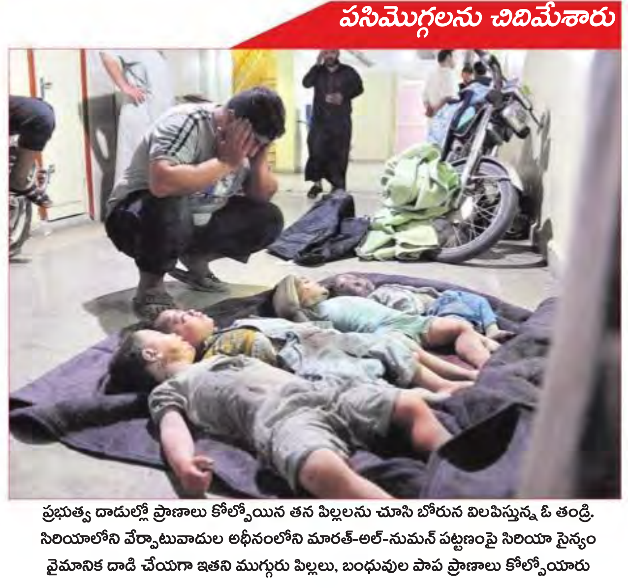
ప్రభుత్వ దారుల్లో ప్రాణాలు కోల్పోయిన తన పిల్లలను చూసి బీదలను విలపిస్తున్న ఓ తండ్రి. నిరయలోని వేర్పాటువాదుల అధినేతలైన మారత్-అల్-సమన్ పట్టణంపై నిరయ సైన్యం వైమానిక దాడి చేయగా ఇతర ముగ్గురు పిల్లలు, బంధువుల పాప ప్రాణాలు కోల్పోయారు

బాలిస్టిక్ క్షిపణి 'ఘజ్నవి' ప్రయోగం • పరదేశాల్లో భారతదేశ భూభాగాలు ఇస్లామాబాద్: జమ్మూకశ్మీర్ కు ఉన్న ప్రత్యేక ప్రతిపత్తిని తొలగించిన తర్వాత భారతదేశంపై కయ్యూనిక్ కాలు దువ్వతన్న దాయాది దేశం పాకిస్తాన్ తాజాగా అణు బాలిస్టిక్ క్షిపణి 'ఘజ్నవి'ని విజయవంతంగా పరీక్షించింది. ఇప్పటికే కరాచీలోని మూడు గగనతల మార్గాలను మూసివేసి, నిత్యం భారత్పై అక్కసును వెళ్లగక్క తున్న పాక్ ఇప్పుడు ఏకంగా అణు క్షిపణిని పరీక్షించడం గమనార్హం. అణు వాణిజ్యం (అణు ధిక తీవ్రత కలిగిన) పలుకు పదార్థాలు మోసు క్షిపణిని గమనార్హం. అణు వాణిజ్యం (అణు ధిక తీవ్రత కలిగిన) పలుకు పదార్థాలు మోసు క్షిపణిని గమనార్హం. అణు వాణిజ్యం (అణు ధిక తీవ్రత కలిగిన) పలుకు పదార్థాలు మోసు క్షిపణిని గమనార్హం.