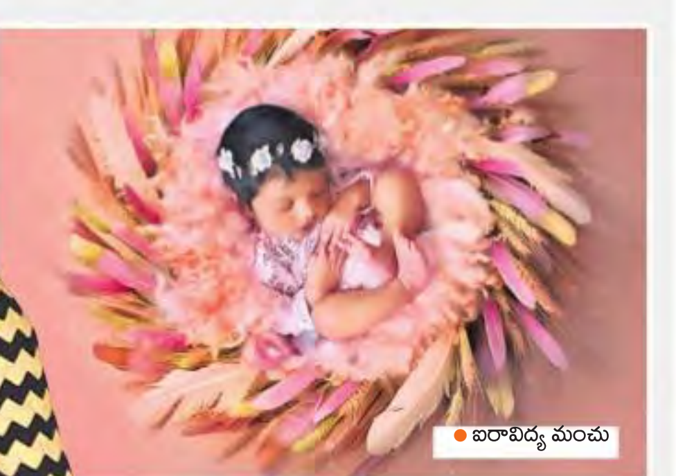
• బాలీవుడ్ మంచు