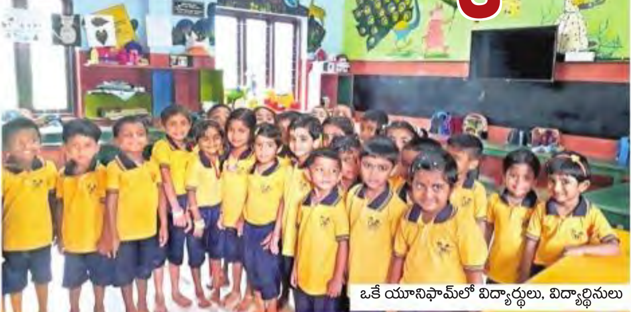
ఒకే యూనిఫామ్లో విద్యార్థులు, విద్యార్థినులు