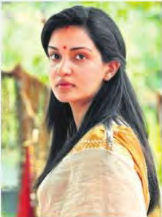
తమిళ చిత్రం 'కుంబనరమ్ - ది కన్నెవన్లో హానీ రోజ్ (ప్రతికాత్మక చిత్రం)

ఏం చేస్తోంది? ఎక్కడ ఉంటోంది? ఎవరితో ఉంటోంది? ఏం కొంటోంది? ఏం కట్టుకుంటోంది? ఇవి కావాలి అతడికి. కానీ అతడిలా ఆమె మళ్ళీ లాగిన అవలేదు. మనిషిలోంచే లాగవుట్ అయినప్పుడు, మనిషి అకౌంట్లోకి ఎందుకు లాగిన అవుతుంది?