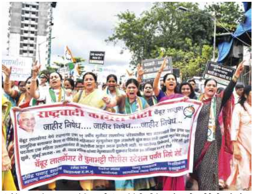
मुंबई में शुक्रवार को बलात्कार मामले में न्याय की मांग करने के लिए विरोध प्रदर्शन करती एनसीपी की कार्यकर्ता