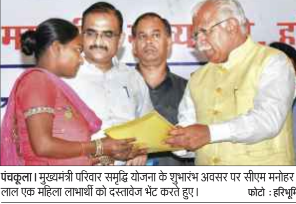
पंचकूला। मुख्यमंत्री परिवार समृद्धि योजना के शुभारंभ अवसर पर सीएम मनोहर लाल एक महिला लाभार्थी को दस्तावेज भेंट करते हुए।

मंत्रिमंडल की बैठक के बाद कृषि मंत्री ओमप्रकाश धन्खड़ ने बताया कि प्रदेश सरकार ने सफाई कर्मियों के लिए अहम फैसला लिया है। अब 7103 कर्मचारियों को टेकेदार की बजाए नगरपालिका, नगर परिषद और निगम का कर्मचारी बनाने का फैसला लिया गया है। वहीं, किसानों को भी राहत दी गई है। उनके गन्ने का बकाए का भुगतान जल्द हो सकेगा। सेंट्रल बायोफॉर टेक्नोलॉजी हिसार का केंद्र अब ऋण सिंह विधि द्वारा संचालित किया जाएगा।