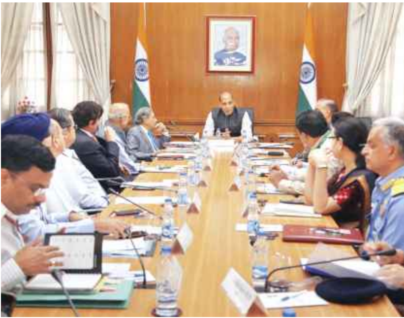
नई दिल्ली में शुक्रवार को रक्षा मंत्रालय के अधिकारियों के साथ 15वें वित्त आयोग की बैठक करते रक्षा मंत्री राजनाथ सिंह।