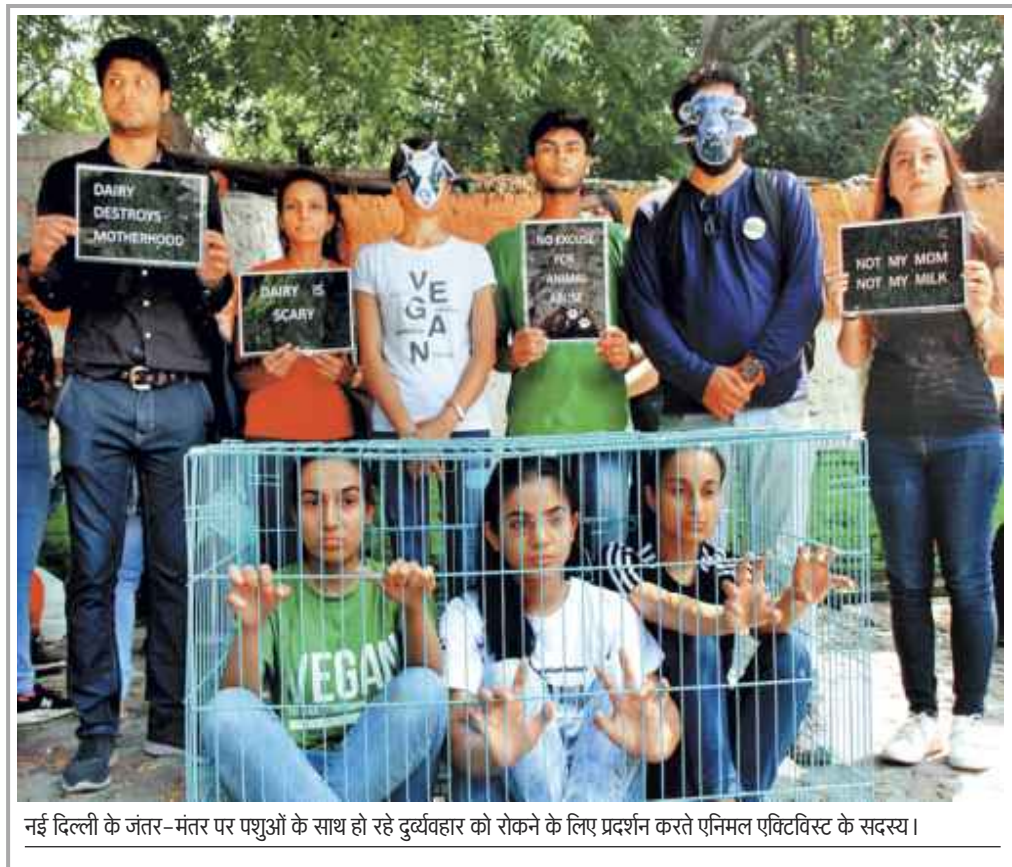
नई दिल्ली के जंतर-मंतर पर पशुओं के साथ हो रहे दुर्यवहार को रोकने के लिए प्रदर्शन करते एनिमल एक्टिविस्ट के सदस्य।