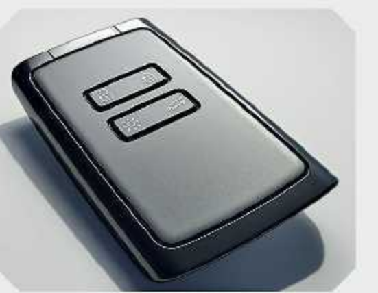
స్మార్ట్ వెక్స్ డ్రైవ్

For further details, visit renault.co.in