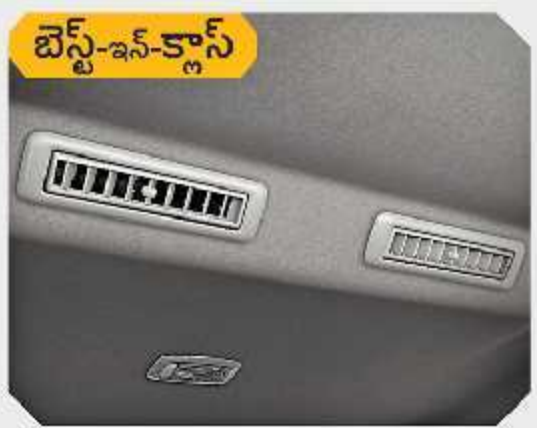
2వ మరియు 3వ రోస్ ట్రిన్ ఎసి వెంటిలేట్