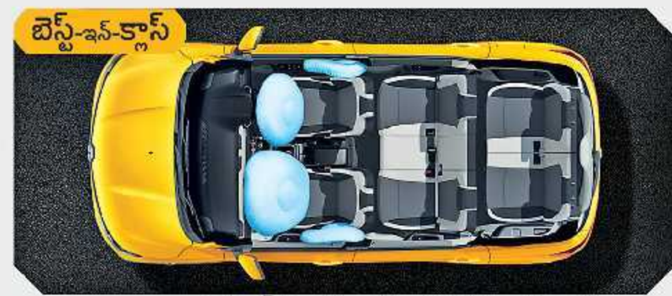
2 ఫ్రంట్ ఎయిర్ బ్యాగ్స్ + 2 సైడ్ ఎయిర్ బ్యాగ్స్