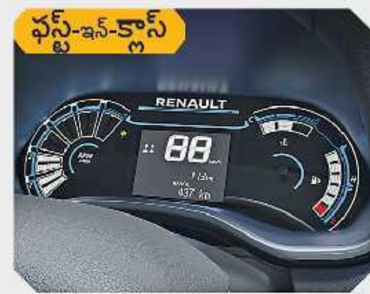
LED ఇన్స్ట్రుమెంట్ క్లస్టర్