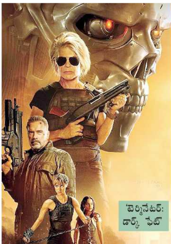
కె.ఎఫ్.ఎల్: డార్క్ ఫెట్