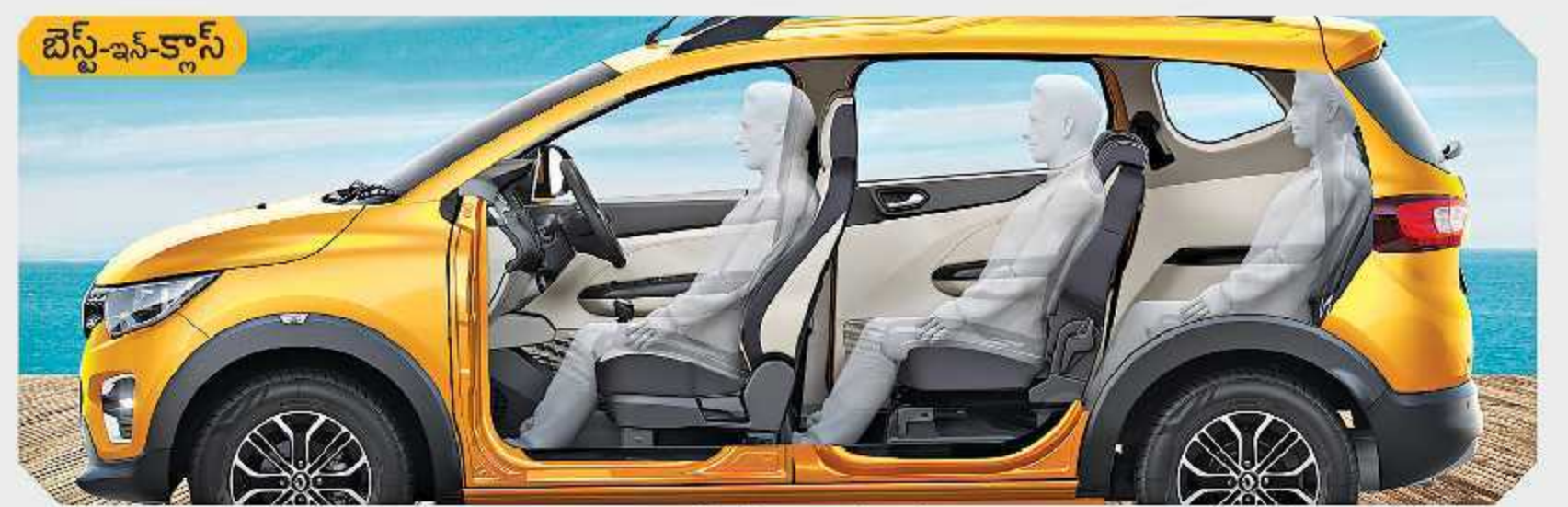
అన్ని రోస్ లోను సాటిలేని చోటు మరియు స్టెడ్ అండ్ రిక్జెనబుల్ 2వ రో సీట్స్