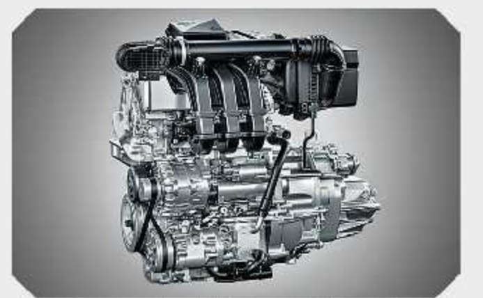
డ్యూయల్ VVT ఎనర్జీ ఇంజన్