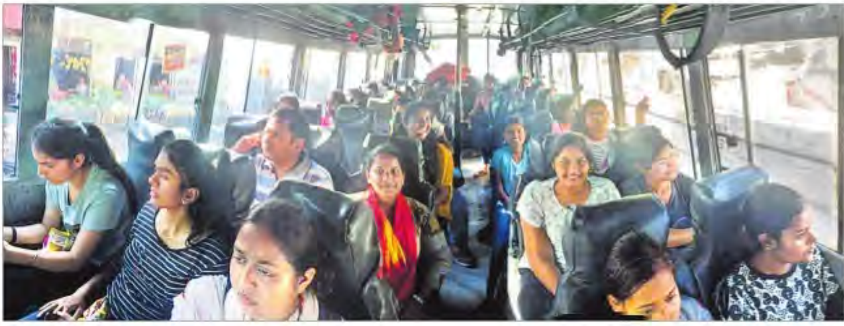
భద్రతా చర్యల దృష్ట్యా శ్రీనగర్లోని నిజ్ క్యాంపస్ను ఖాళీ చేయాలని కేంద్ర ప్రభుత్వం ఆదేశించడంతో నాలుగు బస్సుల ద్వారా విద్యార్థులను జమ్మూకి తరలిస్తున్న కాలేజీ యాజమాన్యం

సాక్షి, హైదరాబాద్: డిగ్రీ కాలేజీల్లో ప్రవేశాలకు సంబంధించి తొలిదశ కౌన్సెలింగ్ ముగిసింది. ఇందులో భాగంగా సీట్లు పొందిన విద్యార్థులు కాలేజీల్లో రిపోర్టు చేశారు. రాష్ట్రవ్యాప్తంగా వివిధ డిగ్రీ కాలేజీల్లో 3,86,684 సీట్లు ఉండగా, శనివారం నాటికి సీట్లు పొందిన వారిలో 1,74,078 మంది విద్యార్థులు కాలేజీల్లో చేరారు. ఈమేరకు కన్సర్వేట్ జాబితాను దోస్ట్ (డిగ్రీ) ఆన్లైన్ సర్వీసున తెలంగాణ) కన్సర్వేట్ వివరాల చేశారు. ప్రభుత్వ డిగ్రీ కాలేజీల్లో 78,519 సీట్లుండగా, ఇప్పటివరకు 56,222 శాతం విద్యార్థులు అడ్మిషన్లు తీసుకున్నారు. ప్రైవేటు ఎయిడెడ్ కాలేజీల్లో 14,685 సీట్లకు గాను 59.95 శాతం, ప్రైవేటు అన్ ఎయిడెడ్ కాలేజీల్లో 2,99,500 సీట్లకుగాను 41.27 శాతం అడ్మిషన్లు జరిగాయి. బీఏ లిటరేచర్ కేటగిరీలో హిందీ, మరాఠీ, సంస్కృతం, బీబీఎం తెలుగు కోర్సుల్లో సున్నా ప్రవేశాలు జరగగా... బీబీఎం ఫిజికల్ సైన్స్ (ఉర్దూ)లో సింగిల్ డిజిటైజ్ ప్రవేశాలు పొందారు. మొత్తంగా ప్రైవేటు అన్ ఎయిడెడ్ కాలేజీల్లో అతి తక్కువ శాతంలో సీట్లు భర్తీ కాగా ప్రభుత్వ కాలేజీలు రెండో స్థానంలో, ప్రైవేటు ఎయిడెడ్ కాలేజీల్లో అధికంగా 59.95 శాతం సీట్లు నిండాయి. ప్రస్తుతం దోస్ట్ రెండో దశ కౌన్సెలింగ్ కొనసాగుతోంది.