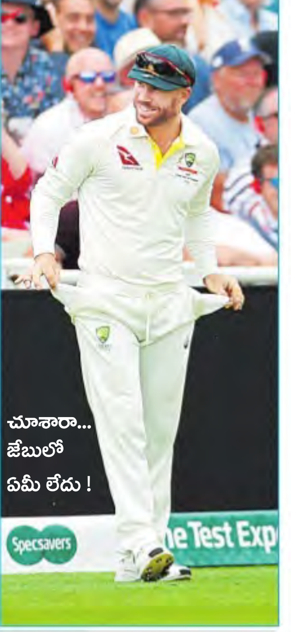
యాసారూ... జేబులో ఏమీ లేదు!

బాల్ బ్యాంపరింగ్ నిషేధం ముగిసిన తర్వాత తొలి టెస్టు ఆడుతున్న స్మిత్, వార్నర్లను ఇంగ్లండ్ అభిమానులు తొలి రోజునుంచే గెలి చేస్తున్నారు. అయితే వీరిద్దరు మాత్రం దానిని పట్టించుకోకుండా ఆటపైనే దృష్టి పెట్టారు. శనివారం మాత్రం వార్నర్ ప్రేక్షకులకు సమాధానమిచ్చాడు. అయితే అది సరదాగానే సుమా... జేబులో స్కాండ్లెవర్ పెట్టుకొని బ్యాంపరింగ్ వివాదానికి కారణమైన వార్నర్ ఇప్పుడు మాత్రం తాను ఆలాంటి పనేమీ చేయడం లేదని, కావాలంటే మీరే చూసుకోండి అంటూ పోజీ వ్యవధి విశేషం!