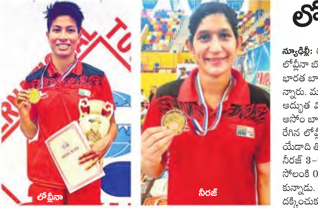
లోషినా, నీరజ్ కు స్వర్ణాలు

సాక్షు బోర్డు వెస్ట్ ఇండీస్: క్యాంప్ బెట్ (సి) కునాల్ (టి) సుందర్ 0, లూయిస్ (టి) భువనేశ్వర్ 0, పూచర్ (సి) పంత్ (టి) సైని 20, పాల్వార్ (ఎట్టి) సైని 49, హెట్ మెర్ (టి) సైని 0, పావెల్ (సి) పంత్ (టి) ఖలీల్ 4, బ్రాత్ వైట్ (సి) అండ్ టి (టి) కునాల్ 9, నర్దెన్ (సి) ఖలీల్ (టి) జెడెజా 2, పాల్ (సి) కోట్లా (టి) భువనేశ్వర్ 3, కాట్రెట్ (నాటౌట్) 0, ధామన్ (నాటౌట్) 0, ఎక్స్ ట్రాలు: 8, మొత్తం: 20 ఓవర్లలో 95/9. వికెట్ల పతనం: 1-0, 2-8, 3-28, 4-28, 5-33, 6-67, 7-70, 8-88, 9-95, పాల్వార్: 4-0-11-17-2-0-18-1, భువనేశ్వర్ 4-0-19-2, సైని 4-0-17-3, ఖలీల్ 2-0-8-1, కునాల్ 4-1-20-1, జెడెజా 4-1-13-1. భారత్: రోహిత్ శర్మ (సి) పాల్వార్ (టి) నర్దెన్ 24, శిఖర్ ధవన్ (ఎట్టి) కాట్రెట్ 1, విరాట్ కోట్లా (సి) పాల్వార్ (టి) కాట్రెట్ 19, పంత్ (సి) కాట్రెట్ (టి) నర్దెన్ 0, మనీష్ (టి) పాల్ 19, కునాల్ (టి) పాల్ 12, జెడెజా (నాటౌట్) 10, సుందర్ (నాటౌట్) 8, ఎక్స్ ట్రాలు: 5, మొత్తం: 17.2 ఓవర్లలో 98/6. వికెట్ల పతనం: 1-4, 2-32, 3-32, 4-64, 5-69, 6-88, పాల్వార్: ధామన్ 4-0-29-0, కాట్రెట్ 4-0-20-2, నర్దెన్ 4-0-14-2, పాల్ 3.2-0-23-2, బ్రాత్ వైట్ 2-0-12-0.