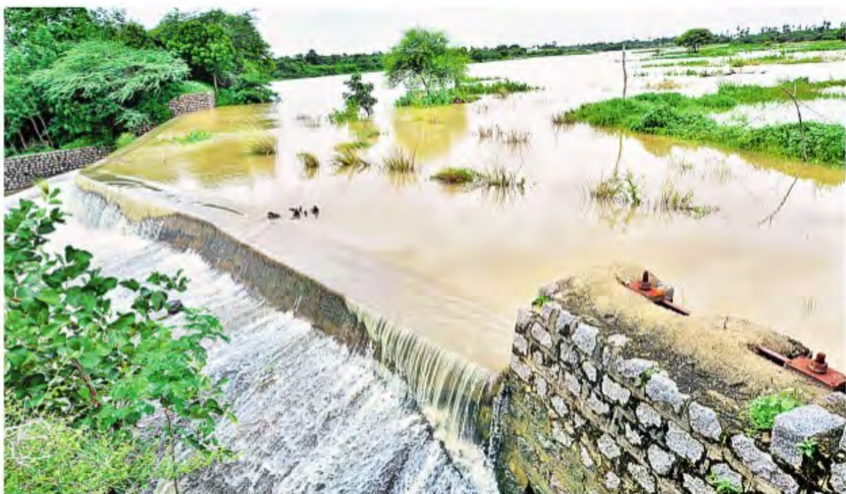
శనివారం వరంగల్ జిల్లా అనంతసాగర్ చెరువు అలుగు పారుతున్న దృశ్యం