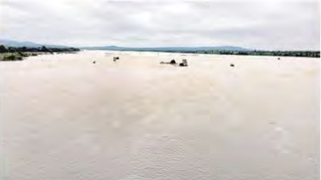
శనివారం జగిత్యాల జిల్లా జిర్కూర్ మండలం కమ్మసూర్ వద్ద నిండుగా పారుతున్న గోదావరి

వరద గోదావరి ఉధృతంగా ప్రవహిస్తున్నది. ప్రాణ హిత నుంచి లక్షల క్యూసెక్కుల వరద గోదావరి బేసిన్ లోకి వచ్చి చేరుతున్నది. శనివారం ఉదయం పేరూరు దగ్గర గోదావరి 6.51 లక్షల క్యూసెక్కుల ప్రవాహం నమోదైంది. ధర్మపురి దగ్గర ఇన్ ఫ్లో శనివారం కొంతమేర తగ్గింది. బరాజుకు 6.48 లక్షల క్యూసెక్కుల వరద వస్తుండగా.. అధికారులు సముద్రంలోకి 6.39 లక్షల క్యూసెక్కులు వదులు తున్నారు. ఈ నీటిసంపత్కరంలో ఇప్పటిదాకా 269.04 టీఎంసీల గోదావరిజలాలు సముద్రంలో కలిశాయి. గడిచిన 24 గంటల్లోనే సుమారు 50 టీఎంసీల వరకు గోదావరిజలాలు సముద్రంలో కలిశాయి. నిర్మల్ జిల్లా స్వర్ణ ప్రాజెక్టు, సదర్నాల్ ప్రాజెక్టులు జలకళతో