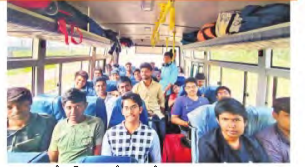
శనివారం శ్రీనగర్ నుంచి ప్రత్యేక బస్సులో జమ్మకు వస్తున్న తెలుగు విద్యార్థులు