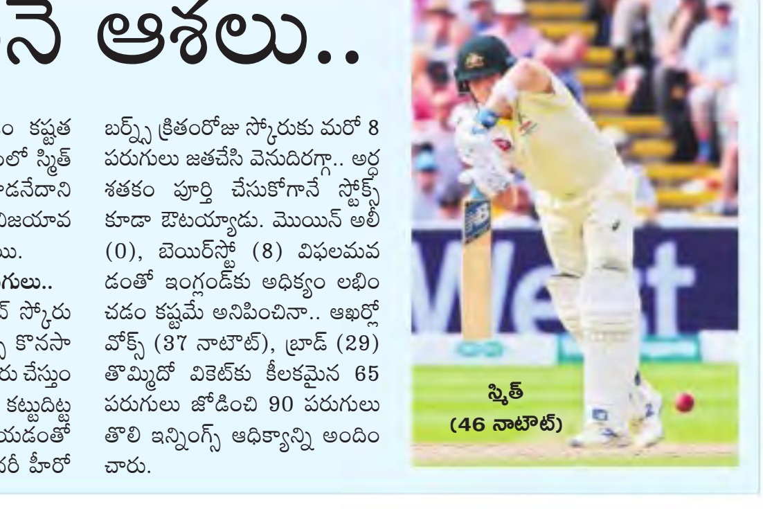
స్కెట్ (46 నాటౌట్)

స్కెట్ పైనే ఆశలు.. గ్నోలో కష్టాల్లో పడ్డ జట్టును ఒంటరి పోరాటంతో పోటీలోకి తెచ్చిన స్కెట్ ప్రస్తుతం అలాంటి పని స్కెట్ లోనే బ్యాట్స్ మన్ చేస్తున్నారు. మూడో రోజు శనివారం ఆట ముగిసే సమయానికి ఆస్ట్రేలియా రెండో ఇన్నింగ్స్ లో 31 ఓవర్లలో 124/3తో నిలిచింది. చేతిలో 7 వికెట్లు ఉన్న ఆసీస్ ప్రస్తుతం 94 పరుగుల ఆధిక్యంలో ఉంది. స్కెట్ తో పాటు హెడ్ (21 బ్యాట్సింగ్) క్రీజలో ఉన్నారు. ఈ పిటిపై నాలుగు ఇన్నింగ్స్ లో బ్యాట్సింగ్ చేయడం కష్టం రంగా కనిపిస్తున్న చేపట్టడం స్కెట్ ఎంతసేపు క్రీజలో ఉంటాడనేదానిపైనే ఈ మ్యాచ్ లో ఆసీస్ విజయాల కారణం అధికం అవుతుంది.. తోమ్మిట్టి వికెట్లకు 65 పరుగులు.. అంతకుముందు ఓవర్లలో స్కోరు 287/4తో తొలి ఇన్నింగ్స్ కొనసాగించిన ఇంగ్లండ్ భారీ స్కోరు చేస్తుందనడం.. ఆసీస్ బౌలర్లు కట్టుదిట్టమైన బంతులతో కట్టిపడేయడంతో అది సాధ్యపడలేదు. సుందర్ హీరో