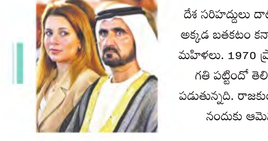
దేశ సరిహద్దులు దాటడం ప్రాణం మీడికి తెచ్చుకోవటం కాదా అంటే, జీవచ్ఛాలుగా అక్కడ బతకటం కన్నా స్వేచ్ఛా గాలుల కోసం ప్రాణాలకైనా తెగిస్తామంటున్నారని అరబ్ మహిళలు. 1970 ప్రాంతంలో సౌదీ అరేబియాలో రాజ కుటుంబీకురాలైన మహిళకు ఏ గతి పట్టిందో తెలిసికూడా అరబ్ మహిళలు తెగిస్తున్న తీరు వారి దుస్థితికి అద్దం పడుతున్నది. రాజకుటుంబ పెద్దలను కాదని ప్రేమించిన వ్యక్తితో ఇల్లువిడిచి పారిపోయినందుకు ఆమెను మత రాజ్యాంగం ప్రకారం బహిరంగ ఉరిశిక్ష విధించారు.

కన్నా ముఖ్యంగా దుబాయి రాజ ప్రాసాంద నుంచి మహిళలు పారిపోవటం ఇది మొదటిసారి కాదు. గతంలోనూ ఇలాంటి ఘటనలు అనేకం జరిగాయి. రాజ కుటుంబానికి చెందిన మహిళలు ఇల్లు విడిచి, దొంగచాటుగా దేశ సరిహద్దులు దాటి విదేశాల్లో ఆశ్రయం కోరిన ఘటనలున్నాయి. గతేడాది దుబాయి రాజ కూతురు షేక్ లతిఫా ఓ ప్రైవేట్ జాతీయమైన స్ట్రీట్ డాన్స్ 19 ఏండ్ల వయస్సులో దేశం విడిచింది. ఆమె రాజప్రాసాంద బంగారు పంజరం నుంచి బయటపడి సముద్ర మాధాన విదేశాలకు పయనమైన విషయాన్ని ఓ వీడియో సందేశాన్ని పంపింది. దీంతో దుబాయి రాజ పౌరుగు దేశాలకు వర్తమానం పంపి తన చెల్లెలును తమకు అప్పగించాలని కోరాడు. ఆమె పయనిస్తున్న పడవ భారత సముద్ర జలాల్లోకి చేరగానే భారత నావికాదళాలు చుట్టుముట్టి నిర్బంధించాయి. ఆమెను దుబాయి రాజకు అప్పగించారు. ఆమెను దుబాయి మతపట్టణ ప్రకారం గృహ నిర్బంధంలో పడేశా