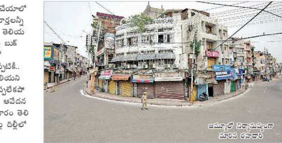
జమ్మూ-కశ్మీర్ లోని సర్కారు భవనం

“నా భర్త ఎలా ఉన్నారో తెలియజేయండి. ఏం చేయాలి? తోచండి. ఆయన పనిచేసే ఛాన్సెల్ వచ్చి వచ్చినప్పుడు, ఆయన గురించి నమానంగా తెలియజేయండి. పంపించండి. అతని వ్యక్తిత్వంను అందించండి. అతని వ్యక్తిత్వంను అందించండి. అతని వ్యక్తిత్వంను అందించండి.”