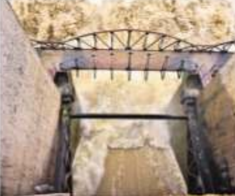
మంగళవారం జూరాల క్రస్ట్ గేట్ల ద్వారా దిగువకు విడుదలవుతున్న నీళ్లు

గోదావరిలో వినితీయమైన పరిస్థితి పేరుగా మీదుగా పది లక్షలకు పైగా క్యూసెక్కుల ప్రవాహం గోదావరి బేసిన్ లో అలుగుపాకెస్తున్న 1,834 చేరువులు 8