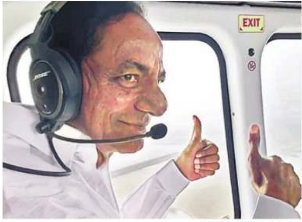
మంగళవారం హెలికాప్టర్ లో గంగ గోదావరిని చూస్తూ విజయనగరంతో సీఎం కేసీఆర్