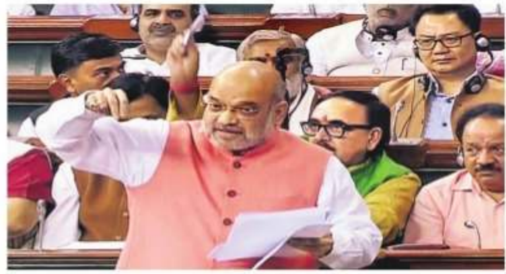
లోక్ సభలో మాట్లాడుతున్న కేంద్ర హోంమంత్రి అమిత్ షా

జమ్మ్యకశ్మీర్ ప్రత్యేక ప్రతిపత్తి కల్పించే ఆర్డీ కారే 370లోని పలు నిబంధనల రద్దుకు ప్రతిపాదించిన తీర్మానం, జమ్మ్యకశ్మీర్ పునర్య్వస్థీకరణ బిల్లును మంగళవారం లోక్ సభ ఆమోదించింది. అంతకుముందు తీర్మానం, బిల్లుపై వాడివేడి చర్చ సాగింది. చర్చకు ముగింపు తెచ్చేందుకు ఉద్దేశించిన వాడుక పాక్ దురాక్రమణతో రెపరెండం అనే ప్రశ్న ముగిసింది. ఈ నేపథ్యంలో జమ్మ్యకశ్మీర్ పాలనా నిర్వహణను తీసుకునే పాక్కు భారతకు ఉన్నట్టి అని అన్నారు. కాంగ్రెస్ పార్టీకి భారతకు గుప్పిస్తున్నా.. కశ్మీర్ అంశాన్ని పాలనకు తీసుకొని వెళ్లింది ఎవరని ప్రశ్నించారు. 1948లో ఏకపక్ష కాల్పుల వరకును తెచ్చిందివరకు నిలిచి శారు. నాడు పరిస్థితి తీసుకోవడానే సైన్యానికి పూర్తి స్వేచ్ఛ ఇచ్చి ఉండే నేడు పీవోకి భారత్ లో అంతర్భాగంగా ఉంచిన చెప్పారు.