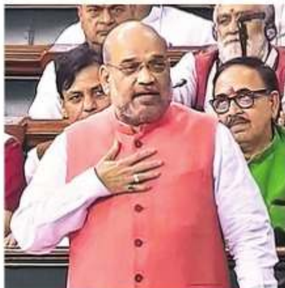
మంగళవారం లోక్ సభలో మాట్లాడుతున్న పోంతులూరి అమిత్ షా

పీవోకే, అక్బాయిచిన్.. కశ్మీర్ లో అంతర్భాగమే