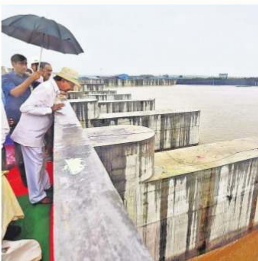
జయశంకర్ భూపాలపల్లి జిల్లాలోని మేడిగడ్డ బరాజ్ లో గోదావరి జలాలను చలశీలమైన, సీఎం కేసీఆర్, చిత్రంలో మంత్రి ఎర్రబెల్లి దయాకర్ రావు కూడా ఉన్నారు.