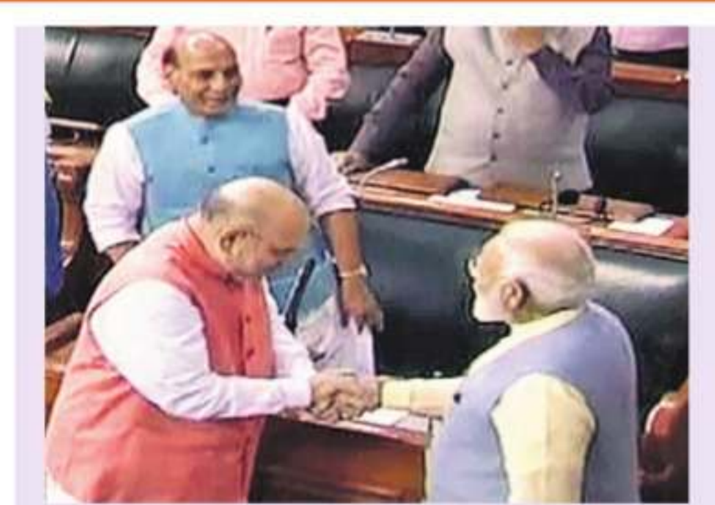
హోంమంత్రి అమిత్ షాను అభినందిస్తున్న ప్రధాని మోదీ