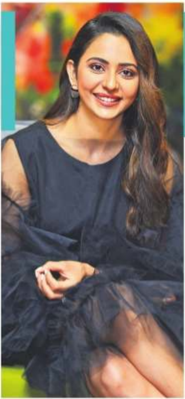
'మనభూమి-2'లో మీ పాత్ర ఎలా ఉంటుంది? ఈ సినిమాను అంగీకరించడానికి కారణం ఏమిటి?

ఇందులో అవంతిక అనే స్వేచ్ఛాస్వాతంత్ర్యాలి అభిలషించే చరిత్రతో కూడిన అమ్మాయిగా కనిపిస్తాను. అందరినీ ఆటపట్టిస్తూ సరదాగా నా పాత్ర సాగుతుంది. వినోదం, సెంటిమెంట్ తో పాటు అన్ని రకాల భావోద్వేగాలతో శక్తివంతంగా ఉంటుంది. తనకన్నా రెట్టింపు వయసున్న వ్యక్తితో పరిచయం అవంతిక జీవితంలో ఎలాంటి మార్పుల్ని తీసుకొచ్చిందన్నది సినిమాలో ఆసక్తిని పంచుతుంది. నా తేరీల్లో అత్యంత సంతోషంగా పూర్తిచేసిన సినిమా ఇదే. చిత్రీకరణ సమయంలో నాగార్జున, లక్ష్మి రూపాస్థి.. అందరం ఓ కుటుంబంలా కలిసిపోయాం. కారావ్యాన్ లోకి వెళ్ళకూడకూడకా విరామ సమయంలో ఒకే దగ్గర కూర్చోని మాట్లాడుకునేవాళ్ళం. 'పోట్ సిద్ధమైంది మాటలు ఆపేసి రండి' అని రాహుల్ చెప్పగానే ముచ్చటలేం బయటపడేవాళ్ళం. సాయంత్రం అరు గంటలకు ప్యాకప్ చెప్పగానే కలిసి డిస్కం చేసేవాళ్ళం. ఆ కలివిడితనం ట్రీన్స్ లో ప్యామిలి సన్నివేశాలు సహజంగా రావడానికి ఉపయోగపడింది. రాహుల్ రచనంద్రనే ఉన్న స్నేహంతోనే ఈ సిని