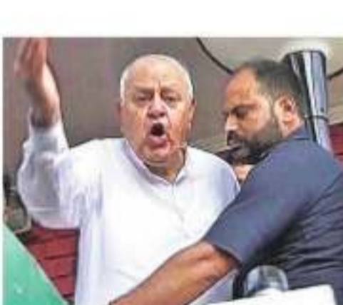
విలేజులలో మాట్లాడుతున్న ఫరూఖ్ అబ్దుల్లా

నియంతృత్వ అధికారం అమల్లోకి వచ్చిందని ఆయన ద్వజమెత్తారు. ఫరూఖ్ అబ్దుల్లా ఆయన ఇప్పటికే అరెస్ట్ చేయబడినట్లు అమిత్ షా వ్యాఖ్యలకు ఆయన ఖండించారు. భాగస్వామ్యం కల్పించే చర్యలకు కూడా కేంద్రం జమ్మ్యకశ్మీర్ నిర్ణయం ప్రతిపత్తిని రద్దుచేసిందని విమర్శలు దుయ్యబట్టారు. కేంద్రం నిర్ణయం రాజ్యాంగాన్ని అపహాసం చేయడమేనని కాంగ్రెస్ ద్వజమెత్తించి, మరో వైపు కశ్మీర్ అంతర్గత వ్యవహారం కాదంటూ ఆ పార్టీ శాసనసభాపక్ష నేత అధిర రంజన్ చౌదరి చేసిన వ్యాఖ్యలతో కాంగ్రెస్ సెల్స్ గోల్ (రెండో సదరణ) బిల్లు-2019ను కేంద్రం ఉప అధిపతి చేయించింది. బిల్లులో పొందుపరిచిన ఎంపీ అసదుద్దీన్ షిక్షి డివిజన్ ఓటింగ్ కోసం పట్టుబట్టారు. టిఆర్ఎస్, వైఎస్సార్ కేంద్రం బిల్లుపై, బీజేపీ, బీసీపీ, అన్నాడిఎంకే కేంద్రం బిల్లుపై, బిల్లుకు మద్దతుగా ఓటింగ్ చేశారు. అనంతరం పార్లమెంటు నిరవధికంగా వాయిదా పడింది. బీజేపీ మేనిఫెస్టోలో హామీ ఇచ్చిన మేరకు మే 2,0 ప్రభుత్వం అధికారంలోకి వచ్చిన 90 రోజుల అనంతరం ఆర్డీ