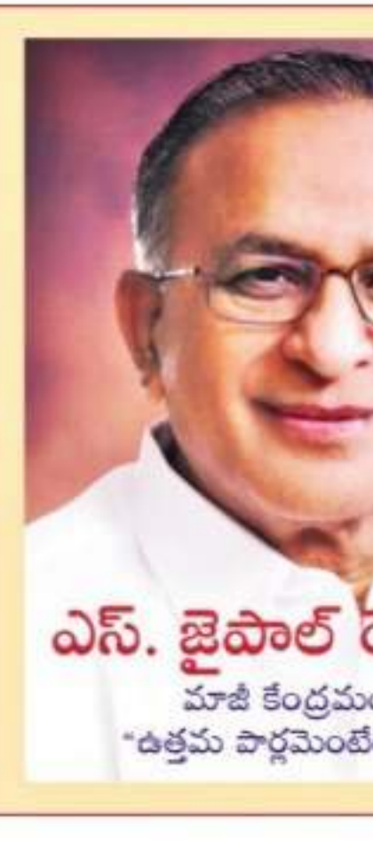
ఎన్. జైపాల్ రెడ్డి గారు మాజీ కేంద్రమంత్రి 'ఉత్తమ పౌరసేవీయన్'