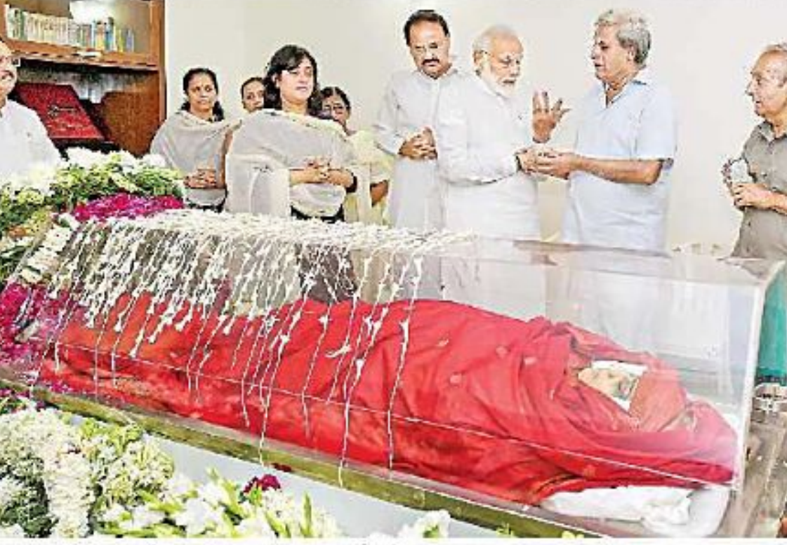
సుప్రీంకోర్టులో పాల్గొనేందుకు బుధవారం దిల్లీలో వివాదాలు అర్జించిన అనంతరం అమె షరత్ స్వరాజ్ కొశల్కు పరామర్శిస్తున్న ప్రధానమంత్రి నరేంద్రమోడీ. చిత్రంలో బాబాకా రాధ్యనిర్వాహక అధ్యక్షుడు జేపీ నల్లా, సుప్రీం కుమార్ బిస్మిల్ కొశల్, ఉప రాష్ట్రపతి వెంకయ్యారాయుడు

ఈనాడు, హైదరాబాద్: వ్యవసాయ పెట్టుబడుల కోసం బంగారం తాకట్టు పెట్టి రైతులు తీసుకునే రుణాలు ఇక వ్యవసాయ రుణ ఖాతా దేశంలోని అన్ని బ్యాంకులకు, రాష్ట్ర లోకి రావు. వాటికి కేంద్రం వడ్డీ రాయితీ ఇవ్వదు. సాధారణ ప్రజలు బంగారం తాకట్టు పెడితే 9 నుంచి 10.5 శాతం వరకూ వడ్డీని బ్యాంకులు వసూలు చేస్తున్నాయి. అక్టోబరు ఒకటో తేదీ నుంచి రైతులకూ ఇవే వర్తిస్తుంది. ఈ విషయాలను స్పష్టం చేస్తూ కేంద్ర వ్యవసాయ శాఖ దేశంలోని అన్ని బ్యాంకులకు, రాష్ట్ర వ్యవసాయశాఖలకు ఆదేశాలిచ్చింది. రాష్ట్ర స్థాయి బ్యాంకర్ల సమితి(ఎస్ఎల్బీసీ) ఒక్కో పంటకు ఏకరూప ఎంత రుణం ఇవ్వాలో ఏటా సిద్ధమవుతుంది. ...మిగతా 2లో