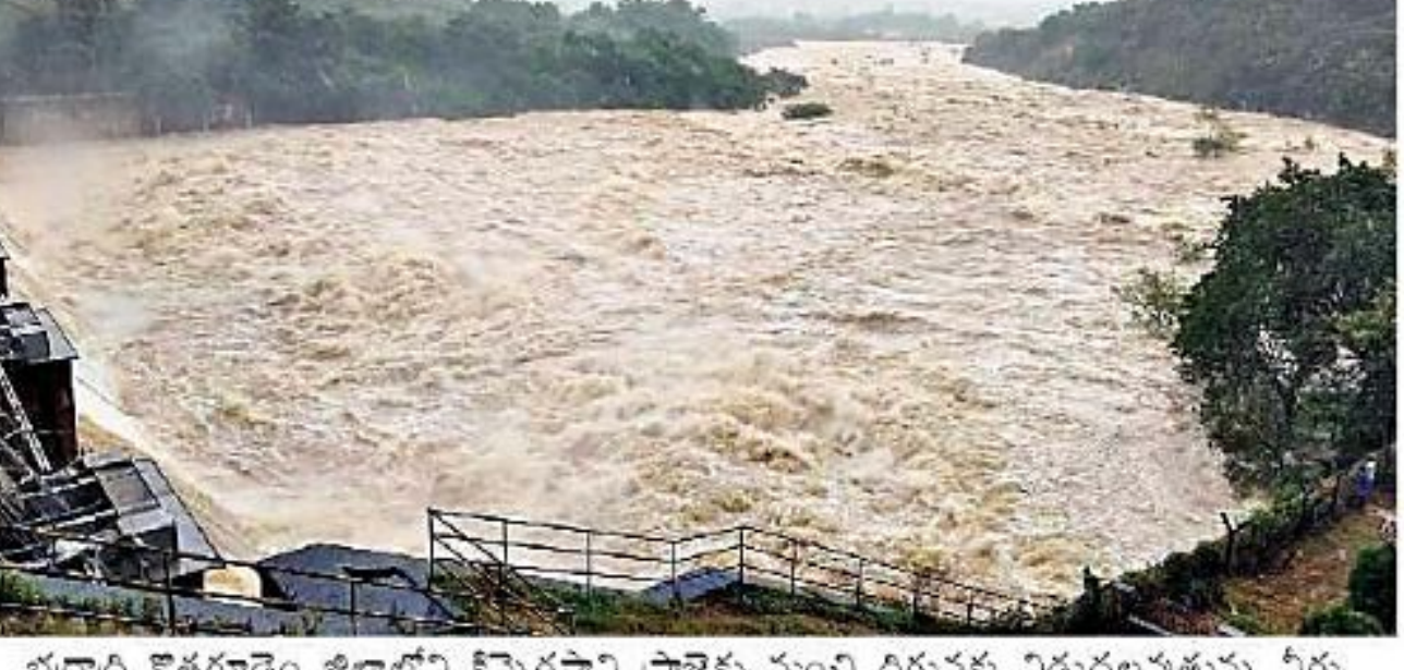
భద్రాద్రి కొత్తగూడెం జిల్లాలోని కిన్నెరసాని ప్రాజెక్టు నుంచి దిగువకు విడుదలవుతున్న నీరు

భారీగా పెరిగిన రైతుబీమా ప్రీమియం • గతేడాదికన్నా 56 శాతం పెంపు • ఒక్కో రైతుకు కట్టేది రూ. 3,555