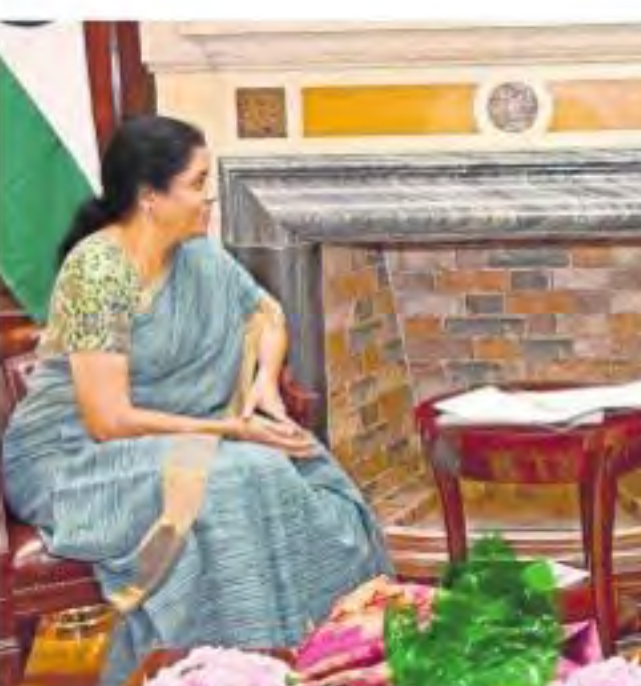
కేంద్ర ఆర్థిక శాఖ మంత్రి నిర్మలా సీతారామన్ తో సమావేశమైన సీఎం వైఎస్ జగన్మోహన్ రెడ్డి