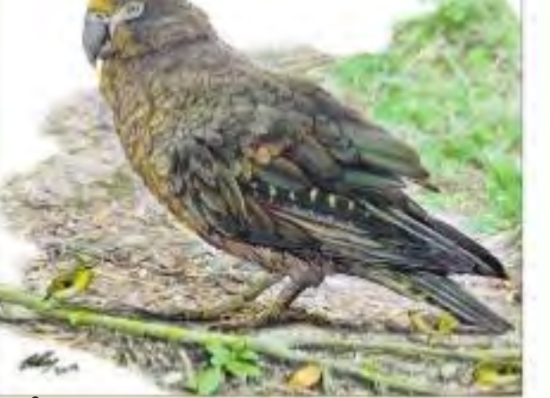
జిటివల శిలాజాల్లో కనుగొన్న ప్రపంచంలోని అత్యంత భారీ చిలుక ఊహించినట్లు. 1.95కోట్ల ఏళ్ల క్రితం జీవించిన ఈ చిలుక బరువు 7 కేజీలు. ఎత్తు ఒక మీటరు. న్యూజిలాండ్లో దీని శిలాజాన్ని కనుగొన్నారు