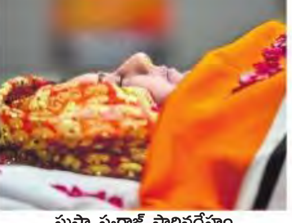
సుష్మా స్వరాజ్ పార్టీవదేహం

న్యూఢిల్లీ: సహచరులు, మిత్రులు, అభిమానుల ఆశ్రయాలను మధ్య బీజేపీ సీనియర్ నాయకురాలు, విదేశాంగ శాఖ మాజీ మంత్రి సుష్మా స్వరాజ్ (87) అంత్యక్రియలు బుధవారం ఢిల్లీలో ప్రభుత్వ లాంఛనాలతో ముగిసాయి. లోధి రోడ్డులోని శ్మశానంలో ఉన్న విద్యుత్ దహనవాటికలో అంత్యక్రియలు జరిగాయి. త్రివర్ణ పతాకంతో చుట్టిన ఆమె ఖాతా కాయాన్ని మధ్యాహ్నం బీజేపీ కేంద్ర కార్యాలయం నుంచి శ్మశానానికి తరలించారు. గుండెపోటు కారణంగా సుష్మ మంగళవారం రాత్రి ఢిల్లీలోని ఎయిమ్స్ ఆసుపత్రిలో మరణించారు. ప్రధాని నరేంద్ర మోదీ, భూటాన్ ప్రధాని పెరింగ్ తాడో, బీజేపీ అధ్యక్షుడు అమిత్ షా, పార్టీ సీనియర్ నాయకుడు ఎల్ కే ఆద్యతీ, వివిధ రాష్ట్రాల ముఖ్యమంత్రులు