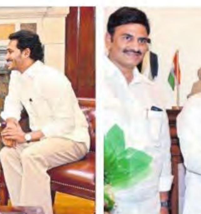
కేంద్ర మంత్రి నితిష్ గడ్కరీకి జ్ఞాపికను అందజేస్తున్న వైఎస్ జగన్. చిత్రంలో ఎంపీ రఘురామ కృష్ణారాజు

సాక్షి, న్యూఢిల్లీ: ఆంధ్రప్రదేశ్ కు చేయూతనందిస్తూ 'సవరణలు' సహా వివిధ అభివృద్ధి కార్యక్రమాలు, ప్రాజెక్టులకు ఉదారంగా సాయం చేయాలని ముఖ్యమంత్రి వైఎస్ జగన్మోహన్ రెడ్డి కేంద్ర ప్రభుత్వాన్ని కోరారు. ఢిల్లీ పర్యటన చేపట్టిన ముఖ్యమంత్రి జగన్ రెండో రోజు బుధవారం రాష్ట్రపతి రామ్ నాథ్ కోవింద్, ఉపరాష్ట్రపతి ఎం.వెంకయ్యనాయుడులను మర్యాద పూర్వకంగా కలిశారు. అనంతరం కేంద్ర హోం మంత్రి అమిత్ షా, ఆర్థిక మంత్రి నిర్మలా సీతారామన్, ఉపరితల రవాణా, జాతీయ రహదారుల శాఖ మంత్రి నితిష్ గడ్కరీలతో సమావేశమై రాష్ట్రానికి అండగా నిలవాలని కోరారు. ఉదయం 9 గంటలకు ఉప రాష్ట్రపతిని, 10.30 గంటలకు రాష్ట్రపతిని కలుసుకున్న ముఖ్యమంత్రి మధ్యాహ్నం 12.30 నుంచి గంట పాటు నితిష్ గడ్కరీతో సమావేశమయ్యారు. సాయంత్రం 4.30 నుంచి 5.30 వరకు ఆర్థిక మంత్రితో సమావేశమయ్యారు. రాత్రి 10 గంటల నుంచుంట్లో హోం మంత్రి అమిత్ షాను కలిశారు. 11 గంటల వరకు దాదాపు గంటపాటు ఈ సమావేశం కొనసాగింది. హామీలను నెరవేర్చాలని, విభజనతో సహజమైన రాష్ట్రానికి అండగా నిలవాలని అమిత్ షాను ఆభ్యర్థించారు. సవరణల ద్వారా ప్రజల జీవన ప్రమాణాలు సవరణలకు భారీ కార్యక్రమాలను చేపట్టమని ఆర్థిక మంత్రి నిర్మలా సీతారామన్ కు వివరించిన ముఖ్యమంత్రి ఆయా కార్యక్రమాలకు సాయం చేయాలని, రాష్ట్రానికి ప్రత్యేక హోదా ఇవ్వాలని