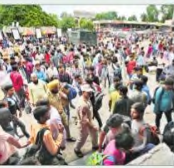
జమ్మూ రైల్వేస్టేషన్లో ప్రయాణికులు

అందోళనకారులకు మద్దతు జరిగిన పురణ పలువురికి బుల్డోజర్ గాయాలు కాగా, ఓ యువకుడు పోలీసుల నుంచి తప్పించుకునే ప్రయత్నంలో జీలంపడిలో దూకడంతో ప్రాణాలు కోల్పోయాడు. జమ్మూకశ్మీర్ మాజీ సీఎం మెహబూబా ముష్టిని ఓ జైలు గదిలో ఒంటరిగా బంధించినట్లు వెల్లడించారు. ఈ నేపథ్యంలో సోమవారం వెల్లడి పంపిన సందర్భంగా అధికారులు నిషేధాజ్ఞలు ఎత్తివేస్తారా? లేక కొనసాగిస్తారా? అనే విషయంలో ఇంకా ఎలాంటి నిర్ణయం రాలేదు.