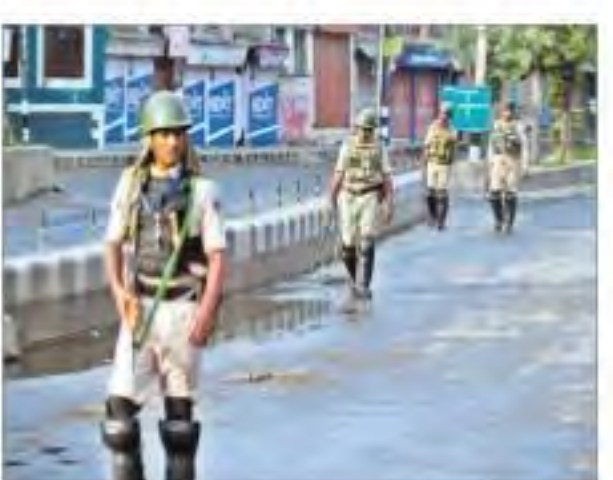
మొత్తం స్తంభించిపోవడమే కారణం. అయితే అర్థిక కల్ 370 రద్దు గురించి తెలిసిన కొందరు కశ్మీర్లకు మాత్రం కేంద్ర ప్రభుత్వ నిర్ణయంపై పెదవి విరిచారు. తమ జీవితాలకు సంబంధించిన కీలక నిర్ణయం తీసుకునే సందర్భంగా తమకు కనీస సమాచారం ఇవ్వలేదని, విశ్వాసంలోకి తీసుకోలేదని అవేదన వ్యక్తం చేశారు.

శ్రీనగర్లో ప్రస్తుతం ఎటువంటి సామర్థ్యం బలగాలే ఉన్నాయి. బయటవారి సంగతి పక్కనపెడితే స్థానికులు కూడా ఇంట్లోంచి అడుగుతీసి బయట పెట్టలేని పరిస్థితి నెలకొంది. అడుగుడు గునా సీఆర్ఎఫ్ బలగాలు చెక్పోస్టులను ఏర్పాటు చేశారు. ఎక్కడకు, ఎందుకు వెళుతున్నారు? అనే సీఆర్ఎఫ్ జవాన్ల ప్రశ్నలకు సంకృష్టకరమైన సమాధానాలు ఇస్తేనే ముందు డిస్కం చెందిన బెంగళూరులోని శ్రీనగర్-జమ్మూ మధ్య 260 కి.మీ దూరాన్ని సాధారణ పరిస్థితుల్లో 6-7 గంటల్లో దాటేయొచ్చు. కానీ ప్రస్తుతం ప్రతి కిలోమీటరుకు ఓ సీఆర్ఎఫ్ పోస్ట్(మొత్తం 280 పోస్టులను) ఏర్పాటుచేశారు. ప్రతి వాహనానికి వారు ఓ ప్రత్యేక నంబర్ కేటాయిస్తున్నారు. అందులోనే బండి ముందుకు కదులుతుంది. జమ్మూకశ్మీర్కు సంబంధించి కేంద్రం తీసుకున్న అర్థిక 370 రద్దు గురించి చాలామంది కశ్మీర్లకు తెలియదు. ఇందుకు కమ్యూనికేషన్ వ్యవస్థ