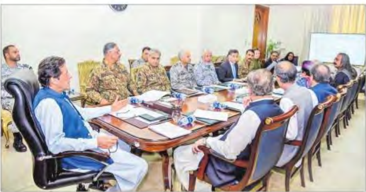
ఇస్లామాబాద్లో పాక్ జాతీయ భద్రతా కమిటీ సమావేశంలో ఆ దేశ ప్రధాని ఇమ్రాన్ ఖాన్