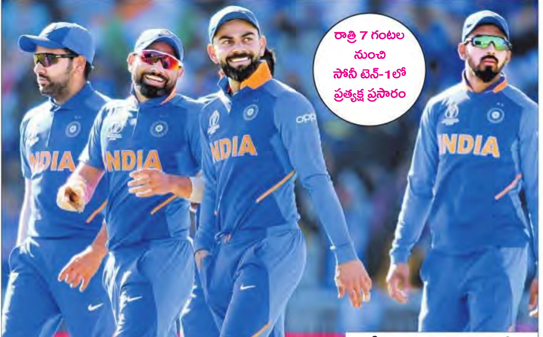
రాత్రి 7 గంటల నుంచి సోని టెన్-1లో ప్రత్యక్ష ప్రసారం

వెస్టిండీస్ గడ్డపై ఆ జట్టుతో భారత్ ఇప్పటి వరకు 36 మ్యాచ్ లు ఆడింది. 14 మ్యాచ్ లో గెలిచి, 20 ఓడింది. రెండు మ్యాచ్ లు రద్దయ్యాయి. 2017లో విండీస్ లో పర్యటించిన భారత్ ఐదు మ్యాచ్ లు సిరీస్ ను 3-1తో గెల్చుకుంది. మరో మ్యాచ్ రద్దయింది.