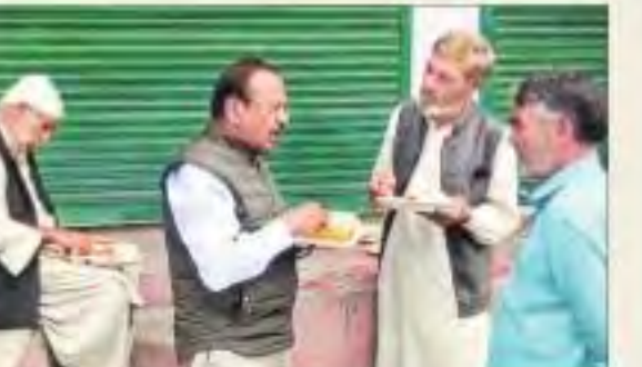
షోపియాన్లో స్టానికరులతో మాట్లాడుతున్న అజిత్ దోవల్

ఎలా ఉంది? ప్రజలు ఏమనుకుంటున్నారు?' అని అడిగారు. దీంతో ఓ స్టానికరు అంతా బాగుందని జవాబిచ్చారు. వెంటనే దోవల్ స్పందిస్తూ.. 'అవును.. సమస్యలన్నీ సమసిపోతాయి. అందుకు ప్రాంతంగా అభిప్రాయం ఏది చేసినా మనమందికే. మీ భద్రత, సర్వేయం బుల్డోజర్లను స్వయం షోపియాన్లో దోవల్ స్టాన్ కలెక్టర్ కోసమే మేం ఆలోచిస్తున్నాం' అని తెలిపారు. అనంతరం సీఆర్ఎఫ్ బలగాలను కలుసుకున్న దోవల్.. 'వామపక్ష తీవ్రవాదం