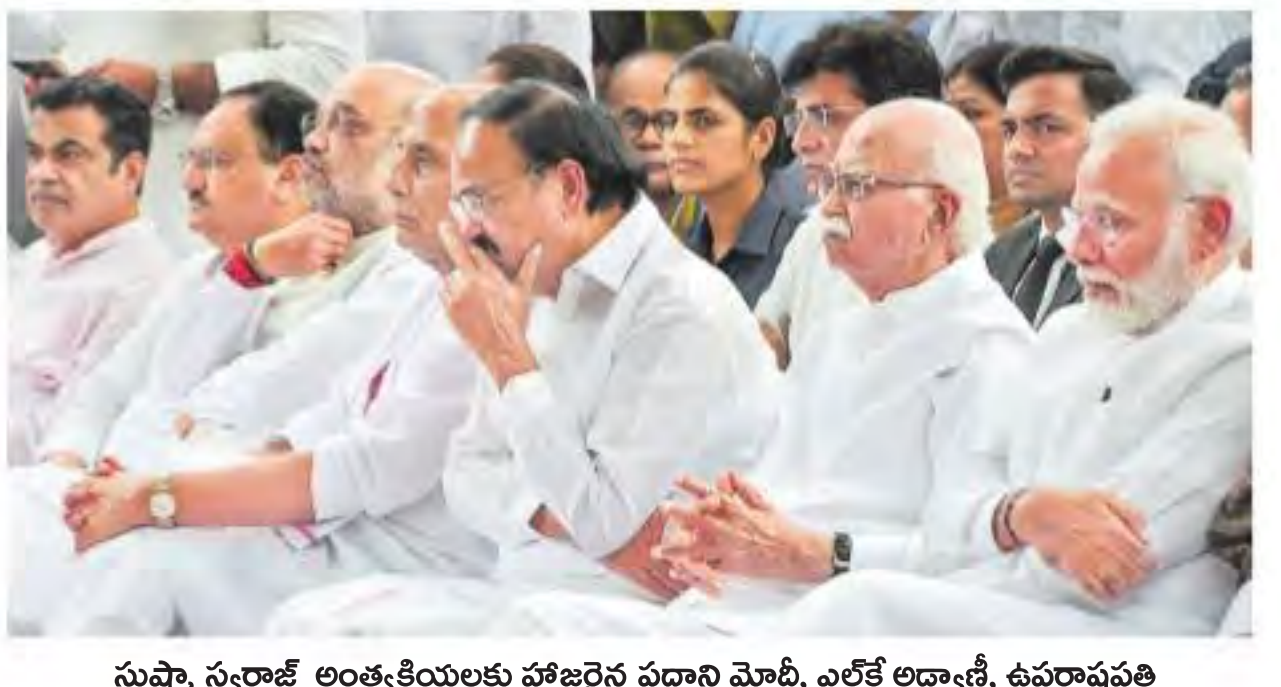
సుష్మా స్వరాజ్ అంత్యక్రియలకు హాజరైన ప్రధాని మోదీ, ఎల్ కే ఆద్యతీ, ఉపరాష్ట్రపతి వెంకయ్య నాయుడు, కేంద్రమంత్రులు అమిత్ షా, గడ్కరీ తదితరులు