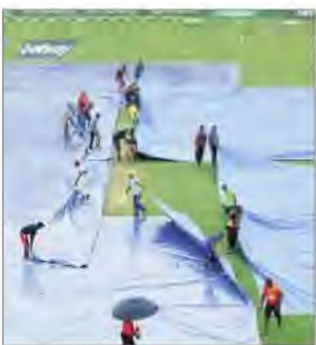
भारत-वेस्ट इंडीज के बीच खेले जा रहे मैच के दौरान बारिश आने के बाद मैदान ढकते कर्मचारी।

भारत और वेस्ट इंडीज के बीच गुरुवार को खेले जा रहे पहले एकदिवसीय अंतरराष्ट्रीय मैच को बारिश के कारण दूसरी बार रोकना पड़ा। वेस्ट इंडीज ने टॉस हारकर पहले बल्लेबाजी करते हुए जब 5.4 ओवर में बिना विकेट खोए नौ रन बनाए थे तब पहली बार बारिश के कारण मैच रोकना पड़ा। दोबारा खेल शुरू होने पर वेस्ट इंडीज ने जब 13 ओवर में एक विकेट पर 54 रन बनाए थे तो बारिश के कारण फिर खेल रोकना पड़ा। इस समय एविन लुईस 40 जबकि शाई होप छह रन बनाकर खेल रहे थे। मैच की शुरुआत से पहले हुई बारिश के कारण इस मुकाबले को 43 ओवर का कर दिया गया था। पहली बार जब खेल रुका तो दोबारा मैच शुरू होने पर 34 ओवर का कर दिया गया।