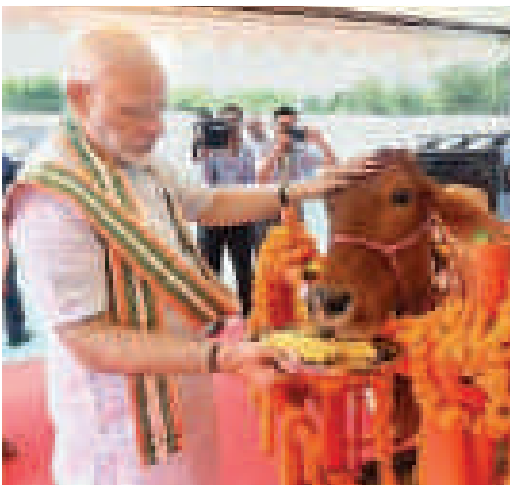
प्रधानमंत्री नरेंद्र मोदी ने बुधवार को उत्तर प्रदेश की कृष्ण नगरी मथुरा में स्थित वेटेरिनरी विश्वविद्यालय में राष्ट्रीय पशु निरोध अभियान की शुरुआत की। इस मौके पर गोमाता को गेहूँ-गुड़ भी खिलाया। जागरण

पीएम ने राष्ट्रीय पशु निरोध अभियान के तहत मुह एवं खुपका और बूसेलोसिस टीकाकरण अभियान लांच किया। इसके तहत देशभर में 51 करोड़ गाय-भैंसों को टीके लगाए जाएंगे। योजना पर 15343 करोड़ खर्च होगा।