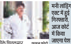
डीके शिवकुमार फाहल फोटो

ईडी के अधिकारियों ने बताया कि कांग्रेस नेता को हिरासत में लेकर पृष्ठलाछ करने की जरूरत थी, इसीलिए मंगलवार को पृष्ठलाछ के बाद उन्हें मनी लॉड्रिंग अधिनियम के गिरफ्तार कर लिया गया। इंडी उन्हें बुधवार को अदालत में पेश करेंगे। शिवकुमार 30 अगस्त को पहली बार इंडी के सामने पेश हुए थे। विमान के जरिये बेंगलुरु से दिल्ली पहुंचने के बाद उन्होंने इंडी की जांच में सहयोग करने की बात कही थी। जैसे ही शिवकुमार की गिरफ्तारी की खबर इंडी कार्यालय के बाहर मौजूद उनके समर्थकों को मिली तो वह नारेबाजी करने लगे।