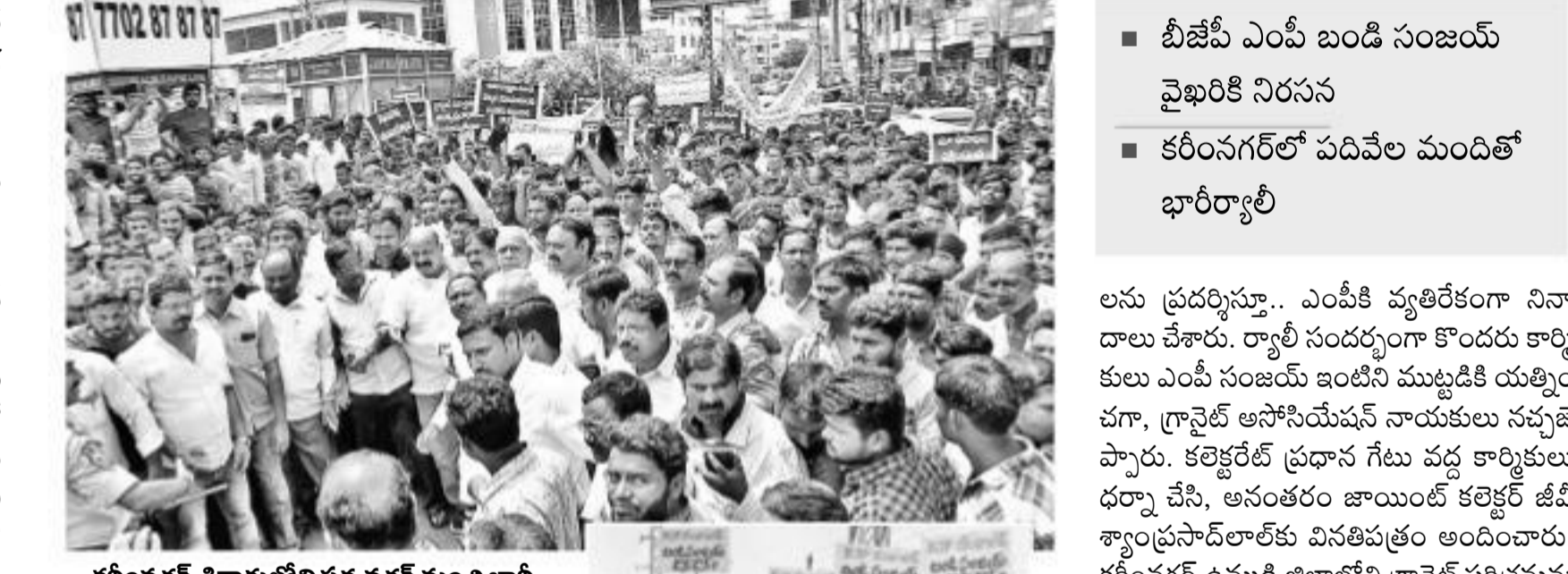
కరీంనగర్ శివారులోని పద్మనగర్ నుంచి భారీ రాళ్ళూ తరలి వస్తున్న గ్రానైట్ కార్మికులు (ఇన్ సిటిలో) 'ఎంపీ సంజయ్ డాన్ డాన్' అని రాసిన ప్లకార్డులను ప్రదర్శిస్తున్న కార్మికులు

ప్రత్యేక ప్రతినిధి, నమస్తే తెలంగాణ: వానకాలం ముగిసింది.. నైరుతి రుతుపవనాల జోరు తగ్గిపోయింది. మరో రెండువారాల దాకా రాష్ట్రంపై రుతుపవనాల ప్రభావం ఉంటుంది. అక్టోబర్ 14 నుంచి 24వ తేదీ వరకు నైరుతి రుతుపవనాలు తిరోగమనంలోకి వెళ్లాయని భారత వాతావరణ కేంద్రం అంచనా వేసింది. నవంబర్ నుంచి ఈశాన్య రుతుపవనాల ఆగమనం మొదలవుతుందని హైదరాబాద్ వాతావరణ కేంద్రం అధికారులు వెల్లడించారు. వాతావరణ పాటు పలు రాష్ట్రాల్లో వానకాలంలో సాధారణం కంటే ఎక్కువ వర్షాలు నమోదయ్యాయి. ఈ వానకాలం జూన్ నుంచి సెప్టెంబర్ వరకు వర్షం కురిసింది. ఇది సగటు వర్షపాతం 759.6 మి.మీ. కంటే 6 శాతం అధికం. ఆగస్టు, సెప్టెంబర్ లో భారీ వర్షాలు కురిశాయి. ఒక్క సెప్టెంబర్ లోనే 46 శాతం అధిక వర్షపాతం నమోదాకావడం విశేషం. సెప్టెంబర్ లో సగటు వర్షపాతం 163.9 మి.మీ. కాగా 241.1 మి.మీ. వర్షం కురిసింది. ఆగస్టులో సాధారణ వర్షపాతం 227.5 మి.మీ. కాగా, 260 మి.మీ. వర్షం పడింది. సాధారణం కంటే 14 శాతం అధిక వర్షపాతం నమోదైంది. జూన్ లో 132 మి.మీ. కుగా సగటు 85.7 మి.మీ.