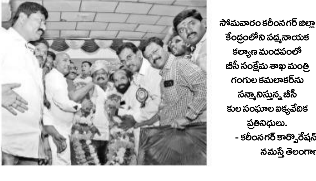
సోమవారం కరీంనగర్ జిల్లా కేంద్రంలోని పద్మనాథులక కార్యాలయంలో జీసీఎం కమిషన్ గాంధీ కమలాకరీను సన్మానిస్తున్న జీసీ కుల సంఘాలాభివృద్ధి ప్రతినిధులు.