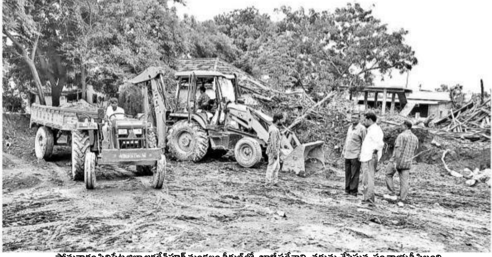
సోమవారం సిద్దిపేట జిల్లా జగదేవులపల్లి మండలం తీగులలో ఖాళీ ప్రదేశాన్ని చదును చేసిస్తున్న పంచాయతీ సిబ్బంది

30 రోజుల పల్లె ప్రణాళిక కార్యచరణ లక్ష్యానికి చేరువవుతున్నది. పారిశుధ్యం, అభివృద్ధి ధ్యేయంగా చేపట్టిన ప్రణాళిక ఫలితము గ్రామీణ వాతావరణంలో మార్పు తెస్తున్నది. ప్రణాళికా కార్యక్రమంతో చేపడుతున్న శ్రమదానాలతో పల్లె పరిశుభ్రంగా మారుతున్నది. హరితహారంలో భాగంగా నాటిన మొక్కలతో పచ్చబుడుతున్నది. పవర్ లైట్ లో భాగంగా ఏండ్లకిందటి కరంలు కచ్చాలు తొలగిపోతున్నాయి. 25వ రోజైన సోమవారం శ్రమదానాలు కొనసాగగా, మంత్రలు, ఎమ్మెల్యేలు, జెడ్పీ చైర్మన్లు, కలెక్టర్లు పాల్గొన్నారు. -నమస్తే తెలంగాణ నెట్ వర్క్