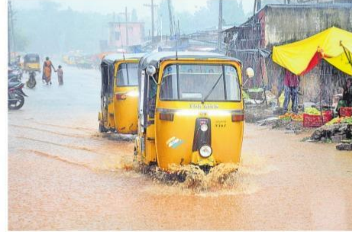
సోమవారం మహబూబాబాద్లో భారీ వర్షానికి ప్రధాన రహదారిపై నిలిచిన గీడు

న్యూఢిల్లీ, సెప్టెంబర్ 30: ఈ వానకాలంలో దేశంలో వర్షాలు దంచికొట్టాయి. దాదాపు వారంరోజులు అలస్యంగా దేశంలోకి ప్రవేశించిన రుతుపవనాలు.. మొదట్లో మందగమనంతో సాగి.. తీవ్ర ఆనమూనాలు రేకెత్తించినా, తర్వాతి నెలల్లో పుంజుకొని దేశమంతటా విస్తారంగా వానలు కురిపించాయి. పలురాష్ట్రాల ప్రత్యేకంగా దేశవ్యాప్తంగా భారీవర్షాలను చవిచూశాయి. 1994 తర్వాత అంటే.. సుమారు 25 ఏండ్లలో వానకాలం సీజన్ (జూన్-సెప్టెంబర్)లో ఇంతస్థాయిలో వర్షాలు నమోదుకావడం ఇదే ప్రథమ మని భారత వాతావరణ విభాగం ప్రకటించింది. అంతేకాకుండా.. 1901 నుంచి పోలిస్తే.. మొదట్లో మందగమన వాతావరణ విభాగం రికార్డులు వేర్వేరుగా ఉన్నాయి. ప్రత్యేకంగా సెప్టెంబర్ మాసంలో అనేకవర్ష కుండపోత వర్షాలు కురిశాయి. ఈ సీజన్ సెప్టెంబర్లో గత 102 ఏండ్లలో ఎన్నడూ లేనంతస్థాయిలో గరిష్ట వర్షపాతం నమోదైంది. ఫలితంగా