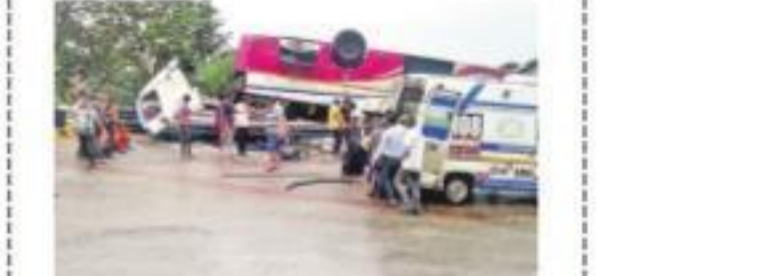
గుజరాత్ లోని బసన్యాంజలి జిల్లా అంబాజీ-దంత రహదారి కొండ మార్గంలో బోల్తా పడిన బస్సు