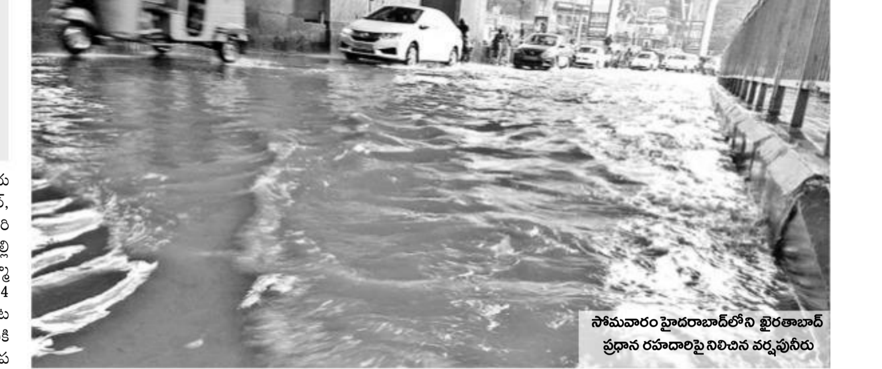
సోమవారం హైదరాబాద్ లోని ఖైరతాబాద్ ప్రధాన రహదారిపై నిలిచిన వర్షపునీరు

నమస్తే తెలంగాణ నెటవర్క్: రాష్ట్రంలోని పలు జిల్లాల్లో ఆదివారం అర్ధరాత్రి నుంచి సోమ వారం వరకు భారీ వర్షం పడింది. గ్రేటర్ హైదరాబాద్ తోపాటు పెద్దపల్లి, జగిత్యాల, మహబూబాబాద్, కామారెడ్డి, వరంగల్ రూరల్ జిల్లాల్లో జోరువాన కురిసింది. భద్రాద్రి కొత్త గూడెం, మంచిర్యాల, జయశంకర్ భూపాల పల్లి తదితర జిల్లాల్లో ఓ మోస్తరు వానలు పడ్డాయి. పలు ప్రాంతాల్లోని లోతట్టు కాలు నీలు జలమయమయ్యాయి. జగిత్యాల జిల్లా లోని మేడిపల్లి మండలంలో 11.3 సెం.మీ వర్షపాతం నమోదుకాగా, గ్రేటర్ హైదరాబాద్ లోని శేరిలింగంపల్లి, మహబూబాద్ 7.2 సెం.మీ, చొచ్చున వర్షం పడింది. మహబూబాబాద్ జిల్లాలో పిడుగుపాటుకు వ్యక్తి మృతి చెందాడు. వర్షంతో భూపాలపల్లి ఏరియల్ బొగ్గు ఉత్పత్తి నిలిచిపోయింది. జగిత్యాల జిల్లాలో 5.8 సెం.మీ. వర్షపాతం నమోదు కాగా, అక్కడక్కడా మేడిపల్లి మండలంలో 11.3 సెం.మీ. వర్షం కురిసింది. పలు మండలాల్లో చెరువులు, కుంటలు, వాగులు పొంగి పొల్లాయి. సోమవారం కోరుట్ల పట్టణంలో