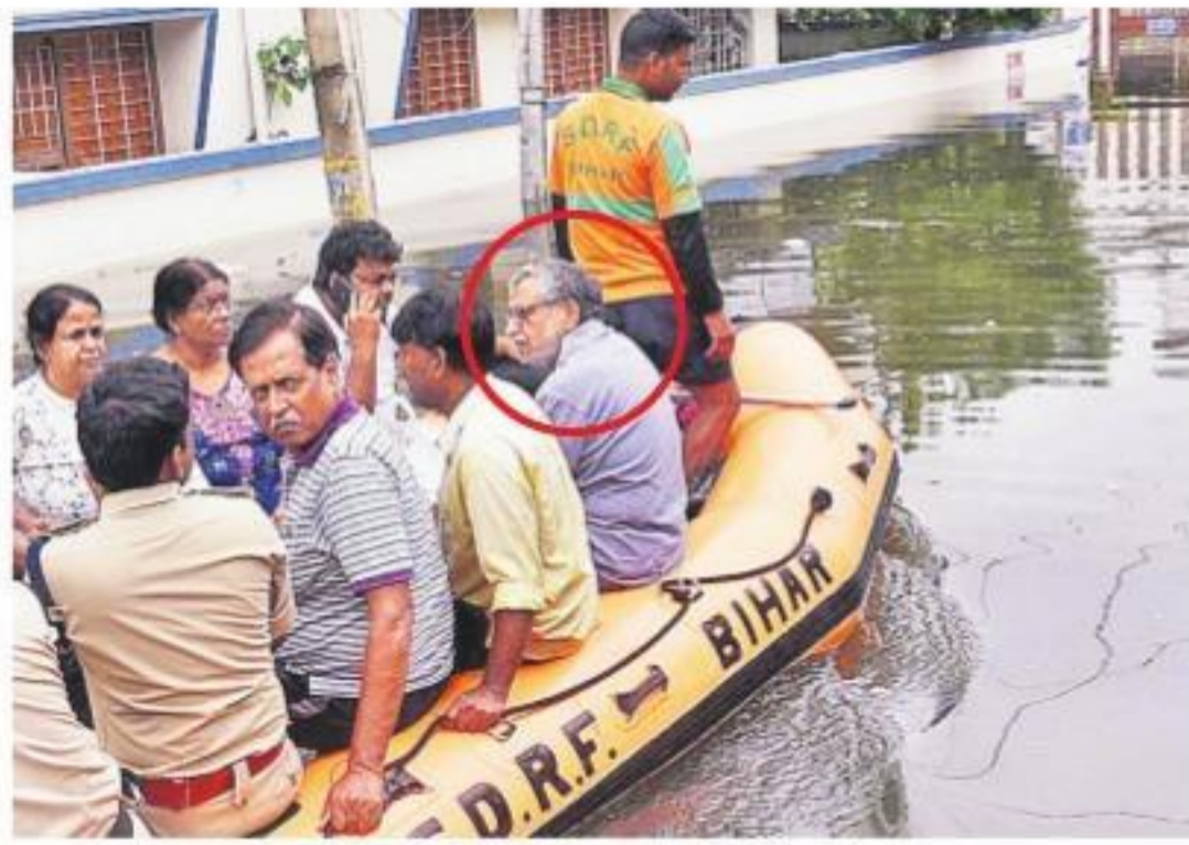
సోమవారం పాటూల్లోని రాజేంద్రనగర్లో బీహార్ ఉపముఖ్యమంత్రి సుశీల్ మోదీ ఇంటి నుంచి ఆయనతో పాటు కుటుంబ సభ్యులను వరదనీటిలో తరలింపునై ఎన్టీఆర్ఎఫ్ బృందం