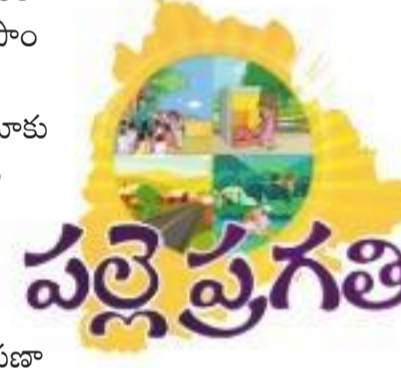
మిగతా 5వ పేజీలో

30 రోజుల ప్రణాళికతో తొలిగిపోతున్న సమస్యలు హైదరాబాద్, నవంబర్ 30: 30 రోజుల ప్రణాళిక పనులు గ్రామీణాప్రాంతాల్లో మారుమూల ప్రాంతాల్లో పురోగతిని తెలుపుతున్నాయి. పల్లెల్లో తిప్పవేసిన సమస్యలు మూడు మృగిణి చేపడుతున్న శ్రమదానం కార్యక్రమాలతో తొలిగిపోతున్నాయి. మరో ఐదురోజుల్లో 30 రోజుల కార్యచరణ ముగిస్తుండగా ఇది స్ఫూర్తితో వార్షిక ప్రణాళికలు రూపొందించుతున్నాయి. 25 రోజులుగా జరుగుతున్న కార్యక్రమాల్లో గ్రామాలన్నీ పరిశుభంగా మారుతున్నాయి. అధికారులు, ప్రజాప్రతినిధులతోపాటు గ్రామాల్లోని మహిళలు, యువత పెద్దపత్తుల శ్రమదానం కార్యక్రమాల్లో పాల్గొంటున్నారు. దసరా నెలవలకు ఊరికి వచ్చిన