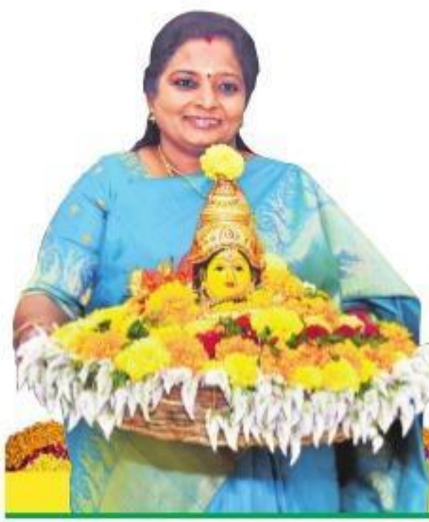
రాజీవ్ గాంధీ జయంతి సందర్భంగా గవర్నర్ తమిళ సాందర్ రాజన్

సంపుటి 9 • సంవత్సరం 97 • పేజీలు : 14 + 16