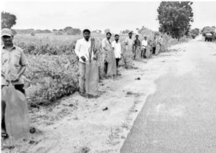
కరీంనగర్ జిల్లా చిగురుమామిడి మండలం గారిరెడ్డిపల్లిలో ప్రోగ్రాముల అమలుచేస్తున్న సర్పంచ్, గ్రామస్థులు