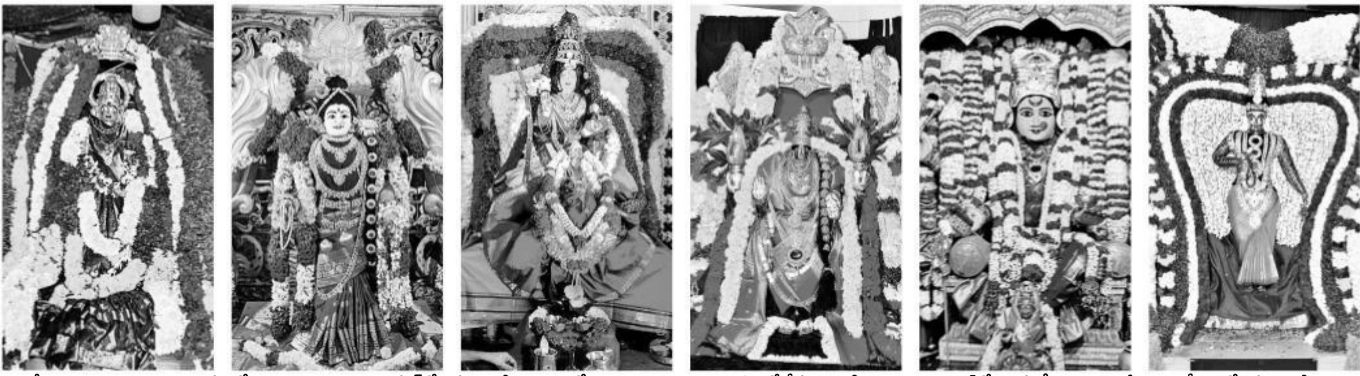
వేములవాడ రాజన్న ఆలయం, బాసర, జోగుశాంబ గద్వాల జిల్లా అలంపూర్లో బ్రహ్మచారిణి ఆలంకారంలో అమ్మవారు, భద్రాచలంలో శ్రీసీతారామచంద్రస్వామి, వరంగల్ లో అన్నపూర్ణేశ్వరిగా భద్రకాళీ, శ్రీకృష్ణం లో బ్రహ్మచారిణి..

నమస్తే తెలంగాణ నెటవర్క్: రాష్ట్రవ్యాప్తంగా దేవీ శరణువరాత్రి ఉత్సవాలు అంగరంగ వైభవంగా కొనసాగుతున్నాయి. సోమవారం రెండోరోజూ వివిధ ప్రాంతాల్లో విభిన్న ఆలంకారాల్లో అమ్మవారు భక్తులకు దర్శనమిచ్చారు. వరంగల్ లోని భద్రకాళీ అమ్మవారు అన్నపూర్ణేశ్వరిగా, నిర్మల్ జిల్లా బాసర క్షేత్రంలో, వేములవాడ శ్రీపార్వతి రాజ రాజేశ్వరస్వామి ఆలయంలో, జగిత్యాల జిల్లా ధర్మపురి శ్రీలక్ష్మీనరసింహస్వామి దేవ స్థానంలోని శ్రీరామలింగేశ్వర ఆలయంలో, జోగు శాంబ గద్వాల జిల్లా అలంపూర్లో, శ్రీకృష్ణం శ్రీకృష్ణరాంబిక అమ్మవారు బ్రహ్మచారిణి ఆలంకారంలో, భద్రాచలం శ్రీసీతారామచంద్రస్వామి దేవస్థానం సన్నిధిలో అమ్మవారు శ్రీసతా నలక్ష్మిగా భక్తులకు దర్శనమిచ్చారు.