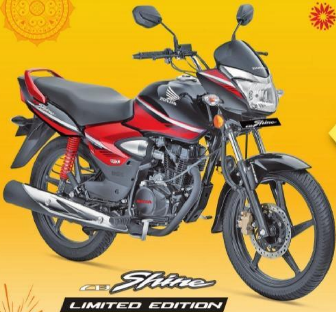
Shine LIMITED EDITION

హోండా పండుగ ధమాకా ₹ 11,000# వరకు ప్రయోజనాలు