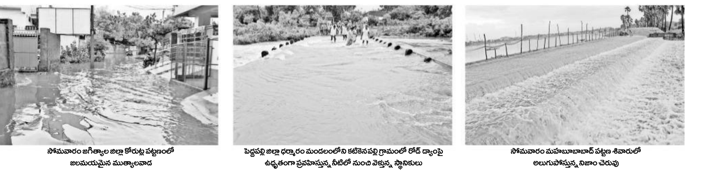
సోమవారం జగిత్యాల జిల్లా కోరుట్ల పట్టణంలో జలమయమైన ముత్యాలవాడ, పెద్దపల్లి జిల్లా ధర్మపురి మండలంలోని కటికపని గ్రామంలో రోడ్ డ్యాంప్ ఉన్నతంగా ప్రవహిస్తున్న నీటిలో నుంచి వెళ్తున్న స్థానికులు, సోమవారం మహబూబాబాద్ పట్టణ శివారులో అలుగుపోస్తున్న నిజాం చెరువు