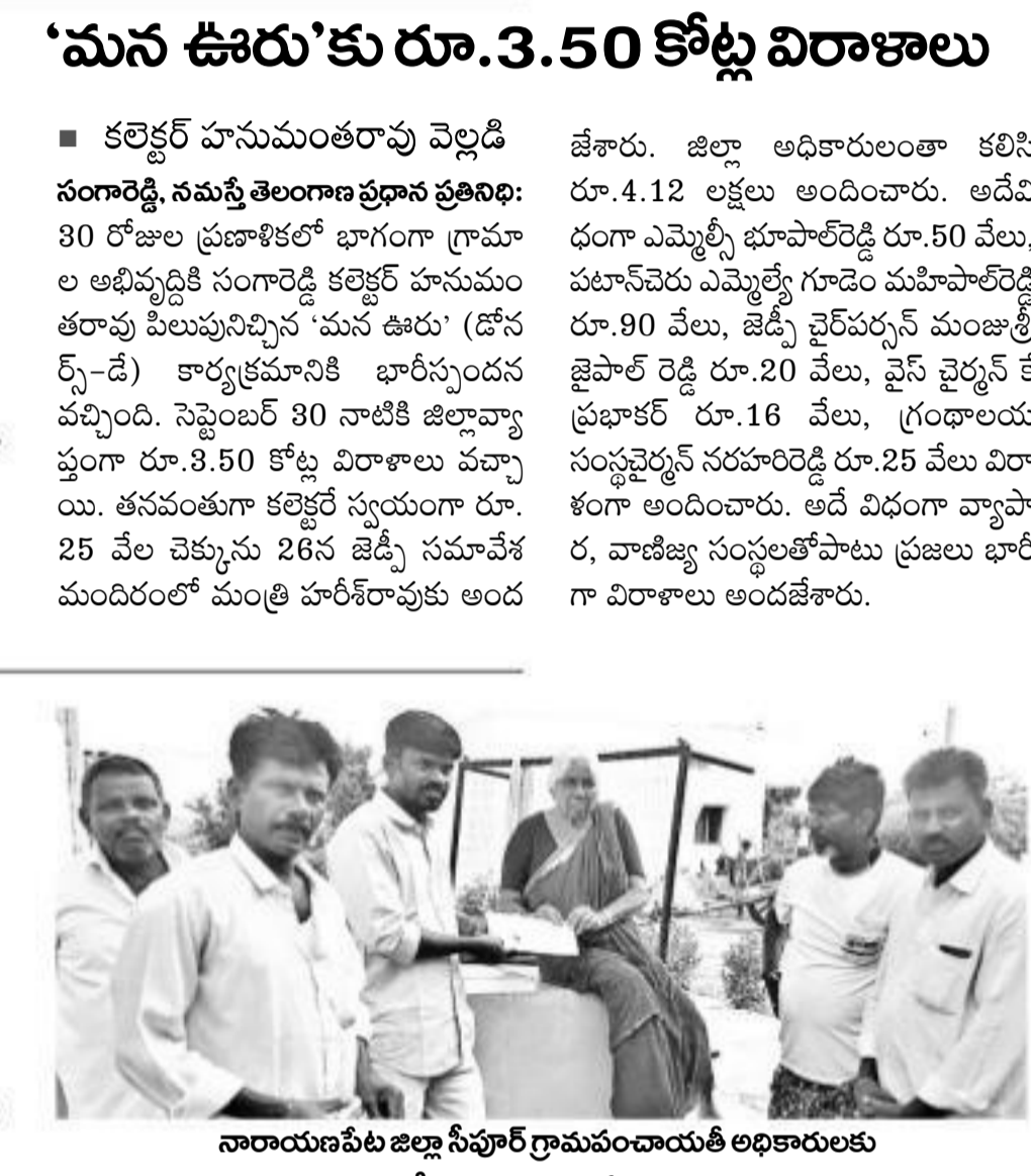
నారాయణపేట జిల్లా సిపూర్ గ్రామపంచాయతీ అధికారులకు రూ. 50 వేల విరాళం అందిస్తున్న సి.సి.ఎం.పి.