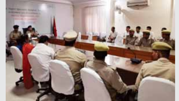
डिप्रेशन से मुक्त रखने के लिए पुलिस लाइंस में बृहस्पतिवार को आयोजित गोष्ठी के दौरान मौजूद डॉक्टरों की टीम व पुलिस अधिकारी।