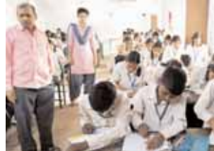
चित्रकला के जरिए जीवदया का संदेश देते बच्चे

चेन्नई द्वारा देशभर के लगभग साढ़े तीन हजार विद्यालयों में कर्णुणा क्लब संचालित किए जा रहे हैं। कर्णुणा क्लब के माध्यम से बच्चों को पर्यावरण संरक्षण, जीवदया, कर्णुणा, अहिंसा, मानवीय गुणों को विकसित किया जा रहा है। बच्चों को उनके हृदय