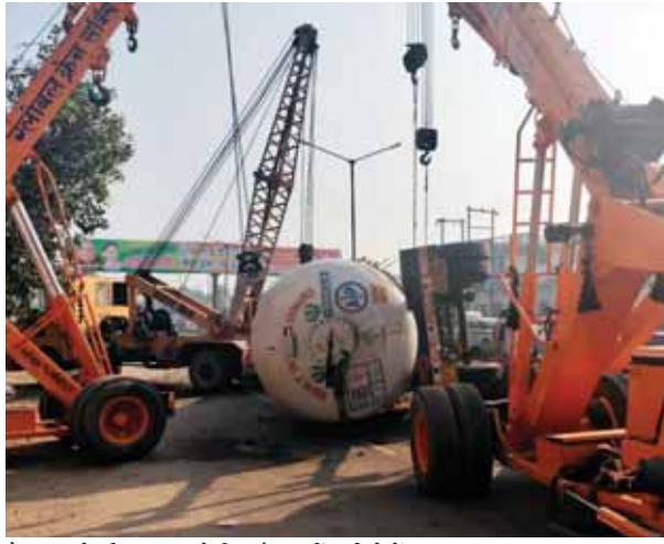
कैम्पूल को बीच सड़क से फिनारें रखती बड़ी क्रेन।

जानकारी के अनुसार बृहस्पतिवार सुबह लगभग 3 बजे मोदीनगर में मथुरा से हरिद्वार जा रहा एल पी जी का भरा हुआ कैम्पूल (बड़ा टैंकर) अनियंत्रित होकर बीच सड़क पर पलट गया जिससे एल पी जी गैस का रिसाव होने लगा। उक्त