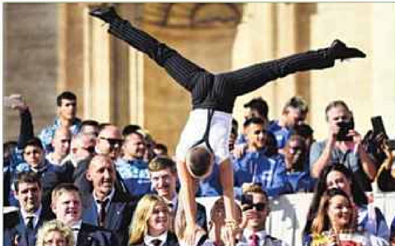
वेटिकन में बुधवार को इटैलियन सर्कस उत्सव के दौरान करतब दिखाते सर्कस के कलाकार। सेंट पीटर्स स्क्वायर पर यह आयोजन पोप के साप्ताहिक सम्बोधन के मौके पर किया गया था।