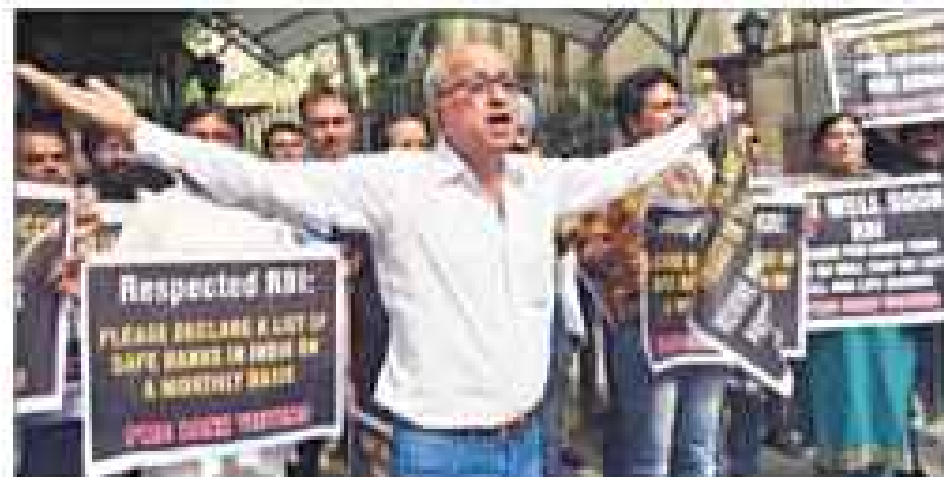
नयी दिल्ली में बुधवार को पीएमसी बैंक के खाताधारक हाथ में तख्तियां उठा कर रिजर्व बैंक के बाहर प्रदर्शन करते हुए।

संकट से घिरे पंजाब एंड महाराष्ट्र को-आपरेटिव (पीएमसी) बैंक के खाताधारकों का विरोध प्रदर्शन तेज होने के बीच बैंक से संबंधित एक याचिका पर सुप्रीमकोर्ट शुक्रवार को सुनवाई करने पर राजी हो गया है। यह याचिका पीएमसी बैंक में पड़ी खाताधारकों की जमापंजी की सुरक्षा के वास्ते तुरंत अंतरिम उपाय किये जाने के बारे में निर्देश देने को लेकर दायर की गई है। सुप्रीमकोर्ट ने याचिका पर शुक्रवार को सुनवाई करने पर सहमति जताई है। पिछले दिनों कम से कम तीन मौतें हुई हैं जिनका जुड़ाव पीएमसी बैंक से बताया गया है। इसी घटनाक्रम को देखते हुए सुप्रीमकोर्ट में याचिका दायर की गई है। उधर पीएमसी बैंक के प्रशासक ने रिजर्व बैंक गवर्नर शक्तिकांत दास सहित शीर्ष पदाधिकारियों से मुलाकात की है और बैंक के खाताधारकों को आशवासन दिया है कि उनके हितों की सुरक्षा के लिये हरसंभव प्रयास