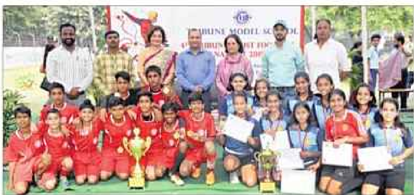
चंडीगढ़ के ट्रिब्यून स्कूल में बुधवार को फुटबाल चैंपियन बर्नी ट्रिब्यून मॉडल स्कूल और सैक्रेड हार्ट स्कूल की टीमों-दैनिक ट्रिब्यून