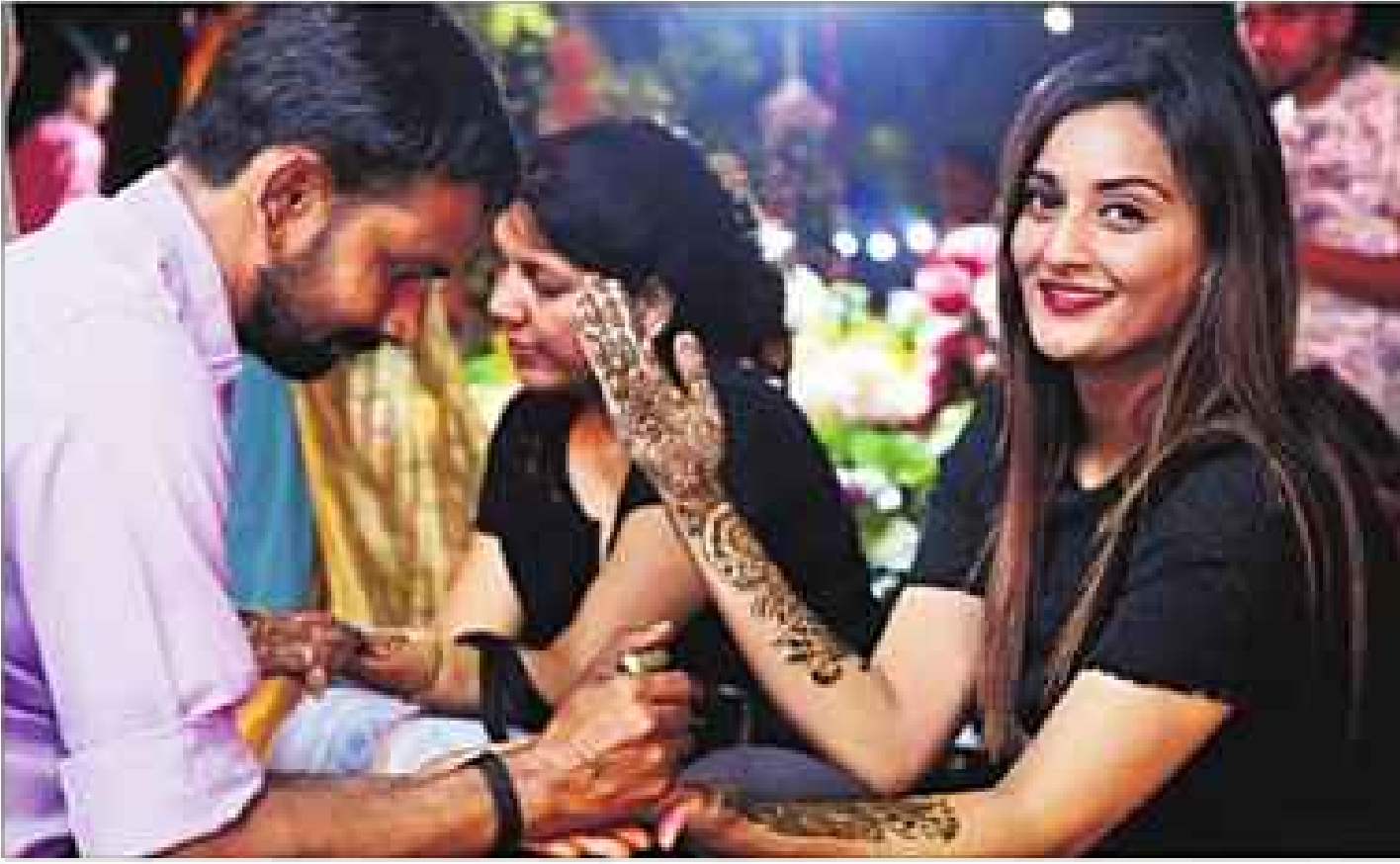
चंडीगढ़ में बुधवार को सेक्टर-19 में हाथों पर दिना लगवाती महिलाएं।

करवाचौथ के अवसर पर मेहंदी लगाने वालों की मार्केटों में बढ़ती भीड़ को देख कर नगर निगम ने इस बार उनके लिए शहर के 62 सामुदायिक केन्द्रों में व्यवस्था की थी। कल करवाचौथ है व आज रात मेहंदी लगवाने वाली महिलाओं की भीड़ जुटी। आश्चर्य की बात है कि निगम के सामुदायिक केन्द्रों में बैठने के लिए किसी ने भी 200 रुपये की पर्ची नहीं कटाई। निगम ने पिछले कल से अनुमति के लिए आवेदन स्वीकार करने थे पर एक भी आवेदन न मिलने से आज निगम सतर्क हो गया। देर शाम सेक्टर 22, 19, 15 व अन्य सेक्टरों में निगम की इनफोसमेंट टीम के लोग मेहंदी वालों की मौके पर ही पर्चियां काट कर उन्हें सामुदायिक केन्द्रों में भेज रहे थे व जो पर्ची नहीं कटा रहे थे उन्हें मार्केटों से उठाया जा रहा था। निगम ने सामुदायिक केन्द्रों की पार्किंग और परिसर के अंदर अक्राम परिया में 20 स्वचायर फीट की जगह मेहंदी लगाने वालों को देने