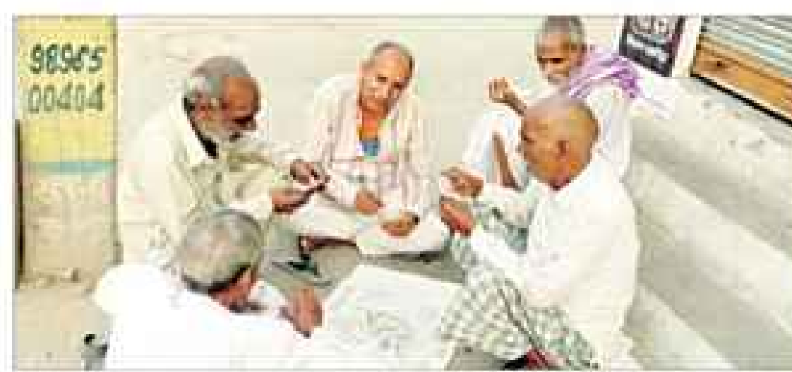
टोहाना के रतिया रोड पर ताश खेलते बुजुर्ग।