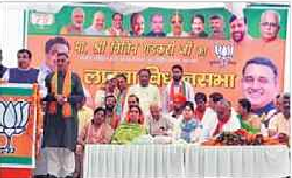
लाडवा में बुधवार को जनसभा को संबोधित करते नितिन गडकरी।

उन्होंने कहा कि वह जिस क्षेत्र से सांसद हैं, वहां ऐसे प्रोजेक्ट लगा दिये हैं, जिससे पराली व गन्ना से एथेनॉल निकालकर उसका सदउपयोग किया जा रहा है। एथेनॉल का इस्तेमाल पेट्रोल में