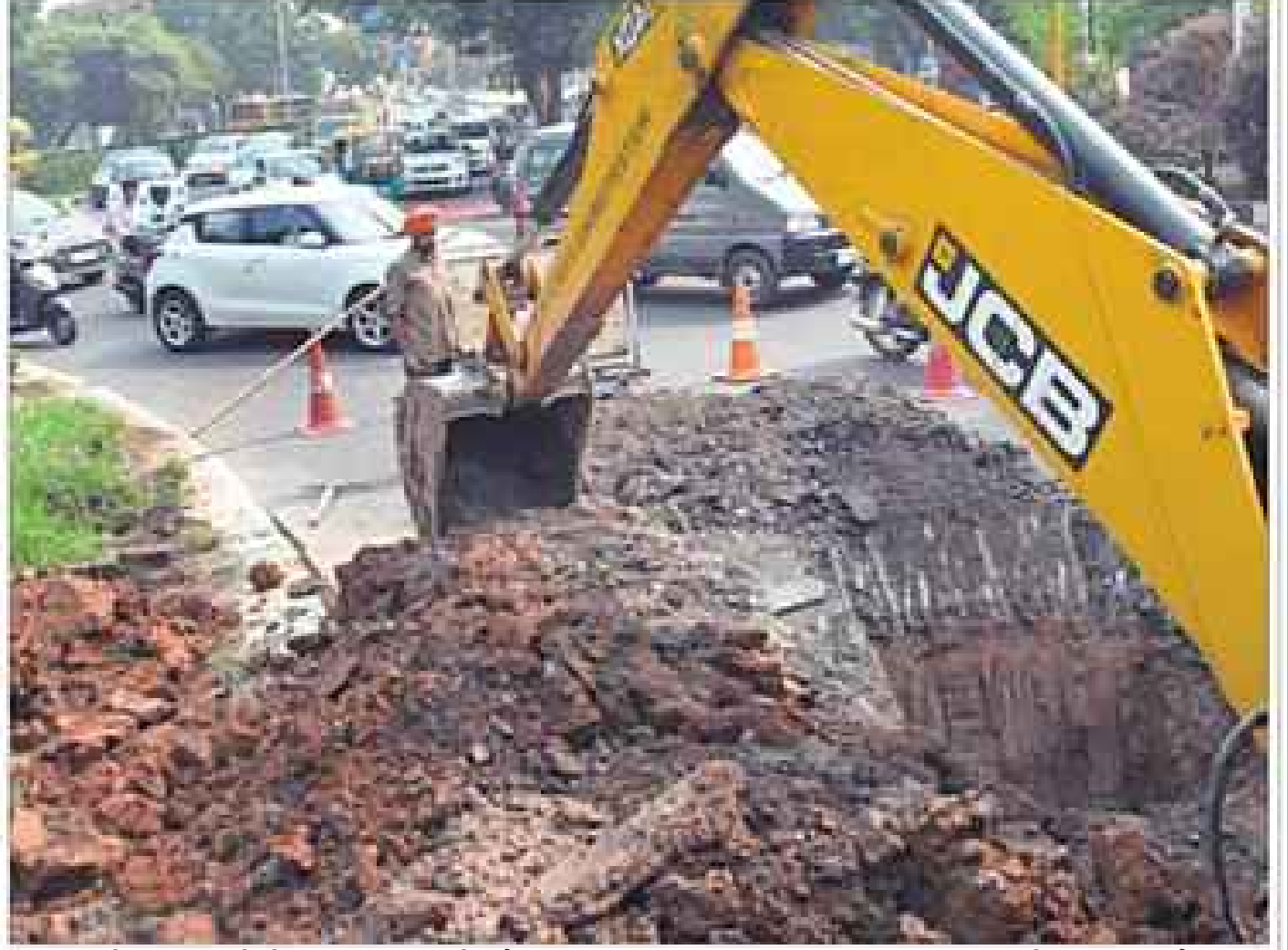
चंडीगढ़ में बुधवार को सेक्टर-26/28/27 के चौक पर वाटर पाइप लाइज की मरम्मत करती जेसीबी। इस दौरान वहां ट्रैफिक जाम की स्थिति बन गई।