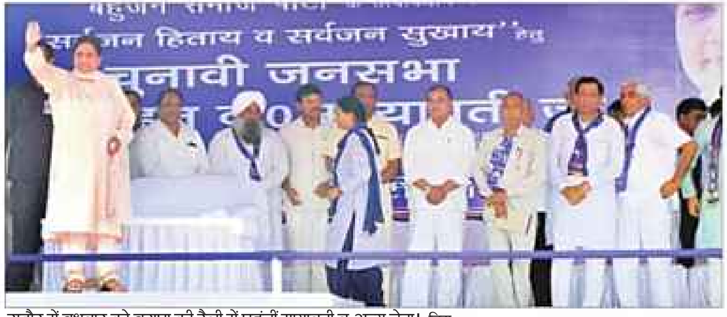
रादौर में बुधवार को बसपा की रैली में पहुंची मायावती व अन्य नेता।