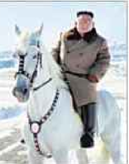
'पाइकेतो पर्वत' पर बर्फबारी के बीच घोड़े पर सवार किम जोन उन।