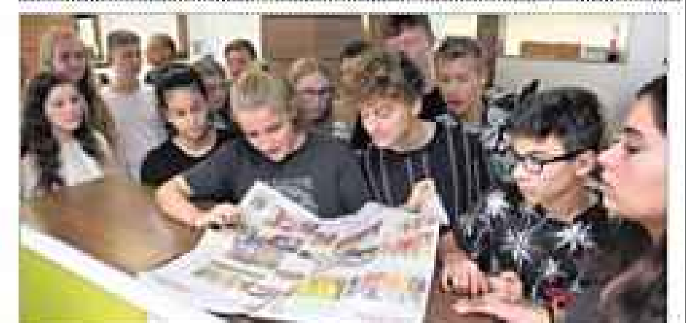
चंडीगढ़ में बुधवार को जर्मन स्कूल के विद्यार्थियों व अध्यापकों के दल ने सेक्टर-29 स्थित ट्रिब्यून कार्यालय का दौरा किया।