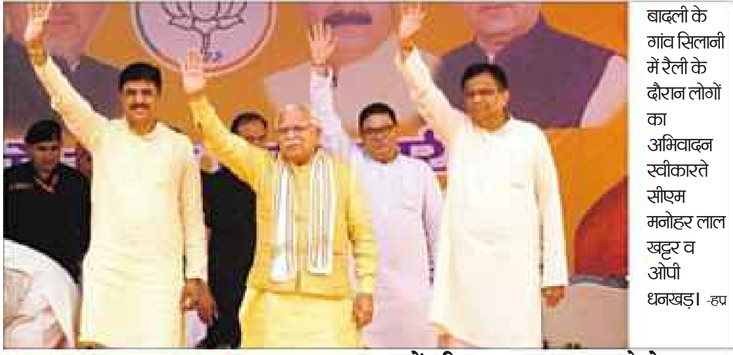
ईवीएम मतलब, एवरी वोट मोदी, मनोहर

उन्होंने कहा कि आने वाले समय में वह भ्रष्टाचार को बिल्कुल खत्म करेंगे और जो भ्रष्टाचार करता नजर आया उसे पकड़कर जनता के हवाले करेंगे। जनता अपने हिस्सा से उसके साथ न्याय करेगी। इससे पहले, कृषि मंत्री ओपी धनखड़ ने कहा कि वह समर्पित भाव से जनसेवा में जुटे हैं। जो कमी रह गई है, वह भी आने वाले समय में पूरी कर दी जाएगी। जनसभा में हिमाचल के मुख्यमंत्री जयराम ठाकुर को भी भाग लेना था, लेकिन वह नहीं पहुंच सके। उन्होंने मोबाइल फोन से रैली को संबोधित किया और धनखड़ के पक्ष में वोट की अपील की। रैली में भाजपा सांसद अरविंद शर्मा मौजूद रहे। भिवानी के बवानीखेड़ा में भाजपा प्रत्याशी विशंभर बाल्मीकि के समर्थन में विजय संकल्प रैली के दौरान खट्टर ने कहा कि पहले की सरकारें नौकरी देने के बाद युवाओं पर रैलियों में वाहन, टैट या