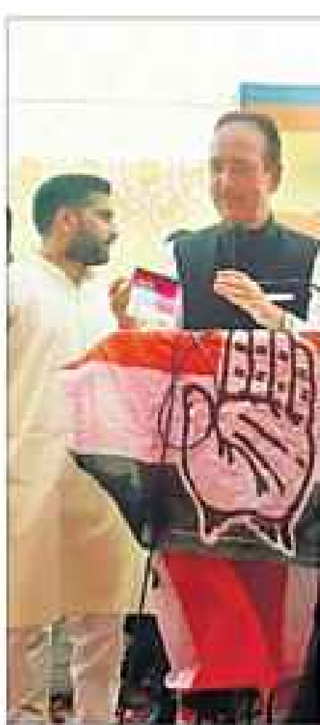
मेवात में पार्टी प्रत्याशी के समर्थन में जनसभा करते हरियाणा कांग्रेस के प्रभारी गुलाम नबी आजाद।

उन्होंने कहा कि राजनीति की बुनियाद कांग्रेस पार्टी ने रखी थी। उन्होंने कहा कि कांग्रेस जो कहती है, वो करती है। उन्होंने कहा कि भाजपा केवल लोगों की वोट लेने का काम करती है, उसका विकास से दूर-दूर का रिश्ता नहीं है। भाजपा सरकार केवल पूंजीपतियों की सरकार है। उन्होंने कहा कि प्रधानमंत्री नरेंद्र मोदी ने नोटबंदी कर देश की गरीब जनता को लाइन में खड़ा कर दिया था, जीएसटी से व्यापारियों की कमर तोड़ दी है, लेकिन कांग्रेस इस बार हरियाणा को भाजपा मुक्त बनाने जा रही है। इस मौके पर उनका फूल मालाओं से