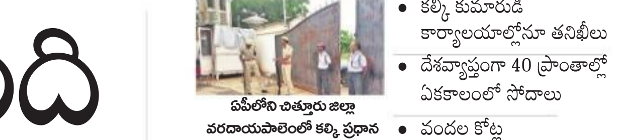
ఏపీలోని చిత్తూరు జిల్లా వరదాదులపాలెంలో కల్కి ప్రధాన ఆశ్రమం వద్ద పోలీసు బందోబస్తు

భారత్ లో పేదరికం సగానికి తగ్గిందని, వృద్ధిరేటు గత 15 ఏండ్లలో ఏడు శాతాన్ని దాటినది ప్రపంచ బ్యాంక్ తెలిపింది. మానవాభివృద్ధి అంశాలలో భారత్ ఎంతో మెరుగుపడిందని, త్వరలోనే సంపూర్ణ పేదరిక నిర్మూలన సాధించగలదని పేర్కొంది. అభివృద్ధి పథంలో సాగుతున్న భారత్ నవాగ్రహ కూడా గణనీయంగా ఎదుర్కొంటున్నదని తెలిపింది. దేశంలో ఇంకా 23 కోట్ల మందికి సరైన విద్యుత్ సదుపాయం లేదని, ఏటా 1.3 కోట్ల మంది నిరుద్యోగులు పుట్టుకొస్తున్నా 30 లక్షల ఉద్యోగాలు మాత్రమే వారికి కొత్తగా అందుబాటులోకి వస్తున్నాయని పేర్కొంది. ప్రభుత్వరంగ సంస్థలను ప్రైవేటు రంగానికి దీటుగా తీర్చిదిద్దాలని సూచించింది. మరోవైపు భారత్ లో అకలితో అలమటిస్తున్న వారి సంఖ్య పెరిగిందని, ప్రపంచ అకలి సూచి (జీఎన్ఎస్)లో భారత్ 102వ స్థానానికి దిగజారిందని రెండు అంతర్జాతీయ సంస్థలు రూపొందించిన నివేదికలో వెల్లడైంది. నేపాల్, పాకిస్తాన్, బంగ్లాదేశ్ కన్నా భారత్ లోనే అస్పృహ సంఖ్య ఎక్కువ అని ఆ నివేదిక తెలిపింది.