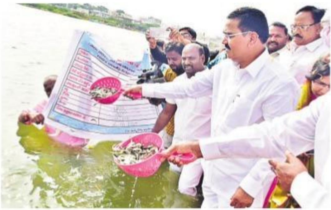
బుధవారం వనపర్తి మినీట్యాంక్ లో చేపపిల్లలను విడుదల చేస్తున్న మంత్రి నిరంజన్ రెడ్డి

వ్యవసాయశాఖ మంత్రి నిరంజన్ రెడ్డి మత్స్యకార్యాలకు ఉపాధి కల్పించడమే ప్రభుత్వ లక్ష్యమని, అందులో భాగంగానే చెరువుల్లో చేపపిల్లలను విడుదల చేస్తున్నామని వ్యవసాయశాఖ మంత్రి నిరంజన్ రెడ్డి చెప్పారు.