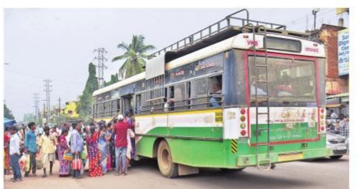
బుధవారం వికారాబాద్లోని ఎస్టిఆర్ చౌరస్తా వద్ద పల్లెవెలుగు బస్సు ఎక్కాతును ప్రయాణికులు

రోడ్లెక్కిన 6,365 బస్సులు • గ్రామాలకు పల్లెవెలుగు సర్వీసులు సోమవారంకల్లా ఆర్టీసీ కార్మికులకు వేతనాలివ్వండి • ప్రభుత్వానికి హైకోర్టు ఆదేశం ప్రతి డిపోకు ఒక నోడల్ ఆఫీసర్ • సహాయకులుగా ఐదుగురు అధికారులు కండక్టర్లకు టెలిఫోన్ జారీ యంత్రాలు • డిపోల్లో రోజువారీగా పరిశీలన వీడియోకాన్ఫరెన్స్లో రవాణాశాఖ మంత్రి పువ్వాడ అజయ్ నేడు ఉద్యోగ జేపీసీ సమావేశం • అనంతరం సీఎన్ఎస్ కు వినతిపత్రం