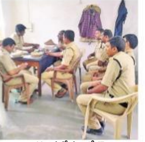
మహారాష్ట్రలో సమావేశమైన రెండు రాష్ట్రాల ఎన్ఫోర్స్ మెంట్ అధికారులు

అధికారులు మద్యం అక్రమ రవాణాకు అడ్డుకట్ట వేయాలని మహారాష్ట్ర తెలంగాణ రాష్ట్రాల ఎన్ఫోర్స్ మెంట్ అధికారులు నిర్ణయించారు. మహారాష్ట్ర ఎన్ఫోర్స్ మెంట్ లో ఇరురాష్ట్రాల అధికారులు ఆ రాష్ట్రంలో పాండ్రకవడలో బుధవారం సమావేశమయ్యారు.