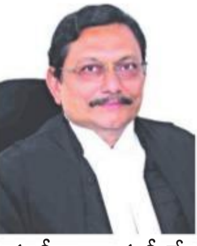
సుప్రీం కొత్త సీజ్ జస్టిస్ బొబ్బే సీజ్ గాగోయ్ సిఫారసు

సంపుటి: 58 • సంఖ్య: 180 • శనివారం 19 అక్టోబర్ 2019 • హైదరాబాద్ • పేజీలు: 10+4 • వెలు: 5.00 • Published from: Hyderabad | Karimnagar | Nizamabad | Suryapet | Vijayawada | Guntur | Rajahmundry | Visakhapatnam | Tirupati | Kurnool | Anantapur | Nellore