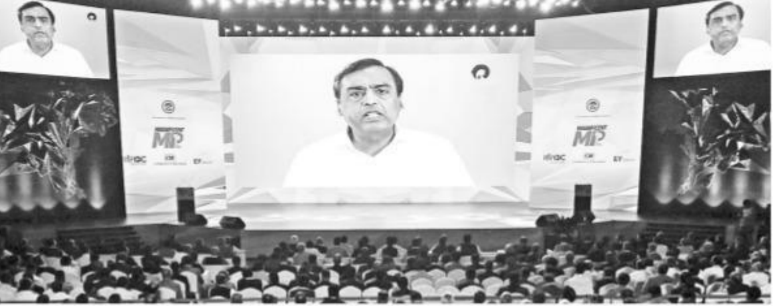
ఇండోలో జరుగుతున్న 'మెగ్నీటీషియంట్ ఎంపీ' సదస్సులో రిల్ సీఎంఓ ముఖేష్ అంబానీ వీడియో కాన్ఫరెన్స్లో ప్రసంగిస్తున్న దృశ్యం

● క్యూ2 లాభాలు రూ. 11,262 కోట్లు ● అంచనాలను మించిన ఫలితాలు ● మంచి వృద్ధిని సాధించాం: ముఖేష్ అంబానీ