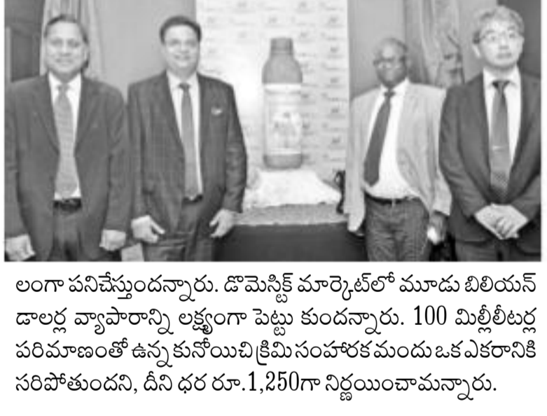
లంగా పనిచేస్తున్న వారు. డౌమ్ నెట్ మార్కెట్లో మూడు బిలియన్ల డార్ల వ్యాపారాన్ని ప్రత్యేకంగా పెట్టుకుంటున్నారని తెలుస్తోంది.

హైదరాబాద్, ఆంధ్రప్రభ: ఇఫోన్ కేంద్రంగా ఉత్పత్తి ప్రారంభించిన ప్రపంచ వ్యాపార లావాదేవీలు నిర్వహిస్తున్న ప్రముఖ క్రిమీ సంస్థ కునోయిచీ మొదలుపెట్టింది.