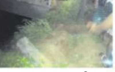
సాగర్ కాల్యోకి స్కాల్పియో అరుగురు జలసమాధి