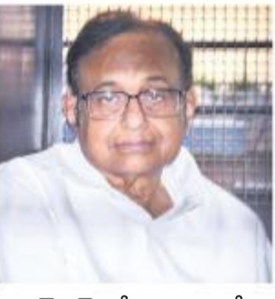
ఐఎన్ఎక్స్ మీడియా కేసు చిద్దూపై చార్జిషీట్ భార్య, కొడుకు పేరు కూడా