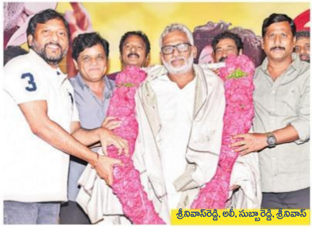
శ్రీనివాసరెడ్డి, అలీ, సుబ్బారెడ్డి, శ్రీనివాస్

తొలి సినిమా 'మొహంబదార్' తర్వాత బాలీవుడ్ లో అగ్రకథానాయకులతో సినిమాలు చేసే అవకాశాలు వచ్చాయని అంటోంది పూజాహెగ్డే. నటిగా తనకో గౌరవాన్ని తీసుకొచ్చే సినిమా చేయాలనే ఆలోచనతో ఇన్నాళ్లు నిరీక్షించానని చెబుతున్నది. దాదాపు మూడేళ్ల వరకూ తర్వాత 'హాస్ పుల్-4' సినిమా ద్వారా బాలీవుడ్ లో రీఎంట్రీ ఇవ్వాలనుకుంటున్నది. తన బాలీవుడ్ ప్రయాణాన్ని గురించి పూజా హెగ్డే వెల్లడిస్తూ 'ఎలాంటి సినిమా చేపట్టడం, ఇండస్ట్రీలో గాడ్ ఫాదర్ లేనివారికి తొలి సినిమా వారిలోని ప్రతిభా సంపత్తులను ప్రపంచానికి తెలియజేసే ఆడిషన్ టేబిల్ ఉపయోగపడుతుంది. 'మొహంబదార్' నా కెరీర్ కు అలాగే ఉపకరించింది. ఆ సినిమా పరాజయం పాలైనా బాలీవుడ్ లో చక్కటి అవకాశాలు నన్ను వెతుక్కుంటూ వచ్చాయి. నటిగా నేనువెళ్లి నిరూపించుకున్న తర్వాత మళ్లీ హిందీలో సినిమా చేయాలని నిశ్చయించుకున్నాను. ఆ ఆలోచనతో హిందీలో మూడేళ్లు సినిమాల్ని ఒప్పుకోలేదు. ఈ సమయంలో తెలుగులో నేను నటించిన సినిమాలన్నీ విజయవంతమయ్యాయి. అగ్రకథానాయకుగా నన్ను నిలబెట్టాయి. 'హాస్ పుల్-4' కథ నా మనసును ఆకట్టుకోవడంతో పునరాగమనానికి ఇదే సరైన సినిమా అనిపించింది అనికరించారు. గ్లామర్ కు పరిమితం కాకుండా నటిగా నాలోని భిన్న పార్శ్వాల్ని ఆవిష్కరించడానికి ఈ సినిమా దోహదపడింది. ఈ చిత్రం కోసం మార్గల్ అర్బీ నేర్చుకున్నాను. అలాగే మా నాన్న కోసం చేసిన సినిమా ఇది. లాయర్ గా పనిచేసే తనకు కామెడీ సినిమా లంటే చాలా ఇష్టం' అని తెలిపింది. ప్రస్తుతం పూజాహెగ్డే 'అల వైకుంఠపురములో' కథానాయికగా నటిస్తున్నది. ప్రభాస్ తో ఓ ప్రేమకథా చిత్రంలో నటిస్తున్నది.