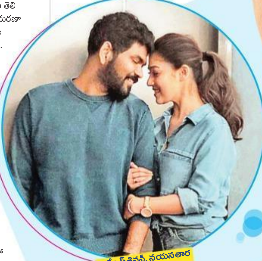
విఘ్నేశ్ వివన్, నయనతార