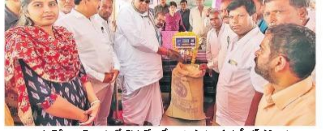
కామారెడ్డి జిల్లా మైలారంలో కొనుగోలు కేంద్రాన్ని ప్రారంభిస్తున్న స్వీకర్ పోచారం