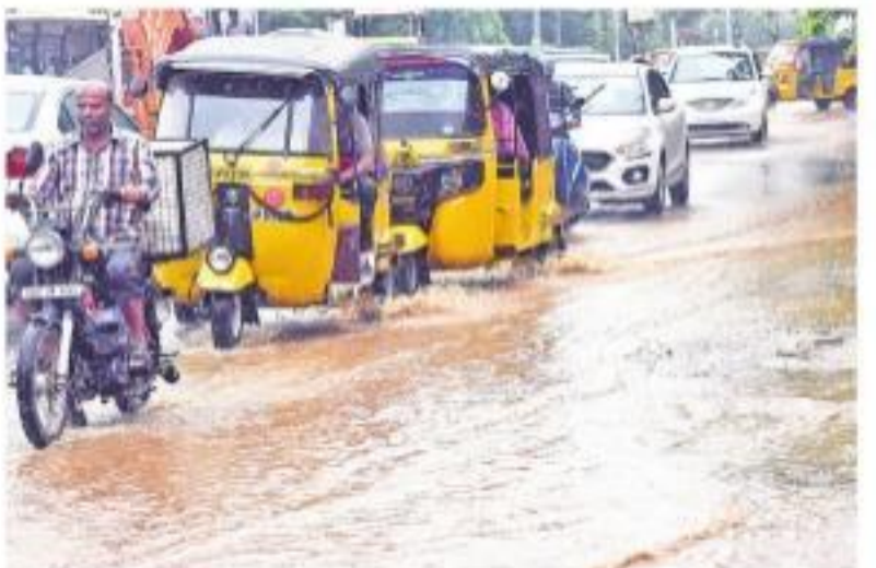
నల్గొండ పట్టణంలో రహదారిపై ప్రవహిస్తున్న వర్షపు నీరు