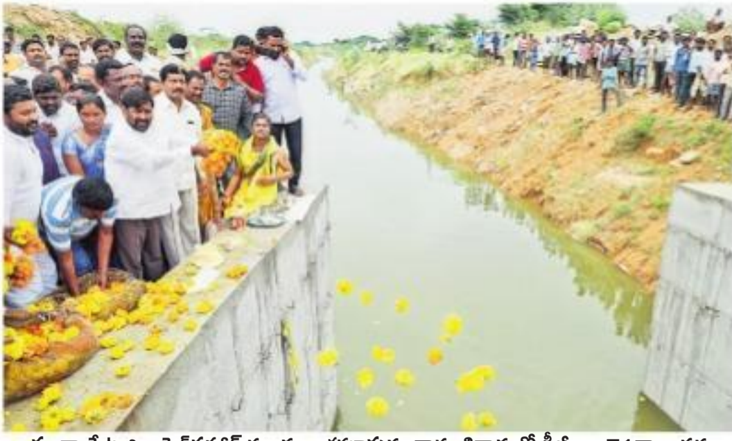
సూర్యాపేట జిల్లా పెన్వహడీ మండలం భక్తకాపురం గ్రామ శివారులో డిసెం-71 కాల్య వద్ద గోదావరి జలాలకు పూజలు చేస్తున్న మంత్రి జగదీశ్ రెడ్డి. చిత్రంలో ఎంపి బడుగుల లింగయ్యయూదవ్