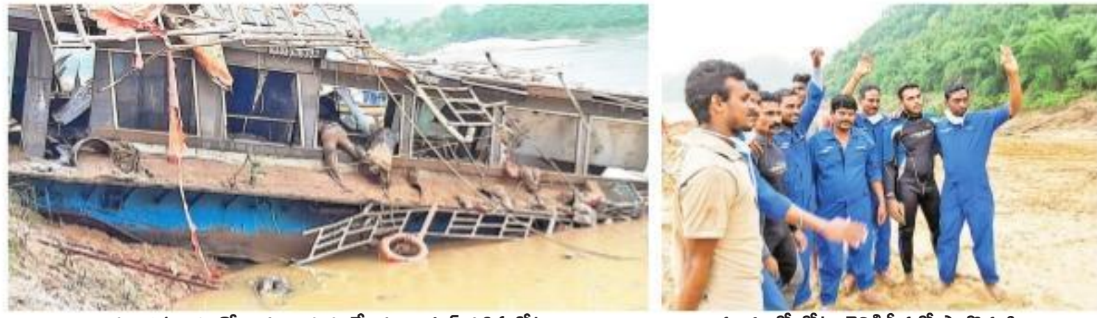
మంగళవారం గోదావరి ఒడ్డుకు చేరిన రాయల్ వశిష్ట బోటు

పుష్కలగూడలో సర్వే సం.310, 311, 318 నుంచి 323, 327 భూములపై విచారం ఉన్న దని తెలిసి కొందరు తక్కువధరకు వస్తున్నాయని కొనుగోలుచేశారు. మరొకరిని అత్యుత్సాహంతో ఏమవుతుందో అని కొన్నారు. అక్రమాలకు చట్టబద్ధత సాధించేందుకు కొందరు ప్రయత్నాలు చేశారు. అయ్యోల్దాల్లో ఎలాంటి లీలవల్లనే లేదు. కానీ గ్రామపంచాయతీ అనుమతులు తీసుకున్నట్లు ఫైరాలు తయారు చేసుకున్నారు సమాచారం. గతంలో హైకోర్టు తీర్పు వెలుపడిననాటినుంచే అధికారులు తదుపరి అక్రమాలు సాగించడానికి అనుకూలంగా అనుమతిచ్చారు. దాంతో సరికొత్త నిర్వాసితులు ఏవీ రాలేదు.