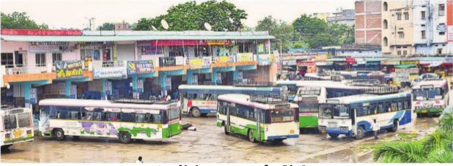
బస్సులతో కిక్ కిక్ లాడుతున్న భువనగిరి బస్ స్టేషన్

నమస్తే తెలంగాణ నెట్ వర్క్: ఆర్టీసీ ప్రగతిపథకం అగ్రకుండా పరుగులు తీస్తున్నది. ప్రభుత్వం ప్రత్యమ్నాయం ఏర్పాటు చేయడంతో ప్రజా రవాణా ఆటంకం లేకుండా సాగుతున్నది. సమ్మె ప్రభావమే కనబడకుండా బస్సులు యథావిధిగా తిరుగుతున్నాయి. పట్టణాలతో పాటు మారుమూల ప్రాంతాలకు సర్వీసులు సదుద్దేశంతో పాటు విద్యార్థుల సౌకర్యార్థం నైట్ హాల్ బస్సులు గ్రామాలకు వెళ్తున్నాయి. 90 శాతానికిపైగా బస్సులు ప్రయాణికులను గమ్యస్థానాలకు చేరవేస్తున్నాయి. జనగణం బస్సులో బస్సును ఆపివేసేందుకు ప్రయత్నించిన ఆర్టీసీ కార్మికులపై ప్రయాణికులు ఆగ్రహం వ్యక్తంచేశారు. పలుచోట్ల ఆర్టీసీ కార్మికులు తాత్కాలిక డ్రైవర్లు, కండక్టర్లు దాడులకు దిగడం ఉద్రిక్తంగా మారింది. ✦ కరీంనగర్ రీజియన్ పరిధిలోని నాలుగు జిల్లాల్లో 84.45 శాతం బస్సులు నడిచాయి. రీజియన్ లో 656 బస్సులు నడచాల్సి