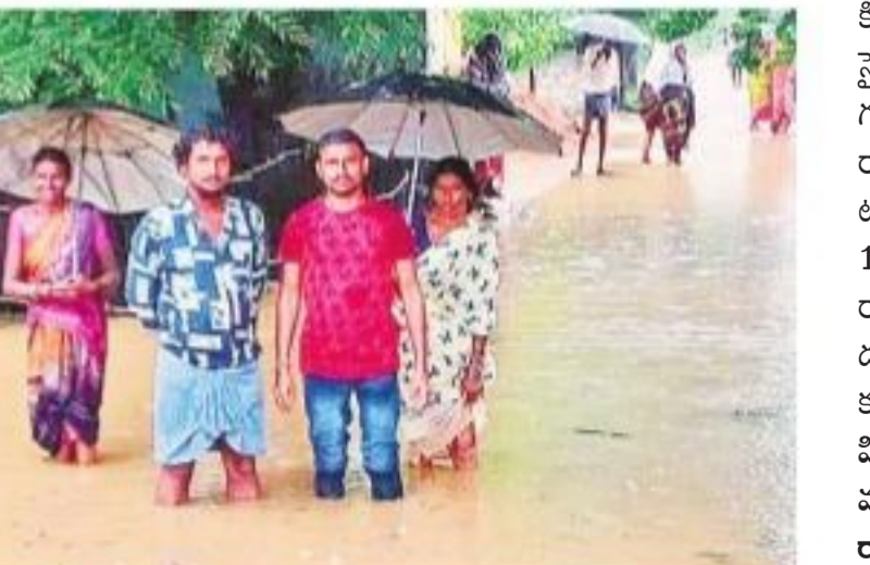
సూర్యాపేట జిల్లా వల్లభాపురంలో రోడ్డుపై మోకారిలో కునీరు