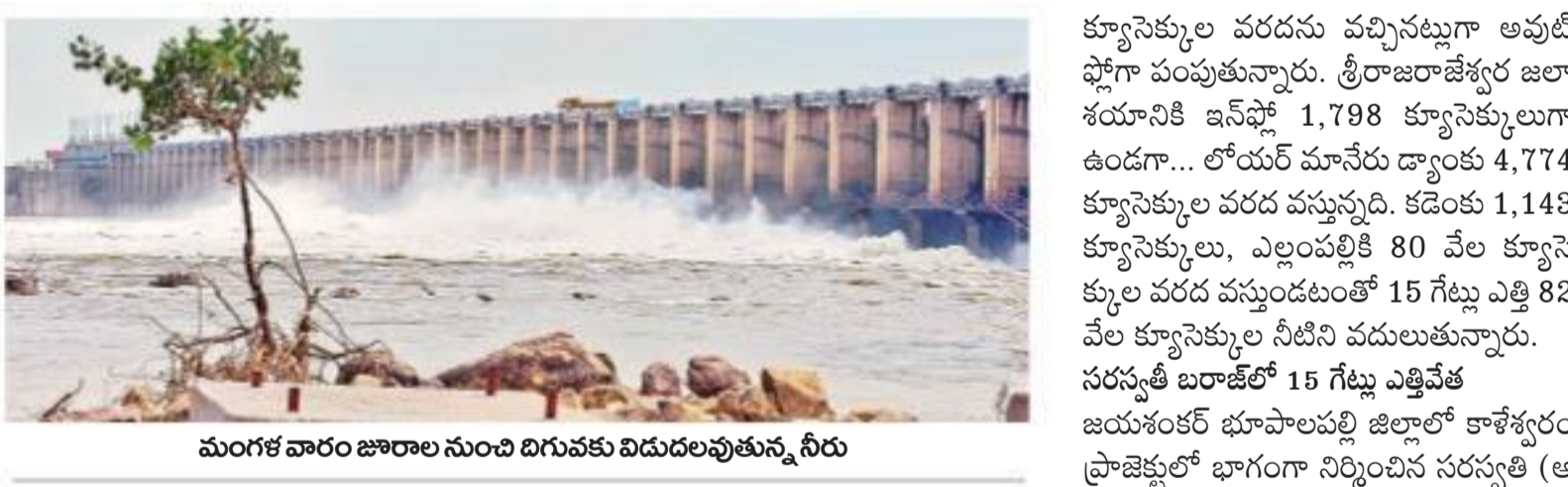
మంగళవారం జిల్లాల నుంచి దిగువకు విడుదలవుతున్న నీరు

లక్షల క్యూసెక్కుల వరకు నష్టంపాలిస్తోంది.. జూలూరు నుంచి 10 వేల క్యూసెక్కుల వరకు ప్రయాణం చేస్తున్నది. జూలూరు జిల్లాలోని కృష్ణానదికి చేరుతున్నది. జూలూరు జిల్లాలోని కృష్ణానదికి చేరుతున్నది. లక్షల క్యూసెక్కుల వరకు నష్టంపాలిస్తోంది.. జూలూరు నుంచి 10 వేల క్యూసెక్కుల వరకు ప్రయాణం చేస్తున్నది. జూలూరు జిల్లాలోని కృష్ణానదికి చేరుతున్నది. లక్షల క్యూసెక్కుల వరకు నష్టంపాలిస్తోంది.. జూలూరు నుంచి 10 వేల క్యూసెక్కుల వరకు ప్రయాణం చేస్తున్నది.