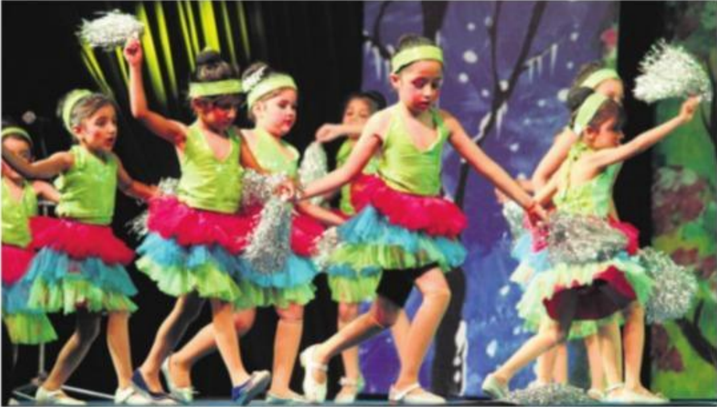
मोहाली के शिवालिक पब्लिक स्कूल में वार्षिक समारोह में परफार्म करते बच्चे।

वहीं, केंद्र से प्रशासन को उक्त प्रेस में काम करने वाले सभी कर्मियों को एडजस्ट का पत्र आने