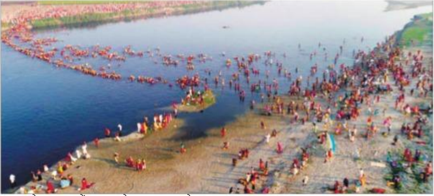
पलवल के हसनपुर में बुधवार को यमुना पार करते श्रद्धालु।

मृतकों में एक महिला, दूसरा वृद्ध, दोनों पश्चिम बंगाल निवासी