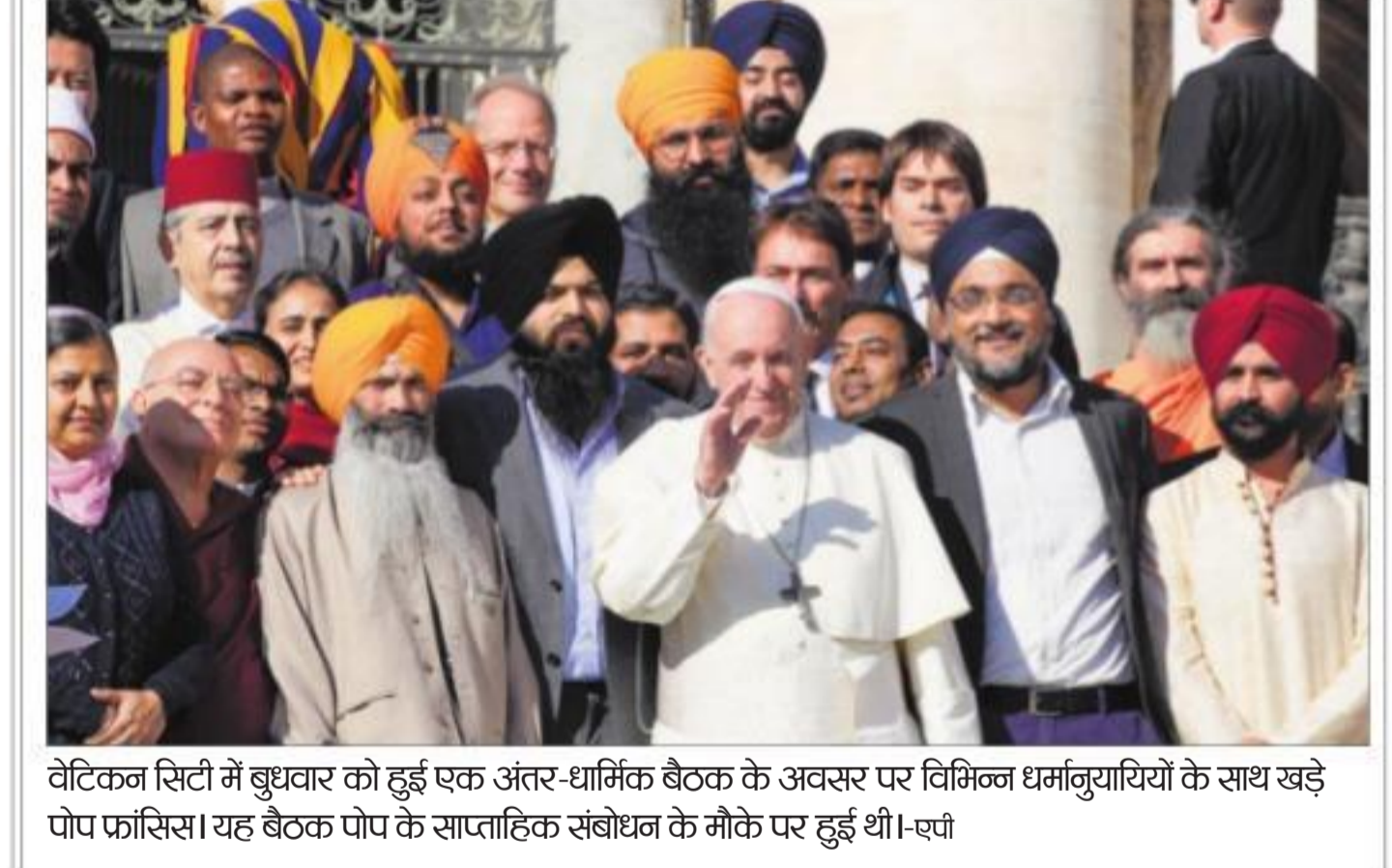
वेटिकन सिटी में बुधवार को हुई एक अंतर-धार्मिक बैठक के अवसर पर विभिन्न धर्मगुरुओं के साथ खड़े पोप फ्रांसिस। यह बैठक पोप के साप्ताहिक संबोधन के मौके पर हुई थी।