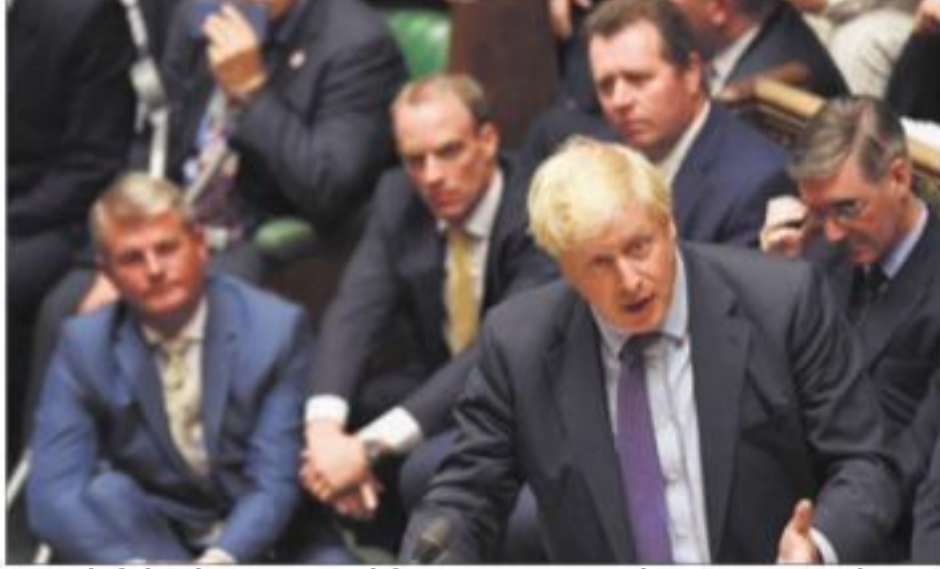
लंदन में ब्रिटेन के प्रधानमंत्री बोरिस जॉनसन संसद में अपनी बात रखते हुए।

ब्रिटेन के प्रधानमंत्री बोरिस जॉनसन ने ब्रेजिट समझौते पर उस समय 'अल्पविराम' लगा दिया जब सांसदों ने उनके ब्रेजिट विधेयक को 299 के मुकाबले 329 मतों से पारित कर दिया लेकिन इससे जुड़े उस अहम प्रस्ताव को खारिज कर दिया जिसमें 31 अक्टूबर तक यूरोपीय संघ के बाहर होने की बात की गई थी। दो महत्वपूर्ण प्रस्तावों पर ब्रिटेन की संसद में मंगलवार को मतदान होने के बाद जॉनसन ने कहा, 'मैं इस बात से निराश हूँ कि सदन ने समझौते के साथ 31 अक्टूबर तक ब्रिटेन के यूरोपीय संघ से बाहर होने की गारंटी देने वाली समयसीमा के बजाए इसमें देरी के लिए मतदान किया है। अब हमारे सामने और अनिश्चितता है।' जॉनसन ने कहा, 'इंयू को अपना मन बना लेना चाहिए कि उसे संसद के देरी के अनुरोध का क्या उत्तर देना है।