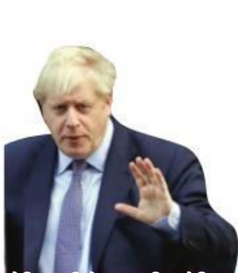
बैजिजट विधेयक पारित लेकिन समय सीमा खारिज -पेज 9