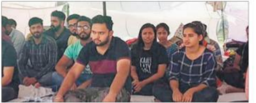
झज्जर के पंडित श्रीराम शर्मा पार्क में बुधवार को मांगों को लेकर धरने पर बैठे वर्ल्ड कॉलेज के विद्यार्थी।