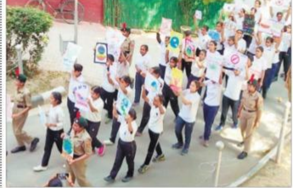
चंडीगढ़ के पीजीसीसीजी-42 की आर्मी विंग के एनसीसी कैडेट्स बुधवार को 'पटाखा विरोधी' रैली निकालते हुए।

एनसीसी कैडेटों ने पटाखे विरोधी रैली निकाली