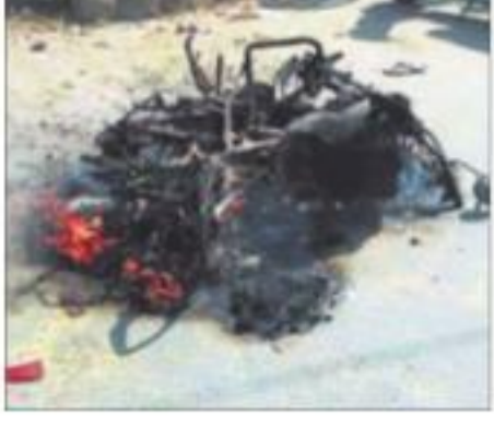
जला हुआ बाइक।