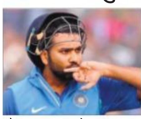
गौतम गंभीर यह श्रेय हासिल कर चुके हैं। रोहित ने रांची में तीसरे टेस्ट

दक्षिण अफ्रीका के खिलाफ सीरीज में पारी का आगाज करने वाले रोहित शर्मा आईसीसी रैंकिंग में तीनों प्रारूपों में शीर्ष दस में पहुंचने वाले तीसरे भारतीय हो गए। रोहित ने तीसरे कप्तान विराट कोहली और क्रिकेट को अलविदा कह चुके