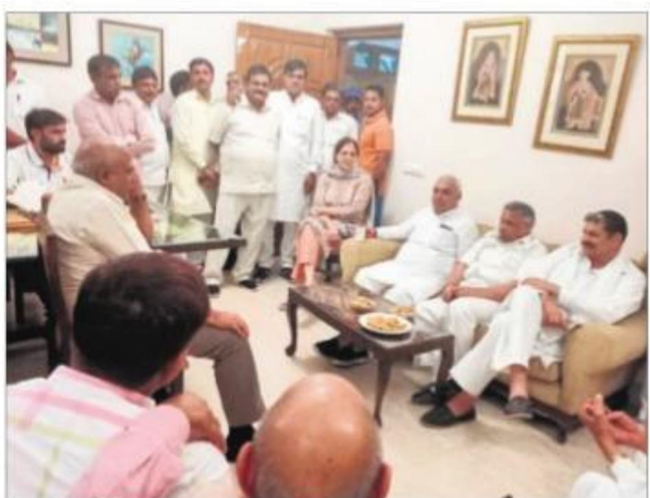
बहादुरगढ़ में बुधवार को पार्टी कार्यकर्ताओं के साथ बातचीत करते पूर्व मुख्यमंत्री भूपेंद्र सिंह हुड्डा।