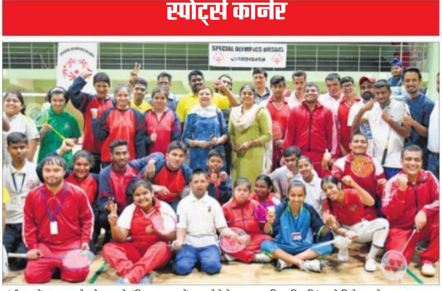
चंडीगढ़ में बुधवार को स्पेशल ओलंपिक्स भारत में भाग लेने के बाद सामूहिक चित्र खिंचवाते विशेष बच्चे।

मौके पर पहुंचे पीसीआर के एएसआई हरविंदर सिंह ने उन्हें समझाने की कोशिश की तो उक्त पदर्शनकारियों ने उक्त पुलिस अधिकारी को घेर कर मारपीट करते हुये तेजधार हथियार से हमला कर गम्भीर घायल कर उनके मोटरसाइकिल को आग लगा दी। मौके से गुजरने एक व्यक्ति ने जब पुलिस मुलाजिम को बचाने की कोशिश की तो उसे भी पदर्शनकारियों ने घायल कर दिया। लाडा से मुआवजा और अंतिम संस्कार आदि के लिये कुछ रुपये देने की मांग की और कुछ न मिलता देखकर राजू के रिश्तेदारों व अन्य सहयोगियों ने लाश को उठाकर उक्त आढ़ती की दुकान के बाहर रख दिया। देखते ही देखते प्रदर्शनकारी सड़क को जाम कर वहाँ से गुजरने वाले लोगों पर लाठियाँ, पत्थर बरसाकर उन्हें घायल करने लगे गये।