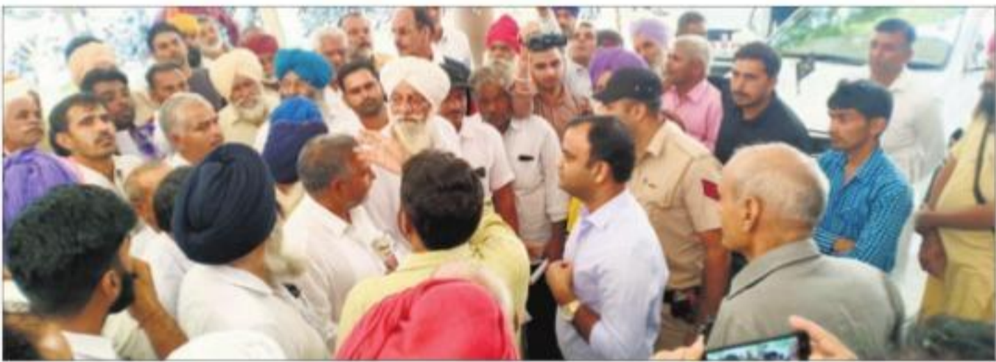
फतेहाबाद में बुधवार को पराली की समस्या को लेकर किसानों के प्रतिनिधिमंडल से बातचीत करते उपायुक्त।