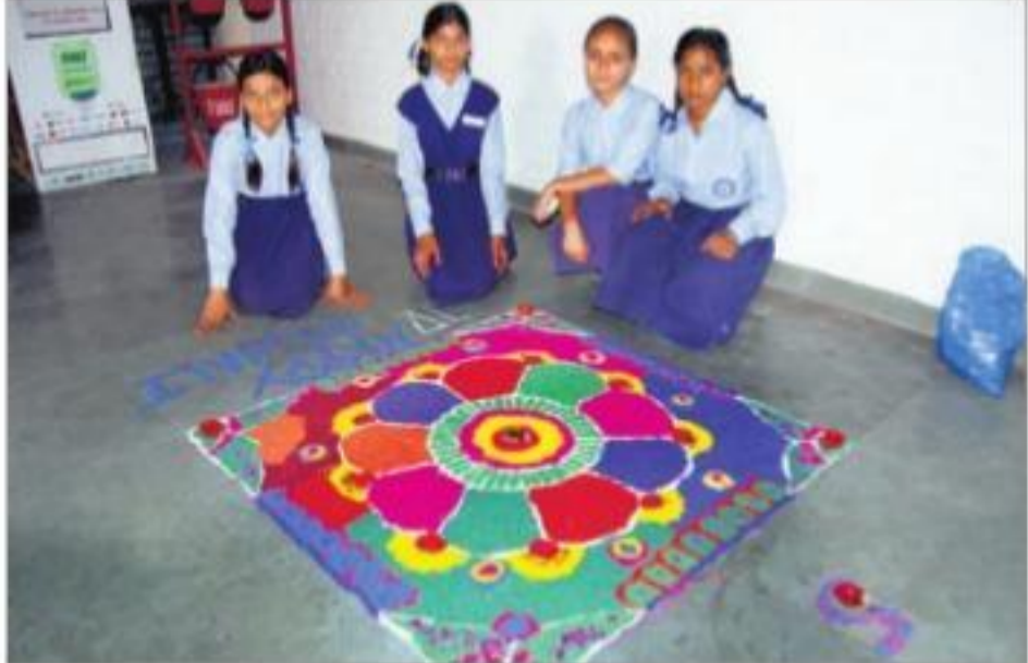
चंडीगढ़ के सेक्टर 41 स्थित गवर्नमेंट मॉडल हाई स्कूल में बुधवार को स्पर्धा में भाग लेते छात्र।