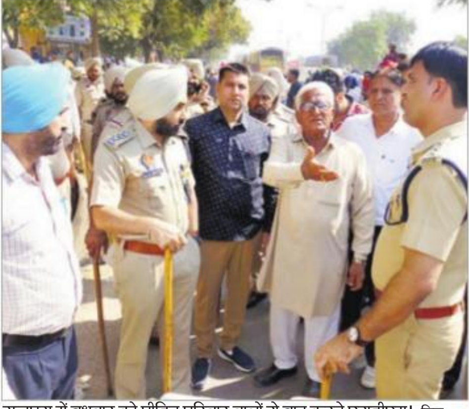
राजपुरा में बुधवार को पीड़ित परिवार वालों से बात करते एसडीएम।