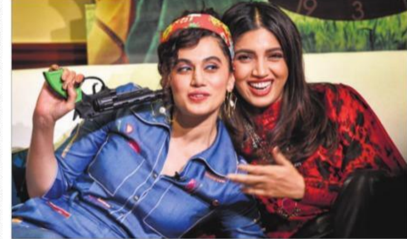
नयी दिल्ली में बुधवार को अपनी आगामी फिल्म 'सांघ की आंख' की प्रमोशन को पहुंचीं अभिनेत्रियां तापसी पन्नू और भूमि पेडनेकर मस्ती के मूड में।