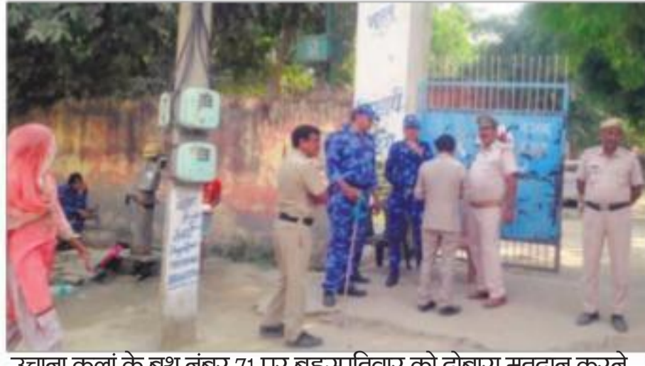
उचाना कलां के बूथ नंबर 71 पर बृहस्पतिवार को दोबारा मतदान करने जाते मतदाता।