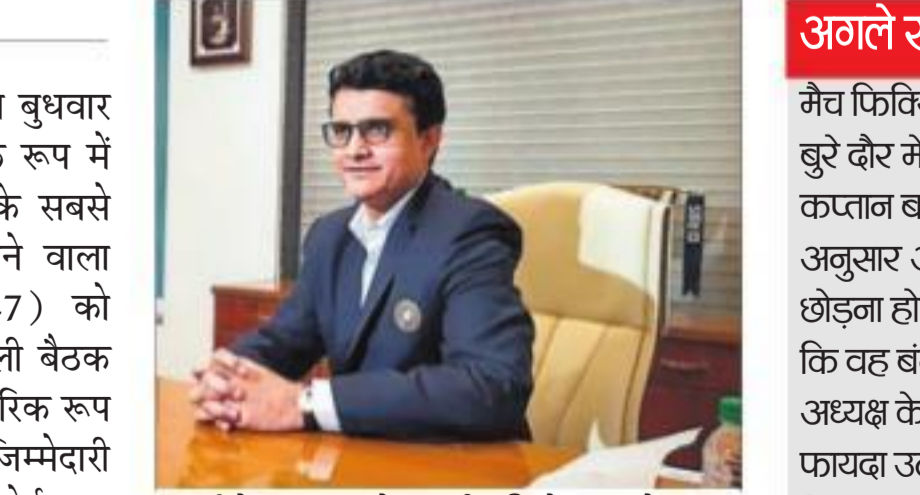
मुंबई में बुधवार को भारतीय क्रिकेट कंट्रोल बोर्ड अध्यक्ष का पद संभालने के मीके पर पूर्व कप्तान सौरव गांगुली।