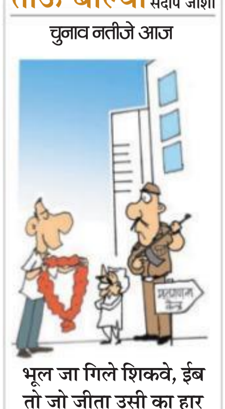
भूल जा गिले शिक्वे, ईब तो जो जीता उसी का हार