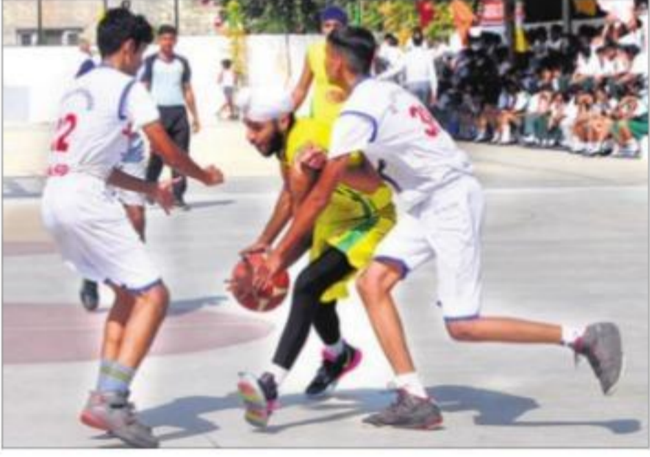
चंडीगढ़ में बुधवार को बास्केटबॉल के मैच में मिड्टे संत जेवियर व सेंट जॉन (वाइट ड्रेस) स्कूल के खिलाड़ी।