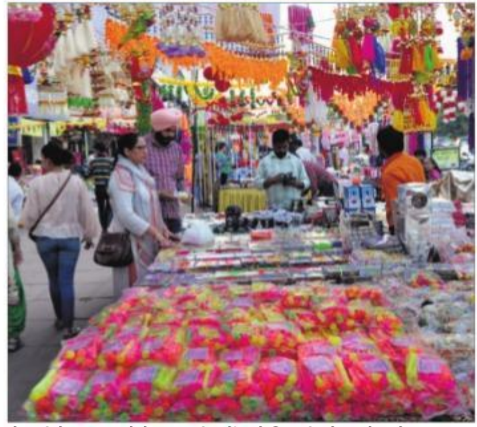
मोहाली में बुधवार को फेज-7 की मार्केट में दिवाली त्योहार के मद्देनजर सजाये गये स्टाल।