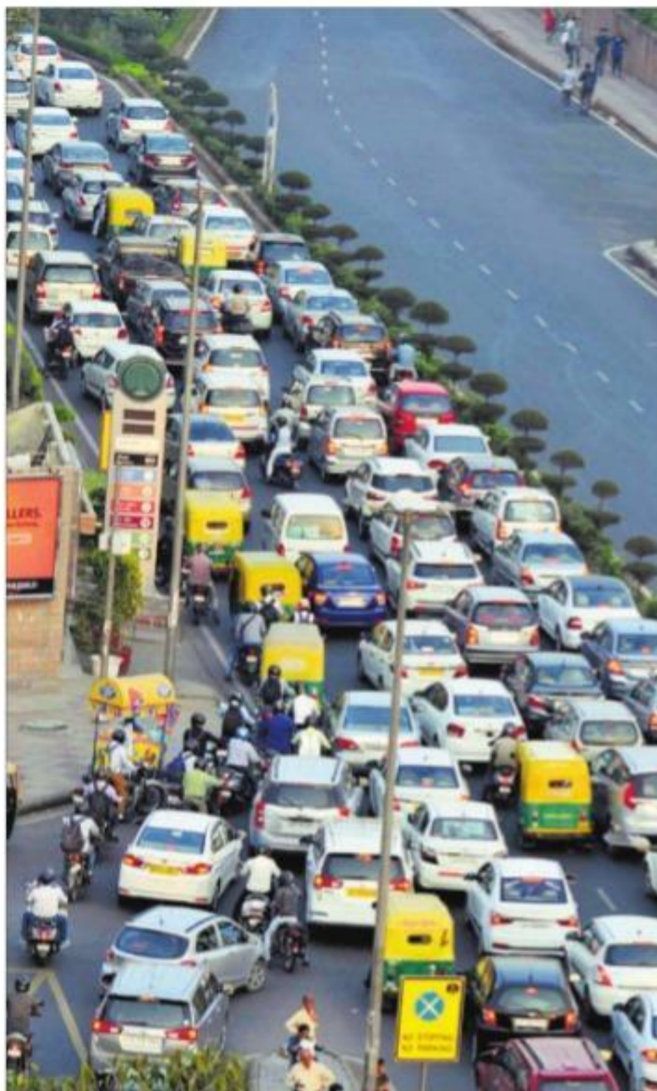
नयी दिल्ली में बुधवार को मंडी हाउस के करीब दिव्यांग छात्रों ने अपनी गांवों के समर्थन में सिकंदरा रोड को जाम कर दिया।