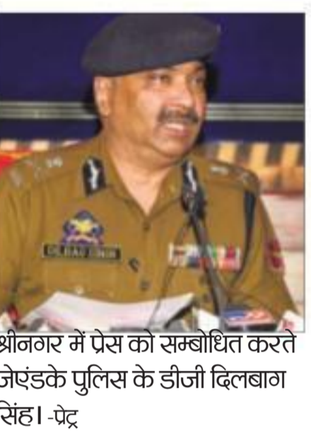
श्रीनगर में पेश की गई सूचनाओं के तहत जैश-ए-मोहम्मद के सदस्यों को जेल में भेजा गया।