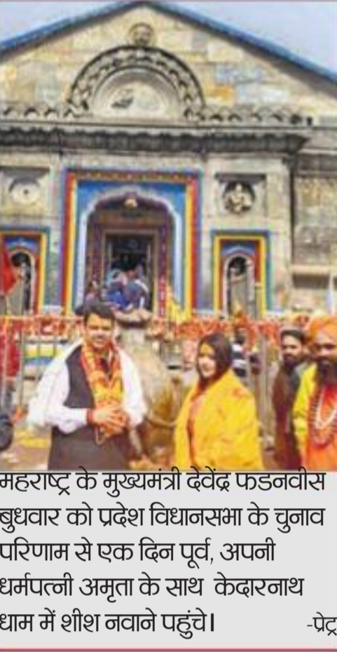
महाराष्ट्र के मुख्यमंत्री देवेंद्र फडणवीस बुधवार को प्रदेश विधानसभा के चुनाव परिणाम से एक दिन पूर्व, अर्जुनी धर्मपत्नी अमृता के साथ केदारनाथ धाम में शीश नवाने पहुंचे।

मुंबई (भाष) : महाराष्ट्र में सोमवार को हुए विधानसभा चुनाव और सतारा लोकसभा उपचुनाव की मतगणना बृहस्पतिवार सुबह 8 बजे शुरू होगी। चुनाव अधिकारियों ने यह जानकारी दी। एक्टिवेट पोल में भाजपा-शिवसेना गठबंधन के आसानी से सत्ता हासिल करने की संभावना बताये गयी है। मतगणना इयूटी के लिए करीब 25,000 कर्मियों की तैनाती की गयी है। अधिकारियों ने बताई कि 288 विधानसभा क्षेत्रों के लिए राज्य के 269 स्थानों पर मतगणना होगी। सोमवार को 61.13 प्रतिशत मतदान हुआ था जबकि वर्ष 2014 में 63.20 प्रतिशत मतदान दर्ज किया गया था। इसके साथ ही पंजाब की 4 और हिमाचल की 2 विधानसभा सीटों पर हुए मतदान का परिणाम भी बृहस्पतिवार को आयेगा। कुल मिलाकर देश के 18 राज्यों की 51 विधानसभा, 2 लोकसभा सीटों का परिणाम आज निकलेगा।