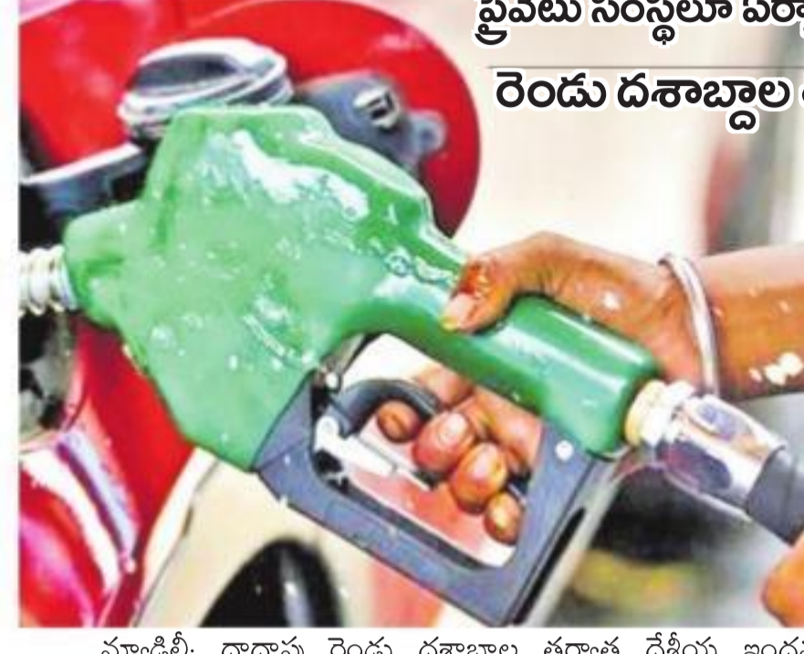
ప్రైవేటు సంస్థలూ ఏర్పాటు చేయవచ్చు.. రూ.250 కోట్ల నెట్ వర్క్ ఉంటే చాలు రెండు దశాబ్దాల తర్వాత ఇంధన లభిల్లే రంగంలో సంస్కరణలు

(నీసీఈఎం) తీసుకున్న నిర్ణయాలను కేంద్ర సమాచార, ప్రసార శాఖల మంత్రి ప్రకాష్ జవదేకర్ విలేజరులకు వెల్లడించారు. ఈ నిర్ణయంతో పెట్రోల్, డీజిల్ రిటైల్ వ్యాపారంలో ప్రభుత్వ రంగ ఆయిల్ కంపెనీలకు పోటీ పెరుగుతుందని భావిస్తున్నారు.