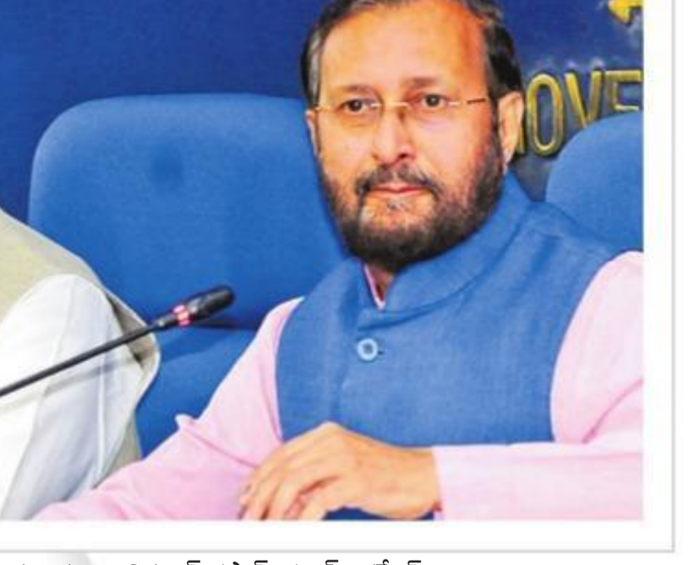
కేబినెట్ నిర్ణయాలను వెల్లడిస్తున్న కేంద్ర మంత్రులు రవిశంకర్ ప్రసాద్, ప్రకాష్ జవదేకర్

దీంతో ప్రస్తుతం రెండు కంపెనీల్లో పని చేస్తున్న 1.9 లక్షల మంది ఉద్యోగుల్లో దాదాపు సగం మందిని వీఆర్ఎస్ ద్వారా పదిలం చేయాలని ప్రభుత్వం భావిస్తోంది.