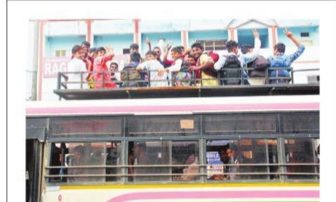
మెడక్ నుంచి హైదరాబాద్ వస్తున్న బస్సు పైన కార్పొని ప్రమాదకరంగా ప్రయాణిస్తున్న విద్యార్థులు