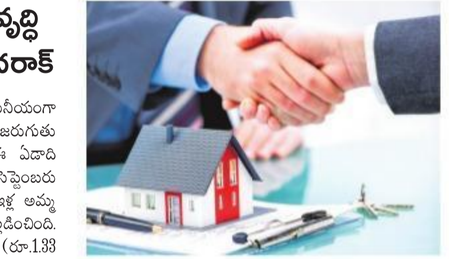
హైదరాబాద్, చెన్నై నగరాల్లో ఈ ఏడాది వరుసగా రూ.9,400 కోట్లు, రూ.5,580 కోట్ల విలువైన ఇళ్ల అమ్మకాలు జరిగాయి. హైదరాబాద్ లో ఇళ్ల అమ్మకాలు 2 శాతం తగ్గాయి. చెన్నైలో 13 శాతం పెరిగాయి.

బెంగళూరు: నగరాల్లో గృహాలకు డిమాండ్ గణనీయంగా పెరుగుతోంది. వీటి అమ్మకాలు భారీ స్థాయిలో జరుగుతున్నాయి. దేశంలో ఏడు అగ్రస్థాయి నగరాల్లో ఈ ఏడాది మొదటి మూడు త్రైమాసికాల్లో (జనవరి నుంచి సెప్టెంబరు వరకు) దాదాపు రూ.1.54 లక్షల కోట్ల విలువైన ఇళ్ల అమ్మకాలు జరిగినట్లు అనరాక్ ప్రాసర్టీ కన్సల్టెంట్స్ వెల్లడించింది. గత ఏడాది ఇదే కాలంలో విక్రయించిన ఇళ్ల విలువ (రూ.1.33 లక్షల కోట్లు)తో పోలిస్తే వృద్ధి 16 శాతంగా ఉందని తెలిపింది.