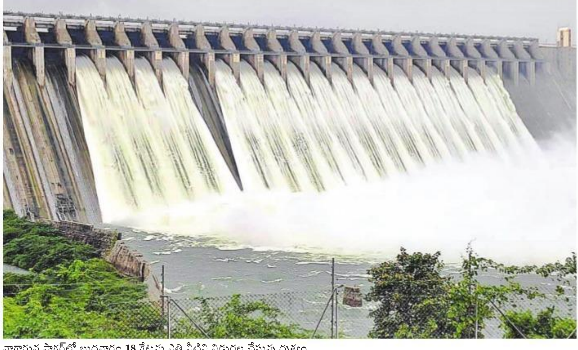
నాగార్జున సాగర్ లో బుధవారం 18 గేట్లను ఎత్తి నీటిని విడుదల చేస్తున్న దృశ్యం