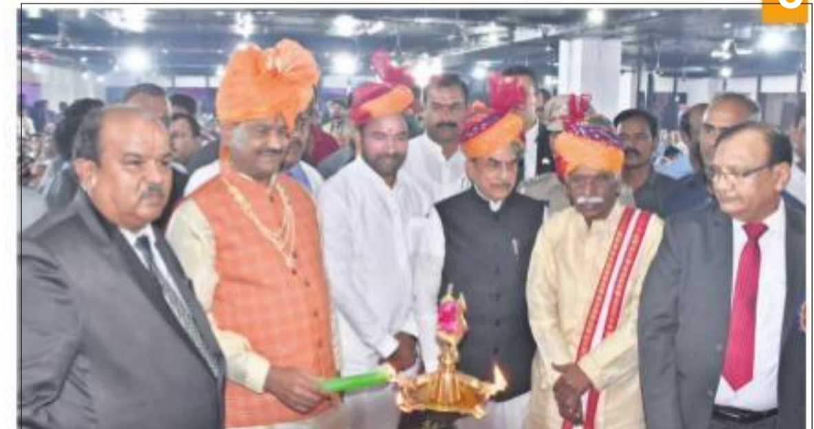
హైదరాబాద్ లో మహిళ కో-ఆపరేటివ్ బ్యాంకు నూతన భవన ప్రారంభోత్సవంలో లోక్ సభ స్పీకర్ ఓంబర్లా