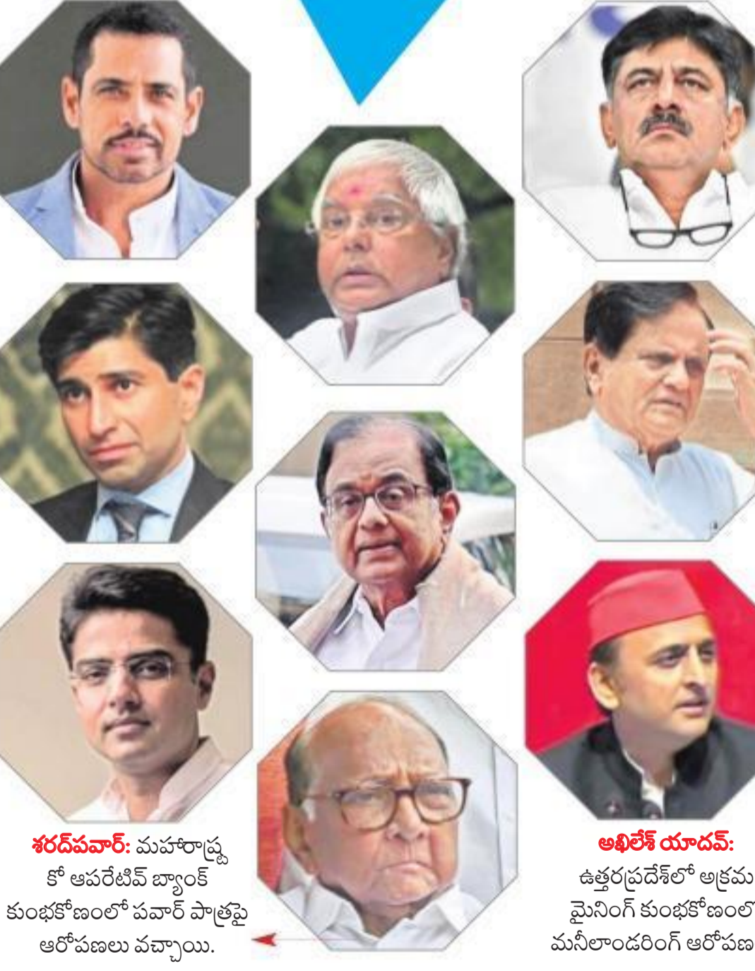
శరదపవార్: మహారాష్ట్ర కోఆపరేటివ్ బ్యాంక్ కుంభకోణంలో పవార్ పాత్రపై ఆరోపణలు వచ్చాయి. అఖిలేశ్ యాదవ్: ఉత్తరప్రదేశ్ లో అక్రమ మైనింగ్ కుంభకోణంలో మసీదాదరింగ్ ఆరోపణలు.