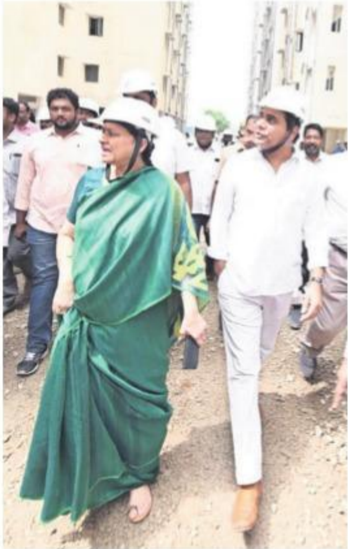
కొల్లూరులో డబుల్ టెండరుం ఇళ్ల పనుల ప్రగతిని పరిశీలిస్తున్న మంత్రి కేటీఆర్