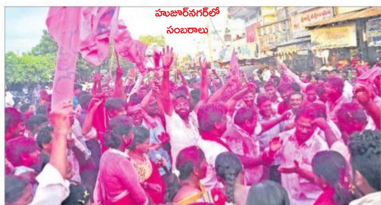
మజూర్ నగర్ లో సందర్శనలు

రేపు మజూర్ నగర్ వెళ్తున్నా.. ప్రజలను కలిసి కృతజ్ఞతలు చెబుతా. ఏం చేయాలనుకున్నానో అక్కడే అన్నీ చెబుతా.. వారి నమ్మకానికి తగ్గట్లు అన్నీ చేస్తాం - సీఎం కేసీఆర్