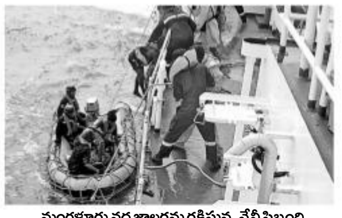
మంగళూరు వద్ద జాలరను రక్షిస్తున్న నేపీ సిబ్బంది

చెన్నై: మాజీ ప్రధాని రాజీవ్ గాంధీ హత్య కేసులో డోపి ఆయన సఖిని వేలూరు జైల్లో నిరాహార దీక్ష దిగారు. హత్య కేసులో తాను, తన భర్త 28 ఏండ్లపాటు జైలుశిక్ష అనుభవిస్తున్నామని, కాబట్టి తమను విడుదల చేయాలంటూ ఆమె డిమాండ్ చేశారు. ఈ మేరకు ఆమె జైలు అధికారులకు ఓ లేఖ రాస్తూ శుక్రవారం రాత్రి నుంచి నిరహారదీక్ష దిగినట్లు పేర్కొన్నారు. తమిళ నాడు ప్రభుత్వానికి పలుసార్లు విజ్ఞప్తి చేశామని గుర్తుచేశారు. తమ కుమార్తెకు గత 28 ఏండ్ల నుంచి దుర్భాగం ఉంటున్నామని, ఆమె వివాహం ఏర్పాటు కోసం ఇటీవల వరల్డ్ విడుదలయ్యామని చెప్పారు.