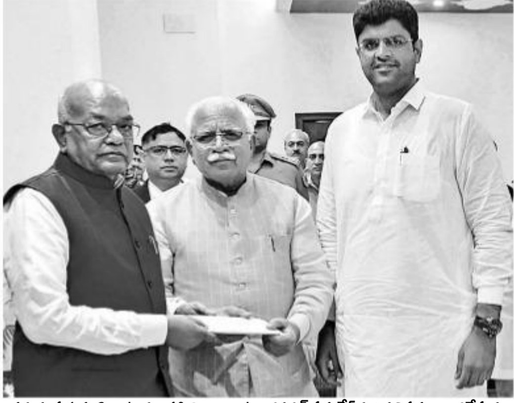
తమను ప్రభుత్వ ఏర్పాటుకు ఆహ్వానించాలంటూ గవర్నర్ సత్యదేవ్ పిన్ తిప్పడం అందజేస్తున్న హర్యానా సీఎం మనోహర్ లాల్ ఖట్టర్. చిత్రంలో జేపీఐ అధినేత దుష్యంత్ చౌతాలా

చండీగఢ్, అక్టోబర్ 26: దీపావళి పండుగనాడే హర్యానాలో బీజేపీ, జేడీపీ సంకీర్ణ ప్రభుత్వం కొలుపుదీరనున్నది. ఆ రాష్ట్ర గవర్నర్ సత్యదేవ్ పిన్ ఆర్థిక ప్రభుత్వాన్ని ఏర్పాటు చేయాలంటూ శనివారం బీజేపీని ఆహ్వానించారు. అధికారం మనోహర్ లాల్ ఖట్టర్ మరోసారి ముఖ్యమంత్రి బాధ్యతలు చేపట్టనున్నారు. జననాయక్ జనతా పార్టీ (జేజీపీ) అధినేత దుష్యంత్ చౌతాలా డిప్యూటీ సీఎంగా ప్రమాణం చేయనున్నారు. ఏడుగురు సభ్యులతో ఎమ్మెల్యేల వైతం ప్రభుత్వంలో భాగస్వాములు కానున్నారు. మధ్యాహ్నం 2.15 గంటలకు రాజీవ్ గాంధీ ప్రమాణ స్వీకారోత్సవం ఉంటుందని బీజేపీ పర్చాలు తెలిపాయి. అంతకుముందు శనివారం ఉదయం కేంద్ర మంత్రి రవిశంకర్ ప్రసాద్, బీజేపీ