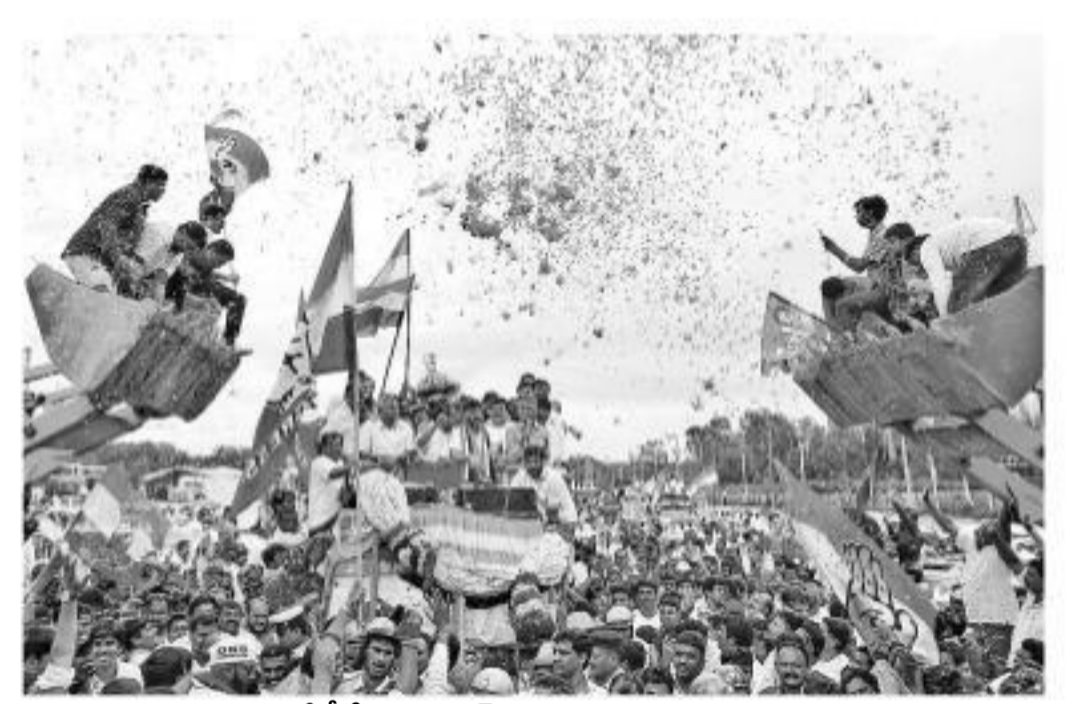
బెంగళూరులో డిజి శివకుమార్ పై పూలవర్షం కురిపిస్తున్న అభిమానులు