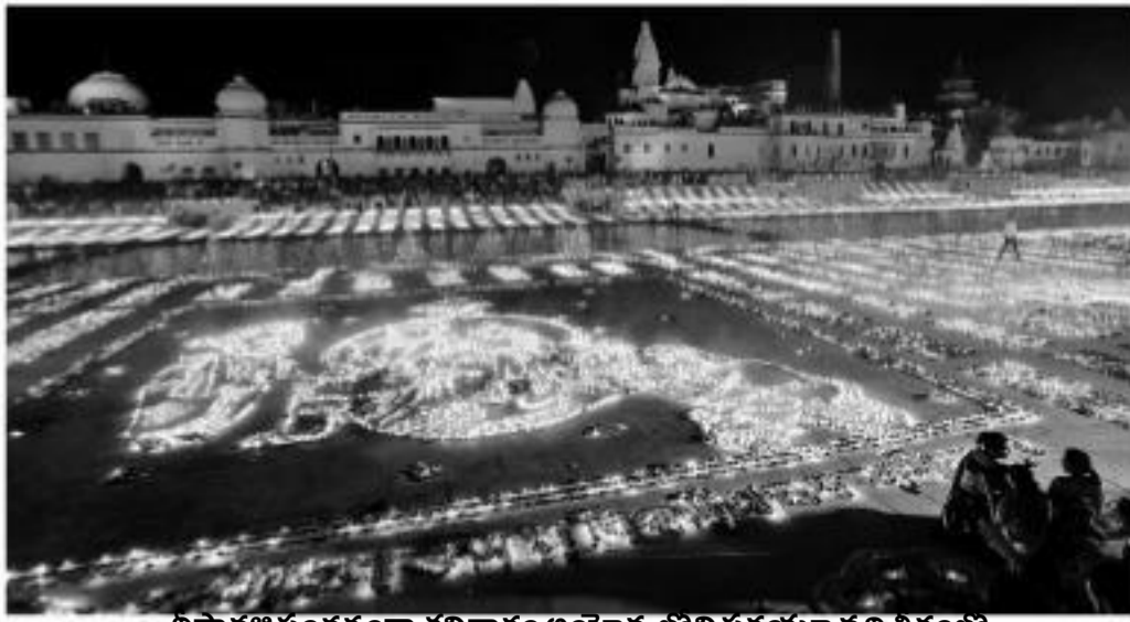
దీపావళి సందర్భంగా శనివారం తియ్యాద్దలోని సరయూ నది తీరంలో దాదాపు ఐదు లక్షల దీపాలును వెలిగించిన దృశ్యం