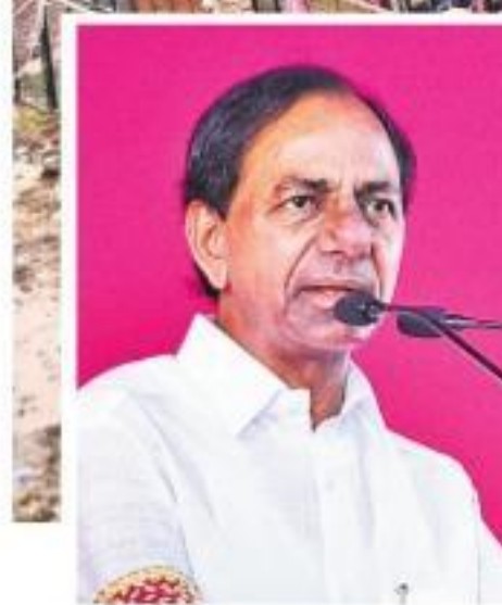
శనివారం సూర్యాపేట జిల్లా హుజూర్ నగర్ లో జరిగిన ప్రజాకృతజ్ఞతనభవన పాఠశాల జనం. (ఇన్ సెట్) ప్రజల సద్దేశించి మాట్లాడుతున్న ముఖ్యమంత్రి కే చంద్రశేఖరరావు