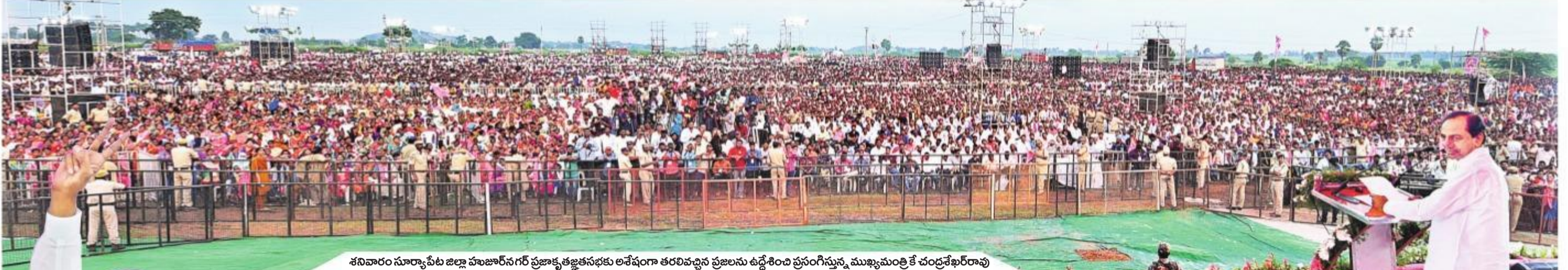
శనివారం సూర్యాపేట జిల్లా హజారన్ గర్ ప్రజాకృతజ్ఞతసభకు అనేకంగా తరలివచ్చిన ప్రజలను ఉద్దేశించి ప్రసంగిస్తున్న ముఖ్యమంత్రి కే చంద్రశేఖరరావు