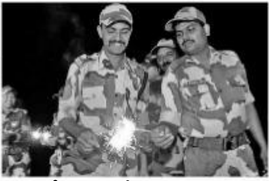
దేశవ్యాప్తంగా దీపావళి సందర్భంగా మొదలయ్యాయి. కశ్మీర్ నుంచి కన్యాకుమారి వరకు వెలుగులపండగను ప్రజలు ఘనంగా జరుపుకొంటున్నారు. ఇందులో భాగంగా నలహద్దులో సైనికులు దీపాలు వెలిగించిన వటాకులు, కాకర్లులూ కాలాదు.