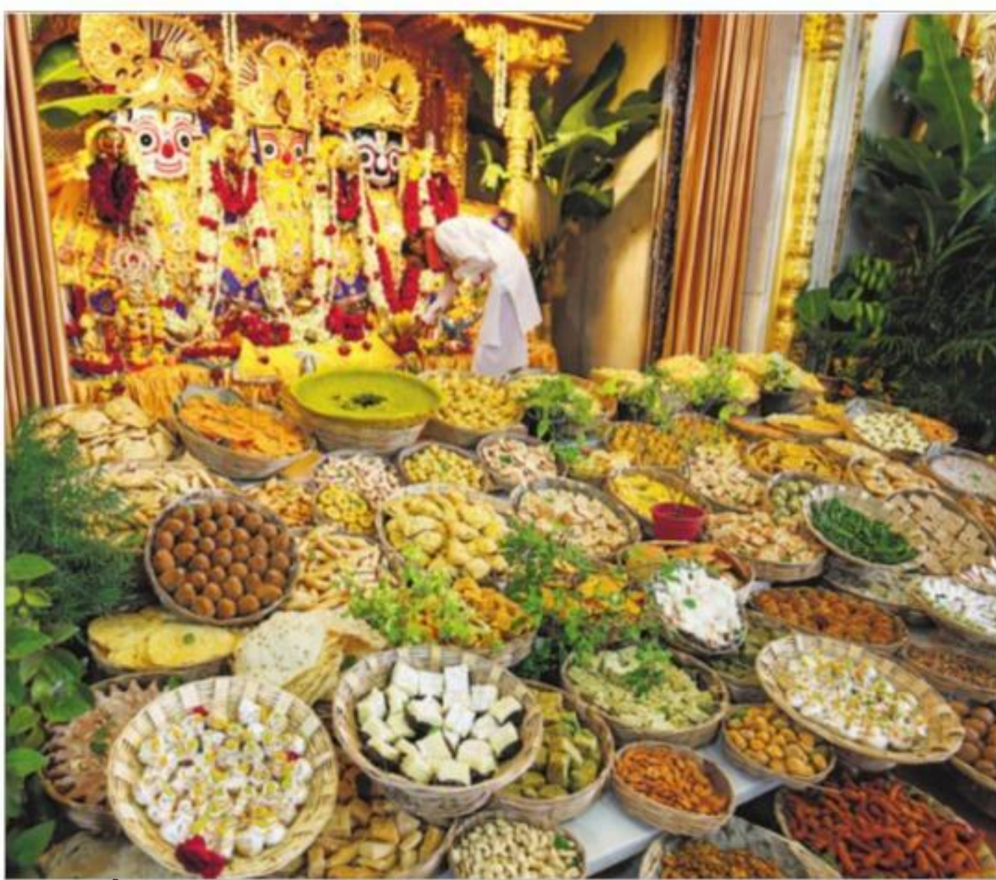
छप्पन भोग : अहमदाबाद के एक मंदिर में सोमवार को 'अन्नकूट' पर्व पर भगवान को अर्पित भोग।

विभिन्न विमानन कंपनियों और हवाईअड्डों के 13 कर्मचारी 16 सितंबर के बाद से शराब परीक्षण में विफल पाए गए हैं। सभी को 3 माह के लिए निलंबित कर दिया गया है। नागर विमानन महानिदेशालय (डीजीसीए) के अधिकारी ने सोमवार को इस संबंध में जानकारी दी। 7 कर्मचारी इंडिगो के और 1-1 गोएयर और स्पाइस जेट के हैं। नागर विमानन नियामक डीजीसीए ने सितंबर में सभी हवाईअड्डों पर शराब परीक्षण के नियम जारी किए थे। इसके तहत हवाईअड्डों, हवाई यातायात नियंत्रण (एटीसी) संभालने वाले कर्मचारी, विमान के रखरखाव कर्मचारी, जमीन पर विमानन कंपनियों का काम संभालने वाले कर्मचारी इत्यादि सभी का शराब परीक्षण किया जाना है।