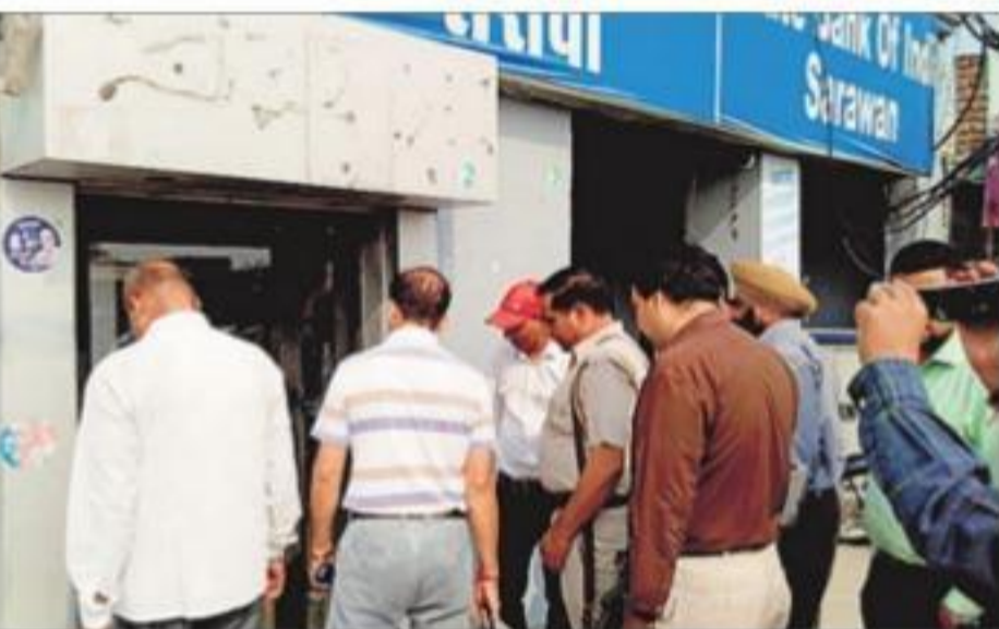
यमुनानगर के गांव सरवां में सोमवार को एटीएम के बाहर जमा भीड़।