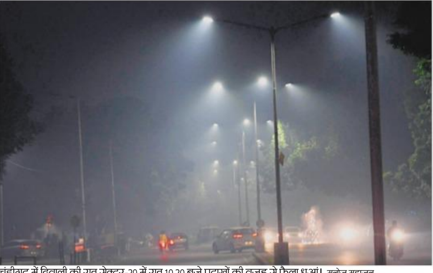
चंडीगढ़ में दिवाली की रात सेक्टर-20 में रात 10.20 बजे पटाखों की वजह से फैला धुआं।

रंजू ऐरी डडवाल/ट्रिब्यू चंडीगढ़, 28 अक्टूबर