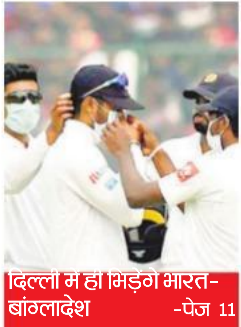
दिल्ली में ही भिड़ंग भारत-बांग्लादेश - पेज 11