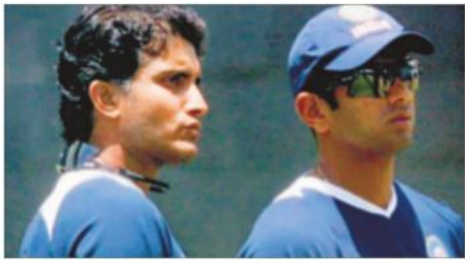
नयी दिल्ली, 28 अक्टूबर (एजेंसी)

राष्ट्रीय टीम का लंबे समय तक एक साथ प्रतिनिधित्व करने वाले सौरव गांगुली और राहुल द्रविड़ क्रमशः बीसीसीआई अध्यक्ष और राष्ट्रीय क्रिकेट अकादमी (एनसीए) के प्रमुख के तौर पर भारतीय क्रिकेट के भविष्य का खाका तैयार करने के लिए बुधवार को बेंगलुरु में मुलाकात करेंगे। द्रविड़ ने जुलाई में एनसीए प्रमुख का कार्यभार संभाला था।