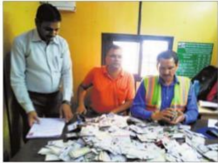
घरौंडा टोल प्लाजा पर पकड़े गये फर्जी आईडी पूफ को दिखाते टोल अधिकारी।

इस टोल बैरियर से रोजाना हजारों की संख्या में छोटे-बड़े वाहन बिना टोल टैक्स चुकाए निकल रहे हैं। मुफ्त टोल क्रास करने वाले वाहन चालक खुद को आसपास से गांवों से संबंधित होने का हवाला देकर यह सुविधा ले रहे हैं। इसके लिए बाकायदा टोल कर्मचारियों को स्थानीय एड्रेस का आधार कार्ड, आरसी, लाइसेंस, वोटर कार्ड दिखाया जाता है। टोल से मुफ्त क्रास कर रहे वाहनों की संख्या दिन प्रतिदिन बढ़ती जा रही है। ऐसे में वाहनों की फ्री क्रासिंग से टोल कंपनी एनएआई को रोजाना मोटा चूना लग रहा है। मुफ्त टोल क्रासिंग पर अंकुश लगाने के लिए टोल कंपनी ने प्लाजा पर