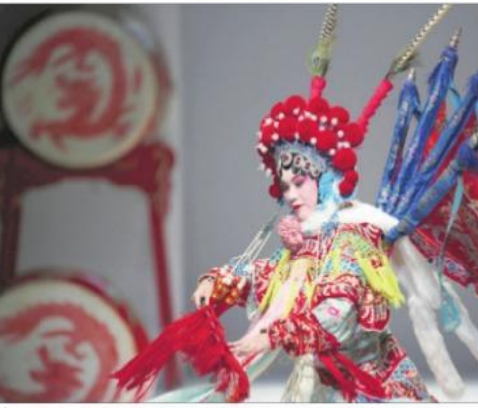
चीन फैशन वीक में सोमवार को प्रस्तुति देती बीजिंग की एक ओपेरा डांसर।

मुंबई (एजेंसी) : अभिनेता नील नितिन मुकेश के अनुसार फिल्म उद्योग एक बाक्सिंग रिंग है जहां खेल तब तक खत्म नहीं होता जब तक मुकाबले में एक व्यक्ति हार न जाए या खेल का वक्त पूरा न हो जाए। यहां कलाकार लगातार वापसी के लिए जुझता है और आखिरी तक लड़ता है। 2007 में 'जॉनी गद्दार' से अपने करियर की शुरुआत करने वाले नील ने वह दौर भी देखा जब उनकी फिल्में फ्लॉप हुईं। उन्होंने बताया कि समय ने उन्हें बहुत मजबूत बना दिया। एक मेट में उन्होंने कहा, 'अपने 12 साल के करियर में उन्होंने कई फिल्मकारों के साथ काम किया और फिल्म निर्माण के बारे में बहुत कुछ सीखा। बॉलीवुड में मेरी यात्रा खुद से लड़ने की सीख देने वाली रही। मैंने अभिनय की कोई औपचारिक ट्रेनिंग नहीं ली थी। हर दिन मैं सीखता गया। वह मानते हैं कि सिनेमा कमी भी, कहीं भी नहीं ठहरता इसलिए उनका अलग अलग भाषाओं की फिल्में करने का फैसला सही है।