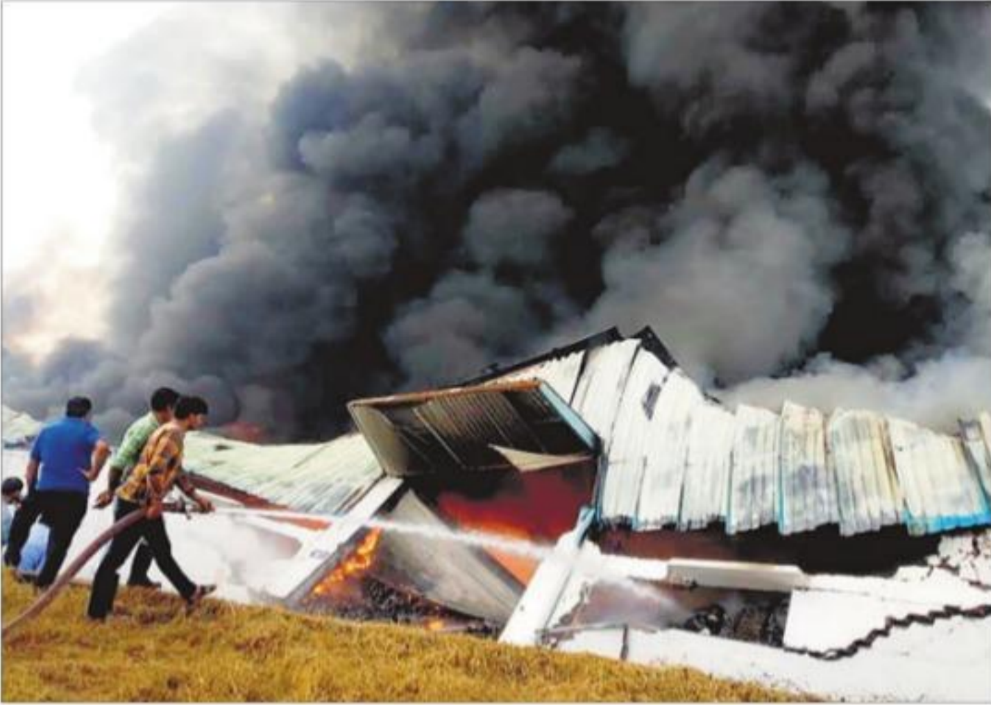
सोनीपत में सोमवार को इलेक्ट्रॉनिक्स के गोदाम में आग पर काबू पाते दमकल कर्मी।

दमकल विभाग की गाड़ी मौके पर पहुंची, लेकिन आग तब तक काफी फैल चुकी थी। इसके बाद दमकल विभाग ने जिले के सभी दमकल स्टेशनों के साथ-साथ पानीपत व समालखा केन्द्रों पर आग की सूचना दी गई। सूचना मिलने के बाद मौके पर पहुंची एक दर्जन से ज्यादा गाड़ियों ने कड़ी मशक्कत के बाद आग पर काबू पाया।