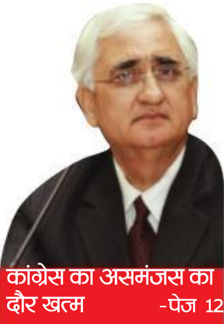
कांग्रेस का असमंजस का दौर खत्म - पेज 12