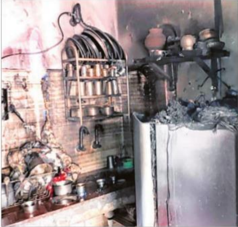
रेवाड़ी में कांग्रेस नेता के घर में लगी आग से जला सामान।

लेकिन आग की चपेट में आने से वह मामूली सी झुलस गई थी।