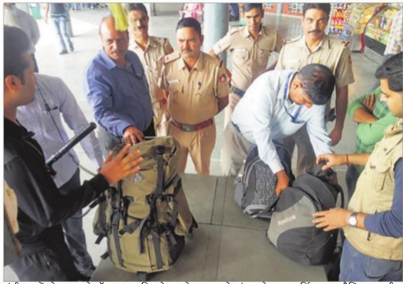
चंडीगढ़ में सोमवार को हॉक्स काल मिलने पर सेक्टर-43 के इंटरस्टेट बस टर्मिनल पर चैकिंग करती पुलिस।