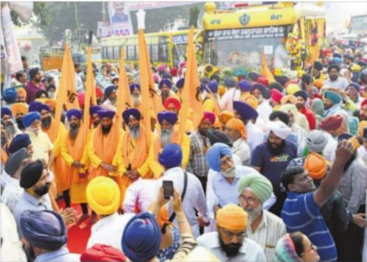
नयी दिल्ली में सोमवार को ननकाना साहिब के लिए निकले नगर कीर्तन में उमड़ा विशाल जनसमूह।

प्रकाशक व मुद्रक राजकुमार सिंह द्वारा द ट्रिब्यून ट्रस्ट की ओर से द ट्रिब्यून प्रेस, सेक्टर 29-सी, चंडीगढ़ से मुद्रित व द ट्रिब्यून, सेक्टर 29-सी, चंडीगढ़ से प्रकाशित। कॉपीराइट ©, द ट्रिब्यून ट्रस्ट, सर्वाधिकार सुरक्षित। आर.एन.आई. रजि. नंबर 312198/78. चंडीगढ़ फोन : 2655066, 2655067, 2655068. सकुंलेशन : 0172-2670419, विज्ञापन : 0172-2670256-257. संपादक : राजकुमार सिंह* *पी.आर.बी. एक्ट के तहत समाचारों के चयन हेतु जिम्मेदार। epaper.dainiktribuneonline.com