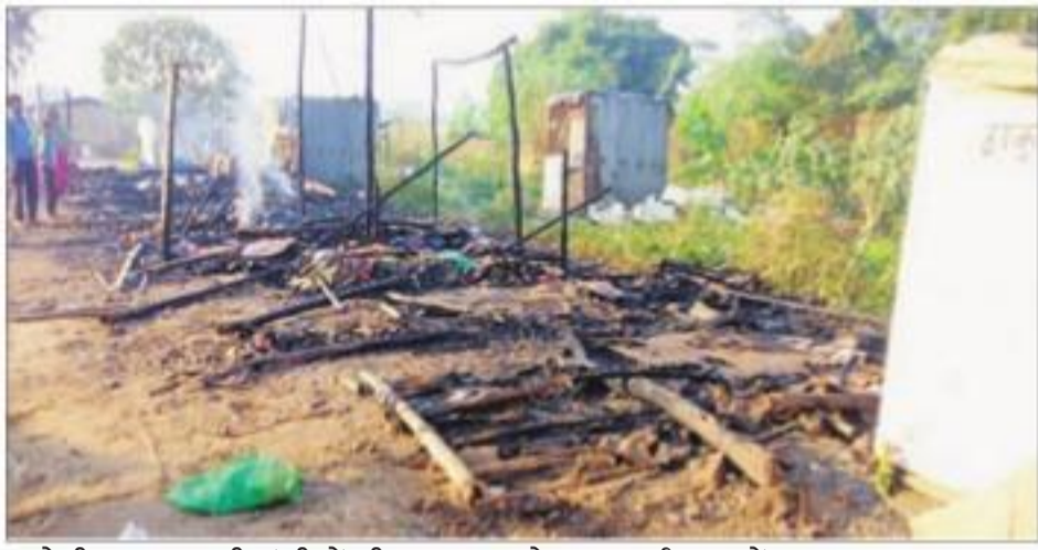
बरोटीवाला सब्जी मंडी में भीषण आग से राख हुई दुकानें। -निस

औद्योगिक क्षेत्र बरोटीवाला में दिवाली की रात करीब 12 बजे अचानक आग लगने से सब्जी की आठ दुकानें जल गईं। एक के बाद एक दुकानों ने आग पकड़ी और महज 30 मिनट में सभी दुकानें राख के ढेर में बदल गईं। आग लगने की सूचना दुकान में सो रहे कारोबारियों और मजदूरों ने अग्निशमन विभाग को दी और करीब 15 मिनट में अग्निशमन की गाड़ी मौके पर पहुंची और आग पर काबू पा लिया गया। तब तक आठ दुकानें पूरी तरह से नष्ट हो गईं, जिससे लाखों रुपये का नुकसान हुआ।