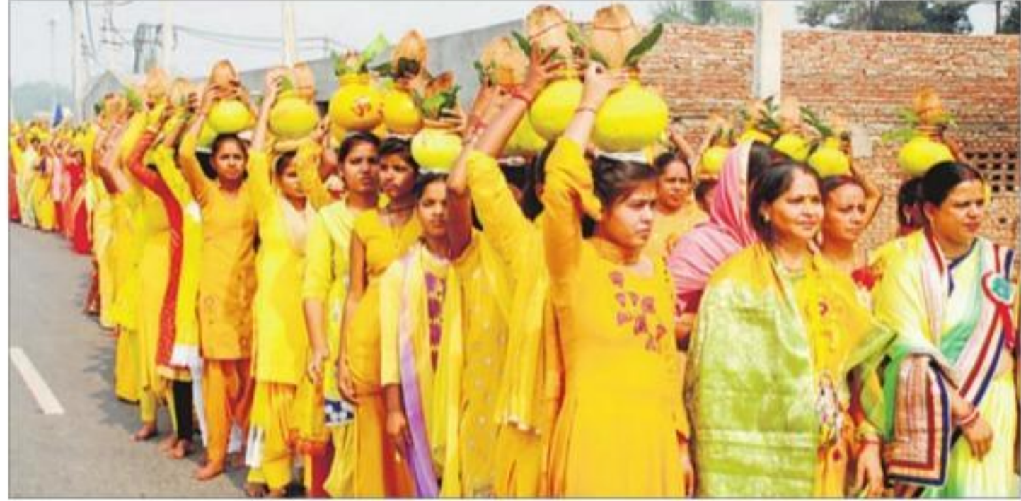
करनाल में सोमवार को महाछठ पर्व महोत्सव का आगाज करती कलश यात्रा निकालती महिलाएं। -रूप