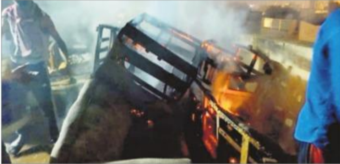
अंबाला में दिवाली की रात फैक्टरी की छत पर लगी आग में जलता निमाणाधीन फर्नीचर। -ए

अंबाला शहर (हप) : दीपावली की रात शहर के नदी मोहल्ला स्थित एक फर्नीचर फैक्टरी में आसामान की ओस से गिरी पटाखे की चिंगारी से आग लग गई किंतु बड़ा हादसा बनने से पहले ही स्थानीय लोगों ने उस पर काबू पा लिया। चिंगारी विजय फर्नीचर फैक्टरी की तीसरी मंजिल पर गिरी और निर्माणाधीन सोफों में आग लग गई। जानकारी दमकल विभाग को दी गई और मोहल्ले के लोगों ने मिलकर आग पर काबू पा लिया। इस दौरान करीब आधा दर्जन निमाणाधीन सोफे जलकर क्षतिग्रस्त हो गए। आधी रात के बाद तक पटाखे चलाने की अवाजें सुनाई देती रहीं। रात्रि 10 बजे के बाद पुलिस की सायरन बजाकर वाहनों ने लोगों को पटाखा चलाने की अवधि समाप्त होने की सूचना भी दी लेकिन उसका आस्था पर कोई प्रभाव नहीं पड़ा।