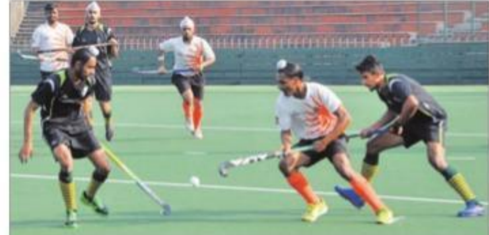
चंडीगढ़ में सोमवार को सेक्टर-42 के स्टेडियम में 48वें वीएन वोहरा ऑल इंडिया गुरुमीत मेमोरियल हाकी टूर्नामेंट में मिडले एसजीजीएस-26 व रोपड़ हॉक्स के खिलाड़ी।