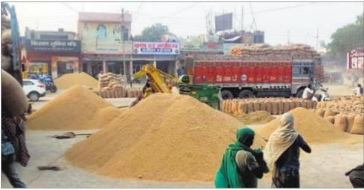
अम्बाला शहर अनाज मंडी में खरीद बंद होने के बाद लगे धान की बोरियों के ढेर। -हप

30.50 लाख क्विंटल की हो चुकी है खरीद शहर की अनाज मंडी में इन दिनों धान की आवक अपने पीक पर पहुंच चुकी है, लेकिन लिपिटिंग व्यवस्था चरमरा चुकी है। फिलहाल इस मंडी में 15 लाख बोरी से ज्यादा धान लिपिटिंग की इंतजार में है। अभी तक शहर मंडी में 30.50 लाख क्विंटल से ज्यादा धान की सरकारी खरीद की जा चुकी है। पिछले