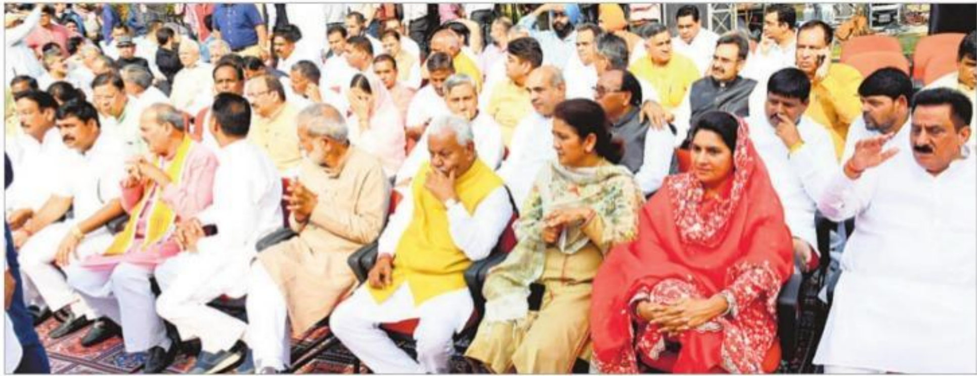
चंडीगढ़ में रविवार को हरियाणा राजभवन में शपथ ग्रहण समारोह के दौरान नवनिर्वाचित विधायक एवं अन्य नेता।

सोमवार को चंडीगढ़ से जारी एक बयान में कुमारी सैलजा ने कहा, जनता से विश्वासघात कर भाजपा और जजपा ने जो सरकार बनाई है, उसके बाद अब कई सवाल उठने लगे हैं। उन्होंने कहा कि भाजपा ने पिछले चुनाव में कई वादे किए थे, जो पिछले पांच वर्ष में पूरे करने में वह विफल रही वहीं इस चुनाव से पहले भी भाजपा ने अनेक