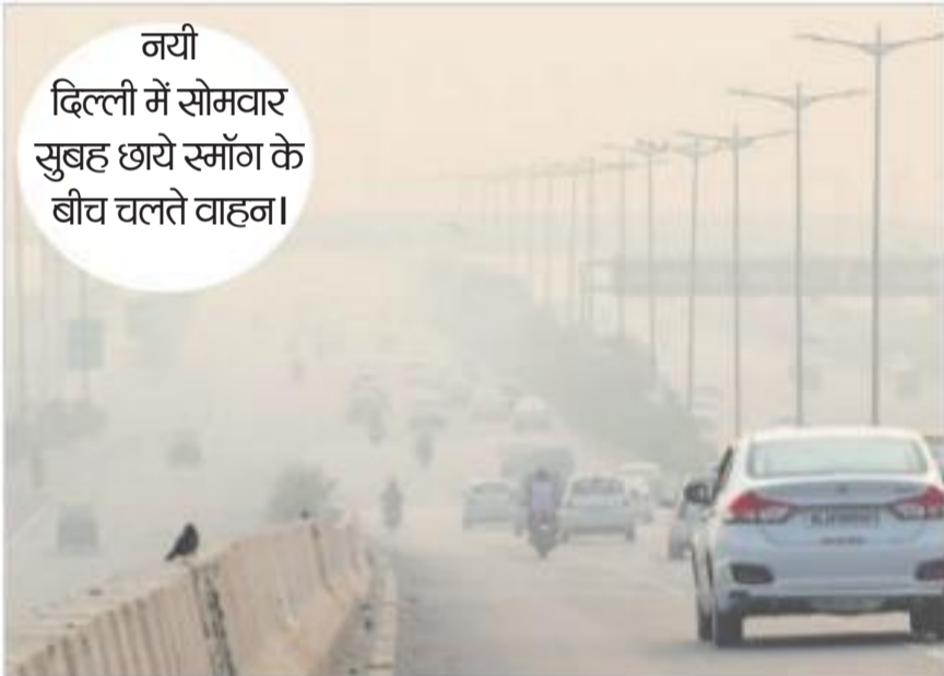
नयी दिल्ली में सोमवार सुबह छाये स्मॉग के बीच चलते वाहन। 460, 668, 413, 477, 483, 553 और 466 दर्ज किया गया। हालांकि, केन्द्रीय प्रदूषण नियंत्रण बोर्ड (सीपीसीबी) के आँकड़े के अनुसार, सोमवार सुबह 11.30 बजे हवा का गुणवत्ता सूचकांक 348 रहा। यह रविवार को शाम चार बजे 337 था। सफर का कहना है कि हवा की गति में वृद्धि प्रदूषक तत्वों को छिराने में मदद करेगी और प्रदूषण के स्तर में शाम तक कमी आने की उम्मीद है।

दिवाली के बाद सोमवार सुबह धुंध छा जाने से राष्ट्रीय राजधानी दिल्ली में हवा की गुणवत्ता 'गंभीर' श्रेणी में पहुंच गई। वैसे तो हर साल दिवाली की अगली सुबह दिल्ली में प्रदूषण का स्तर अति गंभीर श्रेणी में पहुंच जाता था, लेकिन इस बार हवा की गुणवत्ता पिछले तीन साल से बेहतर रही। प्रदूषण कम करने के लिए सुप्रीमकोर्ट द्वारा पटाखे फोड़ने के लिए तय की गई दो घंटे की समय-सीमा के बाहर भी महानगर के कई हिस्सों में लोग पटाखे जलाते रहे। शीर्ष अदालत ने केवल हरित पटाखे जलाने का आदेश दिया था, इसके बावजूद लोगों ने पुराने पारंपरिक प्रदूषण फैलाने वाले पटाखे जलाए। अरविंद केजरीवाल के नेतृत्व वाली दिल्ली सरकार लोगों को पटाखे जलाने से रोकने के प्रयास में एक मेगा लेजर शो का आयोजन कर रही है। पृथ्वी विज्ञान मंत्रालय की वायु गुणवत्ता निगरानी सेवा, 'वायु गुणवत्ता और मौसम पूर्वानुमान एवं अनुसंधान प्रणाली' (सफर) के मूल्यांकित दिल्ली का समग्र वायु गुणवत्ता सूचकांक (एक्यूआई) सोमवार सुबह 11.30 बजे 463 पर पहुंच गया। पूसा, लोधी रोड, हवाई अड्डा टर्मिनल टी3, नोएडा, मथुरा रोड, आयानगर, आईआईटी दिल्ली, धीरपुर, और चांदनी चौक में एक्यूआई क्रमशः 480, 436,