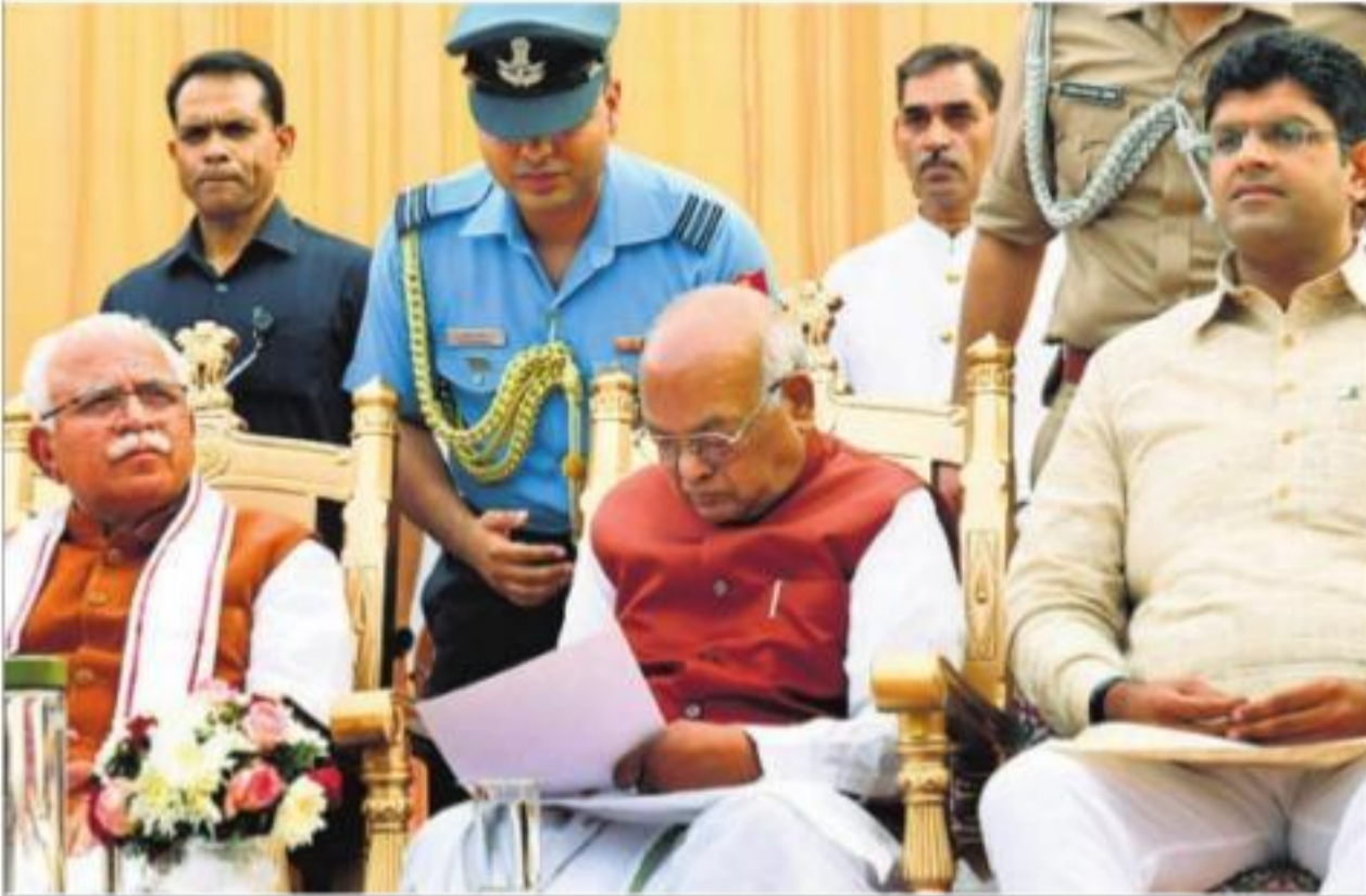
चंडीगढ़ में रविवार को हरियाणा राजभवन में शपथ ग्रहण करने के बाद मुख्यमंत्री मनोहर लाल एवं उपमुख्यमंत्री दुष्यंत चौटाला, राज्यपाल सत्यदेव नारायण आर्य के साथ।