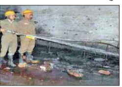
■ दो पुलिसकर्मी घायल, लाखों का माल जलकर खाक

■ दिल्ली का एक्यूआई सोमवार सुबह साढ़े 11 बजे 463 पर पहुंच गया