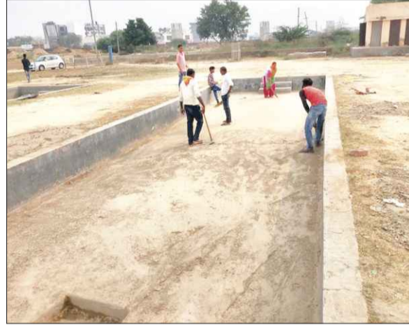
गुरुग्राम। सोमवार को न्यू पालम विहार में छठ पूजा के लिए घाट की सफाई करते श्रद्धालु।