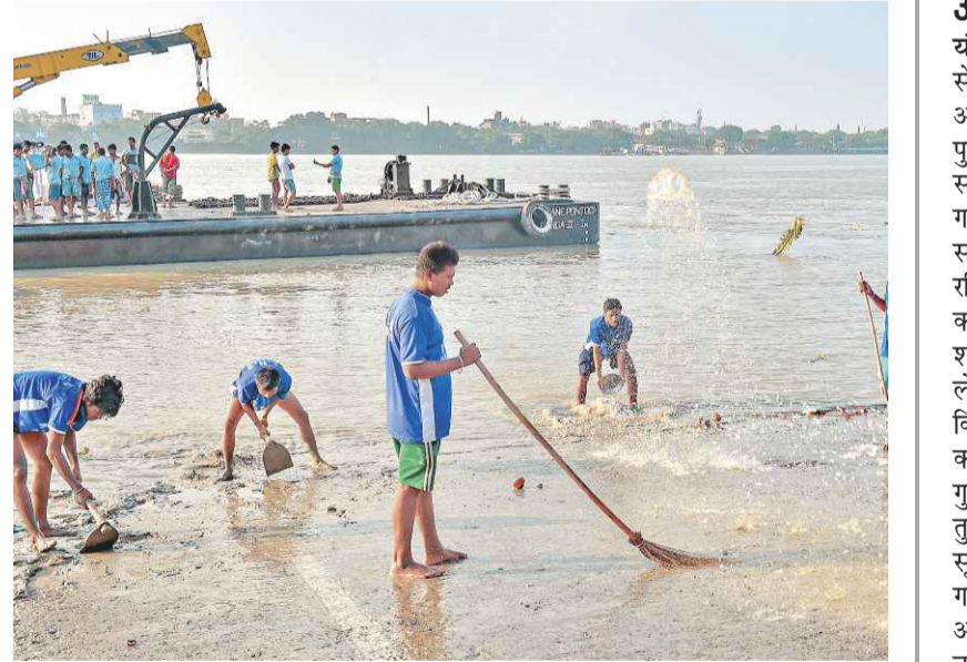
कोलकाता में सोमवार को देवी काली की मूर्तियों के विसर्जन के दौरान प्रदूषण को रोकने के लिए गंगा नदी के घाट की सफाई करते नगर निगम के कर्मचारी।