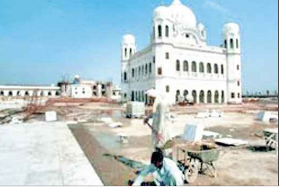
श्रद्धालु पाकिस्तान स्थित करतारपुर जाएंगे। सिखों के धर्म गुरु गुरु नानकदेव ने अपनी जिंदगी के आखिरी 17 साल 5 महीने 9 दिन

लाहौर। पाकिस्तान ने करतारपुर आने वाले श्रद्धालुओं के लिए 80 इमीग्रेशन काउंटर स्थापित किए हैं। इन काउंटरों पर भारत से पाकिस्तान आने वाले श्रद्धालुओं को क्लीयरेंस मिला करेगा। भारत और पाकिस्तान ने पिछले सप्ताह करतारपुर कॉरिडोर पर समझौते पर हस्ताक्षर किए हैं। इस समझौते के तहत भारतीय तीर्थयात्रियों को पाकिस्तान में गुरुद्वारा दरबार साहिब में वीजा मुक्त यात्रा करने की अनुमति देगा। करतारपुर कॉरिडोर का उद्घाटन 9 नवंबर को होगा। शुरूआत में यहां से बड़ी संख्या में