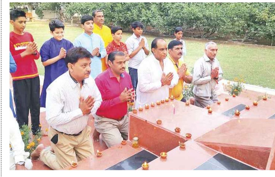
गुरुग्राम। एक दीया शहीदों के नाम जलाकर श्रद्धांजलि अर्पित करते फाउंडेशन के पदाधिकारी