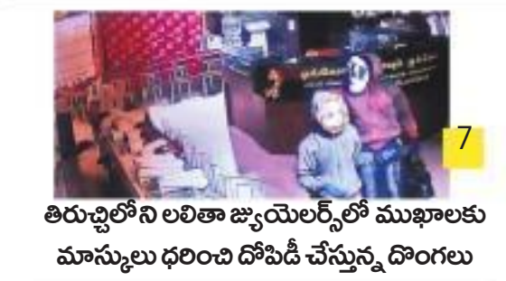
తిరుప్పిలోని లలితా జ్యూయెలరీలో ముఖాలకు మాస్కులు ధరించి డోపిడీ చేస్తున్న డొంగలు

పూజ్య బాపూజీ 150వ జయంతి ఉత్సవాలు బుధవారం దేశవ్యాప్తంగా మనంగా జరిగాయి. జాతీయత సేవలను, బోధనలను మనసా ప్రజలు స్మరించుతున్నారు. ఈ సందర్భంగా రాజ్ గాంధీ జూనియర్ కళాశాలలో, ప్రధాని మోదీ, ఇతర ప్రముఖులు నివాళులర్పించారు.