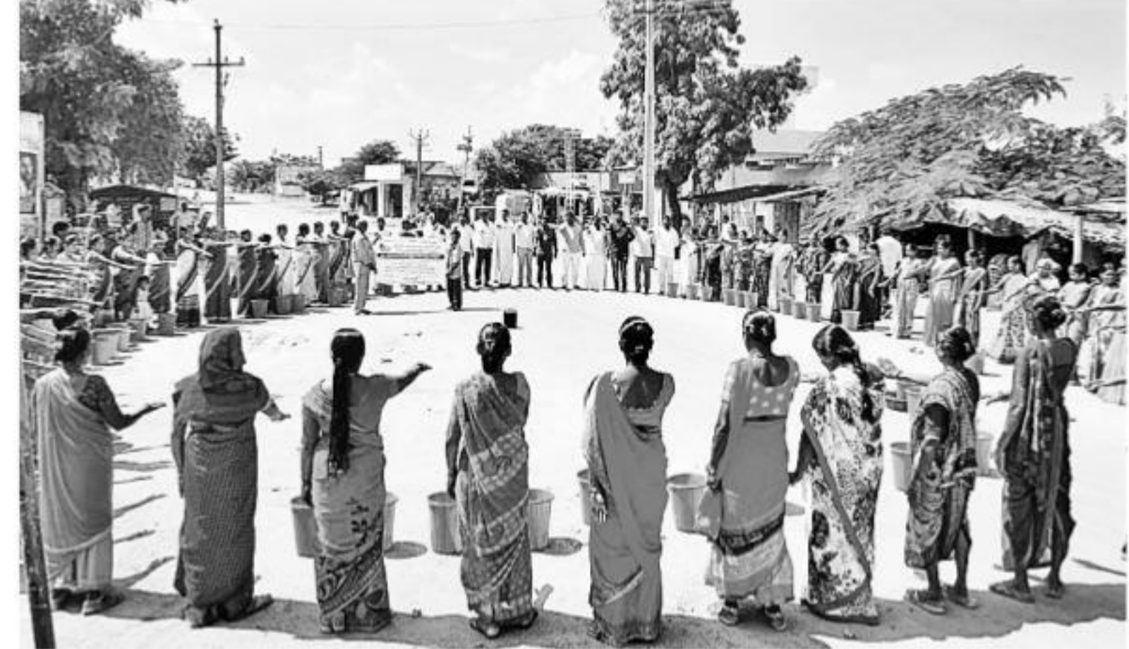
బుధవారం జిల్లావ్యాప్తంగా మండలం మొగిలపేటలో చెత్త రావడం తగ్గించడానికి ప్రతిష్టాపనులు గ్రామస్థులు