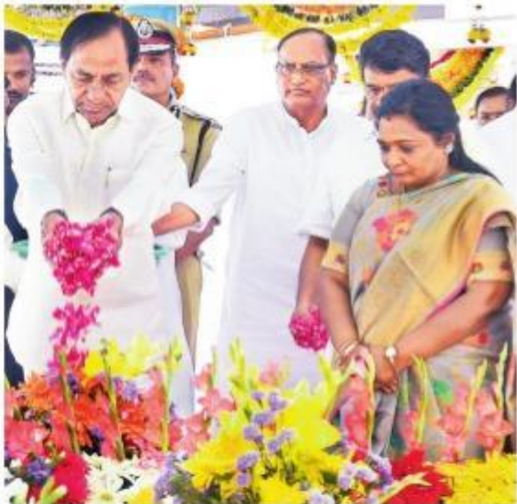
బుధవారం లంగర్ హాస్టల్ లోని బాపూగారి బాపూజీ పుష్పాంజలి ఘోషణ, గవర్నర్ డాక్టర్ తమిళ సోమయాజి, ముఖ్యమంత్రి కే చంద్రశేఖర్ రావు, శాసనమండలి చైర్మన్ గుత్తా సుఖందేరి రెడ్డి, మంత్రి తలసాని శ్రీనివాస్ యాదవ్