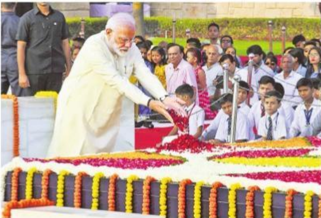
బుధవారం ఢిల్లీలోని రాజ్ గాంధీ జూనియర్ కళాశాలలో గాంధీజీ సమాధిపద్ధతిని వాడుతున్న ప్రధాని నరేంద్ర మోదీ