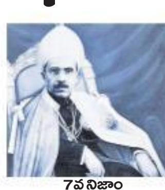
7వ నిజాం మీర్ ఉస్మాన్ అలీఖాన్