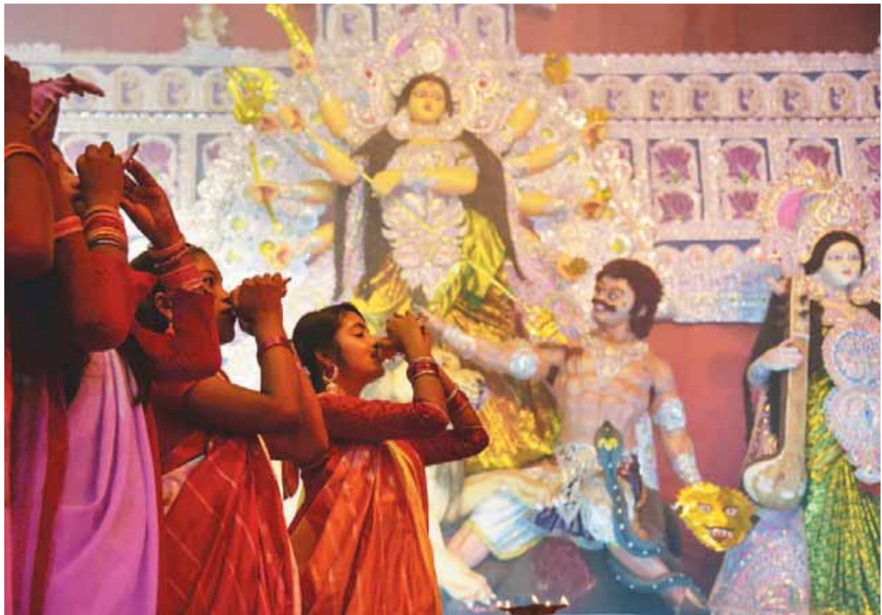
गुवाहाटी में दुर्गा पूजा में महापुष्टी के अवसर पर झांकी में पूजा करते हुए श्रद्धालु

अंतरराष्ट्रीय होने के बीच इस दृष्टि से कोई तनाव नहीं देखते हैं कि विश्व के साथ अधिक संपर्क बढ़ाया जाए...लिहाजा राष्ट्रीयता हमारे के लिए कोई नकारात्मक भावना नहीं है। भारत और अमेरिका के बीच व्यापार समझौते की संभावना के बारे में पूछे जाने पर उन्होंने कहा कि यह इतना आसान नहीं है क्योंकि यह काफी जटिल मामला है। इसलिए यदि इसमें समय लग रहा है तो ठीक है। दक्षिण एशिया सहयोग के बारे में बात करते हुए जयशंकर ने कहा, भारतीय उपमहाद्वीप में क्षेत्रीय आर्थिक सहयोग सबसे कम है और प्रधानमंत्री नरेंद्र मोदी चाहते हैं कि इस दिशा में प्रगति हो और उन्हें लगता है कि हमें इस बारे में कुछ करने की जरूरत है। भारत इसके लिए माहौल बना रहा है। आपने देखा होगा जब राजनीतिक रूप से उन्होंने 2014 में अपने शपथ ग्रहण समारोह में पड़ोसी देशों को आमंत्रित किया था।