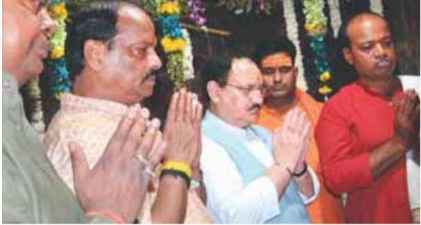
राजगढ़ जिले के रजपारा नदिर में शुक्रवार को पूजा-अर्चना करते हुए भाजपा अध्यक्ष जेपी नड्डा और झारखंड के मुख्यमंत्री रघुबर दास

भाजपा के कार्यकारी अध्यक्ष जे पी नड्डा ने शुक्रवार को कहा कि हाल में ह्यूस्टन में प्रधानमंत्री नरेन्द्र मोदी के एक कार्यक्रम में अमेरिकी राष्ट्रपति डोनाल्ड ट्रंप के शामिल होने से यह स्पष्ट हो गया है कि वह (मोदी) दुनिया के सबसे ताकतवर नेताओं में से एक हैं। नड्डा ने कहा कि प्रधानमंत्री मोदी की जबर्दस्त नेतृत्व क्षमता का लोहा अब पूरी दुनिया मानती है और पिछले पांच वर्षों में वह दुनिया के सबसे ताकतवर नेताओं में शुमार हो गए हैं। उन्होंने पार्टी कार्यकर्ताओं के साथ बैठक में कहा कि मोदी सरकार ने किसानों की जरूरतों को पूरा करने में मदद की है, स्वास्थ्य क्षेत्र में और आवाजाही संपर्क बढ़ाने के लिए कदम उठाए गए हैं। नड्डा ने कार्यकर्ताओं को संबोधित करते हुए कहा कि भारत के प्रधानमंत्री की सभा में अमेरिकी राष्ट्रपति डोनाल्ड ट्रंप ने ना सिर्फ शिरकत की, बल्कि वहां उपस्थित भारतीय समुदाय को संबोधित भी किया। उन्होंने कहा, जब प्रधानमंत्री नरेन्द्र मोदी की ह्यूस्टन की सभा में दुनिया के सबसे शक्तिशाली देश