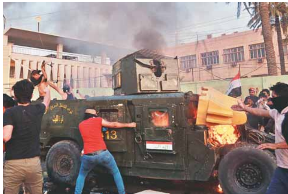
सरकार विरोधी प्रदर्शनकारियों ने बगदाद में बुधवार को विरोध प्रदर्शन के दौरान सशस्त्र पुलिस रेडियटिंग फ्लैग्स फॉरवर्ड से संबंधित एक बखतरबंद बहाना जला दिया।