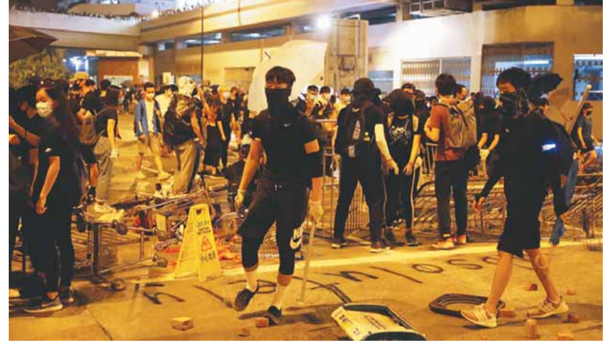
हांगकांग में प्रदर्शन कर रहे लोगों ने एक सड़क को पूरी तरह बंद कर दिया

ट्रंप ने आरोप लगाया कि बाइडेन ने 2014 में उपराष्ट्रपति के तौर पर अपने बेटे हंटर के कारोबारी साझेदार यूक्रेनी गैस कंपनी से जुड़ी भ्रष्टाचार की जांच करने से यूक्रेन को रोका था और इसके लिए अमेरिका से मिलने वाली वित्तीय सहायता का लाभ उठाया था। हालांकि यूक्रेन के रिकॉर्ड दिखाते हैं कि ऐसी किसी जांच को बाधित नहीं किया गया था। वहीं चीन में मीडिया में आई कई खबरों में दावा किया गया था कि हंटन बाइडेन के एक कारोबारी सहयोगी ने निवेश लाइसेंस हासिल किया था जिसमें बाइडेन का नाम नहीं था और इससे लाखों डॉलर कमाए गए।