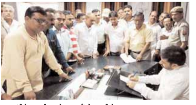
मुख्यमंत्री के नाम डीएम को ज्ञापन सौंपते व्यापारी नेता

ललितपुर। जिला उद्योग व्यापार मंडल ने बिजली की बढ़ी हुई दरों के विरोध में मुख्यमंत्री को नाम संबोधित एक ज्ञापन जिलाधिकारी को दिया। विधानसभा चुनाव 2017 में भाजपा सरकार बनने व निकाय चुनाव के तुरन्त बाद बिजली की दरों में लगभग 12, 73 फीसदी बिजली की बढ़ोतरी की गई थी अभी लगभग ढाई साल होने को है की लोकसभा चुनाव के केन्द्र में भाजपा सरकार बनने के पश्चात बिजली की भारी भरकम दरों में बढ़ोतरी की गई। 12 सितंबर 2019 से नई दरों से बिजली बिल बनाने का आदेश पारित कर दिया गया है। इसका सीधा असर आमजन विशेषकर मध्यम वर्ग के लोगों पर डाका डालना जैसा प्रतीत हो रहा है। बिजली की दरें इस तरह बढ़ाई गई हैं कि घरेलू उपभोक्ताओं के लिए लगभग 12 प्रतिशत, औद्योगिक संस्थान 10 प्रतिशत अन्यमीटर्स ग्रामीण उपभोक्ताओं पर 25 प्रतिशत की बढ़ोतरी की गई है। घरेलू उपभोक्ताओं पर हर सिलेब में बिजली की दरें बढ़ाई गई हैं। शहरों में फिक्स