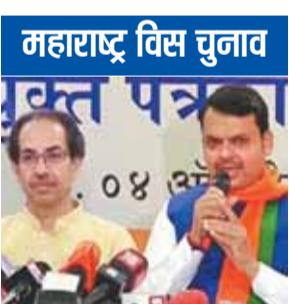
मुंबई में संयुक्त संवाददाता सम्मेलन में शिवसेना प्रमुख उद्भव ठाकरे और मुख्यमंत्री देवेंद्र फडणवीस

महाराष्ट्र के मुख्यमंत्री देवेंद्र फडणवीस ने शुक्रवार को कहा कि मतभेदों के बावजूद हिन्दुत्व शिवसेना और भाजपा को जोड़े रखने वाली समान डोर है और 21 अक्टूबर को होगे वाले मतदान के बाद महाराष्ट्र में हम अपनी सला कायम रखेंगे। महाराष्ट्र में विधानसभा चुनाव के लिए नामांकन प्रक्रिया खत्म होने के