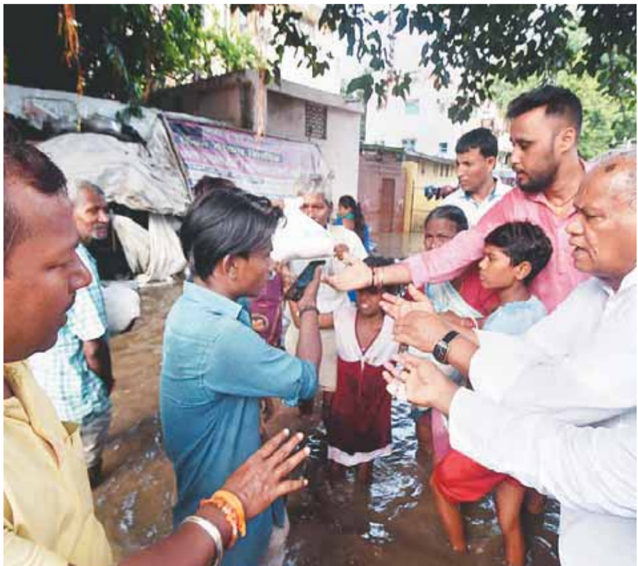
पटना में पूर्व मुख्यमंत्री व हन पार्टी के अध्यक्ष जीतनाराय मांडी बाढ़ पीड़ितों को खाद व सामग्री वितरित करते हुए

हिस्सेदारी बेचने पर सहमति व्यक्त करने के एक सप्ताह के भीतर ही प्रक्रिया में यह बदलाव किया गया है। रणनीतिक बिजली प्रक्रिया में किसी उपक्रम में हिस्सेदारी खरीदने के लिए रूचि व्यक्त की जा सकती है और दूसरे तथा अंतिम चरण में उपक्रम के लिए वित्तीय बोली लगाई जा सकती है। रणनीतिक बिजली के लिए पेश किए जाने वाले उपक्रम के बारे में तमाम जानकारी रखी जाएगी। अधिकारी ने कहा कि इसके पीछे सोच यह है कि प्रक्रिया चार से पांच माह में पूरी कर ली जाए। सरकार ने चालू वित्त वर्ष के दौरान विनिवेश के जरिए 1.05 लाख करोड़ रुपए जुटाने का लक्ष्य रखा है। सरकार के उद्योग जगत को करों में कटौती के रूप में 1.45 लाख करोड़ रुपए का प्रोत्साहन पैकेज देने के बाद विनिवेश लक्ष्य को हासिल करना और भी अहम हो जाता है।