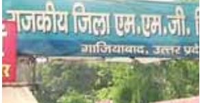
जिला एमएमजी अस्पताल परिसर में बनी संक्रामक रोग विभाग की लैब अब प्रदेश की मॉडल लैब बनने जा रही है। इस लैब में सभी संक्रामक रोगों की जांच होगी।

जिला एमएमजी अस्पताल परिसर में बनी संक्रामक रोग विभाग की लैब अब प्रदेश की मॉडल लैब बनने जा रही है। इस लैब में सभी संक्रामक रोगों की जांच होगी। इसके लिए केंद्र सरकार की टीम ने निरीक्षण के बाद लैब को अपग्रेड करने की संस्तुति की है। लैब के अपग्रेड होने से जनपदवासियों को प्राइवेट लैब पर महंगी जांच करवाने से निजात मिल सकेगी। जनपदवासियों को संक्रामक रोगों जैसे हैपेटाइटिस बीए सीए डीए स्कब टाइफसए डिप्थीरिया समेत सभी रोगों