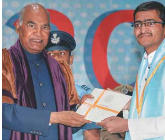
पहले इंजीनियरिंग कॉलेज में उन्होंने कहा, हमें नवाचार और रचनात्मकता को बढ़ावा देना चाहिए। मुझे यह जानकर खुशी है कि आईआईटी रुड़की ऐसा कर रहा है। यहां टीआईडीईएस बिजनेस इंक््यूबेटर उपरती प्रौद्योगिकियों पर काम करने वाली स्टार्ट-अप

उन्होंने कहा, आईआईटी रुड़की जैसे संस्थान केवल शिक्षा के केंद्र नहीं हैं। ए नवाचार और रचनात्मक विचारों के केंद्र भी हैं...और यह अनुसंधान, नवाचार और रचनात्मक विचार हैं, जो हमें अपने राष्ट्रीय लक्ष्यों को प्राप्त करने में मदद करेंगे और साथ ही मानवता के समक्ष मौजूद बड़ी चुनौतियों को दूर करेंगे। ब्रिटिश शासन के दौरान स्थापित