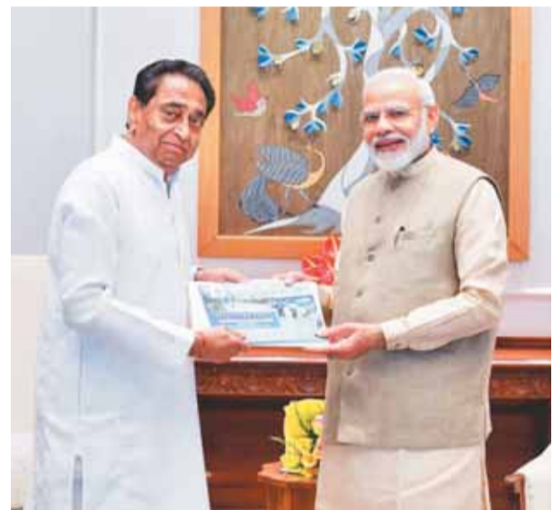
के लिए फौज वित्तीय मदद की मांग से 11,906 करोड़ रुपये का की थी। अधिकारियों ने केंद्रीय टीम औपचारिक अनुरोध किया था।

राज्य सरकार के अधिकारियों ने पिछले महीने प्रदेश के दौरे पर गई एक केंद्रीय टीम को यह जानकारी दी थी और रहत एवं पुनर्वास कार्य