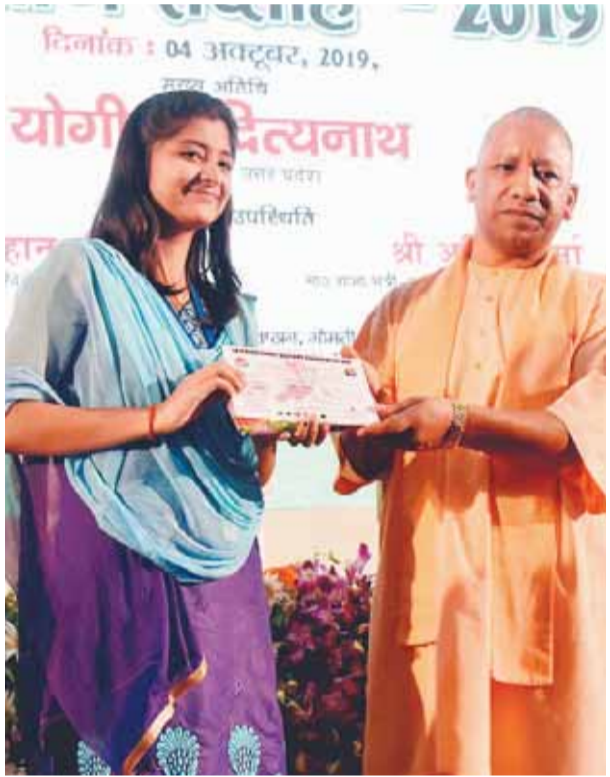
नियमों से छेड़छाड़ के दुष्परिणाम, जलवायु परिवर्तन आदि के रूप में सामने आ रहे हैं। सभी प्राणी सृष्टि के हिस्से हैं। कोई किसी को अनावश्यक रूप से नुकसान नहीं पहुंचाता। समय के साथ प्रकृति के अतिदोहन से जंगल समाप्त हुए, नदियों का स्वाभाविक प्रवाह बाधित हुआ,