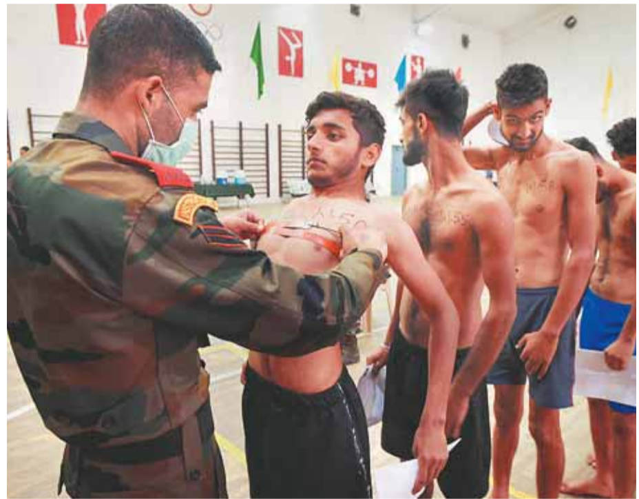
श्रीनगर में सेना की बर्ती दैली के दौरान आये सुबुको की शारीरिक जांच करते सेना के अधिकारी