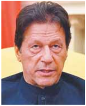
क्षेत्रीय हालात, खासकर अफगानिस्तान में शांति प्रक्रिया के

पाकिस्तान के प्रधानमंत्री इमरान खान ने अफगानिस्तान में रुकी पड़ी शांति प्रक्रिया को फिर शुरू करने पर चर्चा के लिए आए उच्च स्तरीय अफगान तालिबान प्रतिनिधिमंडल से मुलाकात नहीं की। प्रधानमंत्री की एक शीर्ष सहयोगी ने शुक्रवार को इस बारे में बताया। उन्होंने स्थानीय और अंतरराष्ट्रीय मीडिया में आई बैठक संबंधी खबरों को खारिज करते हुए कहा कि यह सही नहीं है।