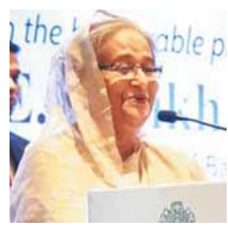
नई दिल्ली में भारत-बांग्लादेश बिजनेस फोरम को संबोधित करती बांग्लादेश की प्रधानमंत्री शेख हसीना।

ऐसा लगता है कि भारत में प्याज के निर्यात पर प्रतिबंध का असर पड़ोसी बांग्लादेश की प्रधानमंत्री शेख हसीना के रसोई घर पर भी पड़ा है क्योंकि उन्होंने हल्के अंदाज में कहा है कि ऐसे निर्णय करने से पहले इसकी जानकारी देना चाहिए। बांग्लादेश की प्रधानमंत्री ने कहा कि प्याज निर्यात पर भारत की ओर से अचानक प्रतिबंध लगा दिए जाने से उनके देशवासियों को थोड़ी दिक्कत हुई है। उन्होंने हल्के अंदाज में कहा, मुझे नहीं पता कि आपने प्याज (निर्यात) को क्यों रोक दिया है। तो क्या हुआ, मैंने ऐसा किया कि... मैंने अपने रसोईए को कहा है कि खाने में प्याज का इस्तेमाल मत करो... ऐसे फैसलों के बारे में पूछ सूचना से मदद मिलेगी। अचानक आपने इसे रोक दिया और इससे हमारे लिए कठिनाई पैदा हो गई है। भविष्य में, अगर आप