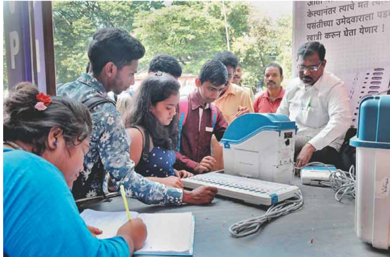
सांगली में विधानसभा चुनाव के लिए निर्वाचन कार्यालय पर ईवीएम और वीवीपैट मशीन को लेकर वोट के प्रति लोगों को जागरूक करते हुए छात्र

गांधीजी के ग्राम स्वराज का सपना तब तक तक पूरा नहीं होगा, जब तक हम अपनी मूलभूत आवश्यकताओं को स्थानीय स्तर पर ही पूरा नहीं करेंगे। अधिकारी पूरी गंभीरता के साथ बजट घोषणाओं को गति प्रदान करें: गहलोत जयपुर। मुख्यमंत्री अशोक गहलोत ने शुक्रवार को अधिकारियों को निर्देश दिया कि जनता की आकांक्षाओं और अपेक्षाओं के अनुरूप बजट घोषणाओं का समय पर क्रियान्वयन सुनिश्चित किया जाए। अधिकारी पूरी गंभीरता के साथ बजट घोषणाओं को गति प्रदान करें। परिवर्तित बजट 2019-20 की घोषणाओं के क्रियान्वयन की समीक्षा बैठक को संबोधित करते हुए मुख्य सचिव को निर्देश दिया कि वे बजट घोषणाओं की प्रगति की अपने स्तर पर नियमित समीक्षा करें। परिवर्तित बजट के जुलाई माह के अंत में पारित होने के कारण घोषणाओं की क्रियान्वयन के लिए समय कम बचा है।