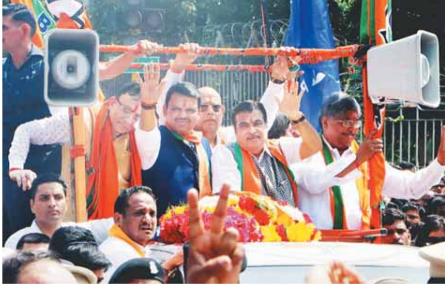
नागपुर में नामांकन करने जाते महाराष्ट्र के मुख्यमंत्री देवेंद्र फड़णवीस

विधानसभा चुनाव के लिए पत्राचार दाखिल करने का आज आखिरी दिन था। राज्य में भाजपा के पहले मुख्यमंत्री फड़णवीस ने दक्षिण-पश्चिम नागपुर निर्वाचन क्षेत्र से पत्राचार भरा है। पत्राचार दाखिल करने के दौरान केंद्रीय मंत्री नितिन गडकरी और प्रदेश भाजपा अध्यक्ष चंद्रकांत पाटील भी उनके साथ मौजूद थे। इस सीट से फड़णवीस के खिलाफ कांग्रेस के आशीष देशमुख चुनाव लड़ रहे हैं। मुख्यमंत्री ने कहा, मैं आश्चर्य हूँ कि आशीषवादी हमारे साथ हैं। मैं रिकार्ड जीत दर्ज करूँगा। वित्त मंत्री एवं भाजपा नेता सुधीर मुंगनतीवार चंद्रपुर जिले के बलारपुर से चुनाव लड़ रहे हैं। आवास मंत्री राधाकृष्ण विवेक पाटील और महाराष्ट्र के पूर्व मंत्री गणेश नाइक क्रमशः शिरडी और एरोली सीटों से पत्राचार भरा। नाइक हाल ही में भाजपा में शामिल हुए हैं। शिवसेना