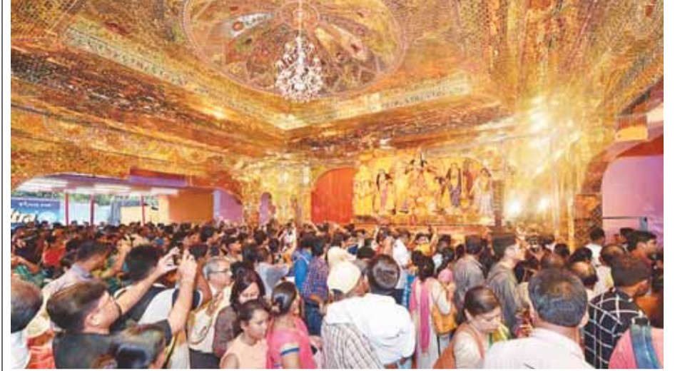
शुक्रवार को कोलकाता में चला रहे दुर्गा पूजा उत्सव के दौरान महा बस्ती पर एक सामुदायिक पंडाल में देवी दुर्गा की पूजा करने के लिए उमड़ी श्रद्धालुओं की भीड़