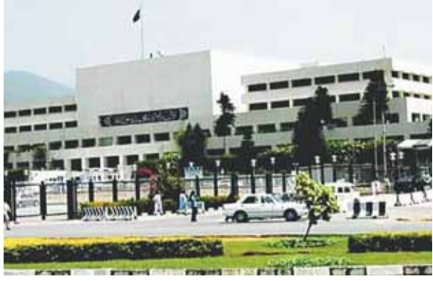
बनने की अनुमति देने का प्रावधान था। पाकिस्तान पीपल्स पार्टी के

पाकिस्तान की संसद ने एक विधेयक को फिलहाल रोक दिया है जिसमें संविधान संशोधन के जरिए गैर मुस्लिमों को प्रधानमंत्री और राष्ट्रपति