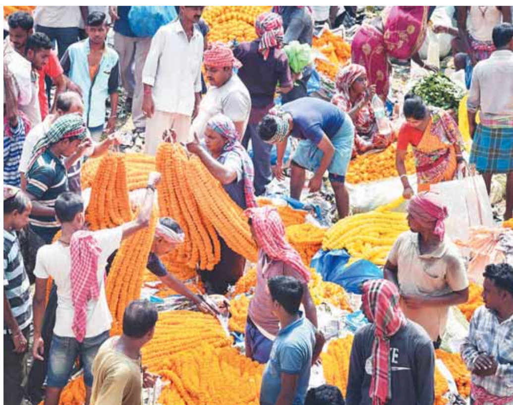
कोलकाता में दुर्गा पूजा उत्सव के लिए एक थोक फूल बाजार में फूल व मालाएं खरीदते लोके