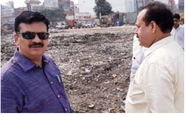
सरकारी जमीन खाली कराते निगम अधिकारी।

● जमीन की बाजार में कीमत करीब सौ करोड़ रुपये है