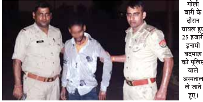
गोली बारी के दौरान घायल हुए 25 हजारों इनामी बुदमाश को पुलिस वाले अस्पताल ले जाते हुए।

जिला पुलिस ने गुरुवार की देर रात में अलग-अलग स्थानों पर हुई मुठभेड़ के बाद दो बदमाशों को गिरफ्तार किया। दोनों तरफ से चली ताबड़तोड़ गोलियों से दो बदमाशों को एक सिपाही घायल हो गए। गिरफ्तार बदमाशों में एक 25 हजार का इनामी भी है।