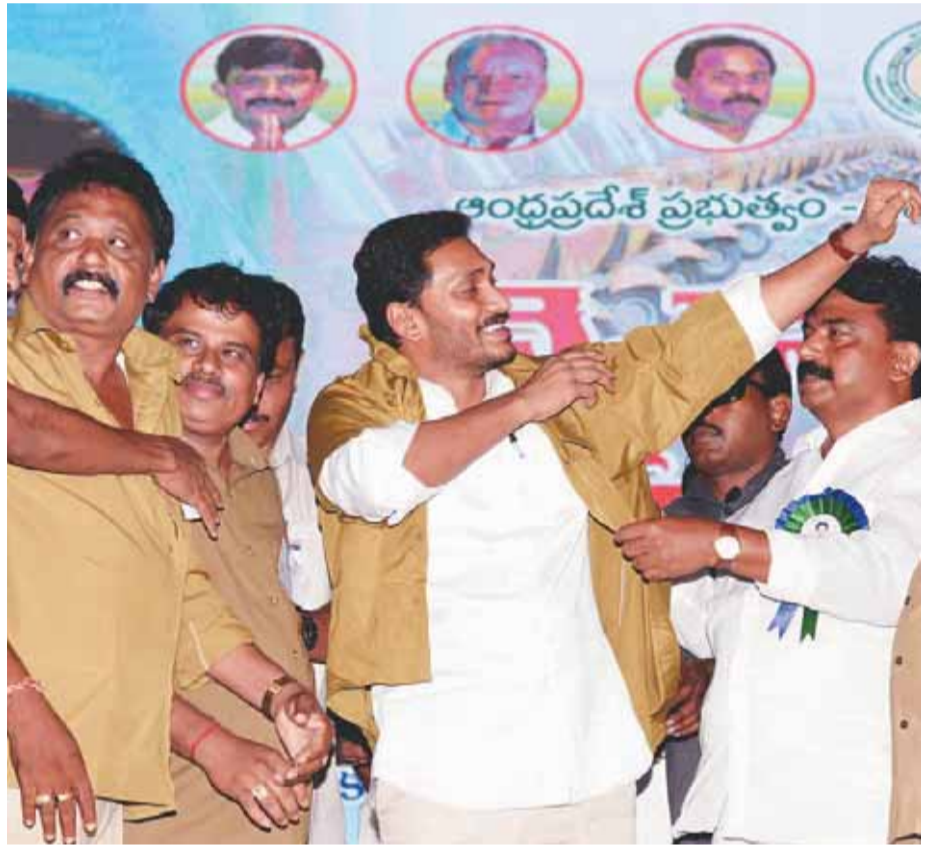
पश्चिम गोदावरी में वाहन मित्र के लांघिन के अवसर पर आंध्र प्रदेश के मुख्यमंत्री जगनमोहन रेड्डी