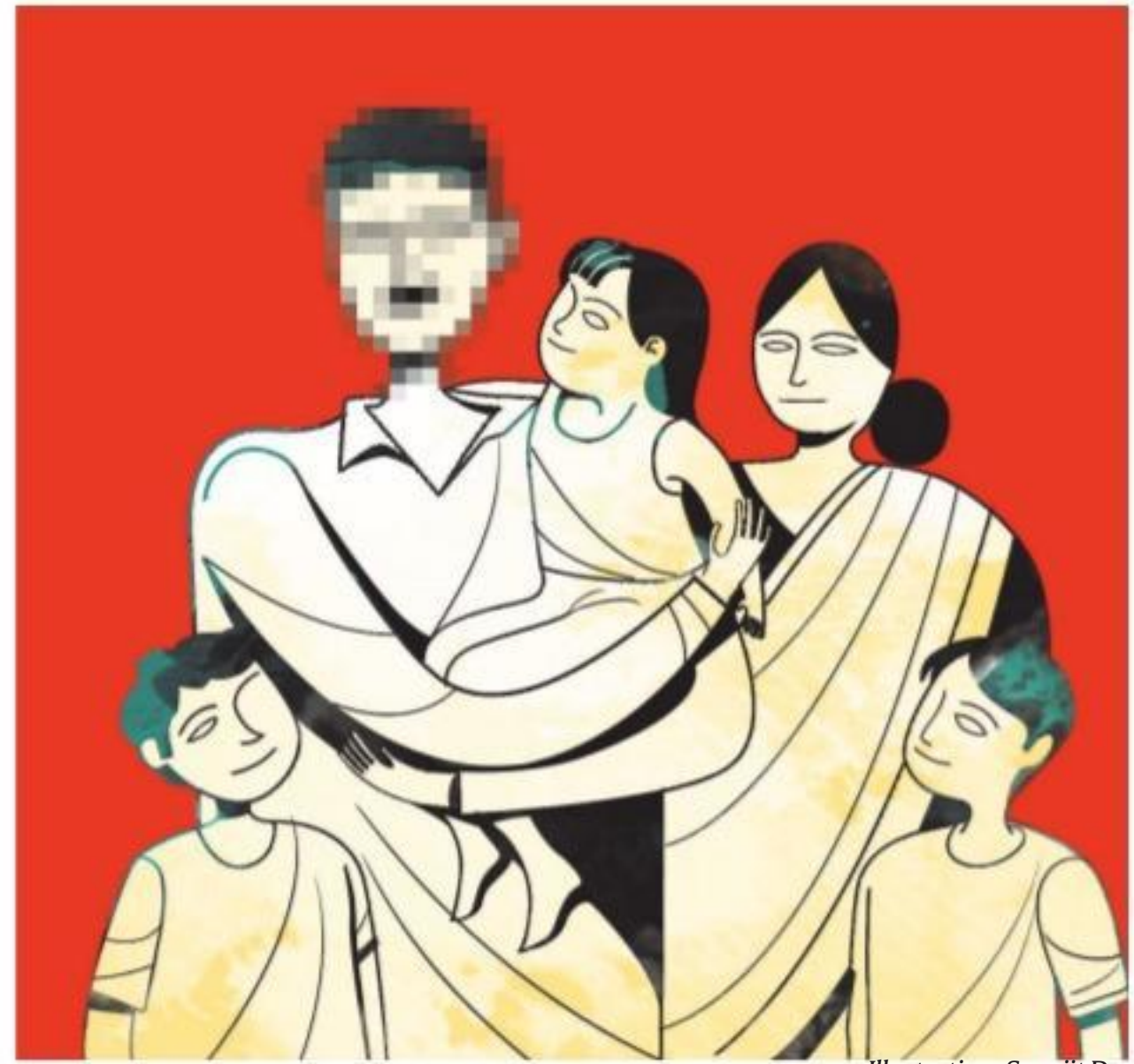
Illustration: Suvajit Dey