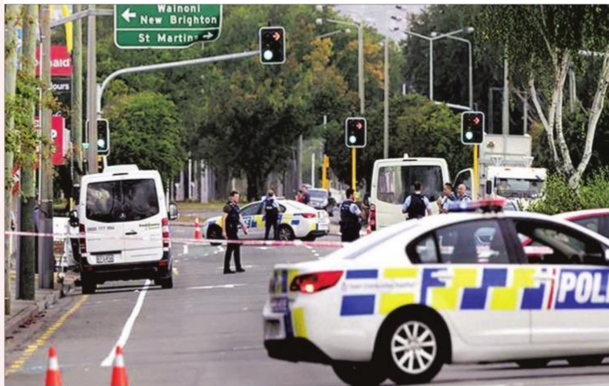
Post Christchurch violence, tech companies have scrambled to ban inflammatory accounts, take down graphic videos, rewrite their terms of service

Speech should be protected, all things being equal. Noxious language online is causing real-world violence. What can we do about it?