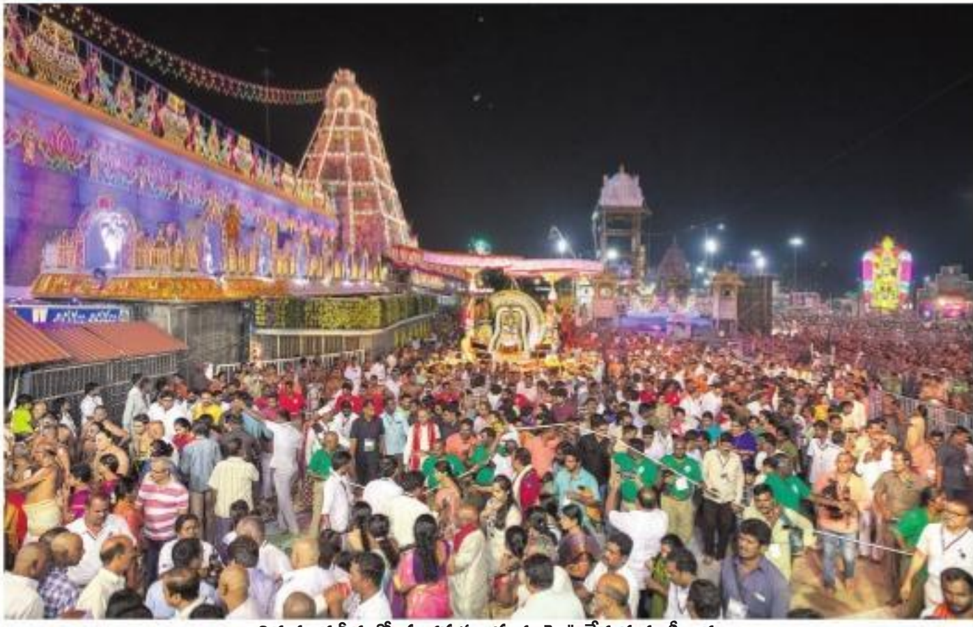
తిరుమల వీధుల్లో చంద్రప్రభ వాహనంపై ఊరేగుతున్న శ్రీవారి