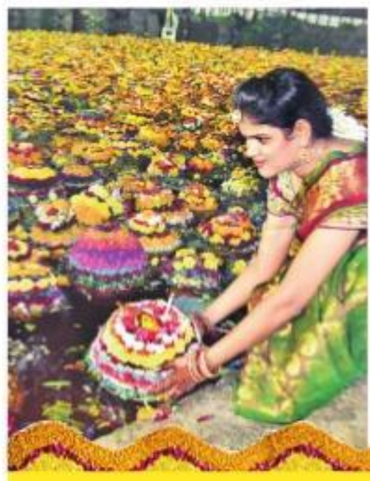
హస్తాంకం వద్దాక్షిణ్యం నుండి బతుకమ్మల నిమజ్జనం