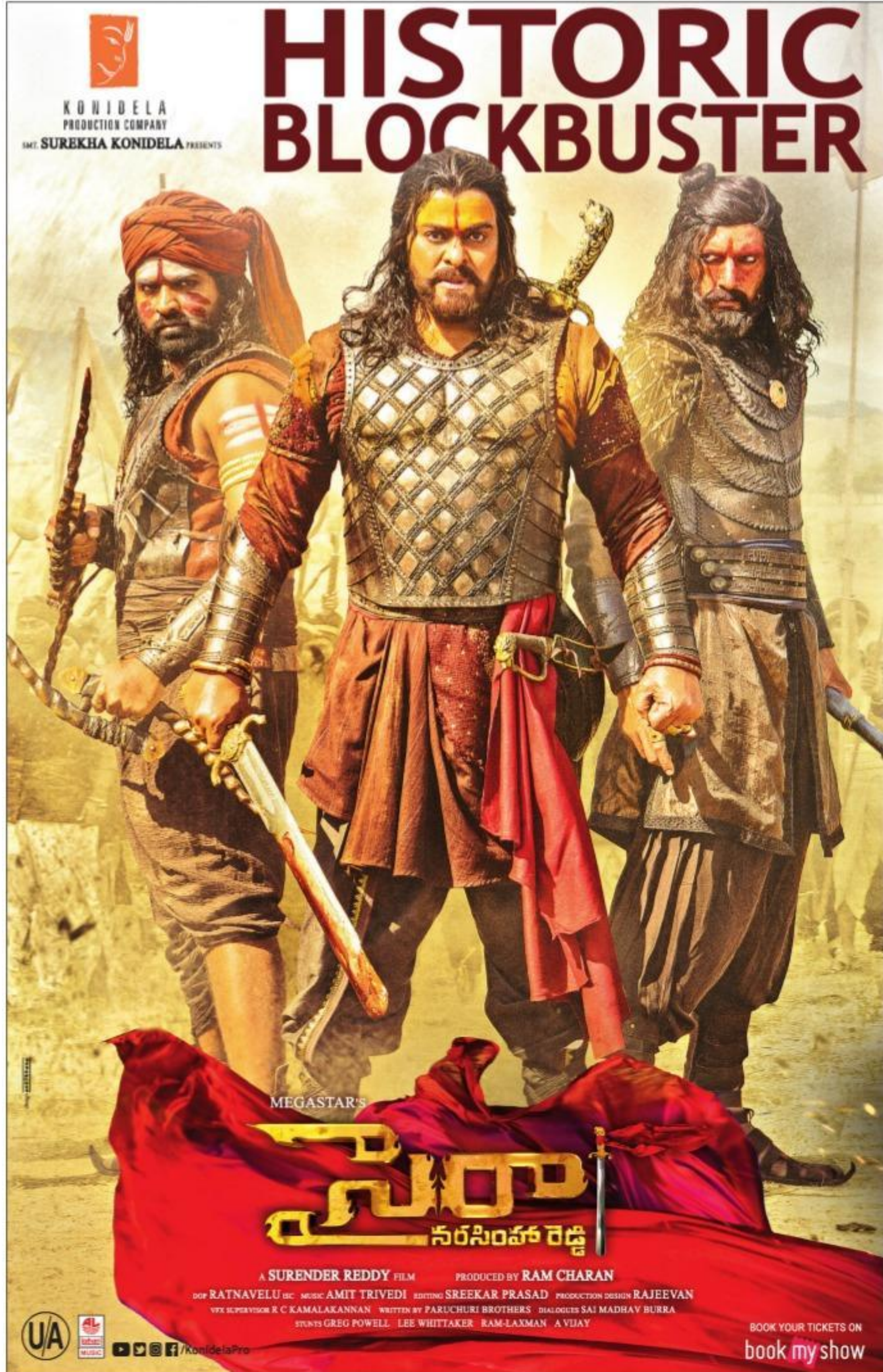
Historic Blockbuster movie poster with production details.

ట్రైగర్ కంపెనీ ప్రొడక్షన్స్ పతాకంపై రామ్ గోపాల్ దర్శన రూపొందిస్తున్న చిత్రం 'బ్యూటీఫుల్'. 'ట్రైబ్యూట్ టు రంగీలా' ఉపశీర్షిక. సూరి, నైనా జంటగా నటిస్తున్నారు. అగస్త్యముఖ దర్శకుడు. టి. అంజయ్య సమర్థుణ్ణు టి.నరేష్ కుమార్, టి. శ్రీధర్ ఈ చిత్రాన్ని నిర్మిస్తున్నారు. నిర్మాతలు మాట్లాడుతూ 'వైవిధ్యభరిత కథ, కథనాలతో రూపొందుతున్న చిత్రమిది. 'రంగీలా' చిత్రానికి వివాళిగా ఉంటుంది. రొమాన్స్, ప్రేమ, భావోద్వేగాల సమాహారంగా అలరిస్తుంది. ఈ నెల 9న ట్రైలర్ విడుదల చేయనున్నాం' అని తెలిపారు. ఈ చిత్రానికి పాటలు: సిరాశ్రీ, సంగీతం: రవిశంకర్, రచన పాటిగ్రేడ్, దర్శకత్వం: అగస్త్యముఖ.