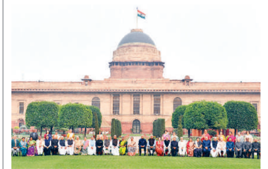
राष्ट्रपति राम नाथ कोविंद राष्ट्रपति भवन में 'राज्यपालों और उपराज्यपालों के 50 वें सम्मेलन' की पूर्व संख्या पर राज्यपालों और उपराज्यपालों के साथ ग्रुप फोटो में।