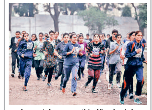
जम्मू में शुक्रवार को सीमा सुरक्षा बल भर्ती में शारीरिक परीक्षण के दौरान दौड़ती हुई महिला उम्मीदवार।