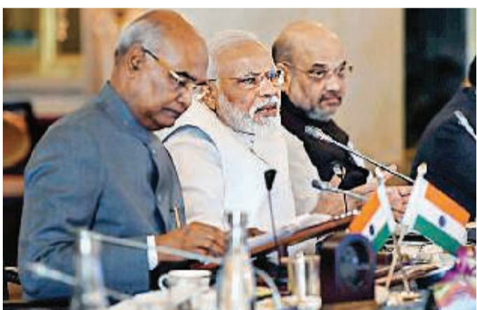
राष्ट्रपति भवन में राज्यपालों एवं उपराज्यपालों के 50 वें सम्मेलन के समापन अवसर पर संबोधित करते प्रधानमंत्री नरेंद्र मोदी। उपराष्ट्रपति रामनाथ कोविंद और गृह मंत्री अमित शाह भी उपस्थित रहे।

प्रधानमंत्री कार्यालय की तरफ से जारी बयान में कहा गया है कि प्रधानमंत्री ने राज्यपालों का छात्रों को जल संरक्षण के लिए प्रोत्साहित करने का आह्वान किया। नई शिक्षा नीति और प्रभावकारी नवाचार के क्षेत्र में भी मोदी ने राज्यपालों की भूमिका का उल्लेख किया। लोगों के जीवन स्तर में सुधार के लिए काम कर रही सरकार : राज्यपालों के सम्मेलन के बाद अनुसूचित जाति और अनुसूचित जनजाति के जुड़े मुद्दों का समाधान कर उनकी आकांक्षाओं को नया आयाम देगा। गरीबी उन्मूलन और बेरोजगारी दूर करना राजद की प्राथमिकता होगी।