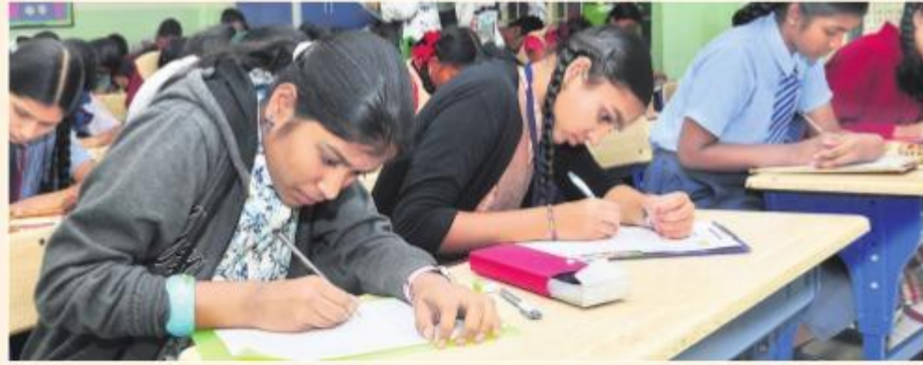
ఒకసారి అడిగిన ప్రశ్న సంఖ్య మరోసారి ఎక్కడా కనిపించదు. కాబట్టి విద్యార్థులు ముందుగా ప్రశ్న సంఖ్యను నమోదుచేసి, తర్వాత దాని సమాధానాన్ని రాస్తే సరిపోతుంది.

ప్రథమభాష తెలుగు పరీక్ష మొత్తం 100 మార్కులకు ఉంటుంది. ఇందులో మొదటి పేపర్ 50 మార్కులు, రెండో పేపర్ 50 మార్కులు. ఈ రెండు పేపర్లలో అవగాహన - ప్రతిస్పందన (16 మార్కులు), వ్యక్తీకరణ - స్వీయరచన (స్వజనాత్మకత) (22 మార్కులు), భాషాంశాలు (12 మార్కులు) అనే మూడు విద్యా ప్రమాణాలు విద్యార్థుల వివిధ సామర్థ్యాలను పరీక్షించేవిగా ఉంటాయి. ఒక్కో పేపర్లో మొత్తం 33 ప్రశ్నలుంటాయి.