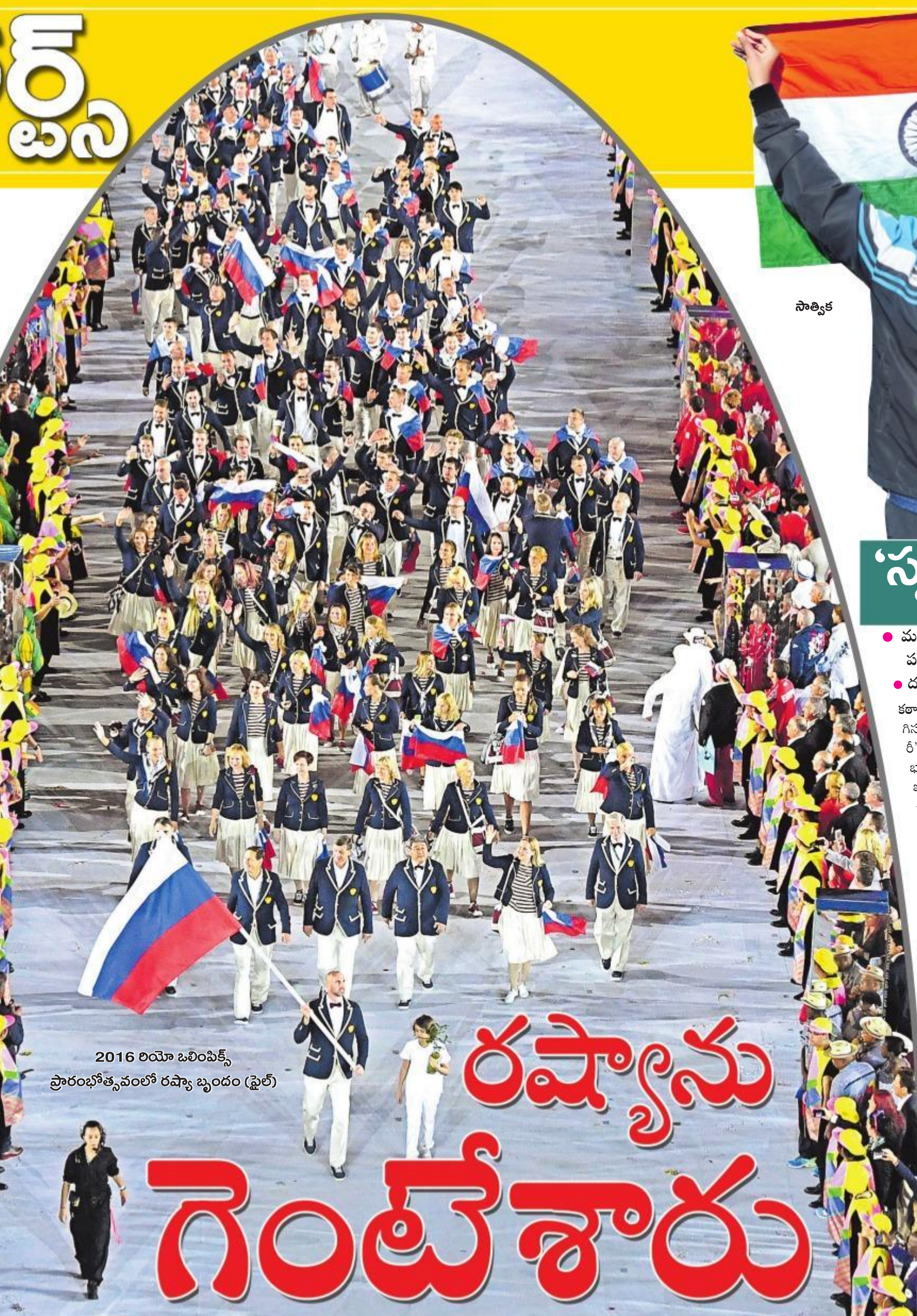
2016 లెంబా ఒలింపిక్స్ ప్రారంభోత్సవంలో రష్యా బృందం (ఫైల్)