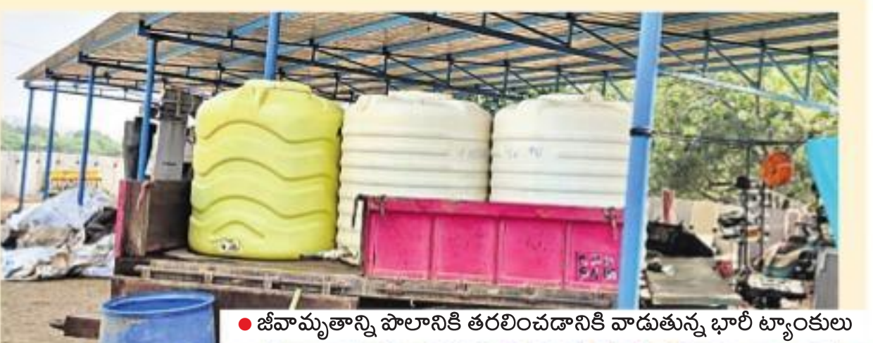
● జీవామృతాన్ని పొలానికి తరలించడానికి వాడుతున్న భారీ ట్యాంకులు