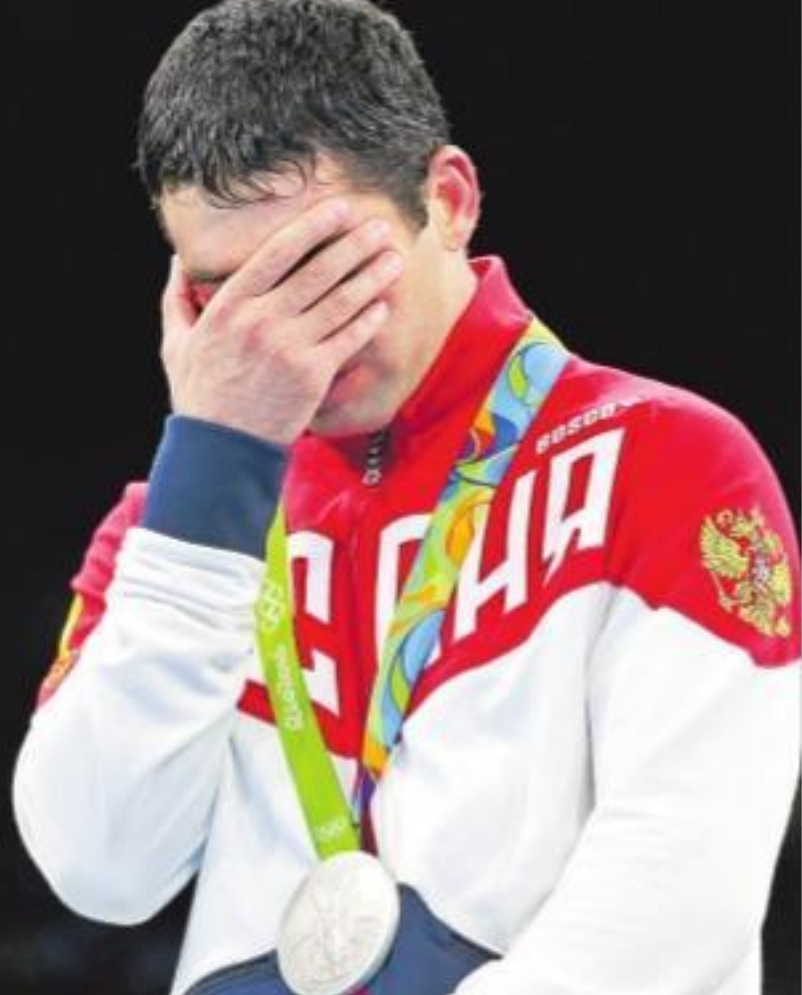
రష్యా పేరు లేకుండా...

అయితే డోపింగ్ మచ్చలేని రష్యా క్రీడాకారులకు 'వాడా' క్యాంప్ వెనుకబాటు ఇచ్చింది. వారు స్వంతం ప్రోటోకాల్ (అంతర్జాతీయ ఒలింపిక్ కమిటీ పతాకం కింద) పాల్గొనవచ్చునని తెలిపింది. స్వతంత్ర ప్రోటోకాల్ పాల్గొనే రష్యా అథ్లెట్లకు పతకాలు గెలిచినా అవి రష్యా జాతీయ పతాకం ఎగరదు. జాతీయ గీతం కూడా వినిపించదు. వచ్చే ఏడాది రష్యాలో జరిగే కొన్ని యూరో ఫుట్బాల్ మ్యాచ్ లకు, ఫార్ములావన్ రేసు నిర్వహణకు మాత్రం మినహాయింపునిచ్చింది. 2020 యూరో టోర్నీ జరిగే 12 దేశాల్లో 12 గనుం.