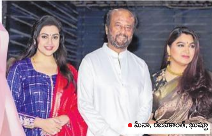
● మీనా, రజనీకాంత్, ఖుష్భూ

కొత్త సినిమాకు కొబ్బరికాయ కొట్టారు రజనీకాంత్. శివ దర్శకత్వంలో ఓ ఫ్యామిలీ ఎంటర్టైన్మెంట్ రజనీ హీరోగా నటిస్తున్నారు. ఈ చిత్రాన్ని నన్ షిక్లర్స్ సంస్థ నిర్మిస్తోంది. మీనా, ఖుష్భూ కీలక పాత్రల్లో నటించనున్నారు. కీర్తి సురేశ్ హీరోయిన్గా నటించనున్నారు. ఈ సినిమా ముహూర్తం బుధవారం జరిగింది. 28 ఏళ్ల తర్వాత రజనీకాంత్ సినిమాలో ఖుష్భూ నటించనుండటం విశేషం. అలాగే ఖుష్భూ తమిళ సినిమాలో కనిపించి దాదాపు పదిళ్లు కావచ్చుంది. ఈ నెల రెండోవారంలో ఈ చిత్రం రెగ్యులర్ షూటింగ్ స్టార్ట్ కానుందని సమాచారం.