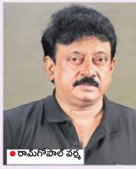
● రామ్ గోపాల్ వర్మ