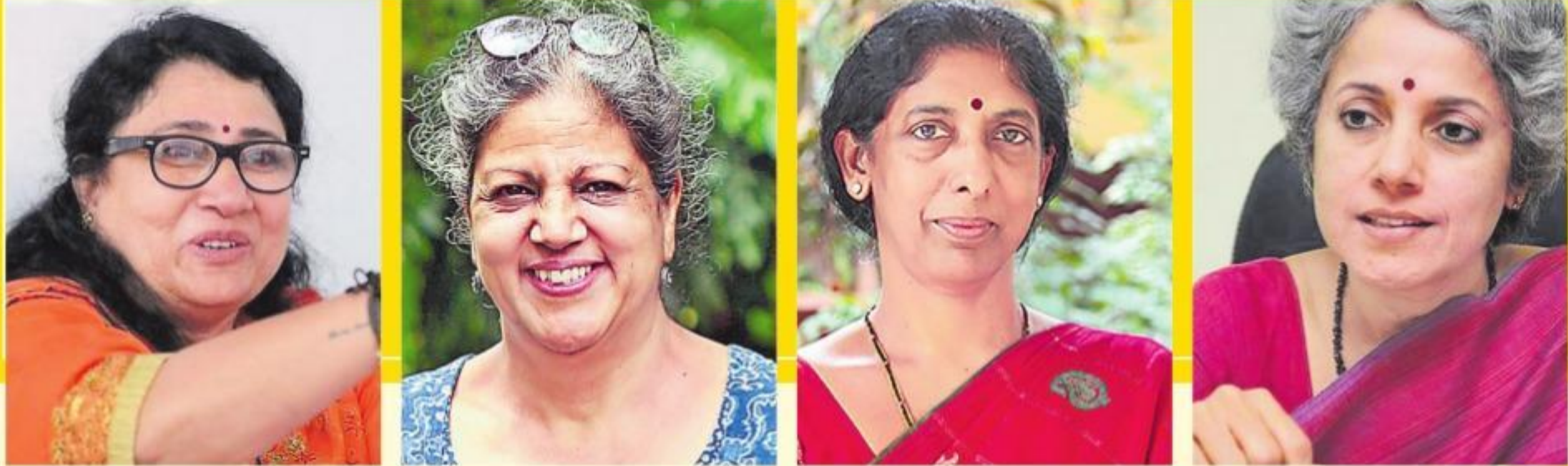
శరీరక సినా భారత రక్షణ రంగానికి కలికి తురాయి వంటి అధ్యాప్త డి.ఎస్.ఎస్. డి.ఎస్.ఎస్. ప్రాజెక్టు డైరెక్టర్, డి.ఆర్.డి.వో. బొట్లసాంబాద్ సైంటిస్ట్