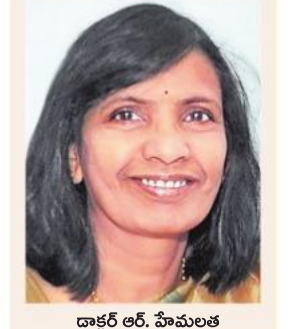
డాక్టర్ ఆర్. హేమలత డైరెక్టర్ ఎస్.ఐ.ఎస్.

'దేశం శాస్త్ర, సాంకేతిక పరిజ్ఞాన రంగాల్లో ఎడగాని ఆంక్షిస్తోంది. ఇది నెరవేరాలంటే కాబోయే తల్లులకు తగిన పోషకాహారం అందించడం ఎంతో శీల కం' అని జాతీయ పోషకాహార సంస్థ డైరెక్టర్ డాక్టర్ ఆర్. హేమలత తెలిపారు. 'మహిళల్లో సుమారు 50 శాతం మంది పోషకాహార లోపంతో బాధపడుతుంటే సుమారు 20 శాతం మందికి తగినన్ని పోషకాలు అందడం లేదు. అదే సమయంలో 40 శాతం మంది మహిళలు ఊబికాయలు' అని ఆమె వివరించారు. గర్భధారణ సమయంలో మహిళలు వండు గ్రాముల బరువు పెరిగితే పుట్టబోయే బిడ్డ, జనన సమయం బరువు 20 గ్రాముల వరకూ పెరుగుతుందని, అలాగే గర్భధారణ సమయంలోనూ, బిడ్డకు రెండేళ్ల వచ్చే వరకూ తగినంత పోషకాలు అందుకుంటున్నారా... అనే అమె వివరించారు. గర్భధారణ సమయంలో మహిళలు వండు గ్రాముల బరువు పెరిగితే పుట్టబోయే బిడ్డ, జనన సమయం బరువు 20 గ్రాముల వరకూ పెరుగుతుందని, అలాగే గర్భధారణ సమయంలోనూ, బిడ్డకు రెండేళ్ల వచ్చే వరకూ తగినంత పోషకాలు అందుకుంటున్నారా... అనే అమె వివరించారు. అంతేకాకుండా పిండం ఏర్పడతే తొలిన్నాళ్లలో తల్లిదండ్రులు తగినన్ని పోషకాలు అందకపోతే ఆ ప్రభావం కాస్తా బిడ్డ జీవితకాలంలో పోషకాలు, ఊపిరికొత్త, మెదడు పనితీరులపై కూడా దుష్ప్రభావం చదుతుందని తెలిపారు.