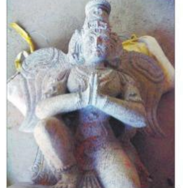
యాదాద్రి శ్రీలక్ష్మీనరసింహస్వామి ప్రధాన ఆలయం వద్ద గరుత్మంతుడి విగ్రహం

యాదాద్రిగిరిగట్టు: యాదాద్రి శ్రీ లక్ష్మీనరసింహ స్వామి దేవస్థానం కోసం ప్రత్యేకంగా తయారు చేయించిన గరుత్మంతుడి విగ్రహాలు ఆలయానికి చేరుకున్నాయి. ఆలయాన్ని మరింత ఆకర్షణీయంగా తీర్చిదిద్దేందుకు వైటీడీపీ అధికారులు, స్వపతులు, శిల్పాలు కృషిచేస్తున్నారు. ఇందులో భాగంగానే ప్రధాన ఆలయం, ప్రాకారాలు, మండపాల్లో గరుత్మంతుడి విగ్రహాలు, దీప కస్తూలు, సింహాల శిల్పాలను ఏర్పాటు చేయనున్నారు. వీటిని పాతగట్టలో స్వపతుల పర్యవేక్షణలో నిష్ఠాతులైన శిల్పాలు రూపొందించారు. నాలుగు గరుత్మంతుడి విగ్రహాలు గురువారం పాతగట్ట నుంచి ప్రధాన ఆలయం వద్దకు చేరాయి. రెండున్నర అడుగుల ఎత్తులో తయారైన వీటిని ప్రాకార మండపంలోని చిన్న విమానాల్లో ఏర్పాటు చేయనున్నారు. ఇక ఆరు అడుగుల ఎత్తులో రూపుదిద్దుకున్న రెండు దీప కస్తూలును గర్భాలయానికి ఎదురుగా ఉన్న గోపురం వద్ద ఏర్పాటు చేసేందుకు సన్నాహాలు చేస్తున్నారు. ఒకటిన్నర నుంచి రెండు అడుగుల ఎత్తులో తయార