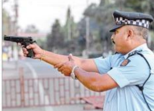
ఆందోళనకారులపైకి తుపాకీ గురిపెట్టిన పోలీసు