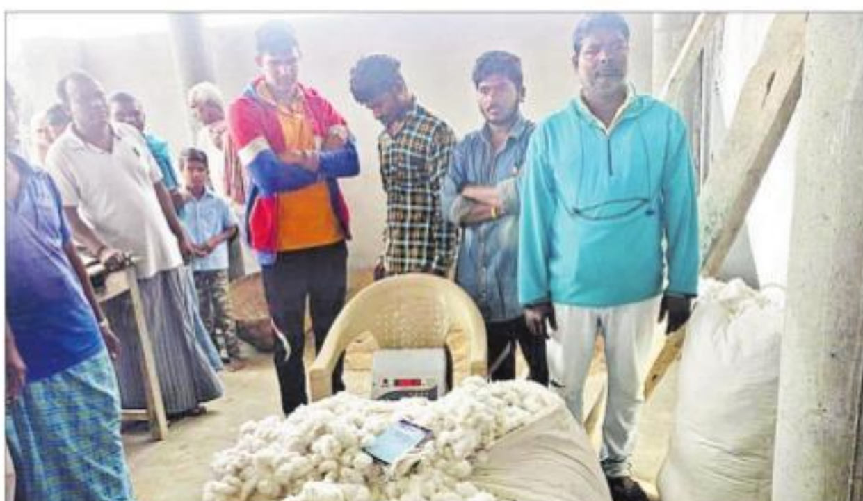
దోనూర్లో మోసం చేసిన పత్తి దళారులు