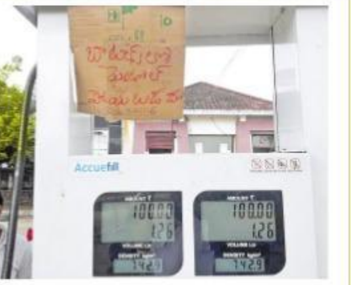
బాటిల్‌లో పెట్రోల్, డీజిల్ పోయబడదు అని బోర్డు ఏర్పాటు

అయితే పంటలకు పురుగు మందు కొట్టడానికి వినియోగించే డ్రైవ్ పంపు, వాహనాలు మధ్యలో అగిపోతే డీజిల్, పెట్రోల్ అవసరం ఉన్నందున.. ఇందనం అవసరమైన వ్యక్తి ఫోన్ నంబర్, వాహనం నంబర్, ఫాటోను స్కాన్ చేసి తీసుకుని పెట్రోల్, డీజిల్ ఇస్తున్నట్లు బంక్ నిర్వాహకులు చెబుతున్నారు.