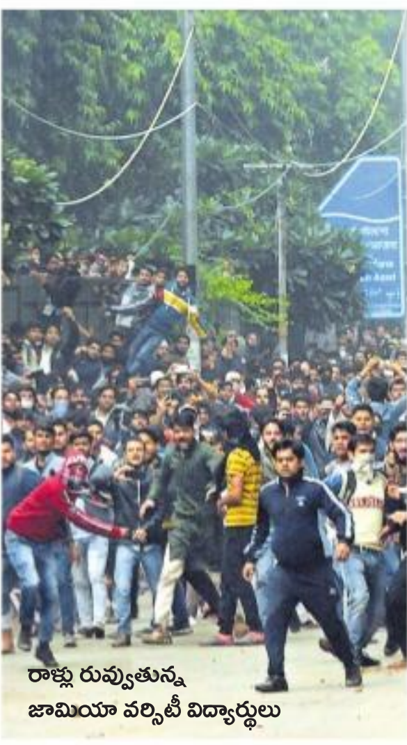
రాజ్కు రువ్వుతున్న జామియా వర్సిటీ విద్యార్థులు