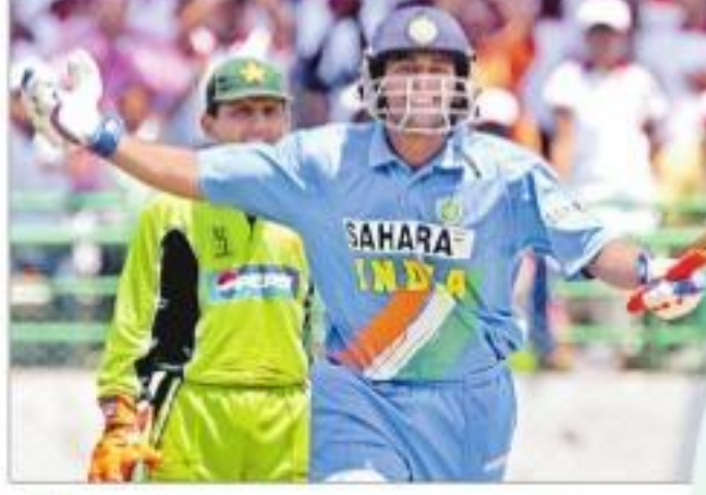
5 ఏప్రిల్, 2005 ఫలితం: పాకిస్తాన్ 58 పరుగులతో భారత్ గెలుపు.

విశేషాలు: కేరీల్ ఐదో వన్డే బరిలోకి దిగిన మహేంద్ర సింగ్ ధోని (123 బంతుల్లో 148; 15 ఫోన్లు, 4 సిక్స్లు) తుఫాన్ ఇన్ఫింగ్స్ బరకాత ప్రత్యర్థిని చిత్తు చేసింది. ధోనితో పాటు సెహ్వాగ్ (74), ద్రవిడ్ (52) ఆర్డర్ సెంచూరీలో భారత్ 9 వికెట్లకు 356 పరుగులు చేయగా, పాక్ 298 పరుగులకు ఆలాటైంది. కెప్టెన్ గంగూలి అండతో మూడో స్థానంలో ఆడి అవకాశం దక్కించుకున్న ధోని అద్భుత ప్రదర్శన అతని సన్మాన బయటపెట్టడంలో పాటు కొత్త ఘోషాని భారత్ క్రెడిట్ కు అందించింది.