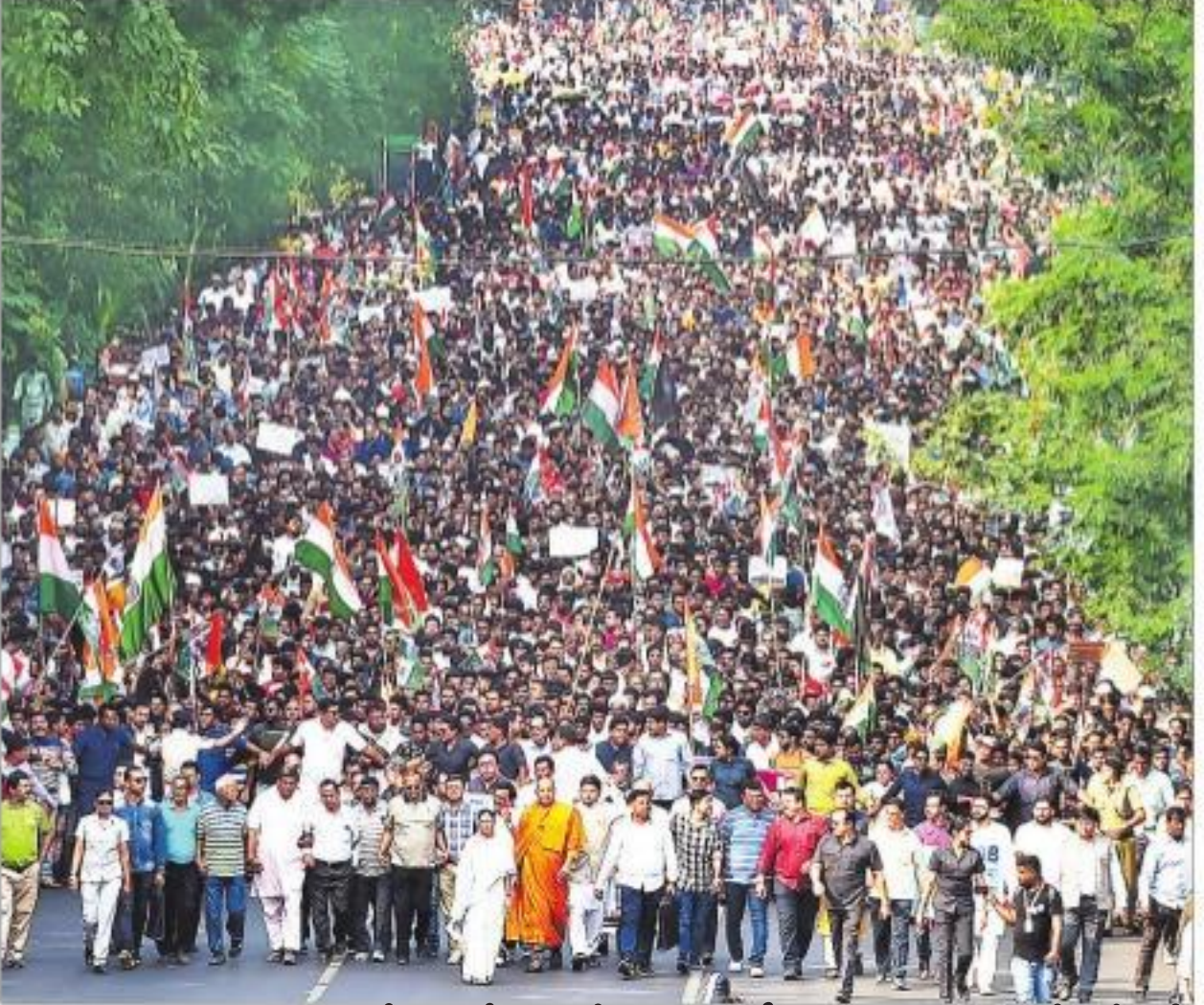
పౌరసత్వ సవరణ చట్టానికి వ్యతిరేకంగా కోల్కతాలో సోమవారం సీఎం మమత ఆధ్వర్యంలో భారీ రా్యలి

న్యూఢిల్లీ: వివాదాస్పద పౌరసత్వ సవరణ చట్టం (సీఏఏ)పై వ్యతిరేకత రోజురోజుకీ తీవ్రమవుతోంది. మొదట ఆస్సాం, త్రైపుర తదితర ఈశాన్య రాష్ట్రాలకే పరిమితమైన ఆందోళనలు సోమవారం నాటికి దేశవ్యాప్తమయ్యాయి. దేశ రాజధానిలోని జామియా యూనివర్సిటీ విద్యార్థుల ఆందోళనలకు పలు ఇతర యూనివర్సిటీలు, విజ్ఞాన సాముభావం ప్రకటించి, నిరసన ప్రదర్శనలు నిర్వహించాయి. ఢిల్లీలోని ఇండియా గేట్ సీఎం మమతా బెనర్జీ, ఢిల్లీలోని ఇండియా గేట్ వద్ద కాంగ్రెస్ ప్రధాన కార్యదర్శి ప్రియాంకా కాండ్ ఆందోళనల్లో ప్రత్యక్షంగా పాల్గొన్నారు. జామియా వర్సిటీలో విద్యార్థులపై పోలీసుల దౌర్జన్యం ఖండిస్తూ కాంగ్రెస్ నేతృత్వంలో విజ్ఞాన స్రైని కాన్వెన్షన్ నిర్వహించాయి. బాధ్యతారహితంగా చట్టాన్ని తీసుకువచ్చిన కేంద్రానిడే ఈ హింసకు బాధ్యత అని కాంగ్రెస్ నేత గులాం నబీ అజాద్ పేర్కొన్నారు. కేక రాజధాని తిరువనంతపురంలో ఆపాధారణంగా ప్రత్యర్థి వజ్రలు ఎలెడీవెస్, యూడీవెస్ నిరసనల్లో పాల్గొన్నారు. ఢిల్లీ, లక్నో, ముంబై, హైదరాబాద్, బెంగళూరుల్లోని పలు వర్సిటీల్లో విద్యార్థుల నిరసనలు చేపట్టారు. ఐబీ, ఐఎం, ఐఎస్ విద్యార్థులు సైతం ఈ