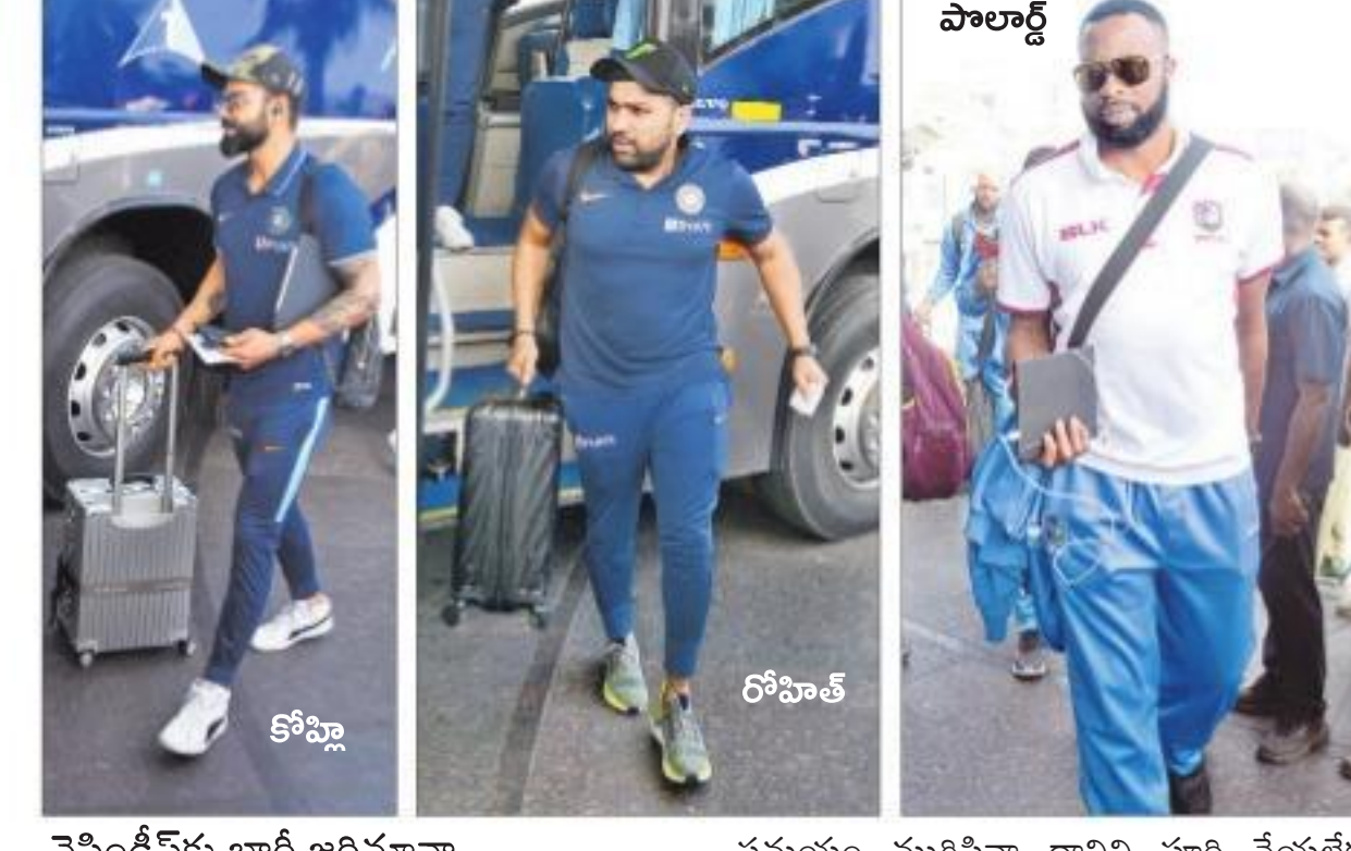
వెస్టిండీస్ కు భారీ జరిమానా