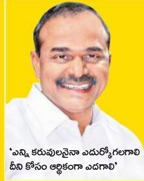
'ఎన్ని కరువులనైనా ఎదుర్కోగలగాలి దీని కోసం ఆర్థికంగా ఎదగాలి'