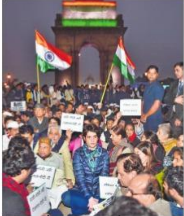
ఇండియా గేట్ వద్ద ధర్నాకు దిగిన ప్రయోగం

వివిధా వర్సిటీ విద్యార్థులపై ఆదివారం పోలీసుల దౌర్జన్యం నిరసిస్తూ సోమవారం వెలాది విద్యార్థిని, విద్యార్థులు వర్సిటీ ప్రధాన ద్వారం ముందు బ్రెజాయింపారు. వర్సిటీ ముందున్న రోడ్లపై ఆందోళనలు నిర్వహించారు. వర్సిటీ ఆదివారం ఆనుమతి లేకుండా పోలీసులు లోపలికి చచ్చి, విద్యార్థులపై రాతిపాల్ల వేసి, టీయర్ గ్యాస్ ప్రయోగించారని ప్రశ్నించారు. పోలీసుల దౌర్జన్యంపై సీఎం విచారణ జరగాలని డిమాండ్