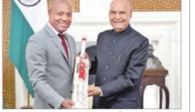
భారత్ రాష్ట్రపతికి బ్యాట్ అందజేస్తున్న లారా

విశాఖపట్టణం: వెస్టిండీస్ దిగ్గజం బ్రియాన్ లారా భారత్ కెప్టెన్ విరాట్ కోహ్లాని సాకర్ స్టార్ క్రెడిట్ లతో ఆస్ట్రేలియాలో టాకాల్ తో ఫోటోలు తీశారు. అతని ఫాలోవర్లకు సామర్థ్యం, మానసిక స్వేచ్ఛ, బ్యాటింగ్ స్టైల్ ను ఇచ్చే కార్యక్రమంలో పాల్గొనడం భారత్ కు వచ్చిన లారా మీడియాలో మాట్లాడుతూ 'నా దృష్టిలో కోహ్లా క్రెడిట్ టాకాల్ టోన్ లతో ఫుట్ బాల్ స్టార్ కోహ్లా ఏ మాత్రం తీసిపోడు. ఆటలో, సన్మానాలలో అతని నిబద్ధతను మెచ్చుకోవాల్సింది. బ్యాటింగ్ లో అతను కష్టపడేటప్పుడు గొప్పగా ఉంటుంది. ఏ తరం క్రెడిట్ ఇచ్చినా సరిగ్గా సరిపోయే బ్యాట్స్ మెన్ అతను అని విరాట్ ను ఆశాననికాదు. అంతకుముందు ఢిల్లీలో ఈ విండీస్ దిగ్గజ బ్యాట్స్ మెన్ రాష్ట్రపతి భవన్ లో భారత్ రాష్ట్రపతి రామనాథ్ కోవింద్ ను కలిశారు. ఈ సందర్భంగా లారా క్రెడిట్ చేసిన సేవలను కోవింద్ కోనియాచారు. వర్తమాన క్రీడాకారులకు లారా ఓ తో మోడల్ అని ఆయన కీర్తిచ్చారు.