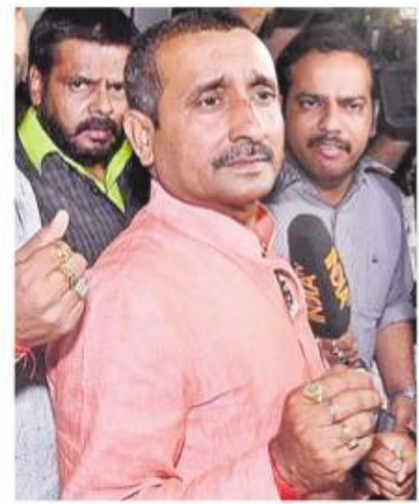
కుల్చీప్ సింగ్ సెంగార్ (ఫైల్)

దేశవ్యాప్తంగా సంచలనం సృష్టించిన ఉన్నావ్ ఘటనపై ఎట్టకేలకు కోర్టులో విచారణ పూర్తయింది. బాలిక కిడ్నాప్.. అత్యాచారం.. బాధితురాలి తండ్రి లాకప్ మరణం.. ఆమె ప్రయాణిస్తున్న వాహనానికి ప్రమాదం..వంటి మలుపులతో రెండేళ్లుగా నలుగురున్న ఉన్నావ్ కేసు ముగింపునుకు వచ్చింది. సుప్రీంకోర్టు జోక్యంతో ఆగస్టు నుంచి రోజువారీ విచారణ చేపట్టిన ఢిల్లీలోని తీస్ హజారీ కోర్టు సోమవారం బీజేపీ బహిష్కృత ఎమ్మెల్యే కుల్చీప్ సింగ్ సెంగార్ ను దోషిగా తేల్చింది. ఈనెల 19న శిక్ష ఖరారు చేయనుంది.