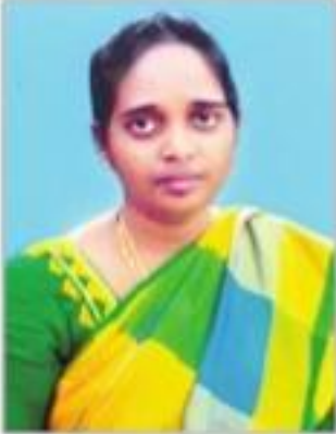
రావుల శరణ్య లత పాల్వంచ

ముగ్గులు పంపాల్సిన మా చిరునామా: సిరి ముగ్గు, నమస్తే తెలంగాణ, 8-2-603/1/7,8,9, కృష్ణావరం, బంజారా హిల్స్, రోడ్ నం-10, హైదరాబాద్ - 500034. zindagi.nt@gmail.com