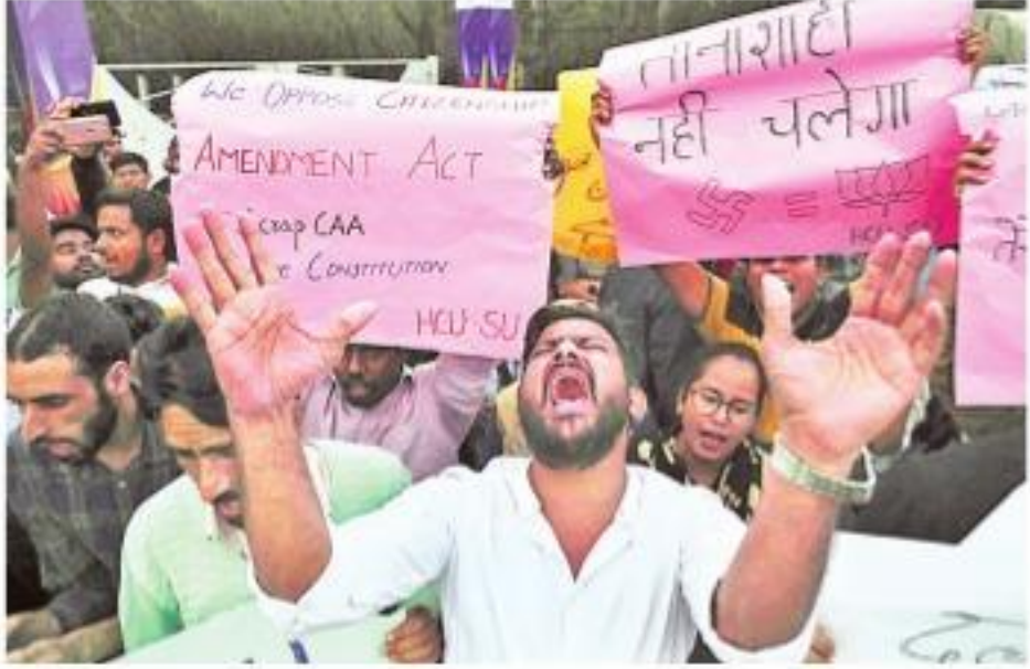
పౌరసత్వ సవరణ చట్టానికి వ్యతిరేకంగా సోమవారం హైదరాబాద్ నింట్లలో యూనివర్సిటీలో విద్యార్థుల ఆందోళన