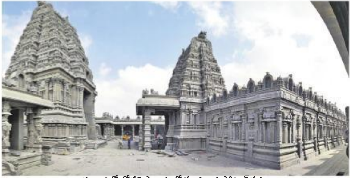
యాదాద్రిలో లోపలి ప్రాకారంలో పూర్తయిన ఫ్లోరింగ్ పనులు