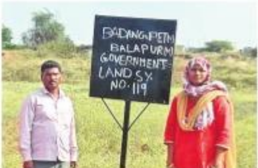
బదంగిపేట ప్రభుత్వ భూమిలో హెచ్చరిక బోర్డులు ఏర్పాటుచేస్తున్న రెవెన్యూ అధికారులు

బాలాపూర్ రెవెన్యూ పరిధిలో చెరవీడిన ప్రభుత్వ భూములు