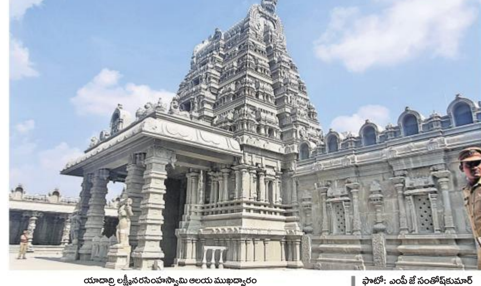
యాదాద్రి లక్షనరసింహస్వామి అలయ ముఖద్వారం

రాతిశిలలను అద్భుత కళాఖండాలుగా మలిచారని, ఆలయ ప్రాంగణమంతా దేవతామూర్తుల విగ్రహాలతో నిండి విభిన్న రూపకల్పన చేశారని శిల్పాలను సీఎం కేసీఆర్ అభినందించారు. 560 మంది శిల్పాలు నాణ్యతగా పడుతున్న కష్టం ఫలించి, అద్భుత ఆకారాలతో కూడిన ప్రాకారాలు సిద్ధమయ్యాయని ఆన్నారు. వందకు వందశాతం శిలలనే ఉపయోగించి దేవాలయాన్ని తిరిగినిర్మించే యాదాద్రిలో సాధ్యమైందని చెప్పారు. ఆలయ ప్రాంగణంలో పచ్చదనం పెంచేలా, ఆహారం పంచేలా ఉద్యానవనాలు పెంచాలని సీఎం సూచించారు. ఆలయ ప్రాంగణంలో దేవాలయ ప్రాకారం, లక్షనరసింహస్వామి చరిత్ర, స్థలపురాణం ప్రయోజనాలకు తైలవర్ణ విగ్రహాలను వేయనున్నారు.