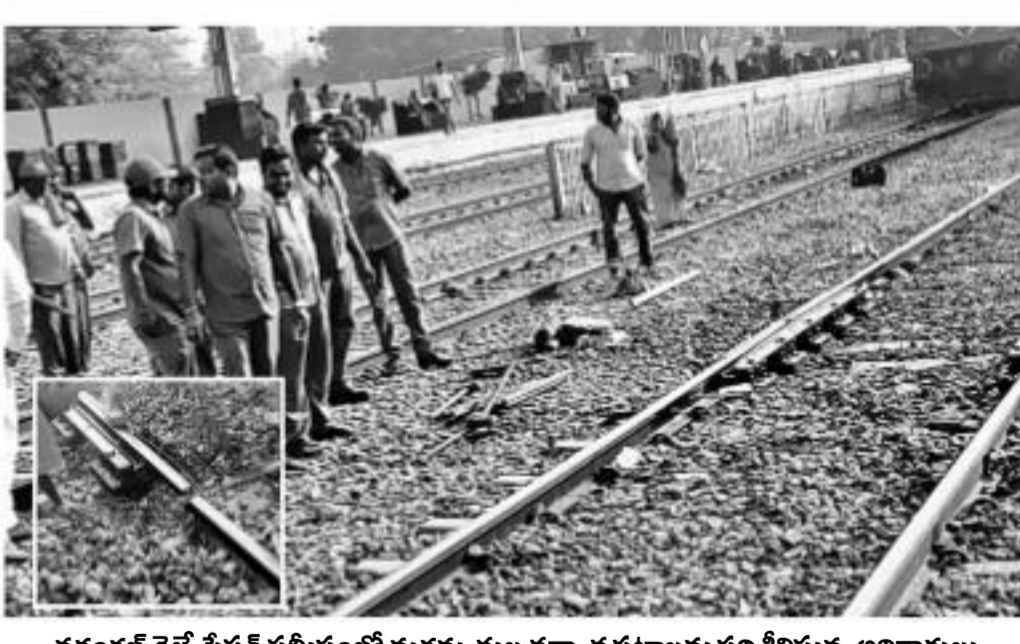
వరంగల్ రైల్వే స్టేషన్ సమీపంలో మరమ్మత్తుల తర్వాత పట్టణాలను పరిశీలిస్తున్న అధికారులు