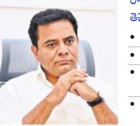
హైదరాబాద్, నమస్తే తెలంగాణ:

దిశ హత్యలకు కేసులో భయంకరమైన కోణాలు వెలుగుచూస్తున్నాయి. దిశ్ కిరా తకంగా లైంగికదాడి జరిపి.. దహనం చేసిన నలుగురు నిందితులు.. ఎదురుకాల్పుల్లో మరణించినా దీని ముందు పోలీసుల ఎదుట వెల్లడించిన వివరాలు అధికారులను విస్మయించిన గురిచేశాయి. హంతకుల నేరాల చిహ్నం భయం పుట్టిస్తున్నది. వారు చంపింది ఒక దిశను మాత్రమేకాదు.. దిశ మాదిరిగానే మరో తొమ్మిది మందిని హత్యచేసి దహనం చేసినట్లు పాంగూలం ఇన్స్పెక్టర్ మాకు హత్యలు చేసినట్లు ఒప్పుకొన్నట్లు విశ్వసనీయ సమాచారం. ఈ హత్యలన్నీ మహాబూబ్ నగర్, సంగారెడ్డి, రంగారెడ్డి, హైదరాబాద్, కర్ణాటక ప్రాంతాల్లోని హైవే ప్రాంతాల వద్ద చేసినట్లు నిందితులు అంగీకరించారని తెలిసింది. ప్రతి