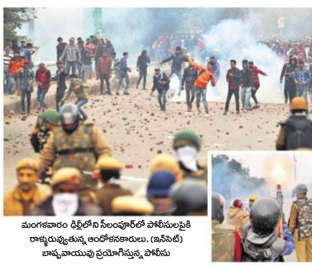
మంగళవారం ఢిల్లీలోని సీలంపూర్ లో పోలీసులపైకి రాక్షసులైతూ, అందోళనకారులు. (ఇసీసీ) బాన్సా నాయువు ప్రయోగిస్తున్న పోలీసు