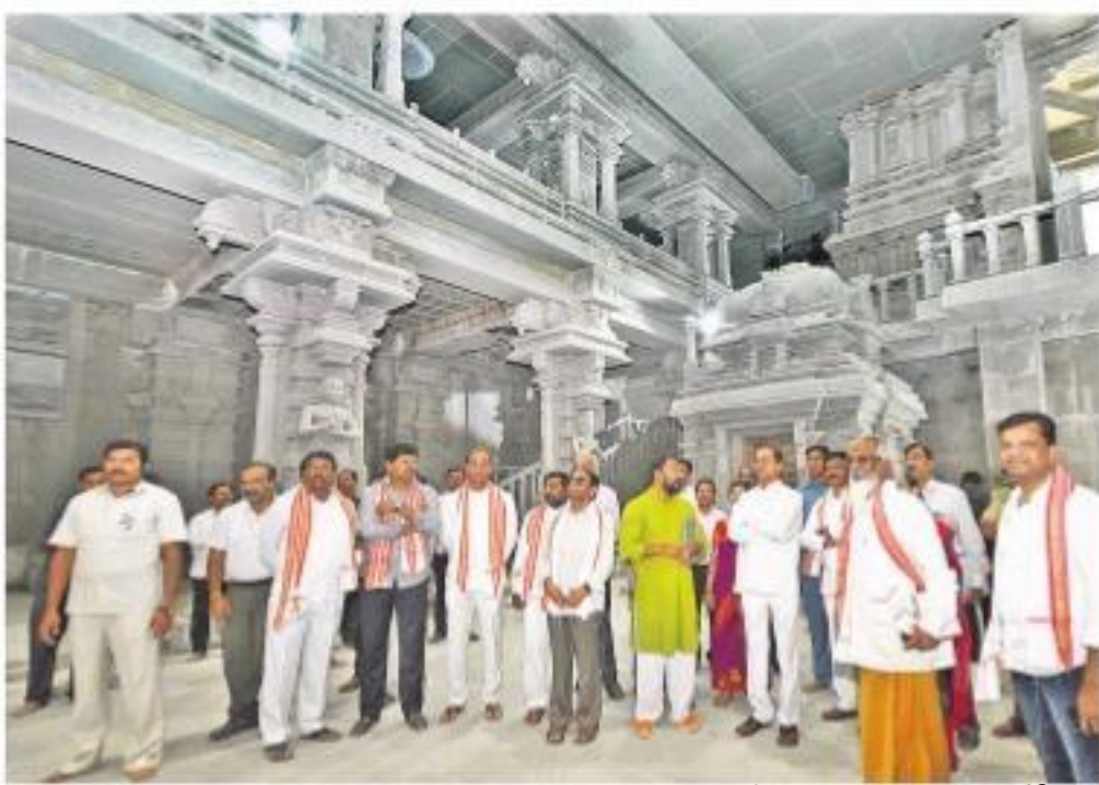
మంగళవారం యాదాద్రిలో ఆలయ పునరుద్ధరణ పనులను పరిశీలిస్తున్న ముఖ్యమంత్రి కేసీఆర్

ఆధ్యాత్మిక కేంద్రంగా భాసిల్లుతుంది ■ చరిత్రలో నిలిచిపోతుంది