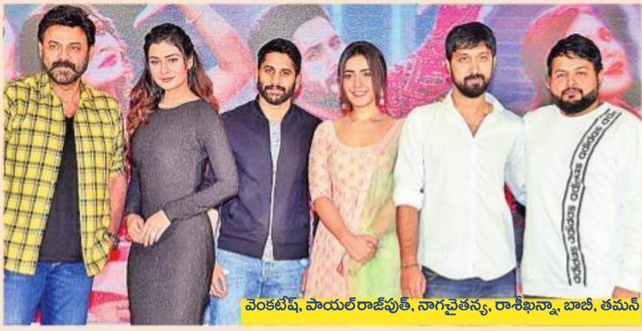
వెంకటేశ్, పాయల్ రాజ్ కుమార్, నాగచైతన్య, రాశీఖన్నా, బాబీ, తమన్