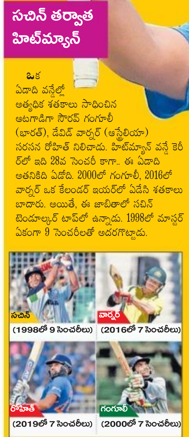
రోహిత్ శర్మ (159)