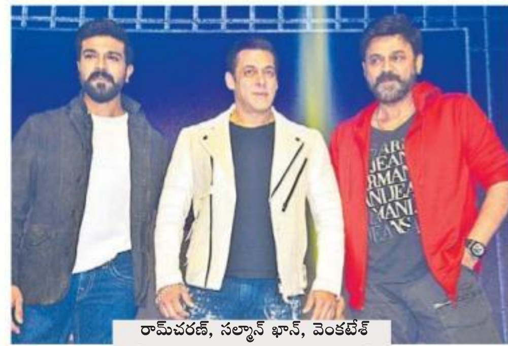
రామ్ చరణ్, సల్మాన్ ఖాన్, వెంకటేశ్

“రామ్ చరణ్ చిన్నప్పటి నుండి నాకు తెలుసు. చాలా సన్నిహితుడు. చిన్న తమ్ముడిలాంటి వాడు. చిరంజీవిగారు కూడా నాకు చాలా క్లబ్. 'వెంకీమామ' పాతికేళ్లుగా తెలుసు. మంచి ఫ్రెండ్” అని సల్మాన్ ఖాన్ అన్నారు. ఆయన హీరోగా, సుదీప్ విలన్ గా ప్రభుదేవ దర్శకత్వంలో రూపొందిన 'దబంగ్ 3' శుక్రవారం తెలుగులోనూ విడుదలవుతోంది. హైదరాబాద్ లో బుధవారం సాయంత్రం ప్రీరిలీజ్ ఫంక్షన్ నిర్వహించారు. వెంకటేశ్, రామ్ చరణ్ అతిథులుగా హాజరయ్యారు. “సల్మాన్ బాయ్ డ్రస్ వేస్తే పోలీస్... లీసెన్స్ గూండా” అని చెప్పే డైలాగ్ మామూలుగా లేదు. తెలుగులో ఈ సినిమా విడుదలవుతుండటం చాలా ఆనందంగా ఉంది. మీరంతా ఆయన్ను ఎంత ప్రేమిస్తారో... సినిమానూ చూసి అంతే సూపర్ డూపర్ హిట్ చేస్తారని నమ్ముతున్నా” అని వెంకటేశ్ అన్నారు. “సల్మాన్ బాయ్ పై నాకున్న ప్రేమను చెప్పడానికి కొన్ని మాటలు చాలవు. సూపర్ స్టార్ సల్మాన్, వెంకటేశ్, సుదీప్, చిరంజీవి నుండి నేను నేర్చుకున్నది సటినీ, డైలాగులు