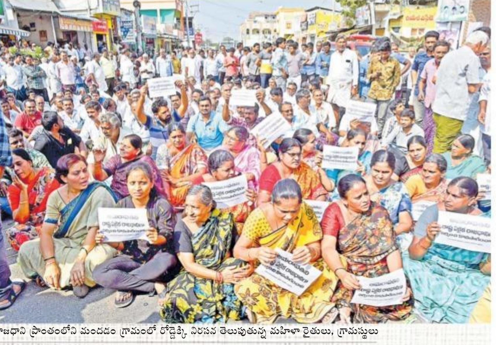
రాజధాని ప్రాంతంలోని మండలం గ్రామంలో రోడ్డుకి నిరసన తెలుపుతున్న మహిళా రైతులు, గ్రామస్థులు