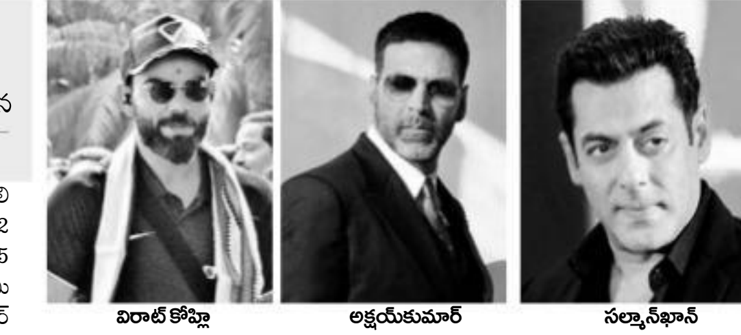
విరాట్ కోహ్లా, అక్షయ్ కుమార్, సల్మాన్ ఖాన్

ముంబై, డిసెంబర్ 19: ఫోర్స్ ఇండియా విడుదల చేసిన టాప్-100 సెలబ్రిటీల (ప్రముఖ వ్యక్తుల) జాబితాలో భారత క్రికెట్ జట్టు సారథి విరాట్ కోహ్లా ఆస్ట్రేలియాలో నిలిచారు. తొలి కేటలం వ్యక్తిత్వమైన ఆదాయాన్ని మాత్రమే పరిగణనలోకి తీసుకోకుండా సెలబ్రిటీలను పేరు ప్రఖ్యాతులను పరిగణనలోకి తీసుకొని ర్యాంకులను ప్రకటించినట్లు ఫోర్స్ ఈ సందర్భంగా పేర్కొంది. అక్టోబర్ 1, 2018 నుంచి సెప్టెంబర్ 30, 2019 మధ్య ఈ జాబితాను తయారుచేసినట్లు నిర్వాహకులు తెలిపారు. ఈ లిస్టులో బాలీవుడ్ ప్రముఖ నటులు 'కి లాడ్' అక్షయ్ కుమార్ రెండో స్థానంలో నిలవగా, కండల వీరుడు సల్మాన్ ఖాన్ మూడో స్థానాన్ని కైవసం చేసుకున్నారు. దేశంలోనే అత్యధిక ఆదాయం పొందుతున్న సెలబ్రిటీగా