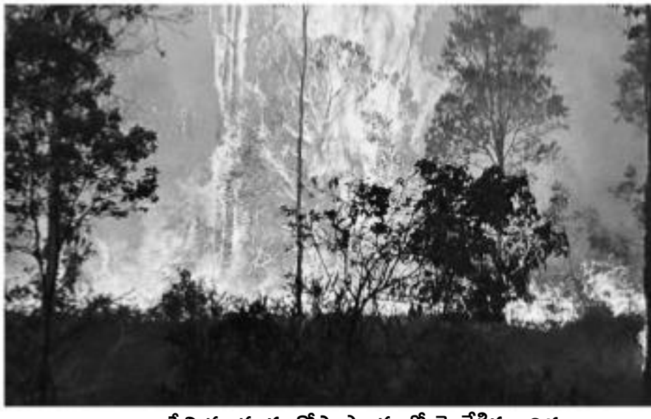
అశ్వినీయా తూర్పు కోస్తా ప్రాంతంలో చేలరేగిన కార్మికులు