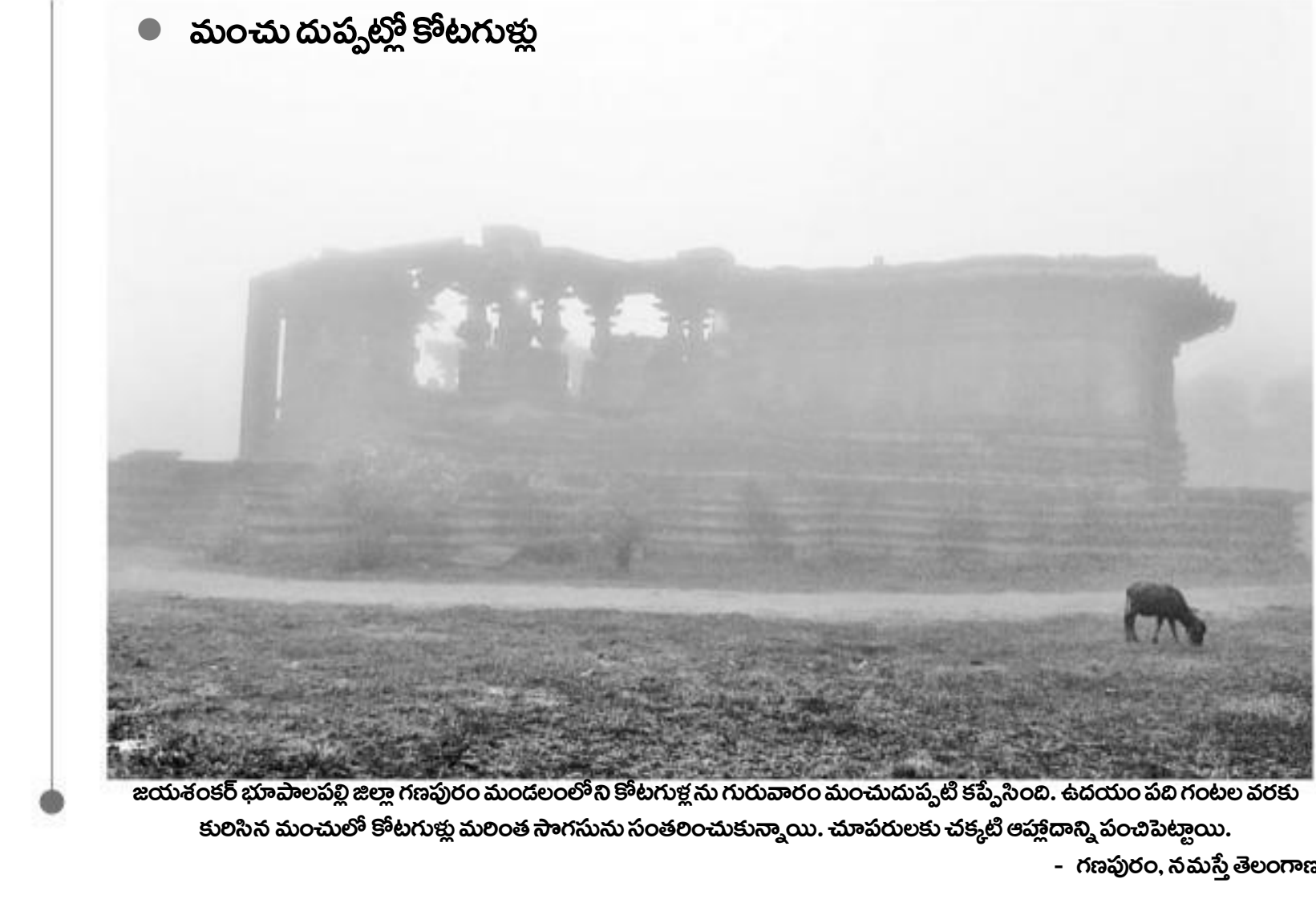
మంచు దుప్పట్లో కోటగుట్ట కురిసిన మంచులో కోటగుట్ట మలంక సాగనును సంతరించుకున్నాయి. చూపరులకు చక్కటి ఆహ్లాదాన్ని వందిపెట్టాయి.

స్థానిన చెప్పారు. కొన్ని వారాల కిందట జరిగిన తనీల్లో ఆయుధాలు లభించాయి. ఇప్పుడు మళ్లీ డౌరికాయంలో ఏవరో వాటిని తరలిస్తున్నారని పేర్కొన్నారు. జైలులో ఖైదీలను బృందాలవారిగా భావించి నిర్బంధించారు, స్థానిక కాలమానం ప్రకారం మధ్యాహ్నం రెండుగంటలకు 14వ భాగంలో కాల్పులు ప్రారంభమయ్యాయని జైలు అధికారులు వివరించారు. ఒకే వర్గానికి చెందిన ఖైదీల మధ్య అంతర్గత అసమ్మతి కాల్పులకు కారణమని పనామా జాతీయ పోలీస్ ఆఫీసర్ వెంటనే తమ భద్రతా మండలిని కలిపి చర్చి