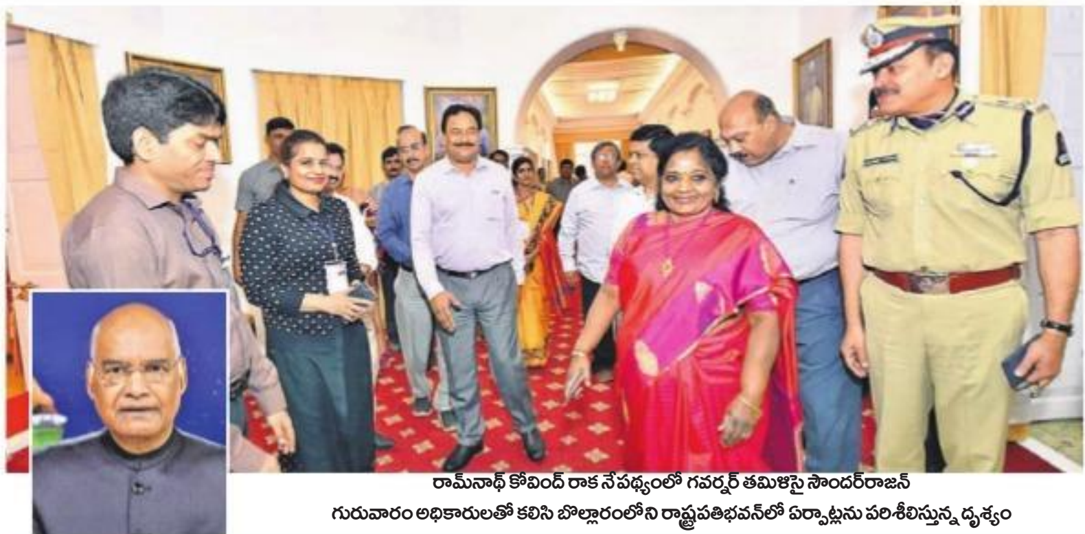
రామనాథ్ కోవింద్ రాక నేపథ్యంలో గవర్నర్ తమిళిస్సై సౌందరరాజన్ గురువారం అధికారులతో కలిసి బోల్షార్లలోని రాష్ట్రమతిభవన్లో ఏర్పాటు పరిశీలిస్తున్న దృశ్యం