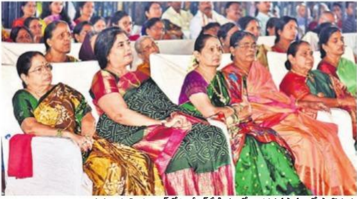
గురువారం హైదరాబాద్‌లోని ఎన్టీఆర్ స్టేడియంలో భాగవత సప్తాహంలో పాల్గొన్న ముఖ్యమంత్రి కేసీఆర్ సతీమణి శోభ, కూతురు, మాజీ ఎంపీ కవిత, కోడలు వైలిమ తదితరులు