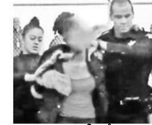
విమానాన్ని దొంగిలించేందుకు ప్రయత్నించిన బాలికను అరెస్టు చేస్తున్న కాలిఫోర్నియా పోలీసులు

చక్కర్లు కొట్టించింది. ఈ క్రమంలో సదరు విమానం దగ్గర్లోనే భవనాన్ని డిక్లాస్టింగ్. దీంతో విమానం, అక్కడి భవనం కొంత దెబ్బ తిన్నాయి' అని ప్రెస్నో పోలీసు అధికారి ఒకరు తెలిపారు. ఈ ఘటనలో ఎవరో గాయాలు కాలేదని, విమానంతో పాటు, విమానాశ్రయ అధ్యక్షులు కొంతమేర దెబ్బతిన్నట్లు ఆయన తెలిపారు. బాలిక విమానాన్ని దొంగతనం చేయాలనుకొనేవదానికి గల కారణాల్ని అన్వేషిస్తున్నట్లు ఆయన తెలిపారు. కాగా మంగళవారం రాత్రి నుంచి తన కుమారుడు ఎక్కడి వెళ్ళిందన్న విషయం తనకు తెలియదని బాలిక తల్లి ఓ వార్తా సంస్థతో పేర్కొన్నారు.