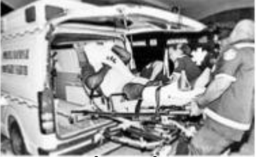
పనామా జైలులో ఘర్షణలో గాయపడ్డవారిని దవాఖానకు తరలిస్తున్న దృశ్యం

పనామా: పనామాలోని ఓ జైలులో ఖైదీల మధ్య మంగళవారం హింస చెలరేగింది. సహచర ఖైదీల మధ్య జరిగిన కాల్పుల్లో 13 మంది మరణించగా, మరో 15 మంది గాయపడ్డారు. అధికారుల సమాచారం మేరకు.. మూడు ఏకే 47 రైఫిల్స్ తోపాటు ఐదు పిస్తోళ్లు పుటనా స్టేషన్ లో లభించాయి. రాజధాని పనామా నగరంలోని లా జోయిటా జైలులోకి ఆయుధాలు ఎలా వచ్చాయనే విషయమై విచారణ చేపట్టనున్నట్లు పనామా దేశాధ్యక్షుడు లుబెర్టిన్ ఫ్రాన్కో తెలిపారు. 'ఈ తుపాకులు ఆకాస్ నుంచి ఊడిపడలేదు. జైలులోకి వాటిని తరలించడానికి కచ్చితంగా లోపలినుంచి సహకారం అంది ఉంటుంది' అని అభిప్రాయపడ్డారు. జైలులోకి ఆయుధాల అక్రమరవాణాను అడ్డుకునేందుకు ఇంటెలిజెన్స్ తమ భద్రతా మండలిని కలిపి చర్చి