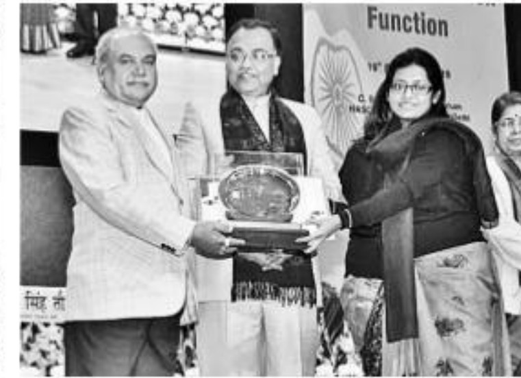
కేంద్రమంత్రి తో మార్ల నంది అవార్డు అందుకుంటున్న సర్వీ సీకావో పాసుమి బసు