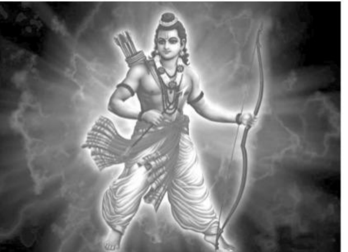
ఉండడం, పరధనానికి, అక్రమ సంపాదనకు ఆశపడకుండా ఉండటం మాతాపితరుల పట్ల మాతృతేజం పట్ల జ్ఞప్తి సేవా భావాలు కలిగి ఉండటం, పెద్దల పట్ల గౌరవం, వినయం కలిగి ఉండటం, సత్యనిష్ఠతో జీవించటం ఇవన్నీ మానవ జీవన

మహామనీషులైన వశిష్టపరశురాజ్ వ్యాసాది మహర్షులు, గౌతమ బుద్ధుడు, శంకరాచార్యుని ప్రవక్తలు, తత్వవేత్తలు కారణ జన్మలైన పరశురామ, రఘురామ, బలరామ, శ్రీకృష్ణాది మహాపురుషులు మానవ శ్రేయస్సు కోసం ధర్మ రక్షణ కోసం దీక్షాపరులై మహాత్కార్యాలు సాధించారు. మానవ జీవన ధర్మాలు నిర్వచించారు. భావికాలకు మహాత్కరమైన సత్యంకారాలు అందించారు. మానవ జన్మ ఇతర జీవుల జన్మలకన్న మహోన్నతమైనది. దుర్లభమైన ఈ జన్మలు లభించిన మానవులు దానికి అనుగుణమైన జీవన ధర్మాలు ఆచరించి, జన్మను సాధారణం చేసుకోవాలి. శ్రుతిస్మృతి పురాణాలు, ఇతిహాసాలు, ఉపనిషత్తులు, కావ్యాల ద్వారా మహర్షులు, సుప్రసిద్ధ కవులు మానవాళికి సత్యంకారాలు అందించి మహోపదేశం చేశారు. మానవ జీవన ధర్మాలలో ప్రధానమైనది గృహస్థాశ్రమ ధర్మం. అనాది కాలం నుంచి సాగుతూ సనాతన ధర్మంగా పేరుపడిన ఇక్కడి ధర్మాలలో ముఖ్యమైనది గృహస్థాశ్రమ ధర్మం. ఈ ధర్మం అనేక రకాల జీవన ధర్మాలకు ఆధారంగా నిలిచింది. తల్లి తన సంకానాన్ని ప్రాణ ప్రదంగా చూసుకుంటూ పెంచటం మాతృధర్మం, పిల్లల బాధ్యత రక్షణ మాదటం పితృధర్మం. ఇలా ఎన్నో ధర్మాలు ప్రతి ఒక్కరికీ ఉన్నాయి. అలా ఎవరి విధులను వారు తమ బాధ్యతగా సకాలంలో నిర్వహించడం వారి వారి జీవన ధర్మాలు. ప్రతి మానవుడు సాటివారితో స్నేహ సంబంధాలు కలిగి