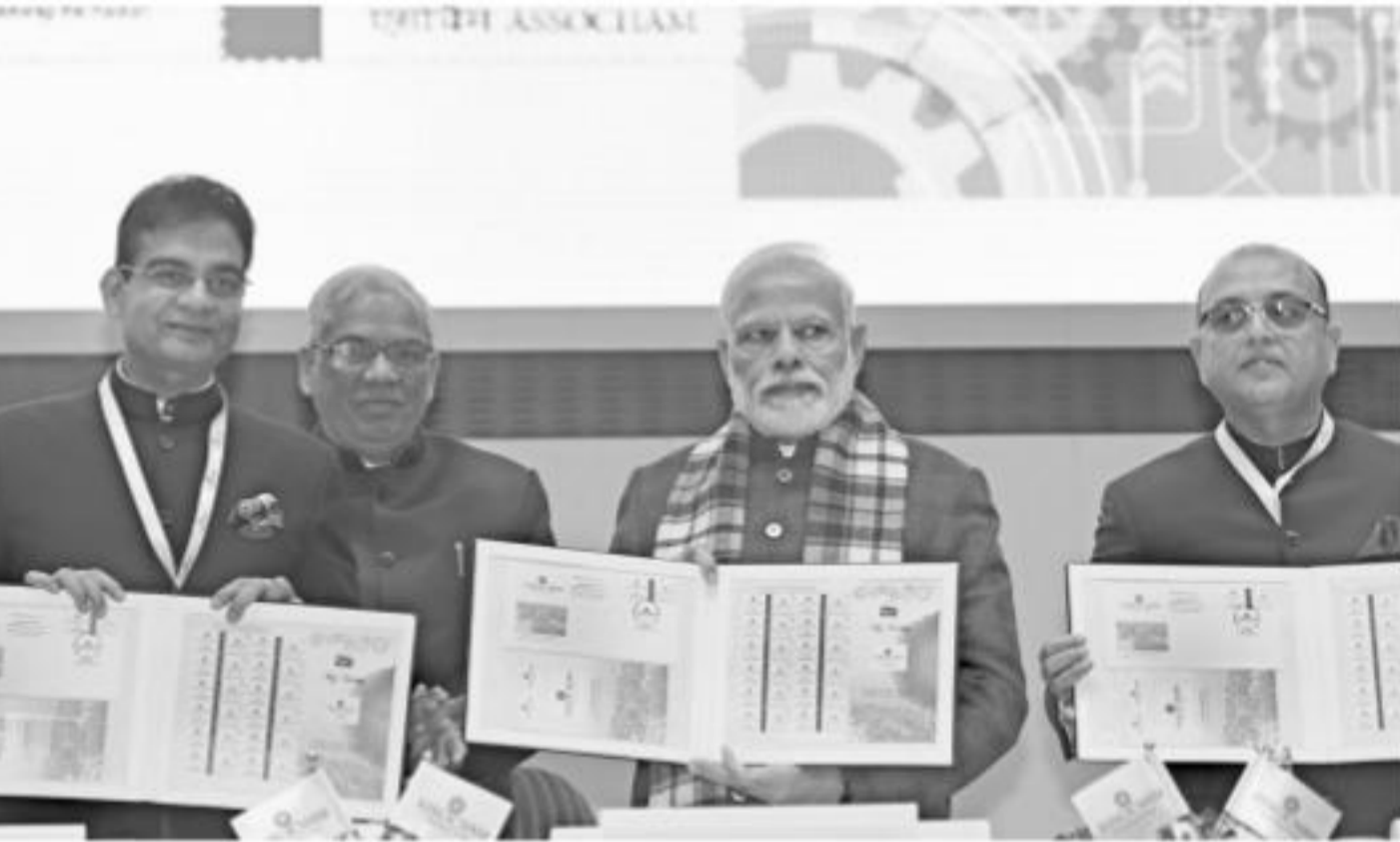
న్యూఢిల్లీ: ఆర్థిక మందగమనంపై వృద్ధి పతనం కొనసాగుతున్న నేపథ్యంలో ప్రధాని మోడీ కీలక వ్యాఖ్యలు చేశారు. భారత ఆర్థిక వ్యవస్థ మందగమనం నుంచి వేగంగా పూర్వస్థితిని అందుకుంటుందనే ఆశాభావాన్ని ఆయన వ్యక్తం చేశారు. దేశ ఆర్థిక వ్యవస్థ మనుషుటి కంటే అధిక వృద్ధి పతనం పరుగులు తీస్తుంది. జీడిపీ వృద్ధి కోసం కార్యక్రమాలను పెట్టుబడులు పెట్టాలని, ఎలాంటి భయాలూ అక్కరలేదని ఆయన భరోసానిచ్చారు. బెరుకు లేకుండా వ్యయాలను చేయాలని ఆయన సూచించారు. కార్పొరేట్ రంగంలో నేరాలకు పాల్పడకుండా నిర్ణయాలు తీసుకునే వ్యవస్థను ఏర్పాటు చేయాలని ఆయన కోరారు. కార్పొరేట్ రంగంలో నేరాలకు పాల్పడకుండా నిర్ణయాలు తీసుకునే వ్యవస్థను ఏర్పాటు చేయాలని ఆయన కోరారు.

హామీ ఇచ్చారు. పారిశ్రామిక సమాఖ్య ఆసోచామ్ 100వ వార్షిక వార్షిక సంవత్సరం డిల్లీలో నిర్వహించిన కార్యక్రమంలో శుక్రవారం ఆయన పాల్గొన్నారు. ప్రస్తుత ఆర్థిక మందగమనంపై బెరుకుతున్న చర్చల గురించి నాకు పూర్తి అవగాహన ఉంది. ఈ వ్యాఖ్యలపై నేను సవాళ్లు చేయను. చర్చల నుంచి సానుకూల అంశాలను తీసుకునేందుకు నేను ప్రయత్నిస్తాను అని ఆయన అన్నారు. వ్యవస్థలోని లోపాలను అధిగమించి ఉత్తమమైన ఫలితాల సాధించగలమని బ్యాంకింగ్, కార్పొరేట్ ప్రభుత్వానికి నేను హామీ ఇస్తున్నాను. కాబట్టి కార్పొరేట్లు పెట్టుబడుల విషయంలో ఎలాంటి భయం లేకుండా భారీ నిర్ణయాలు తీసుకోవచ్చు. భారీగా పెట్టుబడులు పెట్టచ్చు. బెరుకు లేకుండా వ్యయాలను చేయవచ్చు. వాణిజ్య విషయంలో నిజాయితీగా నిర్ణయాలు తీసుకునే సంధ్యలో ఎలాంటి అవాంఛనీయ చర్యలు ఉండ బోవని నేను భరోసా ఇస్తున్నాను నని మోడీ అన్నారు. ఐదారేళ్ల క్రితం విపత్తు దిశగా పయనిస్తున్న ఆర్థిక వ్యవస్థను రక్షించాలి. తమ ప్రభుత్వం కేవలం ఆర్థిక వ్యవస్థలో స్థిరత్వం తీసుకురావడమే కాకుండా ప్రాథమిక రంగాలకు ప్రయత్నించడం మోడీ అన్నారు. పారిశ్రామిక సమాఖ్య దశాబ్దాల దీమాంధల మోడీ ప్రభుత్వం నెరవేర్చింది అయిన వ్యాఖ్యానించారు.