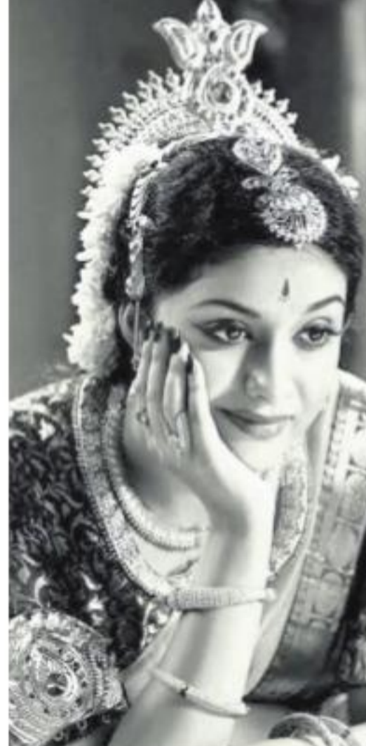
టాటూలతో అసలు గుర్తుపట్టడానికి వీలులేకుండా అతడిని మార్చేసింది ప్రోస్టెటిక్ మేకప్. అలాగే మహానటి సినిమాలో సావిత్రీ పాత్రకోసం కీర్తి సురేష్ సైతం ఈ మేకప్ వేసుకుంది.

2017లో విడుదలైన రోమాంటిక్ థ్రిల్లర్ రాజ్ కుమార్ 324 ఏళ్ల వయసున్న వ్యక్తిగా కనబడతాడు. ముడుతలతో సాధారణంగా హీరోయిన్లు ప్రోస్టెటిక్ మేకప్ వేసుకోవడం కానీ తన ఫేస్ మార్చింది ఏడు నుండి ఎనిమిది గంటలపాటు వేసుకుని నటించిన ఆమె తెలిపింది. చెమటలు పట్టి దురదలు వచ్చేవని మొట్టమొదట కూడా చచ్చాయని... కానీ తెర మీద అద్భుతంగా కనిపించింది ఆమె తెలిపింది.