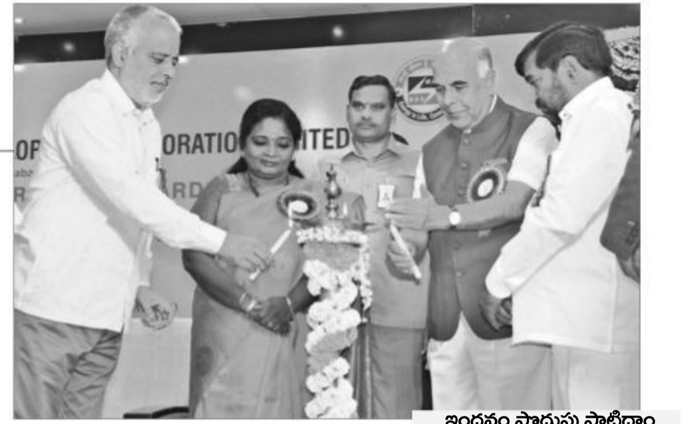
ఇంద్రం పాదుపు పాటిద్దాం పర్యావరణాన్ని కాపాడుద్దాం గవర్నర్ తమిళిసై

చేయకుండా సంవత్సరం పాటు నిర్వహించేందుకు చర్యలు చేపట్టినట్లు ప్రకటించారు. తప్పిపోయిన పిల్లలను, ట్రాఫిక్ లో గుర్తించిన పిల్లలు, బాల కార్యకలాపాలు ఉన్నవారిని గుర్తించి వారి తల్లిదండ్రులకు అప్పగించడం అనేది గొప్ప కార్యమని, ఈ విషయంలో కేవలం ఉద్యోగం చేస్తున్నామనే భావనతో కాకుండా మానవతా దృక్పథం, విశ్వసనీయతతో విధులను నిర్వహించేందుకు సత్ఫలితాలు వస్తాయన్నారు. పసిపిల్లల అక్రమ రవాణాకు పాల్పడే వారిపై అత్యంత కఠినంగా వ్యవహరించాలని పోలీస్ అధికారులకు మహేందర్ రెడ్డి సూచించారు. ఆపరేషన్ స్మైల్-6 కార్యక్రమ నిర్వహణలో పోలీస్ శాఖ ఇతర సంబంధిత శాఖలను సమన్వయం చేసుకుని ముందుకు వెళితే సత్ఫలితాలు వస్తాయని స్పష్టం చేశారు. బాలలను వెంట్రూప్ కాకుండా అవసరమైన వారికి దీర్ఘకాలిక చాగీ గులు కక్షా చూపే విధంగా చర్యలు చేపట్టాలని అవసరం ఉందన్నారు. మహిళా శిశు