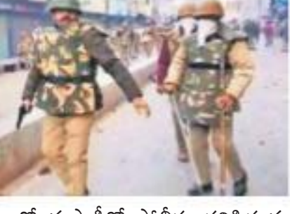
వీడియోలో తుపాకీతో పోలీసు కనిపిస్తున్న మాట వాస్తవమే.

న్యూఢిల్లీ, డిసెంబర్ 22: పౌరసత్వ సవరణ చట్టాన్ని (సీఏఏ) వ్యతిరేకిస్తూ ఉత్తరప్రదేశ్ లోని బాన్సర్గోలో జరిగిన నిరసన సందర్భంగా ఆందోళనకారులపై పోలీసులు కాల్వలు జరిపిన వీడియో ఒకటి వెలుగులోకి వచ్చింది. ఒక నిమిషం 37 సెకండ్ల నిడివి ఉన్న ఈ వీడియోను శనివారం తీశారు. ఓ పోలీసు తుపాకీతో ఆందోళనకారులపై కాల్వలు జరుపుతున్నట్లు ఈ వీడియోలో ఉన్నది. ఇదే సమయంలో కాల్వలు జరుపవద్దంటూ నిరసనకారులు కేకలు వేశారు. అయితే ఉత్తరప్రదేశ్ లో సీఏఏ నిరసనకారులు, పోలీసులకు మధ్య జరిగిన ఘర్షణ సందర్భంగా 17 మంది మరణించిన విషయం తెలిసింది. ఈ నేపథ్యంలో ఆందోళనకారులపై పోలీసులు జరిపినట్లు ఉన్న వీడియో వెలుగులోకి రావడం తీవ్ర చర్చనీయాంశంగా మారింది. దీనిపై బాన్సర్గో రేజ్ ఇన్ షిఫ్ట్ (కాంట్రీబ్యూటర్) ప్రసిడింటు తాము కాల్వలు జరుపలేదని చెప్పారు. 'నిరసనకారులను చెదరగొట్టడానికి పోలీసులు లాఠీచార్జి చేశారు. బాన్సర్గోయింపును ప్రయాణించారు. అంతేగానీ కాల్వలు జరుపలేదు.'