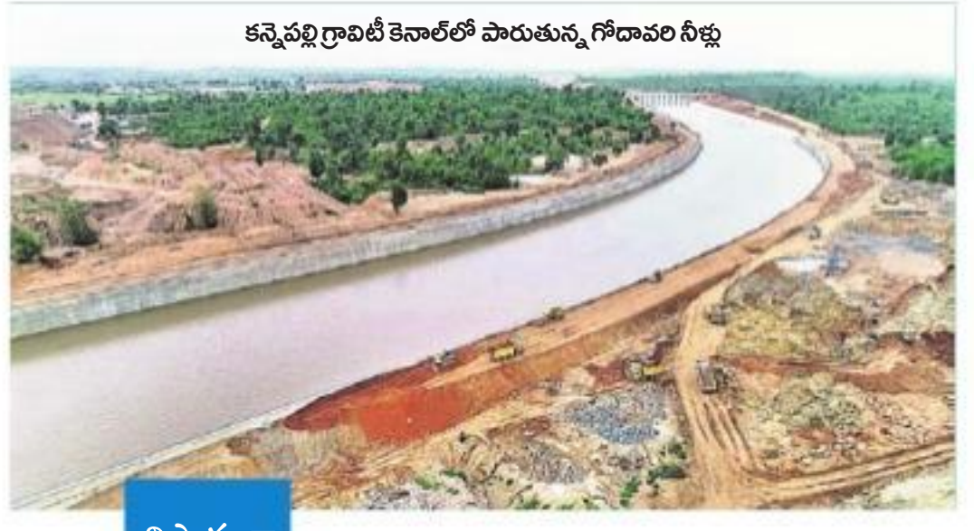
కనైవర్ల గ్రామంలో కెనాల్ పారుతున్న గోదావరి నీళ్లు

సీఎం కేసీఆర్ ఆశయ సాధన దిశగా వేగంగా అడుగులు.. ఈ ఏడాదిలో గోదావరి జల వినియోగం 200 టీఎంసీలు రిజర్వాయర్లలో మరో 200 టీఎంసీలకు పైగా నిల్వ ఉన్న నీరు.. కాశేశ్వరంతో మారుతున్న తెలంగాణ జల ముఖచిత్రం త్వరలోనే 400 టీఎంసీలకు చేరనున్న వినియోగం