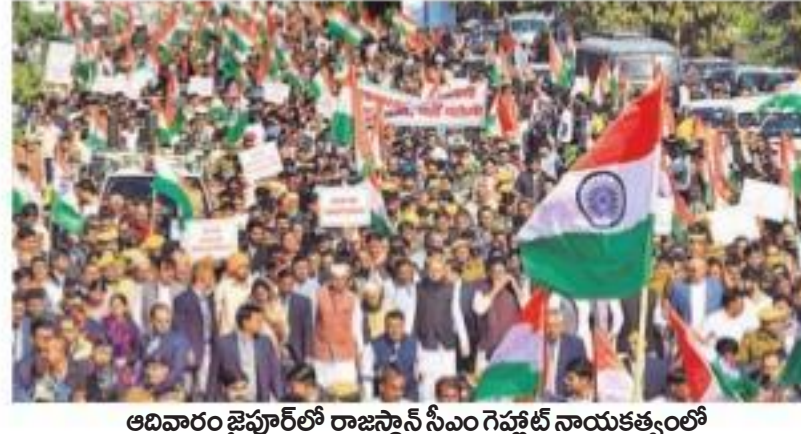
అధికారం జైహింద్ లో రాజస్థాన్ సీఎం గెవ్ హింద్ నాయకత్వంలో సీఎంకు వ్యతిరేకంగా జరిగిన ర్యాలీ దృశ్యం