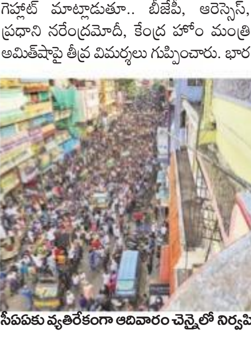
సీఏఏ వ్యతిరేకంగా అదివారం చెన్నైలో నిర్వహించిన మార్చ్ లోని కోల్కతాలో సీఏఏకు వ్యతిరేకంగా