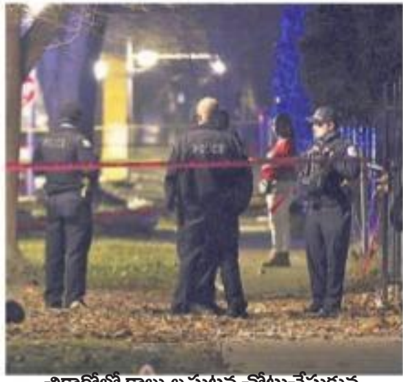
చికాగోలో కాల్వలు ఘటన చోటుచేసుకున్న ప్రాంతంలో పోలీసులు