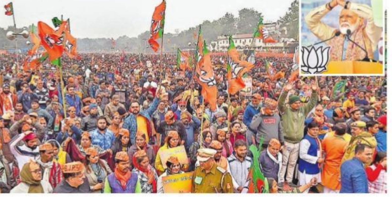
అదివారం ఢిల్లీలోని రామలిలా మైదానంలో నిర్వహించిన సభకు హాజరైన బీజేపీ కార్యకర్తలు.. (ఇన్సైట్) నమస్కరిస్తున్న ప్రధాని మోదీ

మాత్రమే అమలు చేశామని వెల్లడించారు. దేశ వ్యాప్తంగా ఎన్ఎస్ఆర్ అమలు గురించి పార్లమెంట్ లో దేశ క్యాబినెట్ లో ఎప్పుడూ చర్చించలేదని స్పష్టం చేశారు. ఎన్ఎస్ఆర్ తోపాటు పౌర సత్వ సవరణ చట్టం (సీఏఏ)కు వ్యతిరేకంగా దేశవ్యాప్తంగా జరుగుతున్న నిరసనలు కొన్ని చోట్ల హింసాత్మకంగా మారి కొందరు మరణించిన నేపథ్యంలో ప్రధాని వ్యాఖ్యలు ప్రాధాన్యం సంతరించుకున్నాయి. పౌరసత్వ సవరణ చట్టం (సీఏఏ), ఎన్ఎస్ఆర్ భారతీయ ముస్లింలకు అనుకూలమే ముప్పులేదని మోదీ అన్నారు.