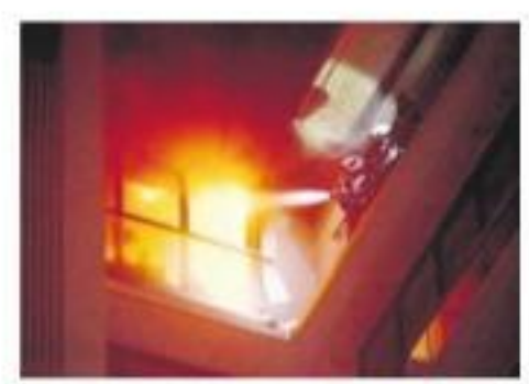
ముంబై, డిసెంబర్ 22: మహారాష్ట్ర రాజధాని ముంబైలో భారీ అగ్నిప్రమాదం సంభవించింది. ఈ ఘటన అదివారం సాయంత్రం విల్ఫింజ్ ప్రాంతంలోని 13 అంతస్తుల లాల్ శ్రీవల్లి భవనంలో చోటుచేసుకుంది. భవనంలోని 7, 8వ అంతస్తుల్లో ఒక్కసారిగా మంటలు చెలరేగాయి. దీంతో పలువురు ఈ మంటల్లో చిక్కుకున్నట్లు తెలుపబడింది. మరోవైపు మంటలు భారీగా ఎగిసిపడడంతో నల్లటి పొగ ఆ ప్రాంతాన్ని కమ్మింది.

నాయి. ఐదుగురిని రక్షించిన సహాయక సిబ్బంది.. భవనంలో ఇంకా ఎవరైనా చిక్కుకున్నారా అన్న విషయాన్ని పరిశీలిస్తున్నారు. ప్రమాదానికి గల కారణాలు, క్షణగాత్రుల వివరాలు ఇంకా వెల్లడికాలేదు. ఈ భవనంలో పలు కార్యాలయాల కూడా ఉన్నాయి. అయితే అదివారం కావడంతో కార్యాలయాల మూసి ఉన్నాయి. లేకుంటే ప్రమాద తీవ్రత పెరిగేది. మరోవైపు మంటలు భారీగా ఎగిసిపడడంతో నల్లటి పొగ ఆ ప్రాంతాన్ని కమ్మింది.