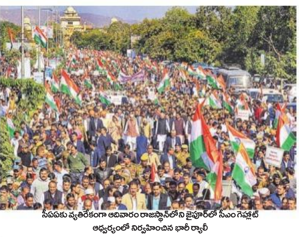
సీఏఏ వ్యతిరేకంగా అదివారం రాజస్థాన్ లోని జైపూర్ లో సీఏఏ గెజట్ లో అధ్యక్షులలో నిర్వహించిన భారీ ర్యాలీ

న్యూఢిల్లీ: పౌరసత్వ సవరణ చట్టం(సీఏఏ)పై దేశ వ్యాప్తంగా ఆందోళనలు కొనసాగుతున్నాయి. జాతీయ పౌర పట్టిక (ఎన్ఎస్ఆర్), సీఏఏకు వ్యతిరేకంగా అదివారం రాజస్థాన్ లోని జైపూర్ లో ఆ రాష్ట్ర ముఖ్యమంత్రి అశోక్ గెహ్లాట్ నేతృత్వంలో భారీ నిరసన ర్యాలీ నిర్వహించారు. సుమారు 3 లక్షల మంది ఈ ర్యాలీలో పాల్గొన్నారు. దేశ రాజధానిలో పలు చోట్ల ప్రదర్శనలు జరిగాయి. ఢిల్లీలోని జంతర్ మంతర్ వద్ద ఈశాన్య రాష్ట్రాలకు చెందిన ప్రజలు నిరసన చేపట్టారు. సీఏఏ వ్యతిరేక ఆందోళనలకు హిందూ-ముస్లిం రంగు పులి మారని, తమ గొంతుకును విప్పించారని ఆవేదన వ్యక్తంచేశారు. మరోవైపు ఆసోలో కాంగ్రెస్ పార్టీ 800 కి.మీ. పాదయాత్రకు శ్రీకారం చుట్టింది. మజిలూర్ లోని దక్షిణ ఇంఫాల్ లో అక్కడి ప్రభుత్వం చెండు నెలలపాటు నిషేధాజ్ఞలు విధించింది. కర్ణాటక, మహారాష్ట్రలో సీఏఏకి అనుకూలంగా ర్యాలీలు జరిగాయి. బెంగళూరులో సీఏఏ అనుకూల ర్యాలీలో పాల్గొన్న వస్తున్న యువకుడిపై దుండగులు దాడిచేశారు.