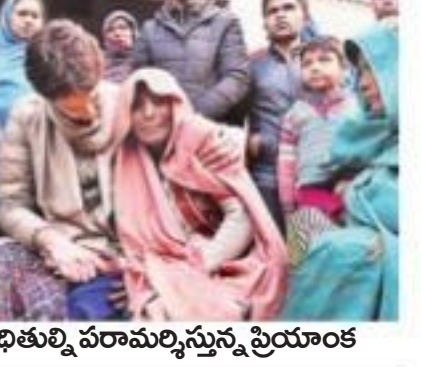
బాధితుల సరామర్శను సైయాంక

న్యూఢిల్లీ: ప్రధాని మోదీ, కేంద్ర హోం మంత్రి అమిత్ షా దేశ యువత భవిష్యత్ నాశనం చేశారని కాంగ్రెస్ నేత రాహుల్ గాంధీ ధ్వజం వేశారు. పౌరసత్వ సవరణ చట్టం (సీఏఏ), జాతీయ పౌర జాబితా (ఎన్ఎస్ఆర్)పై మైనార్టీలు, వేదలను రెక్కగొడుతూ విషజ్వాల దుర్బ్రువారం చేస్తున్నాయని ఢిల్లీలో జరిగిన సభలో ప్రధాని మోదీ దుయ్యబట్టిన నేపథ్యంలో రాహుల్ ఈ వ్యాఖ్యలు చేశారు. 'ప్రియమైన యువతీయమవల్లారా.. మోదీ, షా మీ భవిష్యత్ నాశనం చేశారు. ఉద్యోగాలు తెలుసుకోవాలన్నారు. భారత్ లోని ముస్లింలకు ఎన్ఎస్ఆర్, సీఏఏతో ఎలాంటి సంబంధం లేదని, ఎవరి హక్కులనూ హరించలేదని చెప్పారు. పౌరజాబితాదారులు ఎప్పుడూ బయటపడలేదని కానీ, శరణార్థులు తమ గుర్తింపును ఎప్పుడూ దామకోలేదన్నారు. మతం ప్రతి పాదకన ఏ పథకమూ ప్రవేశపెట్టలేదని, దమ్ముంటే తన పనితీరులో వివక్షను ఎత్తిచూపాలని ప్రతిపక్షాలకు సవాల్ విసిరారు.