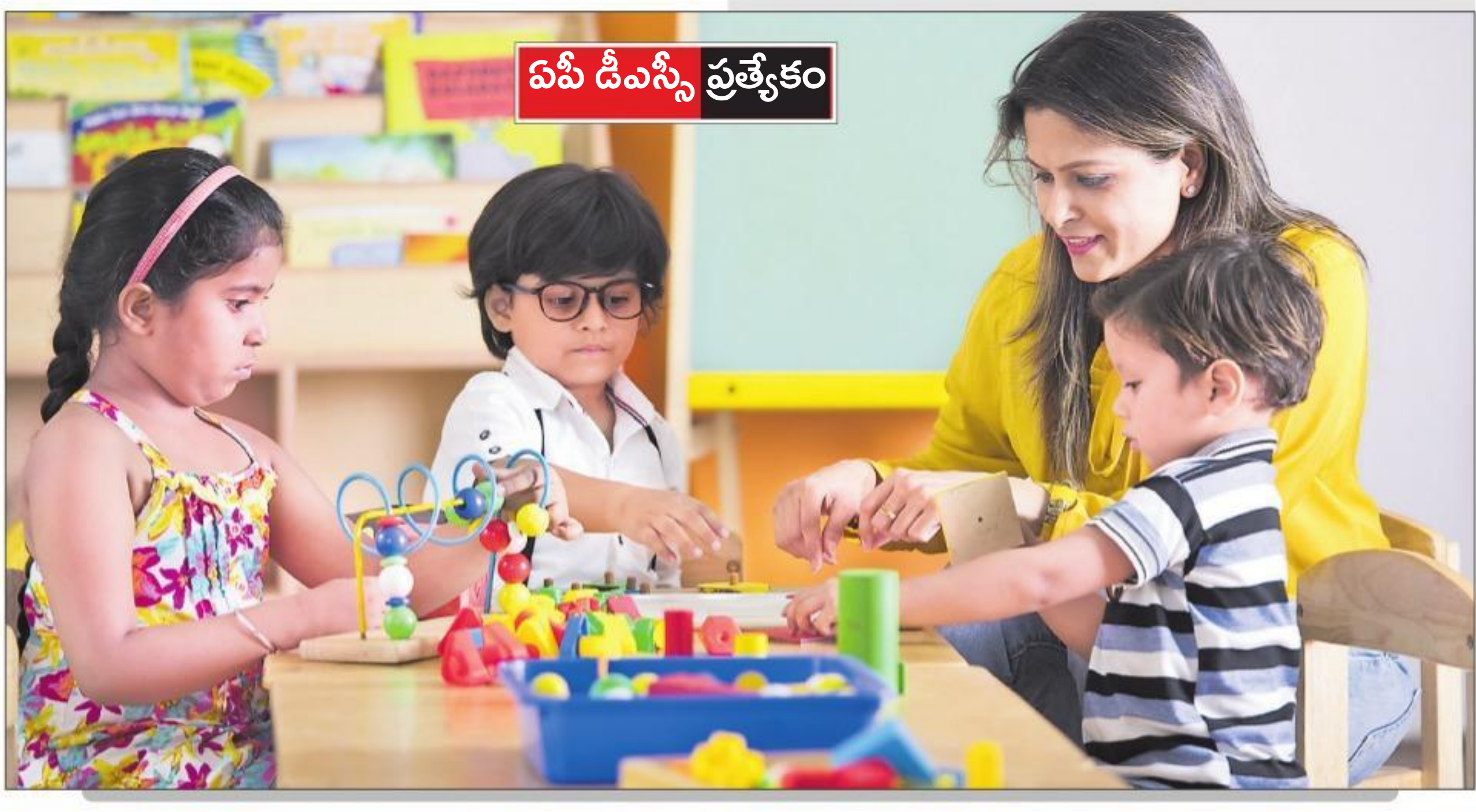
ఏపీ డీఎస్సీ ప్రత్యేకం

ప్రపరేషన్ ఇలా పరీక్ష స్వరూపం ఎలా ఉన్నా... టిపీ కమిటీ ఆర్డర్ పేరిట నిర్వహించినా... లేదా టిపీ లేదా టీఆర్డీ వేర్వేరుగా జరిగినా... డీఎస్సీలో ఆయా కేటగిరీలకు సంబంధించి సబ్జెక్టులు ఒకే విధంగా ఉండే అవకాశం ఉంది. కాబట్టి అభ్యర్థులు ఇప్పటి నుంచే తమ కనకత్తును ప్రారంభించాలి. కేటగిరీల వారీగా, సబ్జెక్టుల వారీగా పటిష్ట ప్రణాళిక రూపొందించుకొని ప్రపరేషన్ సాగించాలి.