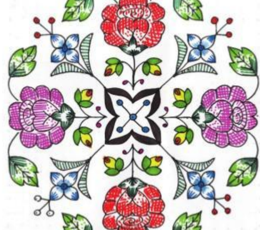
ముగ్గులు పంపవలసిన చిరునామా: ముగ్గు-ముచ్చట, సాక్షి ప్యామిలీ, సాక్షి టవర్స్, రోడ్ నెం.1, బంజారాహిల్స్, హైదరాబాద్-34, muggulu.sakshi@gmail.com

19 చుక్కల నుంచి 11 చుక్కల వరకు (మధ్య నలిమిక్కు)