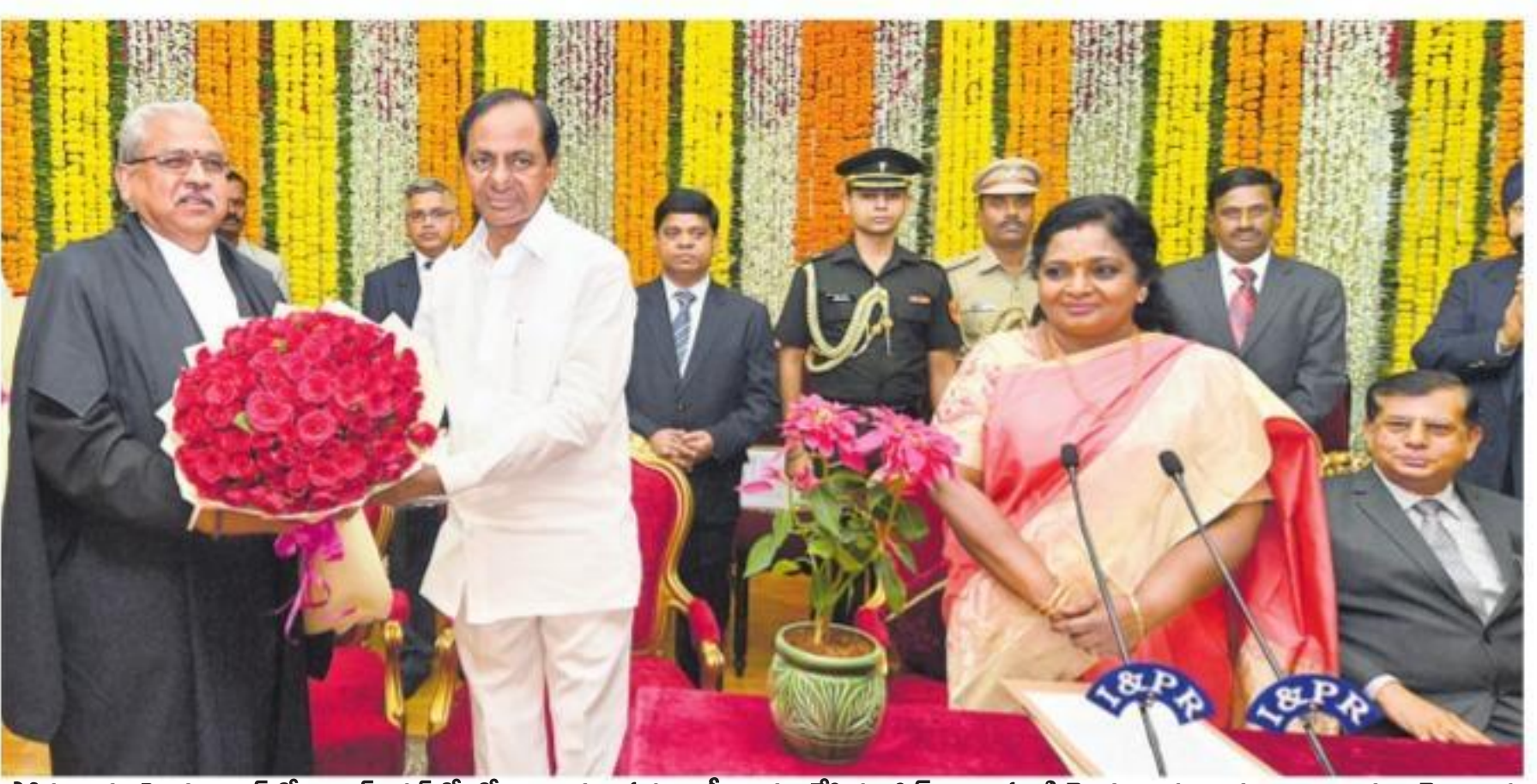
సోమవారం హైదరాబాద్ లోని రాజీభవన్ లో లోకాయుక్తగా ప్రమాణ స్వీకారం చేసిన జస్టిస్ చింతపంటి వెంకటరాములుకు శుభాకాంక్షలు చెబుతున్న సీఎం కేసీఆర్. చిత్రంలో గవర్నర్ తమిళసై, హైకోర్టు ప్రధాన న్యాయమూర్తి జస్టిస్ రాఘవేంద్రసింగ్ చౌహాన్ తదితరులు

పర్యావరణ అనుమతులు జారీ సాక్షి హైదరాబాద్: రాష్ట్రంలో కొత్తగా మరో భారీ ధర్మల్ విద్యుత్ ఫ్లాంట్ నిర్మాణం కానుంది. సింగరేణి బొగ్గు గనుల సంస్థ ఆధ్వర్యంలో మంచినీటిని ఉత్పాదించే 800 మోగావాట్ల ధర్మల్ విద్యుత్ కేంద్ర నిర్మాణానికి పర్యావరణ అనుమతులు లభించాయి. జైపూర్ లో ఇప్పటికే సింగరేణి సంస్థ నిర్మించిన 1200 (2x600) మోగావాట్ల సింగరేణి ధర్మల్ విద్యుత్ కేంద్రం నుంచి విద్యుత్తు ఉత్పాదించడం, అక్కడే రూ.5,879.62 కోట్ల అంచనా వ్యయంతో 800 మోగావాట్ల కొత్త ఫ్లాంట్లను సంస్థ నిర్మించనుంది. ఈ ఫ్లాంట్ నిర్మాణానికి పర్యావరణ అనుమతులు జారీ చేస్తూ కేంద్ర పర్యావరణ, అటవీ, పాతావరణ మార్పుల మంత్రిత్వ శాఖ ఈ నెల 18న ఉత్తర్వులు జారీ చేసింది. ఈ ఫ్లాంట్ నిర్మాణం పూర్తయితే 550 మందికి ఉద్యోగావకాశాలు లభించనున్నాయి. ఈ ఫ్లాంట్ కు ఒడిశాలోని నైని బొగ్గు గని నుంచి బొగ్గు తీరాలింపవలసిన కేంద్రం జరిపింది. ఈ విద్యుత్ ఫ్లాంట్ నుంచి వెలువడే కాలుష్యాన్ని నియంత్రించడం, పరిసర ప్రాంతాల్లో పర్యావరణాన్ని పరిరక్షించడం కోసం రూ.1,128.756 కోట్ల వ్యయంతో వివిధ రకాల నిర్మాణాలను చేపట్టాలని కేంద్ర పర్యావరణ మంత్రిత్వ శాఖ ఆదేశించింది.