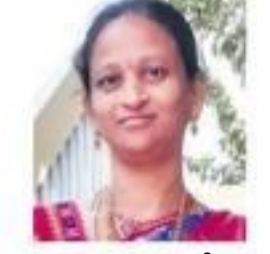
బొడ్డు రూపి, చౌటుప్పల్, యాదాద్రి భువనగిరి జిల్లా