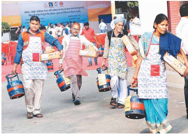
एला से प्री डे एलकीनी (एक्ट्रेस) के सहायियों को बटा गवा मिला फूल व विरहेश

लखडुवाल के रूप में बताई और दो करोड़ रुपये माँगे। कारोबार को धमकी दी कि अगर वह भुगतान नहीं करता तो उसकी हत्या कर दी जाएगी। बाद में कारोबारी को उसी नंबर से कई फोन आए, लेकिन उसने फोन उठाना नहीं। अधिकारियों ने बताया कि बाद में उसे डेक्रेट संदेश आने लगे, जिसमें कहा गया कि वह फोन नहीं उठा रहा है। साथ ही संदेशों में भीरो की मांग दोहराई गई। कारोबारी ने शनिवार देर रात जायारपेट थाने में शिकायत दर्ज करवाई। नावकर ने बताया कि भारतीय दंड संहिता की भाग 385 और 387 के तहत मामला दर्ज कर लिया गया है। उन्होंने कहा कि मामले में अब कुछ किस्मों की गिरफ्तारी नहीं हुई है और इस संबंध में जांच जारी है। लखडुवाल अपना गिरावट बनाने से पहले अंडरवर्ल्ड डॉन दाइज इरामिया के लिए काम करता था और