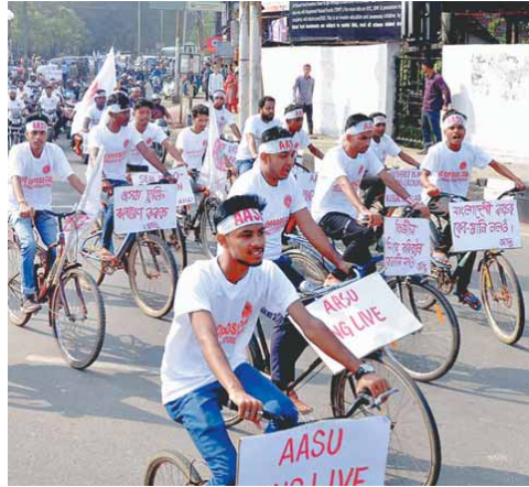
गुवाहाटी में नागरिकता बिल के विरोध में साइकिल रैली निकालने असम स्टूडेंट युनिवर्स के सदस्य

चंद्रपुर (भाषा)। महाराष्ट्र के चंद्रपुर जिले से एक महिला सहित तीन लोगों को काला जादू करने के आरोप में गिरफ्तार किया गया है। पुलिस से बचने के लिए यहाँ भाग आया। संसद