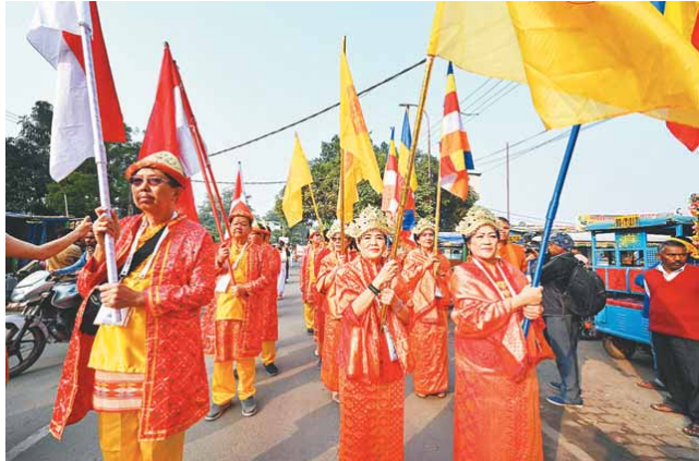
योगेश्या में महाबारी मंदिर में आयोजित एक कार्यक्रम में पहुंचे इंडोनेशिया के बौद्ध भिक्षु

हालांकि शीघ्र अदालत को चुनावों के लिए अधिपूचना जारी करने के बारे में जानकारी दी थी लेकिन उसने कानूनी अनिश्चयताओं का पालन नहीं किया है। कानूनी अनिश्चयताओं के रहत सभी स्थानीय निकायों के प्रत्येक बरग का परिचयन करने के साथ ही गार पंचायत, नगरपालिका या नगर निगम के अध्यक्ष या महापौर के पद के लिए आरक्षण और वास्तवता नीति नियंत्रण करने की प्रक्रिया परिसमन आयोग और राज्य सरकार को पूरी करने है और निर्वाचन आयोग को पूरे करना है। याचिका में कहा गया है कि चुनाव को अधिपूचना जारी करने से पहले इन कानूनी प्रक्रिया पर अमल जरूरी है। याचिका में आरोप लगाया गया है कि राज्य सरकार चुनाव करने के मामले में अभी तक अनुत्तरदायी अपना रहा है लेकिन उसने नौ विली नए नए याचों के लिए परिसमन का काम नहीं किया है।