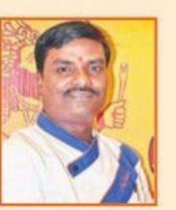
సతీష్ ఎగ్రిక్యూల్చరల్ చెప్ట్ కృష్ణపట్నం జూనియర్ కాలేజీ నం. 36 హైదరాబాద్

తయారీ: ముందుగా గిన్నెలో వీరు పోసి సరిపడా ఉప్పు వేసుకొని మొక్కజొన్న కంకులను ఉడికించుకోవాలి. వాటిని చిన్నముక్కలుగా కట్ చేసుకోవాలి. మరొక గిన్నెలో సరిపడా నూనె పోసి కలిపిన మిశ్రమం డీప్ ఫ్రై చేసుకోవాలి. ఈ క్రమంలో మరొక గిన్నె తీసుకొని అందులో 2 టీస్పూన్ల నూనె వేసి పచ్చిమిర్చి, వెల్లుల్లి ముక్కలు, ఉల్లిగడ్డ ముక్కలు, కరివేపాకు వేసి దోరగా వేయించుకోవాలి. దోరగా వేగిన తర్వాత డీప్ ఫ్రై చేసుకొన్న మిశ్రమం, మొక్కజొన్నముక్కలు కలుపుకొని ఉప్పు, కారం సరిపాసుకోవాలి. తర్వాత కొత్తిమీరతో సర్వ్ చేసుకుంటే ఎంతో రుచికరమైన మొక్కజొన్న ప్లే తయారయినట్లే.