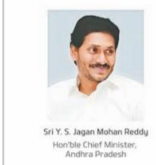
Sri Y. S. Jagan Mohan Reddy Hon'ble Chief Minister, Andhra Pradesh