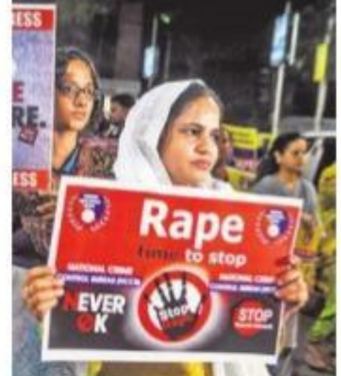
దిశ హత్యాచారంపై బుధవారం కోర్టులో మహిళల ర్యాలీ దృశ్యం

హైదరాబాద్, నమస్తే తెలంగాణ / సిటీబ్యూరో / మహబూబ్ నగర్ లో: అత్యంత దారుణంగా లైంగికదాడి, హత్యకు గురైన దిశ కేసులో బాధిత కుటుంబసభ్యులకు సత్వర న్యాయం అందించేందుకు, నిందితులకు వేగంగా శిక్ష పడేందుకు రాష్ట్ర ప్రభుత్వం ఫాస్ట్ ట్రాక్ కోర్టును ఏర్పాటుచేసింది. దిశ కేసులో ఫాస్ట్ ట్రాక్ కోర్టు ఏర్పాటుచేస్తూ మని ఇటీవల ముఖ్యమంత్రి కే చంద్రశేఖర్ రావు ప్రకటించిన విషయం తెలిసింది. ఈ కేసులో బాధిత కుటుంబ సభ్యులకు సత్వర న్యాయం అందించడంలోపాటు నిందితులకు వేగంగా శిక్ష పడేలా చర్యలు తీసుకోవాలని ముఖ్యమంత్రి అధికారులను ఆదేశించారు. ఈ మేరకు హైకోర్టుతో న్యాయశాఖ సంప్రదింపులు జరిపింది. హైకోర్టు ఆమోదంతో ఈ కేసులో విచారణకు ప్రత్యేకంగా ఫాస్ట్ ట్రాక్ కోర్టును ఏర్పాటుచేస్తూ న్యాయశాఖ కార్యదర్శి ఏ సంతోషరెడ్డి బుధవారం ఉత్తర్వులు జారీచేశారు. మహబూబ్ నగర్ ఒకటో అదనపు జిల్లా సెషన్స్ జడ్జి కోర్టును ఫాస్ట్ ట్రాక్ కోర్టుగా గుర్తిస్తున్నట్లు ఉత్తర్వుల్లో పేర్కొన్నారు. దిశ కుటుంబ సభ్యుల పోలీస్ స్టేషన్లో సమాధిని కైం నంబర్ 784/2019 కేసుపై ప్రత్యేకంగా రోజువారీ విచారణ జరుగుతున్నది. గతంలో వరంగల్లో