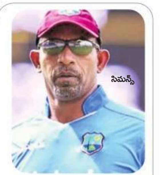
కోహ్లా వికెట్ ముఖ్యం

ఉప్పల్లో చెమటోడ్డిన భారత్, వెస్టిండీస్ విరాట్ వికెట్ కీలకమంటున్న విండీస్ కోచ్