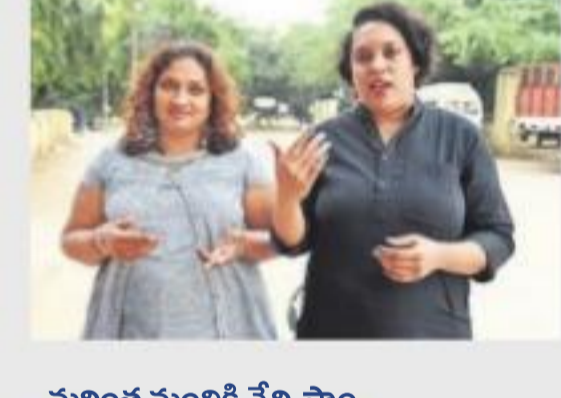
మరింత మందికి నేర్పిస్తాం..

కూర్చుకుంటున్నారు. తమ కార్యక్రమాలను సగరంలోని కొన్ని స్వచ్ఛంద సంస్థలకు తెలిపారు. వారి ద్వారా అనాధలు, ఎంటరి మహిళలకు శిక్షణ ఇస్తున్నారు. ఆసక్తి ఉన్న ఎవరికైనా శిక్షణ ఇచ్చేందుకు తాము సిద్ధమే అంటున్నారు.