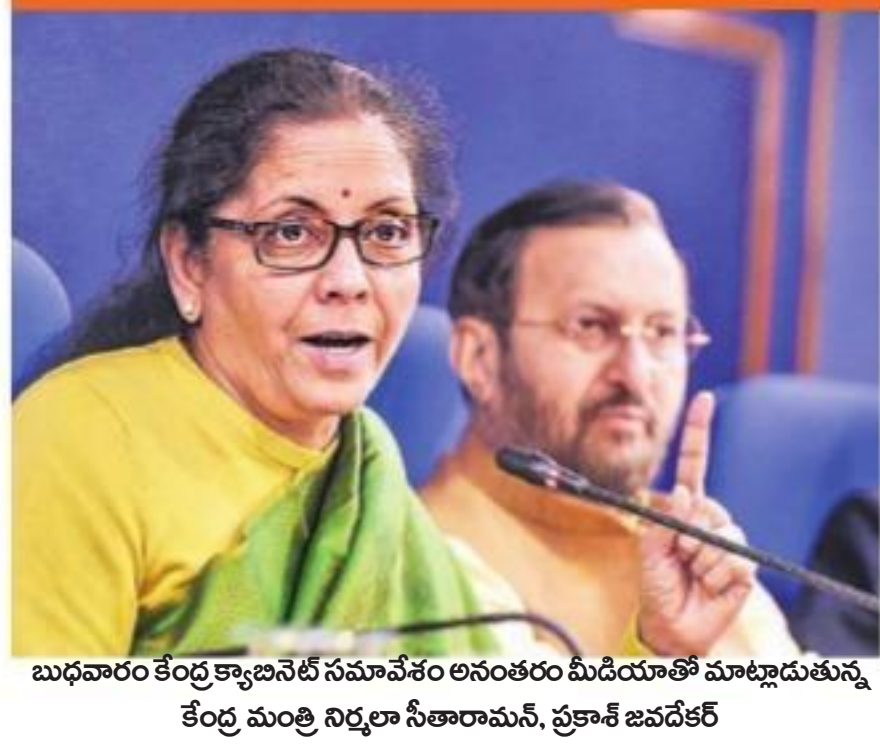
బుధవారం కేంద్ర క్యాబినెట్ సమావేశం అనంతరం మీడియాతో మాట్లాడుతున్న కేంద్ర మంత్రి నిర్మలా సీతారామన్, ప్రకాశ్ జవహర్