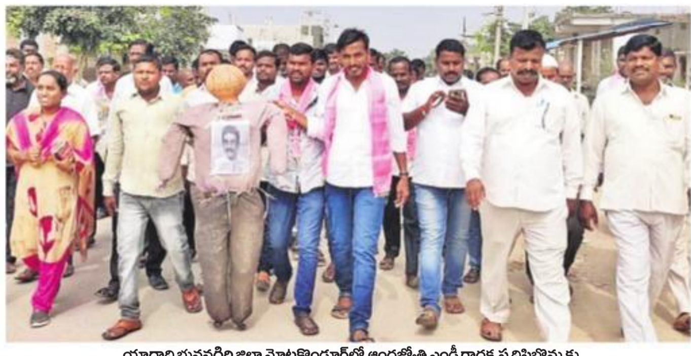
బొమ్మలరామారం మండల కేంద్రంలో ఆంధ్రజ్యోతి పత్రిక ప్రతులను దహనం చేస్తున్న టీఆర్ఎస్ మండల నాయకులు