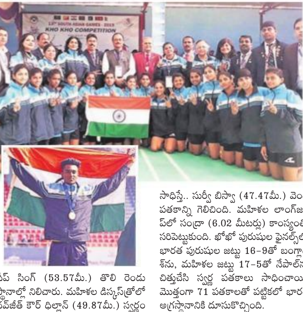
హైదరాబాద్, నమస్తే తెలంగాణ ఆట ప్రతినిధి: