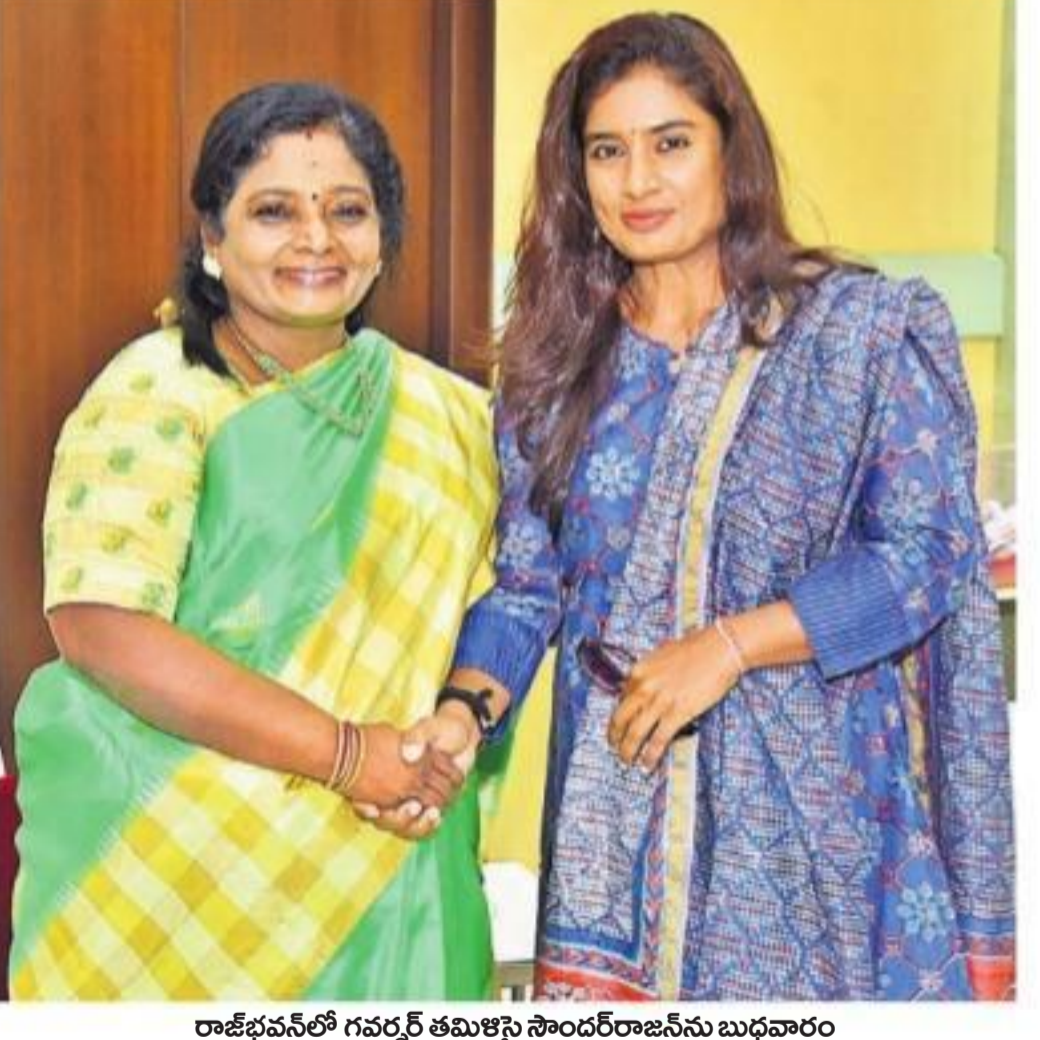
రాజ్ కవల్ గవర్నర్ కమిషన్ సోదరరాజ్ ను బుద్ధవారం మర్యాదపూర్వకంగా కలుసుకున్న భారత్ మహిళల వన్ డే జట్టు కెప్టెన్ మిథాలి రాజ్

అధిల్డె: టెస్టులో విండీస్ దిగ్గజం ట్రయన్ లారా చేసిన 400 పరుగుల రికార్డును అది గమించేందుకు తనకు మరో అవకాశం తప్పకుండా వస్తుంది అనే నీ విద్యంసకర ఓపెనర్ డేవిడ్ వార్నర్ ఆశాభావం వ్యక్తం చేశాడు. ఇటీవలే పాకిస్తాన్ పై రెండో టెస్టులో వార్నర్ 335 పరుగులతో ఆజేయంగా ఉన్న సమయంలో కెప్టెన్ టీమ్ పైన్ ఇన్నింగ్స్ డిక్లర్ చేసిన సంగతి తెలిసింది. త్రితరక బాదిన అనంతరం లారాను వార్నర్ కలిశాడు. ఈ ఫాలోలోను ఇన్ స్ట్రాగ్ మేలో అప్పుడు కున్న ఆతడు దిగ్గజాన్ని కలవడం వచ్చు తంగా అనిపించింది. 400 పరుగుల రికార్డును చెరిపేందుకు నాకు మరో అవకాశం తప్పకుండా వస్తుంది' అని పోస్ట్ చేశాడు. ట్రయన్ కూడా ఫాలోను ఇన్ స్ట్రాలో పోస్ట్ చేసి '735 నాటో' అని రాశాడు.