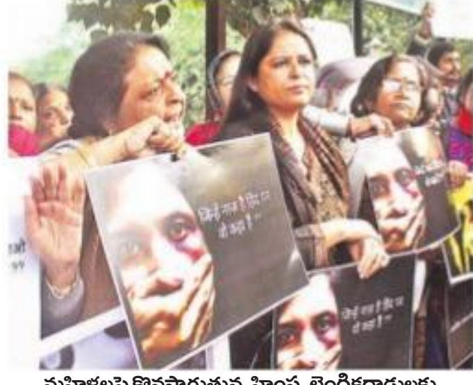
మహిళలపై కొనసాగుతున్న హింస, లైంగికదాడులకు నిరసనగా లక్నోలో గురువారం ప్రదర్శన డ్యూయం

అకాశంలో సగం.. కన్నీరు పెడుతున్న వేళ.. దశ 'దిశ'లా ఆక్రందనలు! నిర్భయలోకంలో అంతే తేలి ఆవేదనలు.. ఆగని అమానుషాలు! ఒకటి పరిచిపోకముందే మరొకటి దుర్భాషలు! ఒకచోట చితులు ఆరకముందే మరోచోట బుగ్గయిపోతున్న బతుకులు! రాముడొచ్చినా నేరాలు ఆపలేదని చేతులెత్తేస్తున్న మంత్రుల సాక్షిగా.. నడిరోడ్డుపై తగలబడిపోతున్న దేహాల అనహాయ మృత్యుసాక్షులు! వీటికి అంతే కృడ అంటూ ప్రశ్నిస్తున్న మరణాలు.. ఘోరాలు! యూపీలోని ఉన్నావేలో ఏడాదికితం లైంగికదాడికి గురైన బాధితురాలు.. అదే కేసులో నిందితుల దాష్టీకానికి గురువారం నడిరోడ్డుపై అగ్నికే లాల్ దహించుకుపోయింది.. 90% ఒళ్లు కాలిపోయి చావుబతుకుల్లో కొట్టుమిట్టాడుతున్నది! హైదరాబాద్ లో దిశపై జరిగిన దుర్భాషాన్ని తలపెట్టే బెంగాల్ లోని మాలాలో ఓ యువతి హత్యాచారానికి గురై.. గుర్తుపట్టలేనంతగా మసి