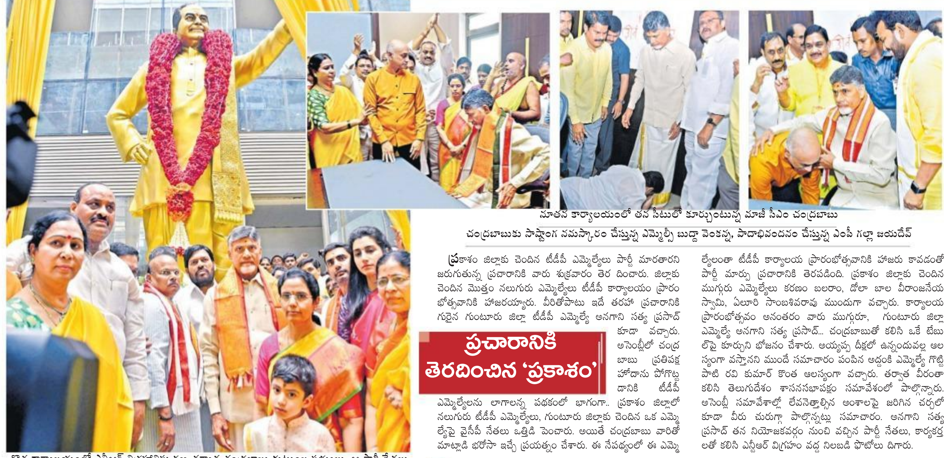
నూతన కార్యాలయంలో తన సేవలో కూర్చుంటున్న మాజీ సీఎం చంద్రబాబు