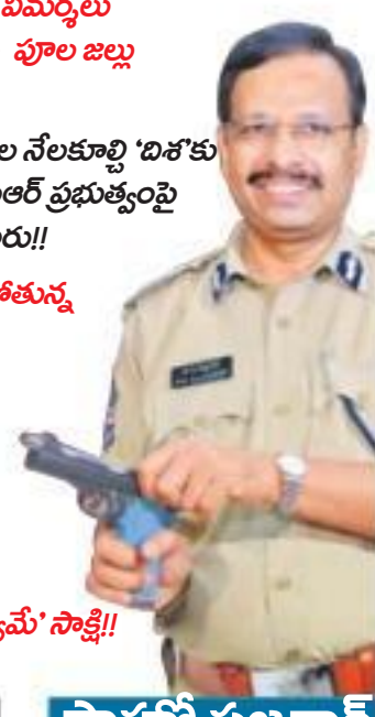
సాహసీ సజ్జనార్ జనం సీరాజనం

దిశ హత్యచారం కేసు.. మొదలైన చోటే ముగిసింది! చీకటి మాటున కాటు వేసిన చీడపురుగులు ఆమెను దహనం చేసిన చోటే.. నిందితులపై ఆఖరి వేటు పడింది!! ఆమెను కాల్చిన 'తెల్లవారుజాము' సమయంలోనే.. ఆ నలుగురు పోలీసుల కాల్యంలో హతమయ్యారు! నేడు 'దిశ' దశ దిన కర్మ, ఆమె ప్రాణాలను బలిగొన్నవారు.. పదిరోజుల్లోనే అంతమయ్యారు!! నాడు పోలీసుల నిర్లక్ష్యంపై విమర్శలు కులపించినవారే.. ఖాళీలపై పూల జల్లు కురిపించారు!! మదమెక్కిన మగపురుషుల నెలకూర్చి 'దిశ'కు న్యాయం చేసినదంటూ కేసీఆర్ ప్రభుత్వంపై ప్రశంసల వర్షం కురిపించారు!! అప్పుడు.. త్రొక్కి కింద కాలిపోతున్న 'దిశ'ను చూసింది పాలవ్యాపారి సభ్యులు. ఇప్పుడు.. త్రొక్కి దగ్గర ఎన్కౌంటర్ గురించి ముందు తెలిసింది కూడా పాలవ్యాపారి సభ్యులుకే! అప్పుడు.. ఇప్పుడు.. 'సత్యం' సాక్షి!!