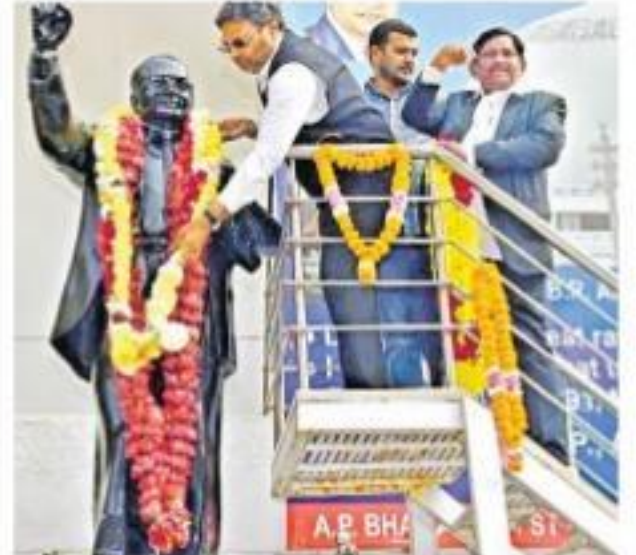
అంబేద్కర్ విగ్రహానికి పూలమాల వేసి వివాహం అర్పిస్తున్న కమిషనర్ పార్లమెంట్ హౌస్లో నివాళి అర్పిస్తున్న మోదీ