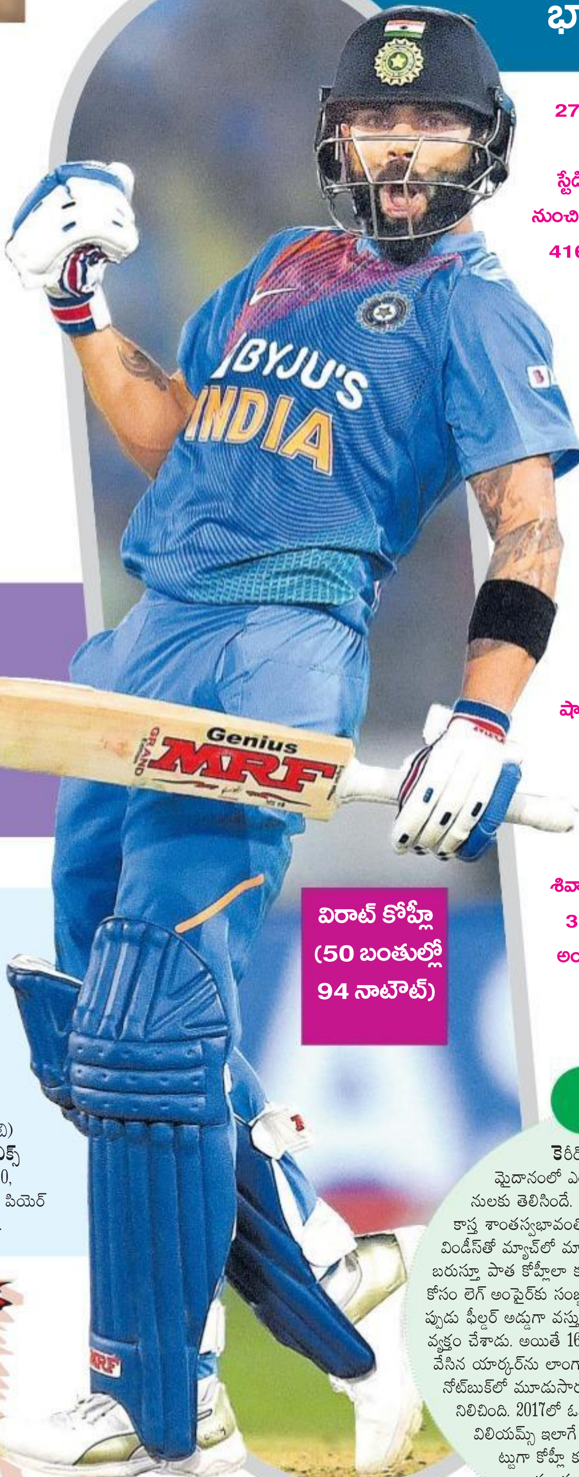
విరాట్ కోహ్లా (50 బంతుల్లో 94 నాటౌట్)

భారత్ లికార్డు ఛేదన • తొలి టీ20లో వెస్టిండీస్ పై విజయం