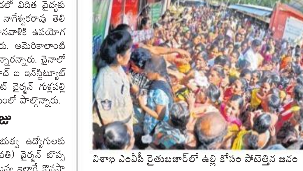
విశాఖ ఎంపిటీ రైలుబజారులో డల్లి కోసం హెచ్చెత్తిన జనం

అమరావతి, డిసెంబరు 6 (ఆంధ్రజ్యోతి): రాష్ట్ర పర్యావరణ సంస్థకు డైరెక్టరులు నియమిస్తూ ప్రభుత్వం శుభ్రవారం ఉత్తర్వులు ఇచ్చింది. అటువే శాఖ ముఖ్యకార్యదర్శి చైర్మన్, డైరెక్టర్లుగా కాలవ్య నియంత్రణ సంస్థ చైర్మన్, సభ్యకార్యదర్శి రమాణ. పరిశ్రమల శాఖకు కమిషనర్, గృహ నిర్మాణ, పర్యావరణ నిర్వహణ సంస్థల ఎంపీలను నియమించారు. పారిశ్రామిక, ఇతర వ్యర్థాల సేకరణ, పరాణ, నిర్వహణ, శుద్ధి వంటి కార్యక్రమాలను ఈ కమిటీ పర్యవేక్షిస్తుంది.