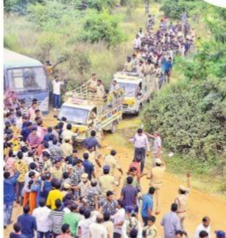
చటాన్ పల్లి నుంచి ఎన్కౌంటర్లో మృతి చెందిన నిందితుల మృతదేహాలను స్వాస్థీలో తీసుకెళ్తున్న పోలీసులు

తెల్లవారుజాము 5.00 గంటలు: దిశను దహనంచేసిన చటాన్ పల్లి బిడ్డ వద్దకు నిందితులను తీసుకొచ్చిన పోలీసులు