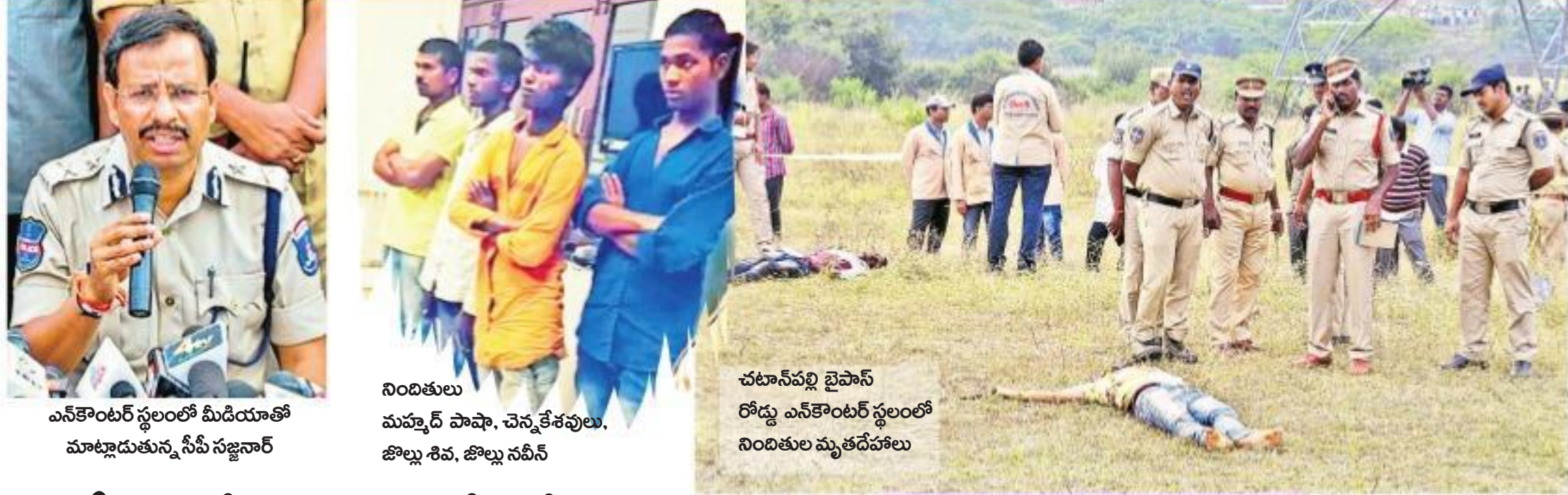
ఎన్కౌంటర్ స్థలంలో మీడియాతో మాట్లాడుతున్న సీపీ సజ్జనార్