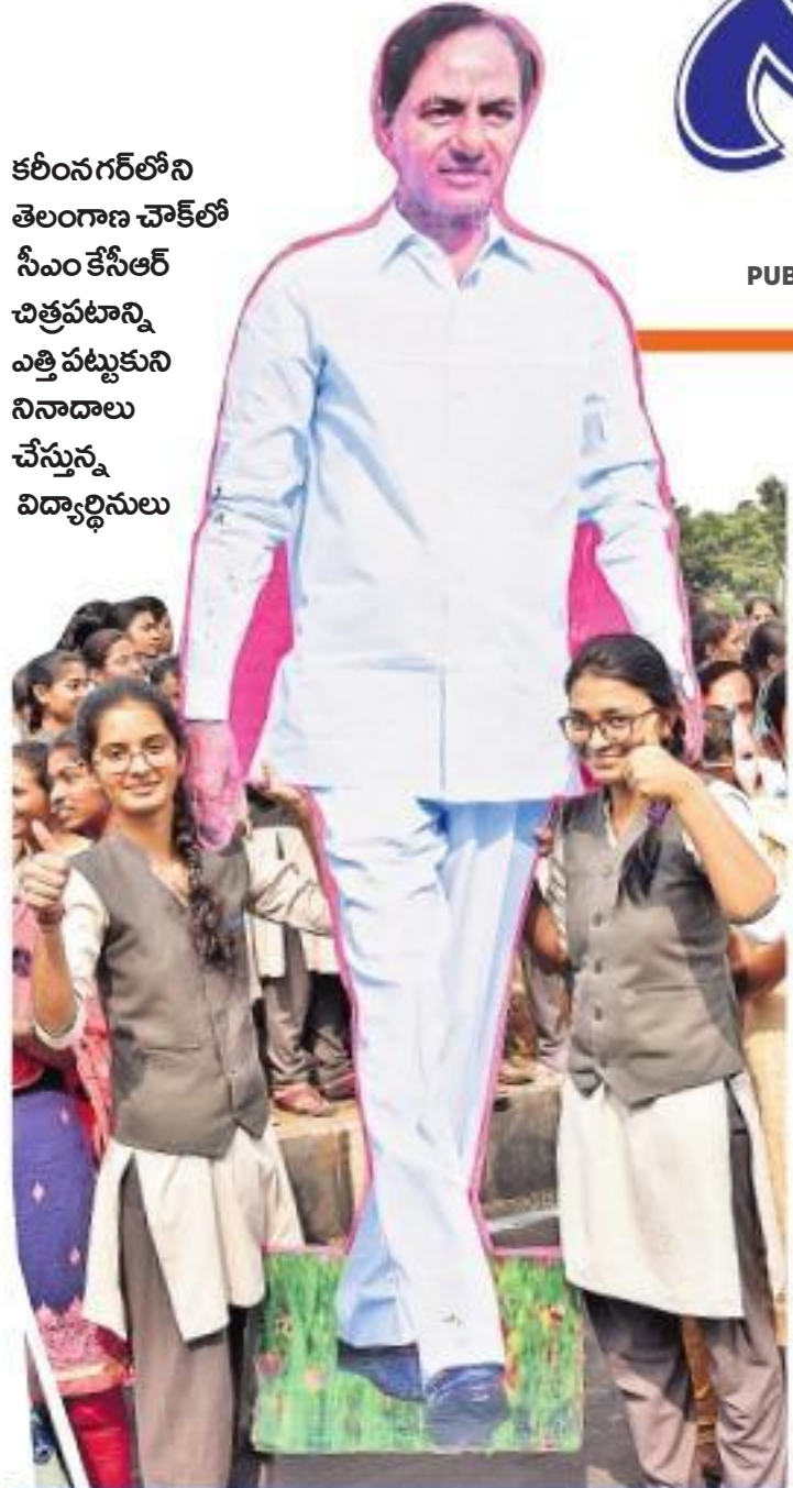
కరీంనగర్ లోని తెలంగాణ చౌకలో సీఎం కేసీఆర్ చిత్రపటాన్ని ఎత్తి చూపుకుని సినాదాలు చేస్తున్న విద్యార్థులు