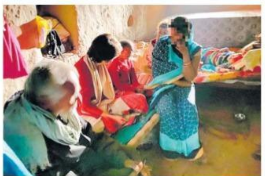
ఉన్నావో బాధితురాలి కుటుంబాన్ని పరామర్శిస్తున్న స్రీయాంకగాంధీ

వయనాడ్, డిసెంబరు 7: దేశంలో బోటుచేసుకుంటున్న అత్యాచార మల నలపై కాంగ్రెస్ నేత, ఎంపీ రాహుల్ గాంధీ ఆందోళన వ్యక్తం చేశారు. భారత్.. అత్యాచారాల రాజధానిగా మారిందని, ఆడబిడ్డలను ఎందుకు కాపాడుకో లేకపోతున్నారంటూ ఇతర దేశాలు ప్రశ్నిస్తున్నాయని అన్నారు. తెలంగాణలో హత్యాచార నిందితుల ఎన్కౌంటర్, ఉన్నావో అత్యాచార బాధితురాలి మృతి నేపథ్యంలో శనివారం రాహుల్ వయనాడ్లో కాంగ్రెస్ కార్యకర్తల సమావేశంలో స్పందించారు. దేశం మరో ఆడబిడ్డను కోల్పోయిందని, దేశంలో హింసను, ప్రత్యేకించి మహిళలపై దాడులను అరికట్టడంలో బీజేపీ ప్రభుత్వం విఫలమైందని ఆరోపించారు. రేపి కేసులో బీజేపీ ఎమ్మెల్యే ప్రమీల డిమాండ్.. ప్రధాని నోరు విప్పడంలేదని విమర్శించారు. ప్రతిరోజూ ఏదో ఒకచోట అత్యాచారాలు రేపి, లైంగిక దాడులకు గురవుతూనే ఉన్నారని, పైసారితో, దళితుల పట్ల హింస కూడా పెరిగిపోతోందని అన్నారు. హింసను, వివేచన లేని అధికారాలను బలంగా నమ్మే వ్యక్తి దేశాన్ని నడుపు తుండటం వల్లే ఇది బోటుచేసుకుంటున్నాయంటూ పరోక్షంగా ప్రధాని మోదీ నుద్దేశించి రాహుల్ వ్యాఖ్యానించారు.