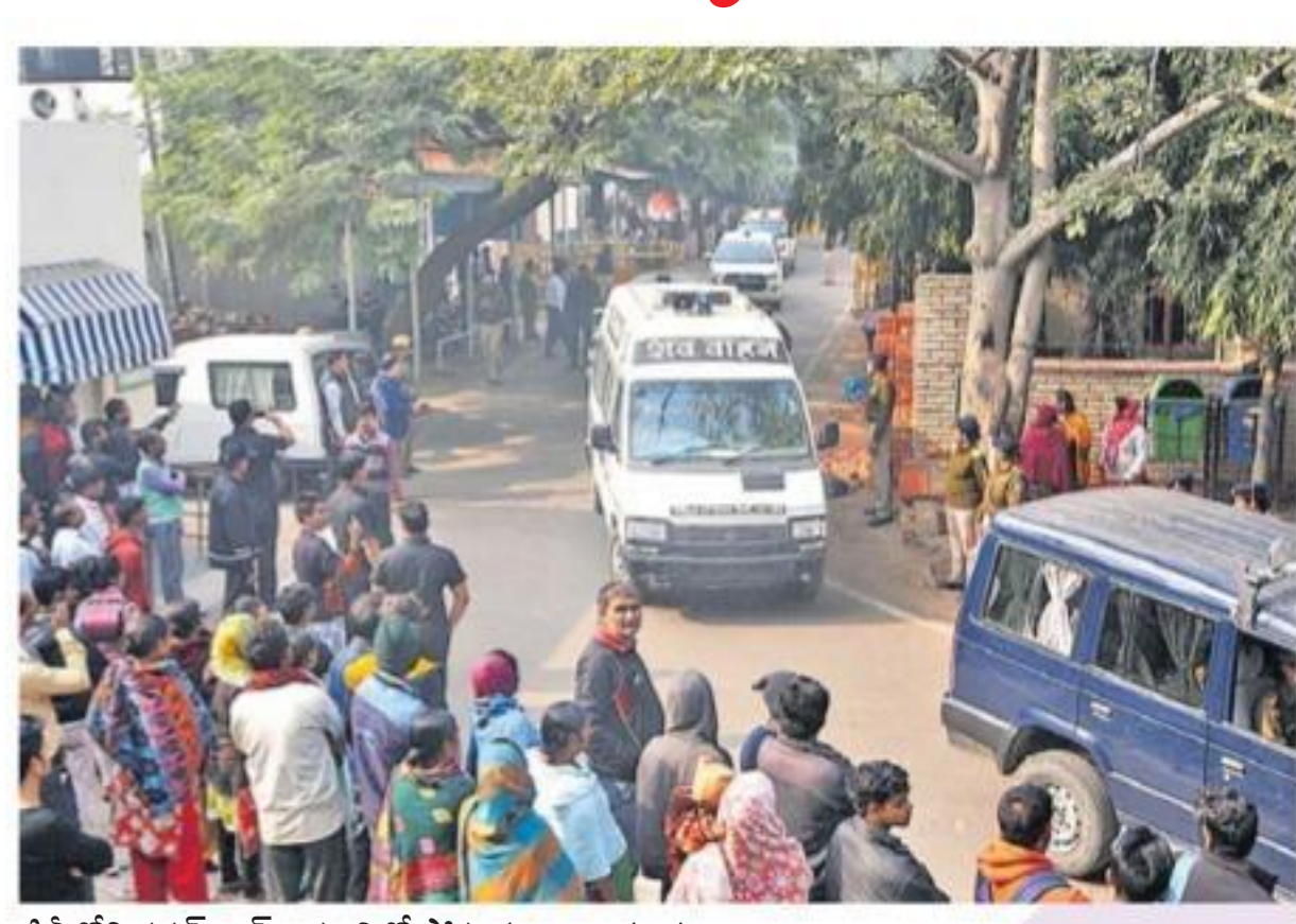
ఢిల్లీలోని సర్పరజంక్ ఆస్పత్రిలో హత్యమార్తం అనంతరం ఉన్నావో రేపి బాధితురాలి మృతదేహాన్ని తరలిస్తున్న దృశ్యం

న్యూఢిల్లీ, డిసెంబరు 7: నిలువెల్లా కాల్షిన్ గాయాలతో 40 గంటల పాటు మృత్యువుతో పోరాడిన 'ఆమె' ఓడిపోయింది. ఈ దుర్ఘటన అగణనమైన భరించలేనంతగా ఆమె గుండె ఆగిపోయింది. బెదిష్టతకు గురైన బంధువులు కలలు కన్న ఆ యువతి.. ఐదుగురు దుర్ఘటన పైకావికత్తానికి 25 ఏళ్ల తనను చాలించింది. తీవ్రమైన కాల్షిన్ గాయాలతో ఉన్నావో బాధితురాలి మహిళా శుభ్రవారం రాత్రి కన్నుమూసింది. రాత్రి 11.40 గంటలకు ఆమె మరణించిందని ఢిల్లీలోని సర్పరజంక్ ఆస్పత్రి వైద్యులు ప్రకటించారు. 'ఆమె పరిస్థితి శుభ్రవారం రాత్రికి మరంత దిగజారింది. 11 గంటల ప్రాంతంలో కాల్షియాక్ అరిస్ట్ అయింది. మా ప్రయత్నాలు విఫలమై 11.40 గంటల ప్రాంతంలో మరణించింది' అని డాక్టర్ శలభకుమార్ ప్రకటించారు. పోస్ట్ మార్టమ్ కోసం మృత దేహాన్ని పోస్ట్ మార్టమ్ విభాగానికి పంపారు. ఉన్నావో జిల్లాలోని ఆమె స్వగృహానికి తరలిస్తారు. బెయిల్ మీద వచ్చిన ఇద్దరు.. మరో ముగ్గురితో కలిసి, న్యాయవాదిని కలిసేందుకు వెళ్తున్న ఆమెపై గురువారం తెల్లవారుజామున కిరోసిన్ పోసి నిప్పంటించిన సంగతి తెలిసిందే.